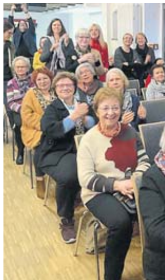
Zu „Ladies Night“ von Kool & The Gang hielt es einige nicht mehr auf den Stühlen.