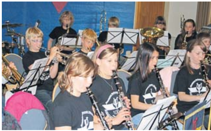
Das Jugendorchester , der musikalische Nachwuchs des Eisenbahner Musikvereins.