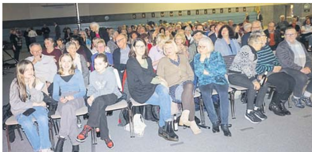
Volles Haus beim Konzert des GrimmMischChores in der Halle am Steines.