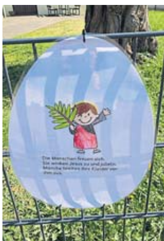
In einfacher, kindgerechter Sprache erzählen die „Ostereier-Tafeln“, am Zaun befestigt, die Passionsgeschichte.