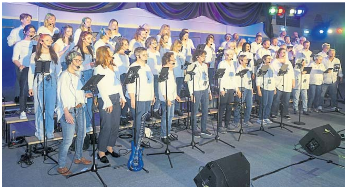
Der GrimmMischChor gab ein rauschendes Popkonzert.