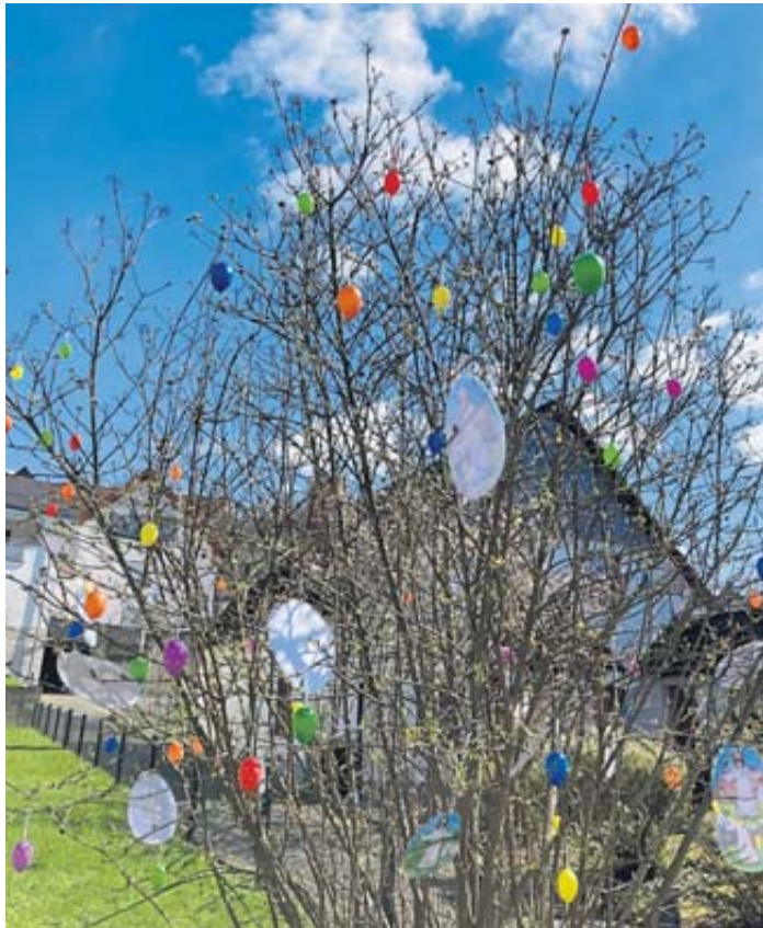
Der farbenfrohe Osterbaum im Pfarrgarten der evangelischen Kirche in Bellings zieht alle Blicke auf sich.

Zusteller (m/w/d) für die Tageszeitung/Post in: SINNTAL (Jossa, Weiperz, Sannerz) SCHLÜCHTERN (Stadt, Gundhelm, Hutten) STEINAU A. D. STR. BAD SODEN SALMÜNSTER (Stadt, Mernes) FREIENSTEINAU in Voll-/Teilzeit oder als Minijob Tel. (0661) 280935 zusteller@medienlogistik-hessen.de