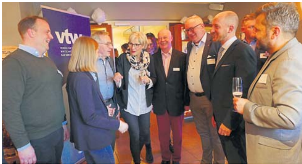
Mit überwältigender Resonanz startete das Format „Unternehmer-Talk“ in der Spezerei in Bad Soden-Salmünster.