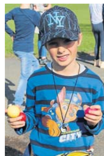
Bei strahlendem Sonnenschein klappte die Ostereiersuche prima.

meinschaft den Kindern zu Gute. Auch das Wetter hielt, was es versprach, und so konnte mit kurzen Ärmeln