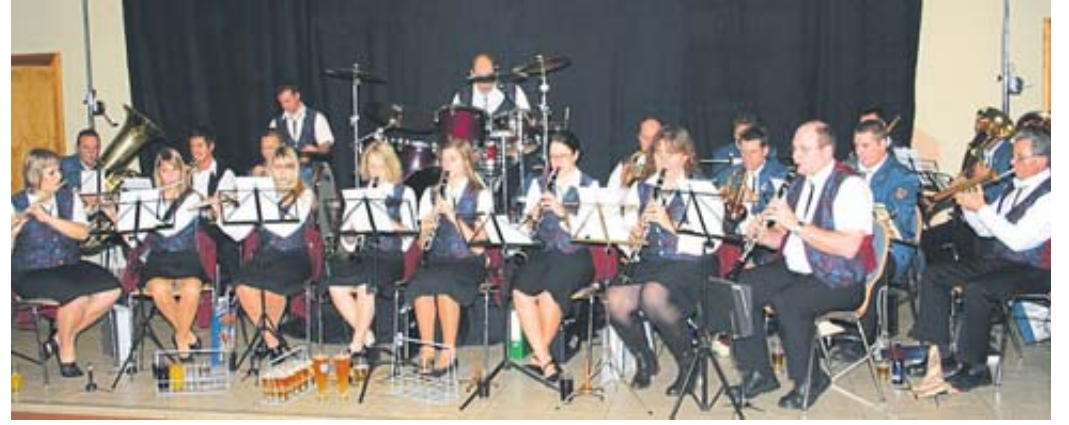
Ein Foto aus früheren Zeiten: Das einstige Bläserorchester des Eisenbahner Musikvereins Elm, der in diesem Jahr sein 115jähriges Bestehen feiert.