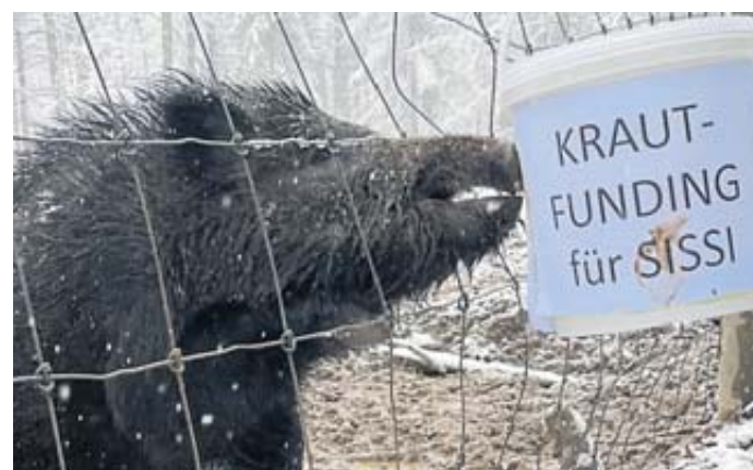
Beim „Krautfunding für Sissi“, das Wildschwein im Sodener Wildpark, kamen 222 Euro zusammen.

In einem symbolischen Akt brachte das Vorstandsteam der kfd und einige Aktive Sissi, dem örtliche Wildschwein, den Scheck über 222 Euro vorbei. Die Erzieher des Waldkindergartens „Wilde Frischlinge“ standen ebenfalls parat und freuten sich sehr über die Unterstützung ihres inoffiziellen Maskottchens Sissi. BWB