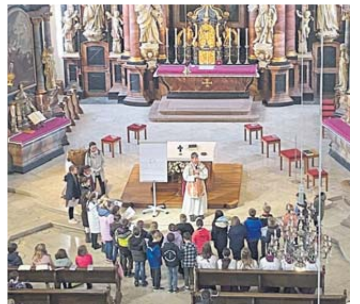
Am Ende der Predigt erhielten die Kommunionkinder das Glaubensbekenntnis.

Pfarrer Sippel ermutigte die Anwesenden, sich dessen bewusst zu werden, damit der Glaube sich entfalten könne. Am Ende der Predigt erhielten die Kommunionkinder das Glaubensbekenntnis, das gemeinsam mit der gesamten Gemeinde gebetet wurde.