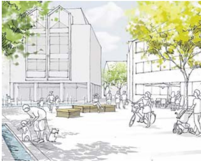
Mit dem neu gestalteten Stadtplatz soll Schlüchtern einen Platz zum Wohlfühlen erhalten. Visualisierung: Stadt Schlüchtern

Wie der Stadtplatz einmal aussehen soll, präsentierte das ausführende Architekturbüro „foundation 5+“ aus Kassel. Es werde flexible Sitzbänke geben, die zu einer