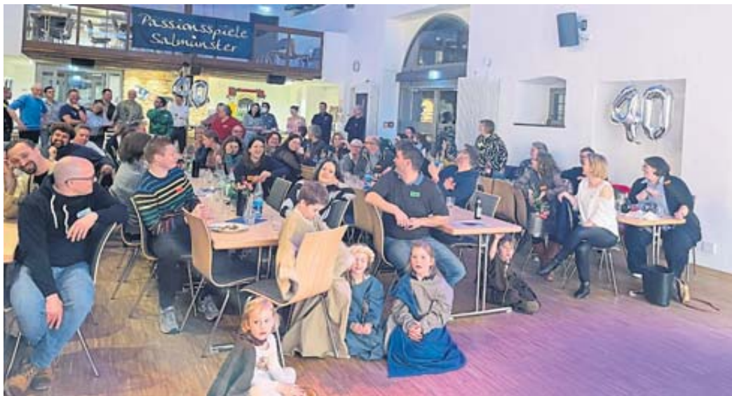
Das 40-jährige Jubiläum der Passionsspiele Salmünster wurde im Generationentreff gefeiert.

Der Bergwinkel Wochen-Bote Amtliches Bekanntmachungsorgan des Main-Kinzig-Kreises Verlag: MGW Mediengestaltungs- und Vermarktungs GmbH & Co. KG Frankfurter Straße 8, 36043 Fulda Hausanschrift und zugleich auch ladungsfähige Anschrift für alle im Impressum Verantwortlichen. Geschäftsführer: Haldun Tuncay Redaktion: Sabine Broj (V.i.S.d.P.) Anzeigen: Lutz Bernhard (verantwortlich) Julia Linkersdörfer Zustellung: Tobias Röder (verantwortlich) Druck: ColdsetInnovation Fulda GmbH & Co. KG Gewerbegebiet Kerzell Am Eichenzeller Weg 8 36124 Eichenzell-Kerzell Erscheint in Schlüchtern, Steinau, Sinnatal, Bad Soden-Salmünster, Freiensteinau Auflage: 21.200 Geschäftsstelle: Obertorstraße 16, 36381 Schlüchtern Telefon 06661/965678 Preisliste Version 2023/3 Falls Sie diese Zeitung nicht mehr erhalten möchten, bitten wir Sie eine E-Mail an vertrieb@wochen-bote.de zu senden und einen Aufkleber mit dem Hinweis „Bitte keine kostenlosen Zeitungen“ an Ihrem Briefkasten oder Zeitungsrohr anzubringen.