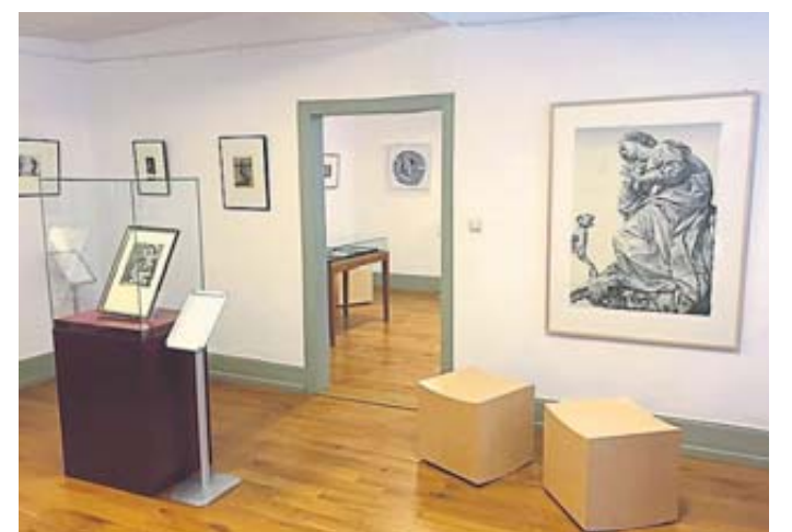
Die Ausstellung „Glaube – Triegel – Grimm“ ist noch bis zum 30. April im Brüder-Grimm-Haus zu sehen.

Besucher sollten sich Zeit nehmen für die Ausstellung, denn es gibt viel zu sehen, zu entdecken und zu hinterfragen. Der Eintritt kostet 6 Euro, ermäßigt 3,50 Euro. BWB