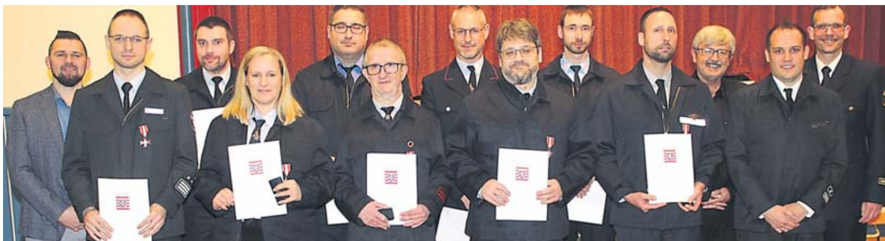
Ehrende und Geehrte mit dem Silbernen Brandschutzehrenzeichen des Landes Hessen.