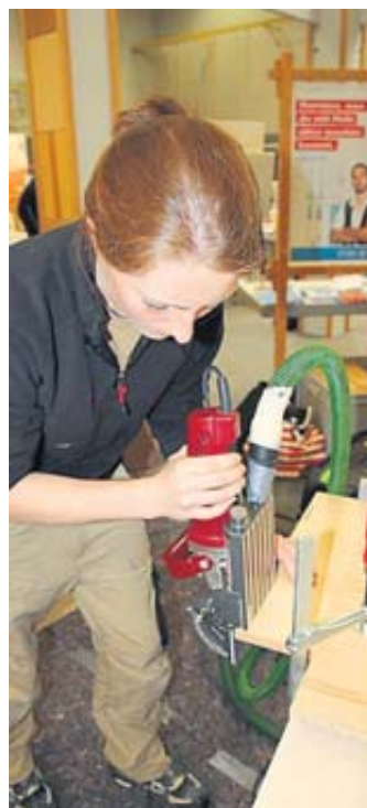
Besucher können Fragen stellen und vielleicht sogar selbst mal kurz in den Beruf reinschnuppern.

Interessierte senden ihre E-Mail-Bewerbung an folgende Adresse: Ausbildung-Steinau@birkenstock.com . BWB