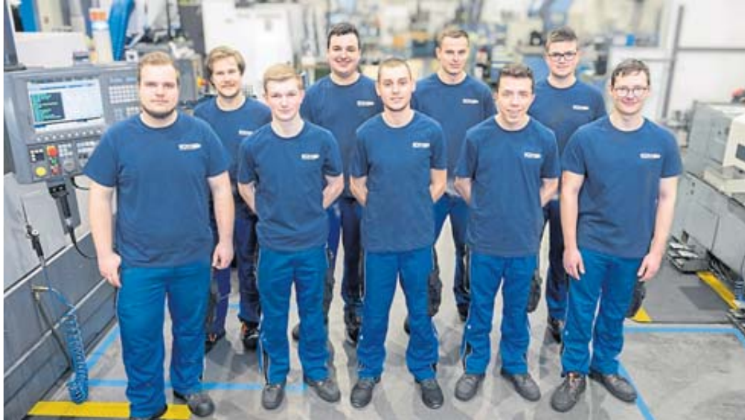
Eckart Hydraulik bietet Ausbildungsplätze in vier Berufsfeldern an.