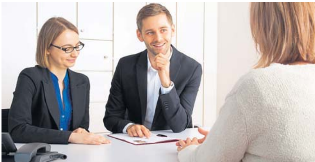
Wer in Bewerbungsgesprächen oft unsicher ist, kann in Rollensimulationen ein souveräneres Auftreten trainieren.