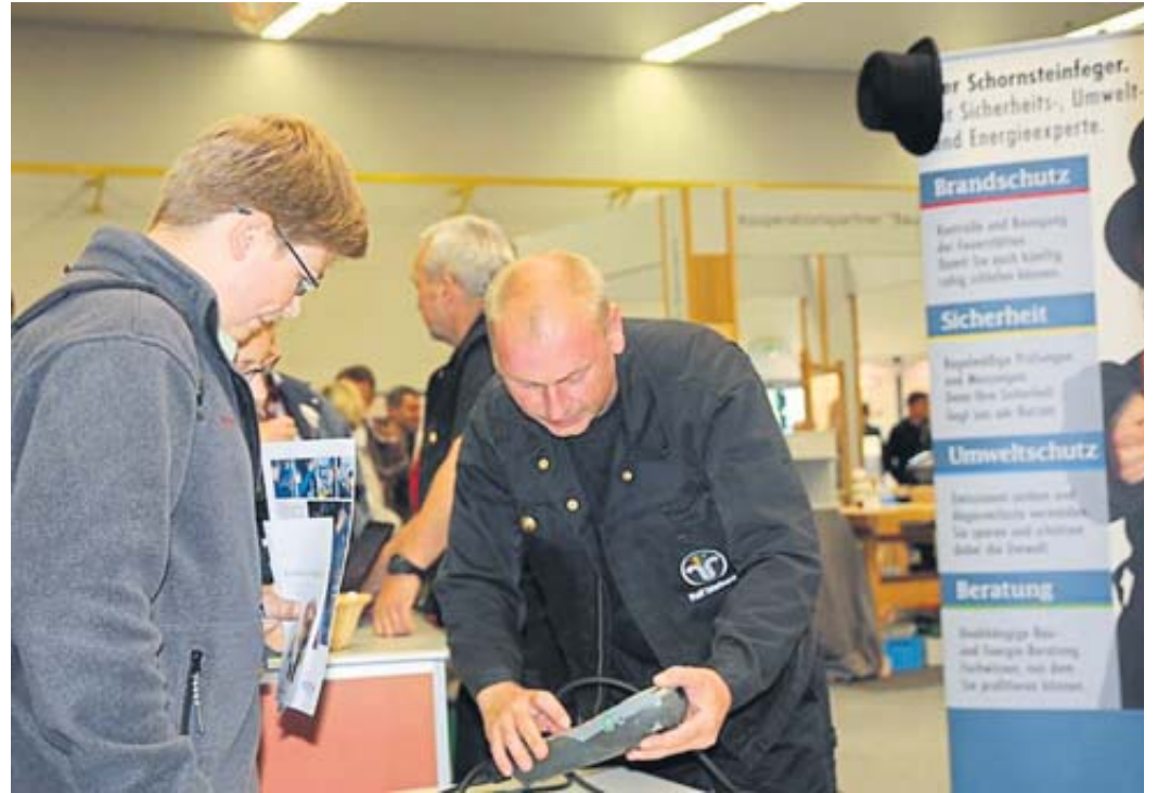
Die Ausbildungsbörse eine hervorragende Gelegenheit für Schülerinnen und Schüler, sich über verschiedenste Berufsbilder zu informieren.

STEINAU – Die Bergwinkel Ausbildungsbörse findet nach drei Jahren endlich wieder in der Halle am Steines in Steinau statt und lädt alle Schülerinnen und Schüler, Lehrerinnen und Lehrer, Eltern und Freunde ein, am Samstag, 13. Mai, von 9-13 Uhr über 30 Unternehmen aus der Region kennenzulernen.