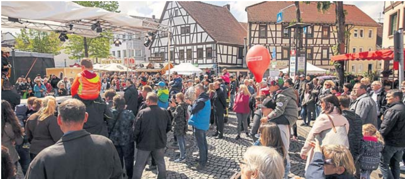
Der Helle Markt zieht Menschen aus allen Himmelsrichtungen an. Wenn das Wetter auch 2023 wieder so gut wird wie auf dem Archivfoto, dann erst recht.

MARKTTREIBEN | LIVEMUSIK | PUMPTRACK | NIGHTSHOPPING | FRÜHSCHOPPEN | OPENMUSEUM | FRAGDOCHMALDIESTADT | VERKAUFSOFFENERSONNTAG WWW.SCHLUECHTERN.DE/MAERKTE