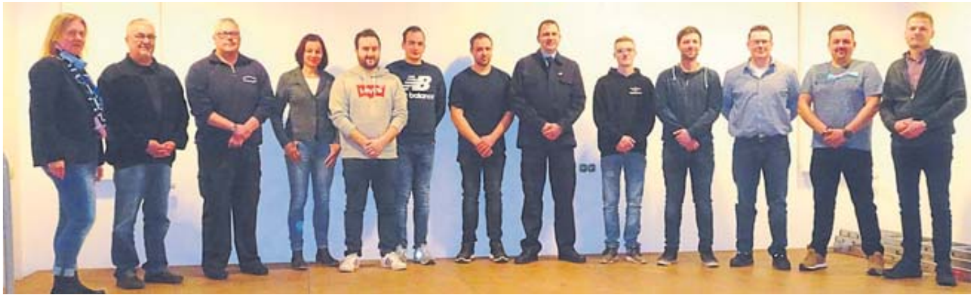
Der neu gewählte Vorstand und die Wehrführung der Feuerwehr Mottgers.