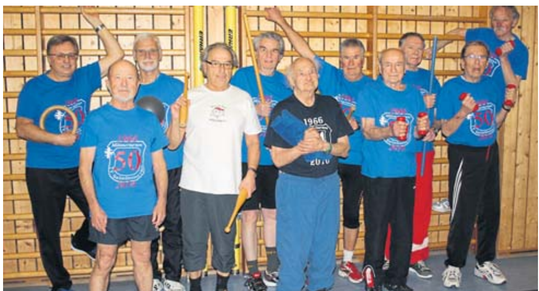
Das Männerturnen ist die am längsten bestehende Gruppe des Turnvereins Salmünster und sucht neue Sportkameraden.

Öffnungszeiten: Mo. - Fr. 9:00-20:00 Uhr *Neu*Neu* Samstag 8:30-20:00 Uhr Angebote gültig vom 29.04. - 05.05.2023 Höbäckeweg 24 - 36381 Schlüchtern