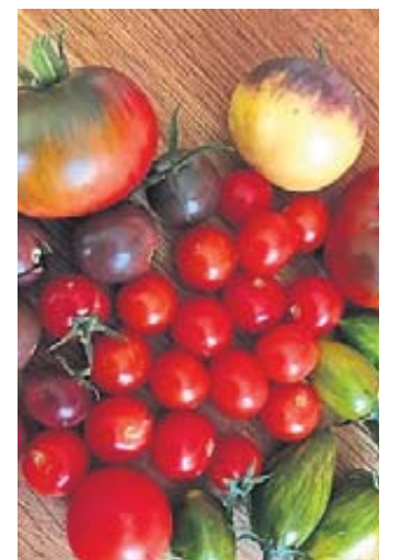
Weltweit gibt es 10.000 Tomatensorten.

Am Sonntag, 30. April ab 12 Uhr bietet sie im „Schaufenster Spessart“ im Schafhofgebäude in Burgjoß zwölf Sorten dieser besonderen Tomatenpflanzen zum Selbstkostenpreis von 1,50 Euro pro Pflanze an. Es sind Cocktail-, Salat- und Fleischtomaten in verschiedenen Formen und Farben. „Weltweit sind mehr als 10.000 Tomatensorten bekannt“, so die Expertin, die ihr Wissen zur Aufzucht und zur Pflege der Pflanzen gerne an Interessierte weitergibt. Es