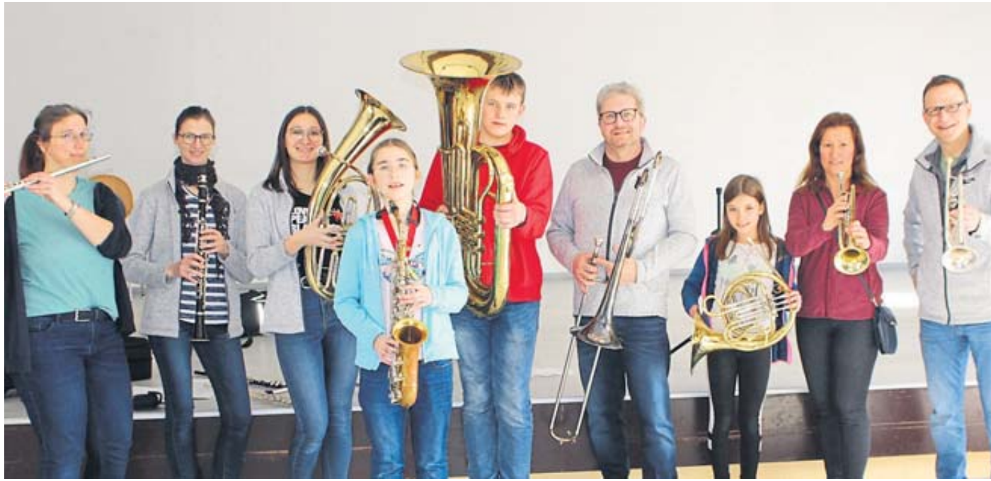
Unsere Aufnahme zeigt einige neue Musikschüler beim Eisenbahner Musikverein Elm zusammen mit den Vereinsverantwortlichen.