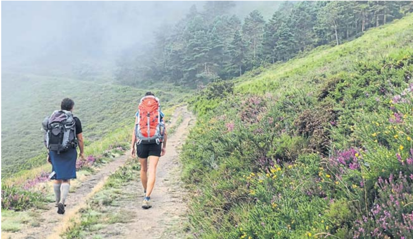
Rucksack auf und los? Der Jakobsweg gehört zu den beliebtesten Wanderwegen Europas und kann Experten zufolge sehr herausfordernd sein.

Je nach Alter und Vorerkrankungen, kann auch ein Besuch beim Kardiologen sinnvoll sein, um eventuell ein EKG, Belastungs-EKG