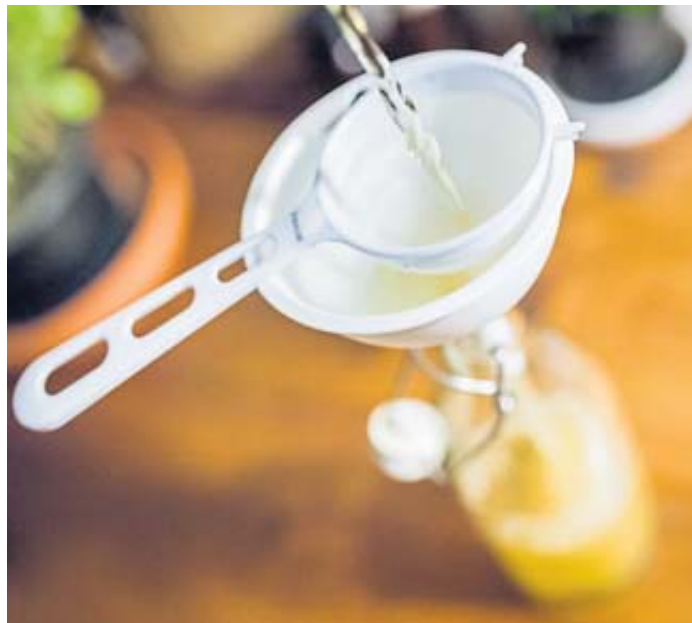
Die Verbraucherzentrale klärt auf: Ein Wundermittel ist Kombucha-Tee nicht.

Trotzdem: Kombucha hat mit circa 20 Kilokalorien und zwischen vier und sechs Gramm Zucker je 100 Millimeter – verglichen mit anderen Erfrischungsgetränken – einen recht geringen Kalorien- und Zuckergehalt.