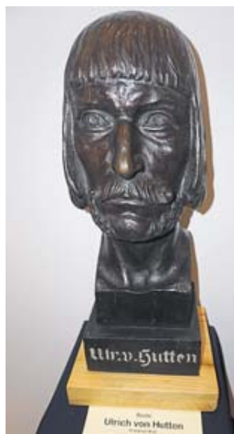
Mit einer Ausstellung zum 500. Todestag ehrt das Heimatmuseum Ulrich von Hutten.