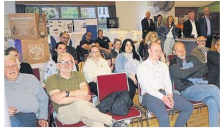
100 Zuhörer erlebten eine kurzweilige Gesprächsrunde.