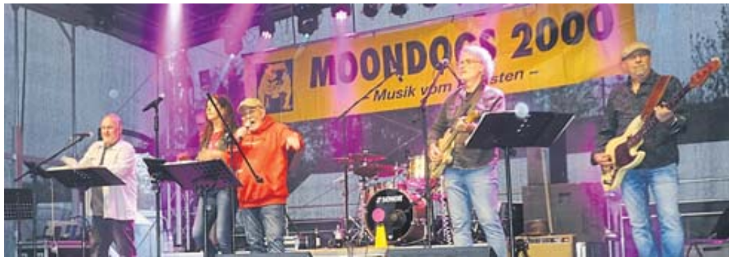
Die Moondogs feierten ein grandioses Comeback.

Die Jugendlichen forderten generationsübergreifende Kommunikation ein. Der Bergwinkel sei Heimat und Rückzugsort für alle Generationen. Hier könne man sich ausleben, meinte Hofacker. Und der Schlüchterner Bür-