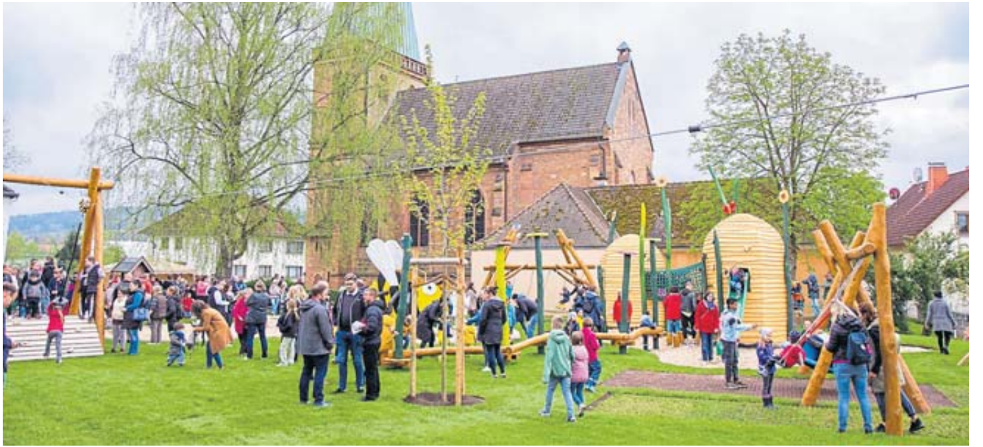
Vor der malerischen Kulisse der Kirche entstand der Spielplatz „Wilde Biene“ mit Schaukel, Rutsche, Seilbahn, Kletterturm, Sandkasten und Co. in Waben- und Bienenkorb-Form.