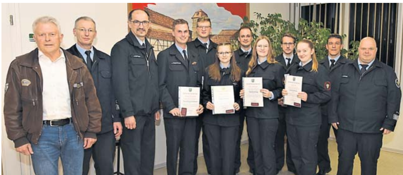
Geehrte und Ehrende in der Jahreshauptversammlung der Feuerwehr Schlüchtern.

Herausragende Veranstaltung sei ein Tag der offenen Tür gewesen. „Was an diesem Tag in und vor dem Gerätehaus abgegangen ist, hat es in den Jahren zuvor noch nie gegeben. Wir wurden förmlich überrannt“, zog Jahn eine äußere positive Bilanz. Mehrere Tausend Besucher haben das umfangreiche Programm des Aktionstages in Augenschein genommen. Ein weiteres bedeutsames Ereignis war die Bewirtschaftung der „Lösch-