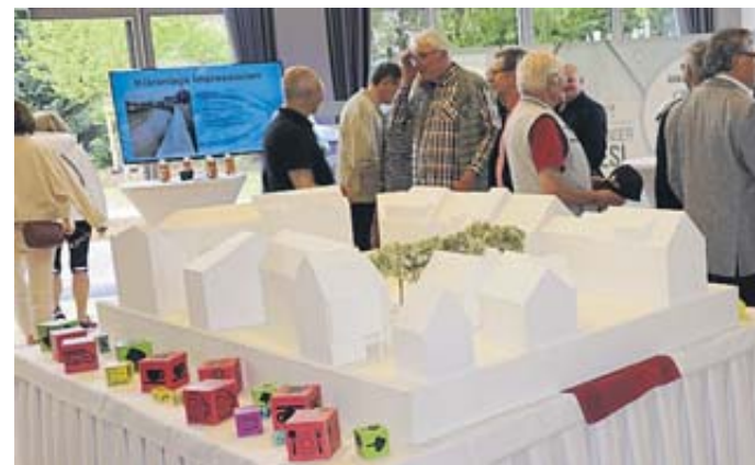
Großes Interesse an „Frag doch mal die Stadt“.