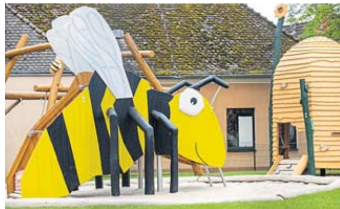
Ein schwarz-weiß gestreifter Hingucker und Namensgeberin: die Biene im Zentrum des Spielplatzes.

Bei der offiziellen Einweihungsfeier nahm der versammelte Nachwuchs den neuen Spielplatz mit Begeisterung in Beschlag und vergnügte sich bei einer Schatzsuche, die mit Gutscheinen des „Eishäuschens“ von Sebastian Golditz und kleinen Büchergeschenken versüßt wurde. Für musikalische Unterhaltung sorgte der Kinderchor unter der Leitung von Karoline Münzel. BWB