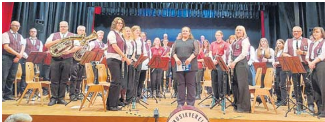
Das Stammorchester des Musikvereins Cäcilia und das gemeinsame Jugendorchester Cäcilia und Salmünster boten im Spessart Forum ein bemerkenswertes Konzert.