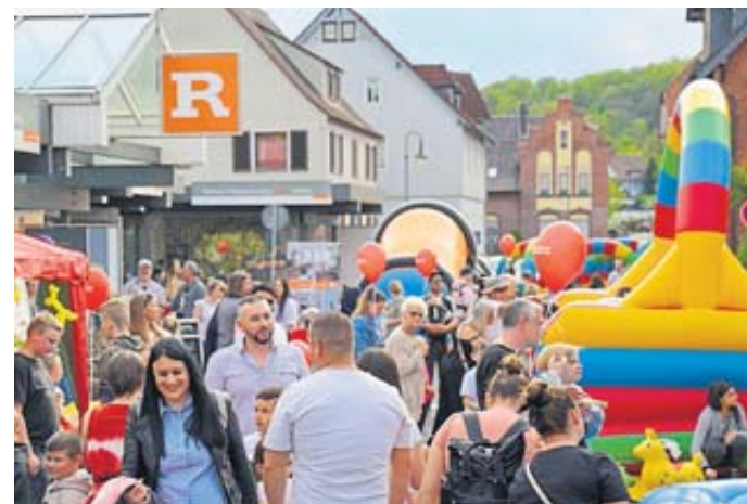
Dichtes Gedränge – große und kleine Besucher zog es zum Hellen Markt in die Bergwinkelstadt.

Nightshopping, verkaufsoffener Sonntag und Livemusik, Ballett, Musikschule Tonika und Tanzeinlagen der Dance Company und der SCC-Garden sorgten an den drei Tagen dafür, dass der Bergwinkel mal wieder ordentlich feiern konnte. CS