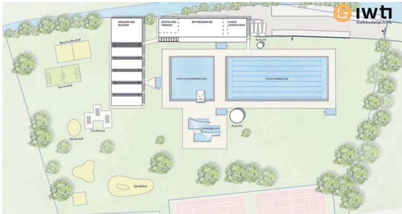
Die Skizze zeigt die geplante Neugestaltung des Schlüchterner Schwimmbades, so wird beispielsweise seitlich zum Nichtschwimmerareal ein neues das Kinderbecken gebaut.

Das Wichtigste vorweg: Die Arbeiten sollen am 4. Oktober dieses Jahres beginnen, einen Tag nach Ende der Schwimm-Saison. Im Jahr 2024 bleibt die Anlage komplett geschlossen, um möglichst in der Saison 2025 wieder für die Bevölkerung geöffnet zu werden. Während der Schließung soll das Hallenbad geöffnet bleiben. Sämtliche Bestandsgebäude im Freibad-Areal werden im Zuge der Maßnahme abgerissen, weil sie baufällig sind oder eine zu geringe Fläche für die notwendige Technik aufweisen. Als Ersatz werden zwei