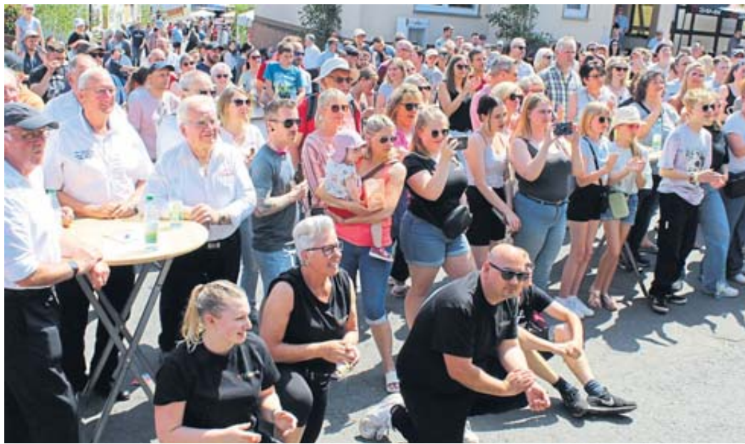
Hochbetrieb herrschte an vielen Stellen entlang des stehenden Festzuges.