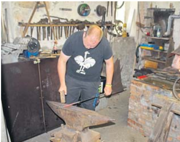
Auch einem Schmied konnten die Besucher bei seiner schweißtreibenden Arbeit über die Schulter schauen.

sondere für die Ausrichtung des Dorfjubiläums, bei welchem ganz Mottgers „Kopf stand“. Das Dorf erlebte einen nie dagewesenen Besucheransturm, der durch die Dorfstraßen flanierte.