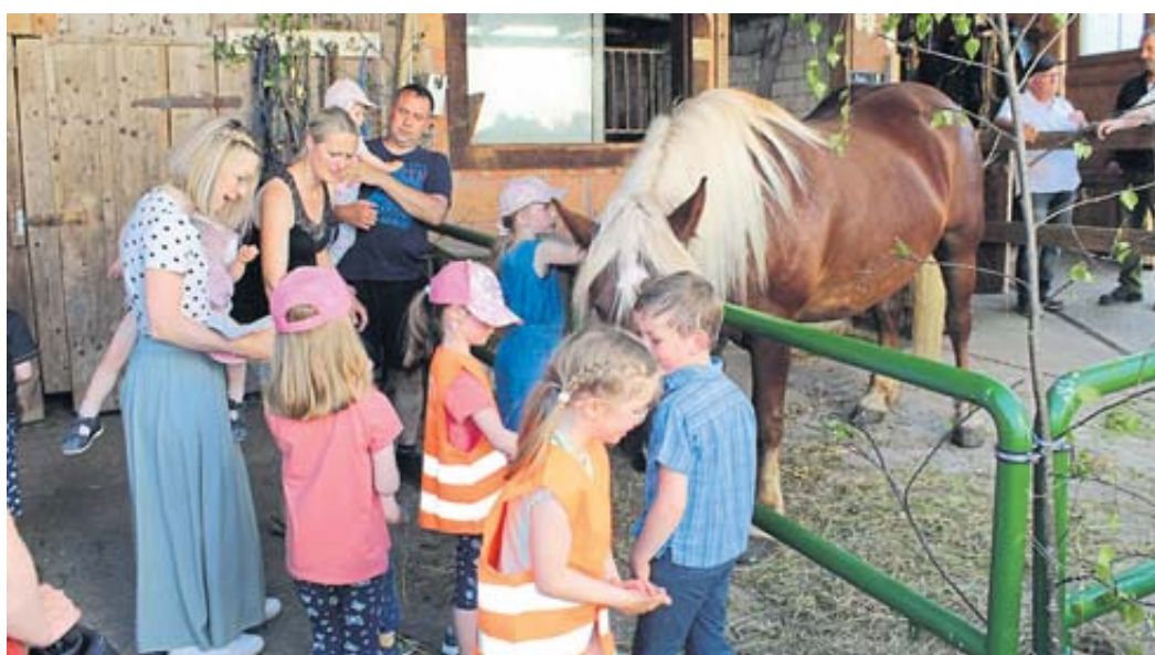
Pferde zum Anfassen gab es – zur Freude der Mädchen und Jungen – bei diesem landwirtschaftlichen Betrieb.