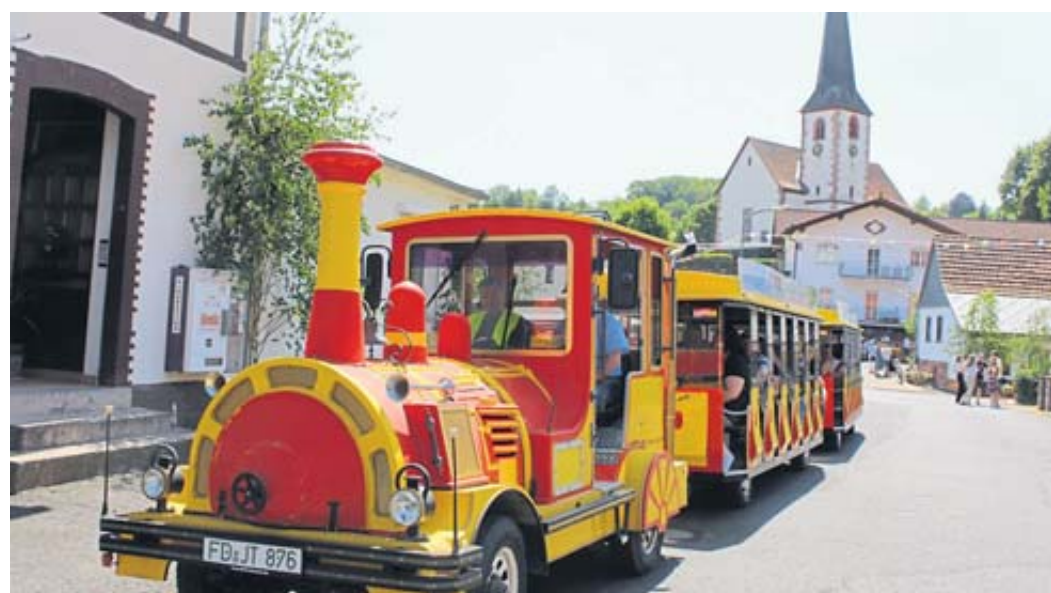
Eine farbenfrohe Bimmelbahn fuhr die Besucher auf originelle Weise zu den verschiedenen Stationen des stehenden Festzuges.