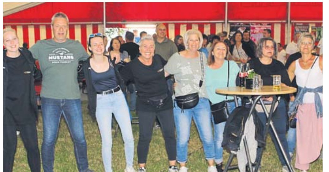
Stimmungsvoll und mit vielen Besuchern: So präsentierte sich die Abschlussveranstaltung.