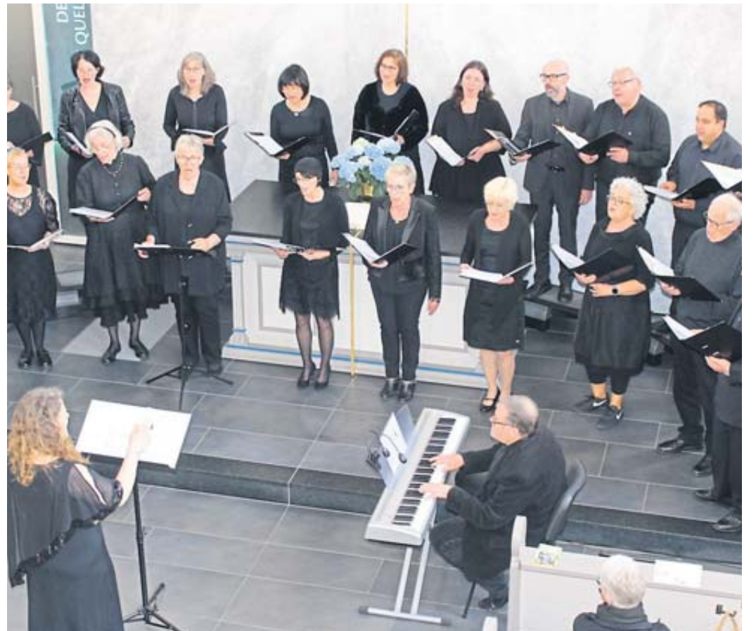
Der Kirchenchor ConDio bot in der Sterbfritzer Kirche mitreißenden Chorgesang.