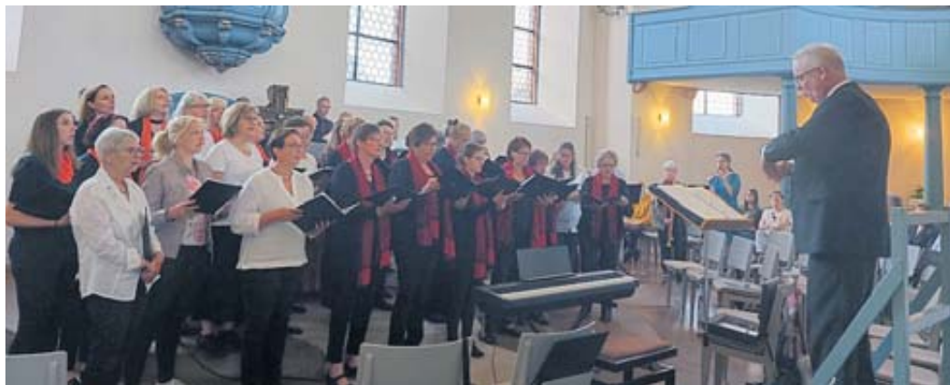
Chöre und Instrumentalisten setzten mit der Choralkantate „Komm, Herr, segne uns“ einen fulminanten Schlussakkord.