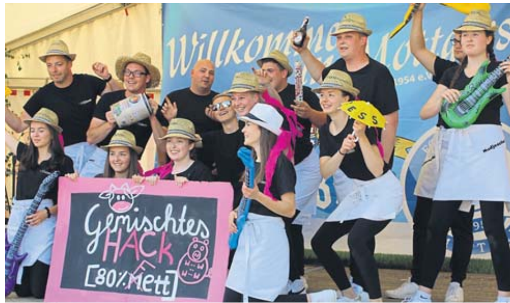
Einen fulminanten Auftritt bot die Mottgenser Tanzgruppe „Gemischtes Hack“.