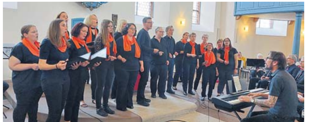
„Oh happy day“ stimmten die Sängerinnen und Sänger des Gospelchors „New Spirit“ aus Wallroth an.