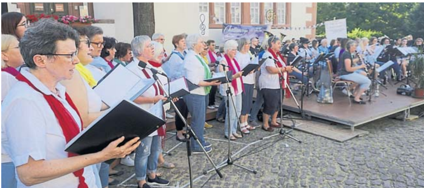
Das Zusammenspiel zwischen Chor und Orchester war überragend.