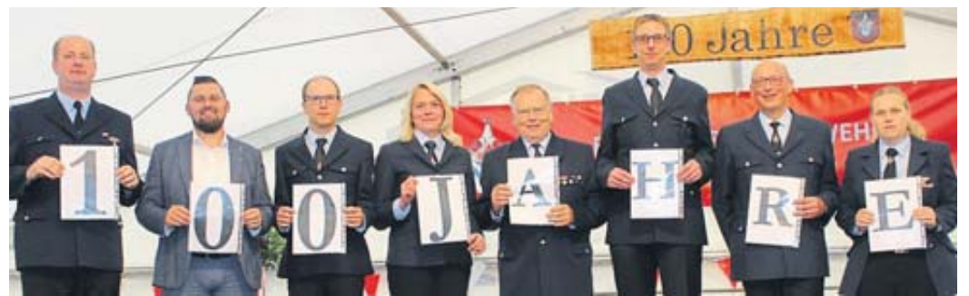
Die „Schulklasse“ der Sterbfritzer Wehr präsentierte eine außergewöhnliche Chronik-Vorstellung.