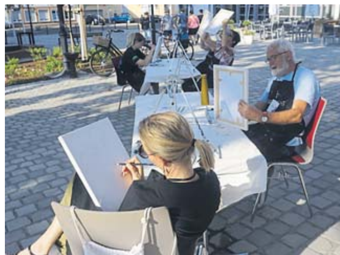
„Jeder malt in seinem Tempo.“ Nach zwei Stunden war es geschafft, die Werke konnten sich sehen lassen.

„Jeder malt in seinem Tempo. Bei dem einen geht es schnell, ein anderer lässt sich mehr Zeit, das Porträt technisch auszuarbeiten“, sagte die Malerin. Nach zwei Stunden war es geschafft. Die Werke konnten sich sehen lassen. „Man kennt mich nicht als Maler. Ich stehe erst am Anfang. Es macht richtig Spaß, Tipps und Tricks zu bekommen“, berichtete der 68-