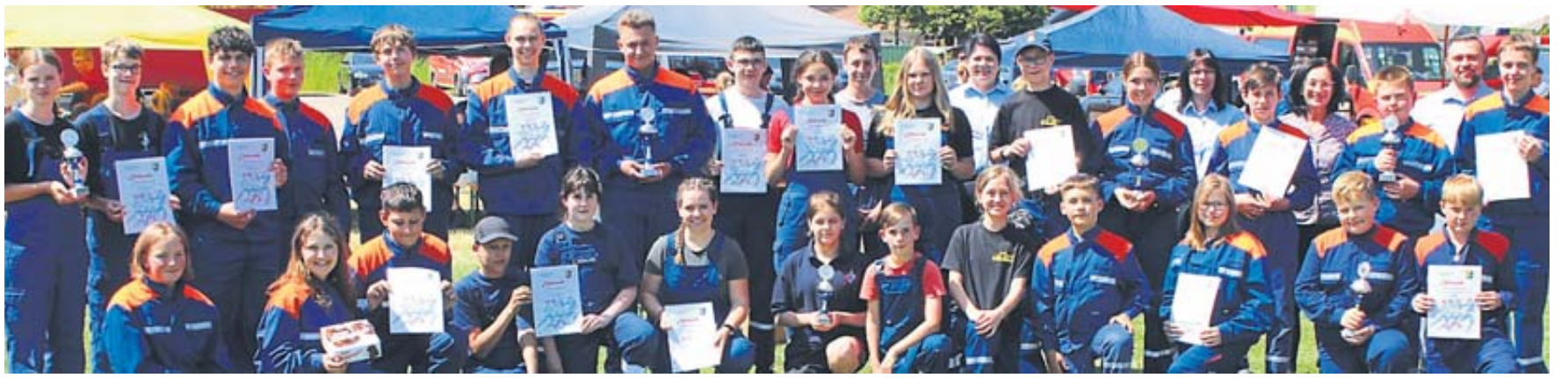
Abordnungen von den 17 teilnehmenden Mannschaften des offenen Pokalwettkampfes nach der Siegerehrung.

STEINAU – Ab Montag, 3. Juli, wird die Buslinie MKK 95 wieder regulär bedient. Die Baustelle L 3178 zwischen Steinau/Neustall und Freiensteinau/Holzmühl wird aufgehoben. Entsprechende Auswahlfahrpläne werden an den betroffenen Haltestellen ausgehängt. In der elektronischen Verbindungsauskunft des RMV stehen ebenfalls alle aktuellen Fahrpläne zur Verfügung. Weitere Informationen und Fahrpläne unter www.vgf-fulda.de oder telefonisch unter (06661) 9635-777. BWB