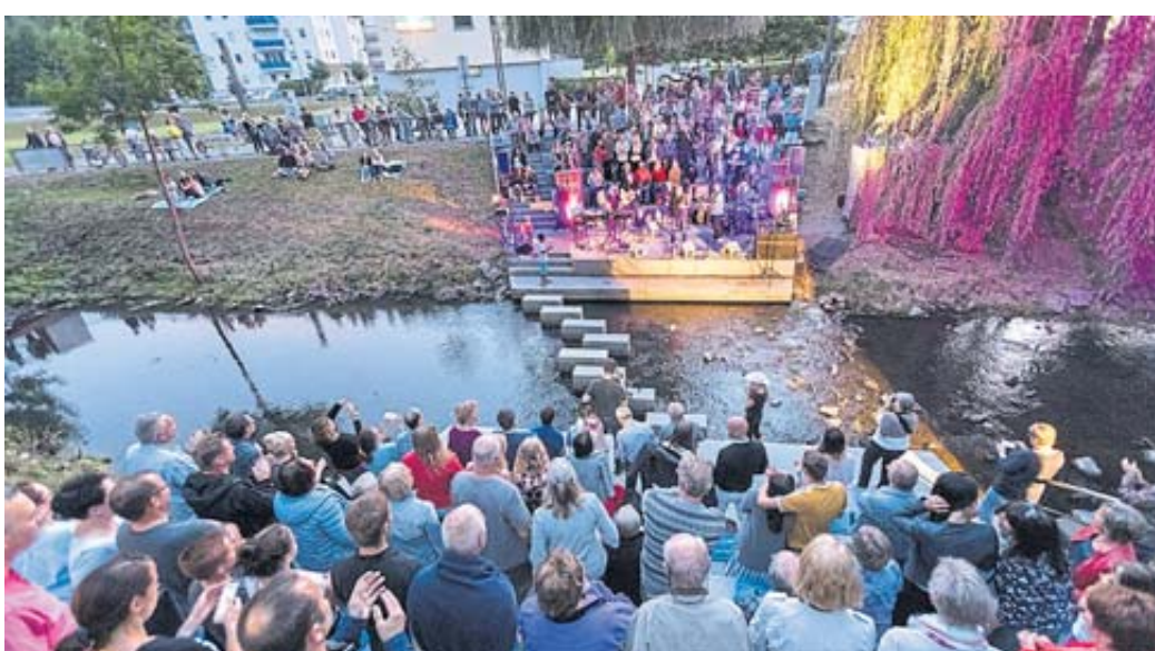
Die Fluss-Bühne bietet eine einmalige Atmosphäre für den Auftritt von Musikprofis, ambitionierten regionalen Bands und Talenten.

Am Samstag übernimmt die Vocapella-Band STIMMIK die Bühne in der Arena. Die vier Frauen und drei Männer singen, was ihre Stimmbänder hergeben und ziehen das Publikum mit ihrer Performance in ihren Bann. Witzige Texte, populäre Songs, verblüffende Arrangements, a-capella oder mit Piano und eine Prise Selbstironie charakterisieren das „Andere“ an STIMMIK. Jeder ist in der Lage sich für den Vocapella-Sound der Band einzubringen, kann jedoch auch solistisch absolut überzeugen. Die Bühnenpräsenz kommt nicht zu kurz und macht jedes Konzert zu einem echten Hingucker.