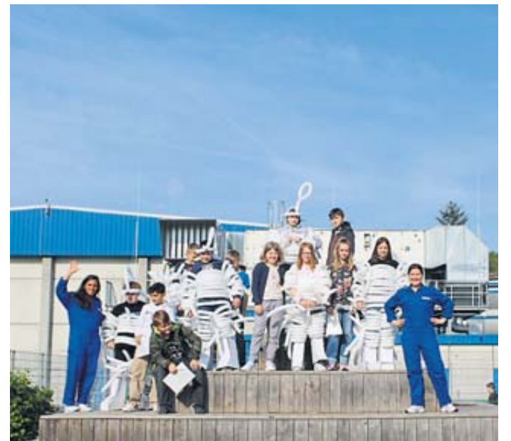
Das ganze Schuljahr über haben die beiden Frauen mit Schülerinnen und Schülern der Stadtschule künstlerisch und performativ gearbeitet und verschiedene Mond- und Raumfahrtmissionen künstlerisch bespielt.