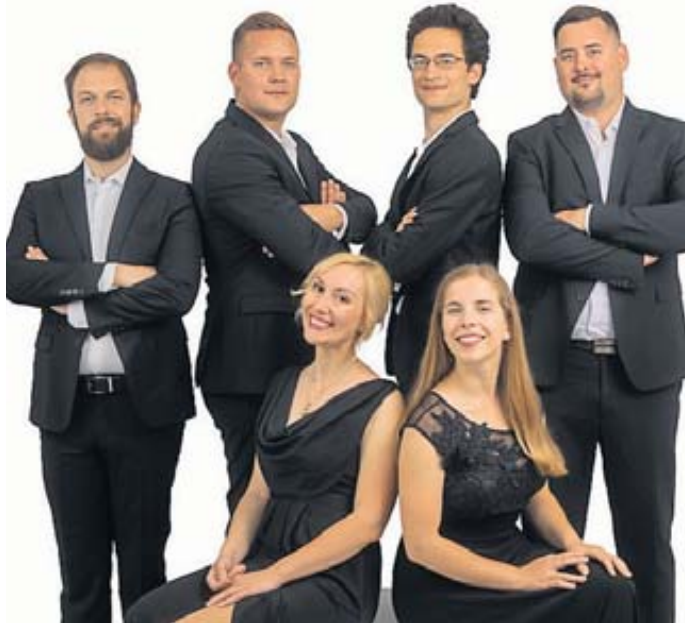
Das Vokalensemble Ingenium ist zum zweiten Mal in Nieder-Moos zu Gast.