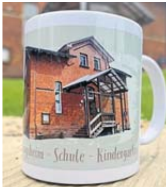
Das Backsteingebäude auf einem Kaffeebecher.

Doch in diesem Jahr wird der alte Backsteinbau abgerissen werden. Ein Neubau für den Kindergarten ent-