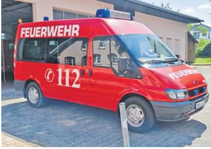
Dieses neue Mannschaftstransportfahrzeug, das in Eigenleistung auf die Bedürfnisse der Wehr Weiperz umgebaut wurde, wird am 8. und 9. Juli feierlich in Weiperz geweiht.