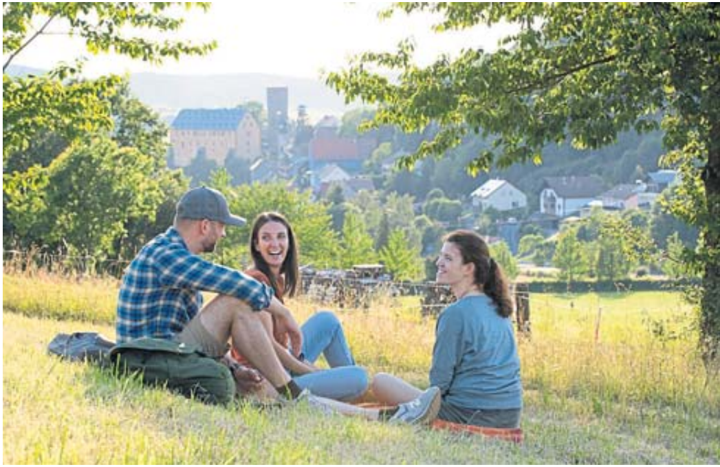
Ländlicher, nachhaltiger Tourismus ist attraktiv und hat Zukunft. Das weiß man auch bei der Spessart Tourismus und Marketing GmbH.