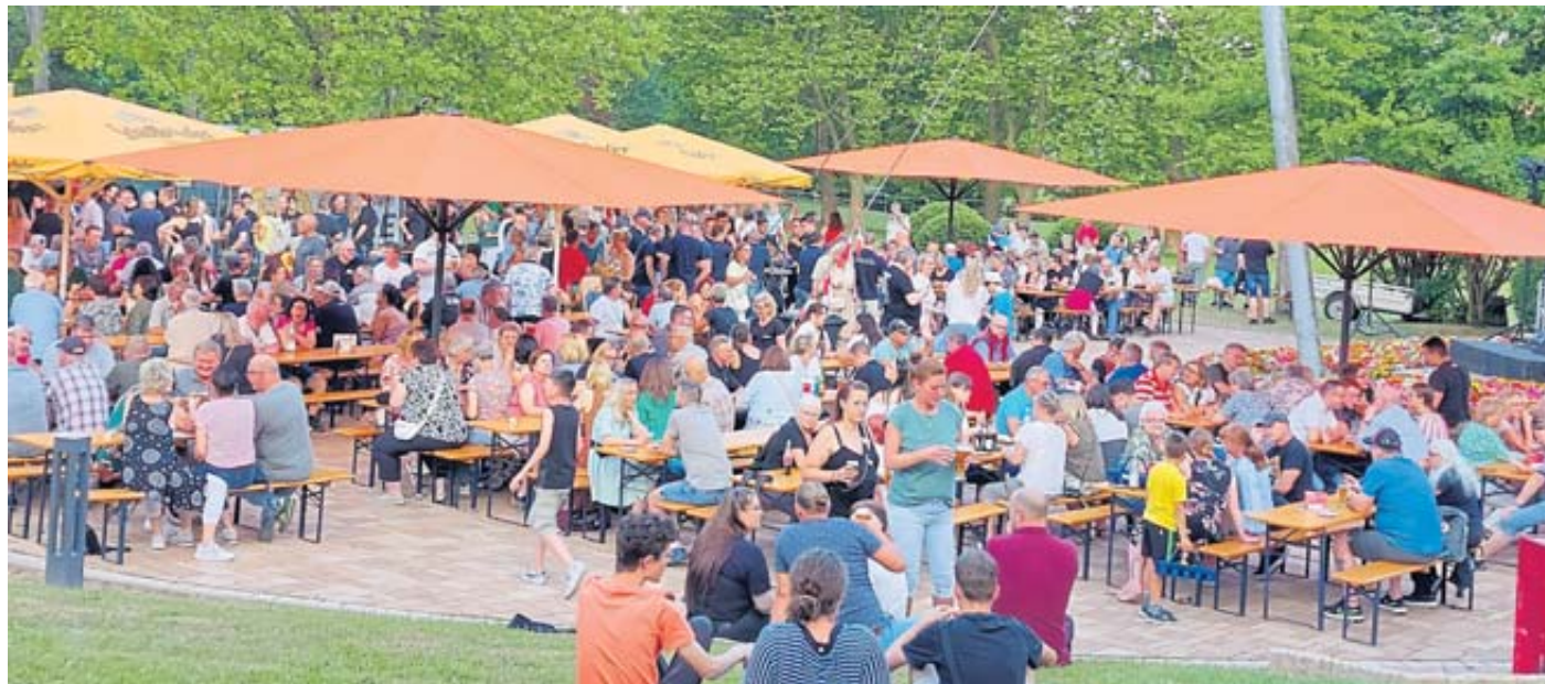
Riesige Resonanz: Die Feuerwehr hatte eingeladen, und alle kamen.