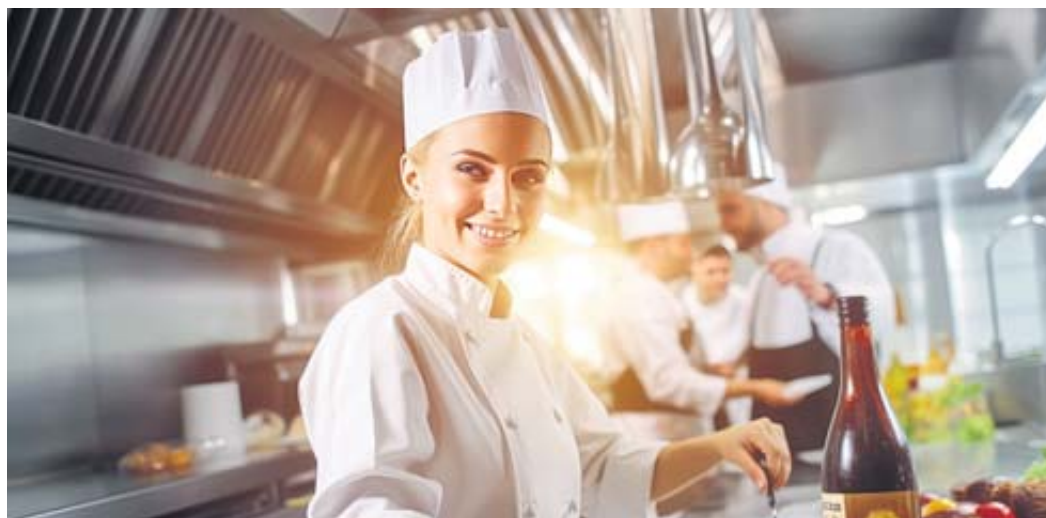
In der Gastronomie ist nach wie vor ganzjährig Personalbedarf gegeben.

sen eigentlich mittlerweile angesichts von sich auftuenden oder drohenden Personalücken noch offener für Quereinsteiger geworden?