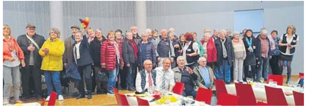
Die Senioren aus Schlüchtern wurden im Sozialzentrum Jean Morette in Fameck herzlich begrüßt und gastfreundlich bewirtet.