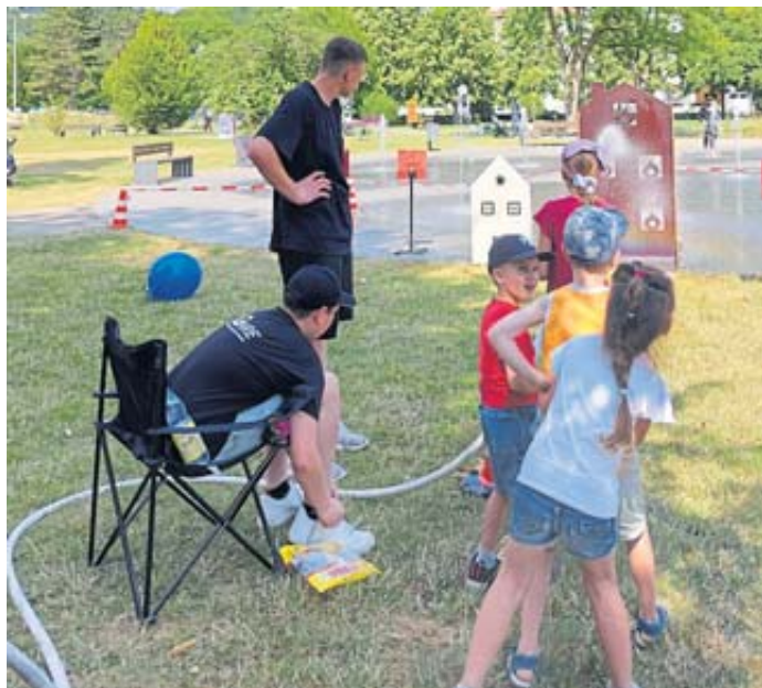
Früh übt sich: Viel Spaß hatten die Kinder beim „Löschen einer Hauswand“.