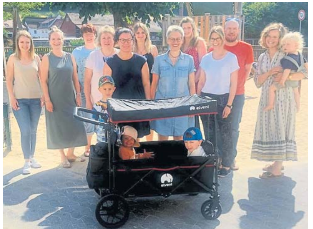
Sie freuen sich über den neuen Bollerwagen: Vertreterinnen und Vertreter des Elternbeirates, Erzieherinnen mit Kita-Leitung und Kita-Kindern.

sprächen mit den Verkäuferinnen und Verkäufern konnte eine positive Bilanz gezogen werden – wir sind rundum zufrieden mit dem ersten Herolzer Tischbasar und bedanken uns bei allen Mitwirkenden und Unterstützern, die bei der Umsetzung geholfen haben“, so der Elternbeirat. „Unser Ziel ist es, den Tischbasar fest zu etablieren. Damit leisten wir gerne einen Beitrag für neues Equipment für einen noch schöneren Kita-Alltag unserer Kinder“, heißt es weiter. Geplant ist eine zweite Auflage im Frühjahr 2024. BWB