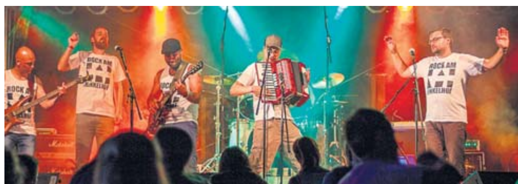
„The Sick Rats“ spielen am 21. Juli bei Rock am Hinkelhof.

Diese Retrospektive bietet also einen vielfältigen Überblick und zeichnet die Geschichte der „kranken Ratten“ von einer linksradikalen Schülerband zum Song-Kollektiv gesetzter Herren umfassend nach. Auf den einschlägigen Streaming-Portalen wird das Album am 18. Juli veröffentlicht; für unverbesserliche Nostalgiker wird es auch eine CD-Version geben. Wer „The Sick Rats“ tatsächlich live erleben will, hat dazu beim diesjährigen Rock am Hinkelhof im gleichnamigen Schlüchterner Ortsteil die Gelegenheit: Die Band spielt hier am Freitag, 21. Juli, ab 19 Uhr. BWB