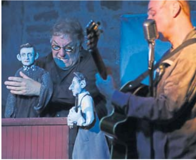
„Das letzte Autogramm“, eine Hommage an Johnny Cash.

ULMBACH – Die Chorgemeinschaft Harmonie Ulmbach lädt für Sonntag, 16. Juli, zur Sommerserenade auf den „Platz der Harmonie“ ein. Pfarrer Rapu hält um 10.30 Uhr einen Gottesdienst, danach sorgen die Dixie Oldies aus Schlüchtern für Stimmungsmusik zum Mittagessen. Verschiedene Chöre, darunter der Männerchor Frohsinn 1866 Bad Soden, Heimatliebe Eckardroth und der Kindergartenchor Ulmbach treten ab 14 Uhr auf. BWB