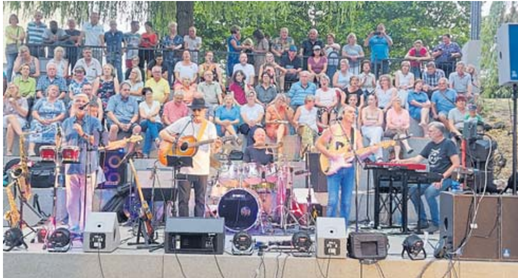
„Freiheit“ mit der Band „Westernhagen reloaded“.