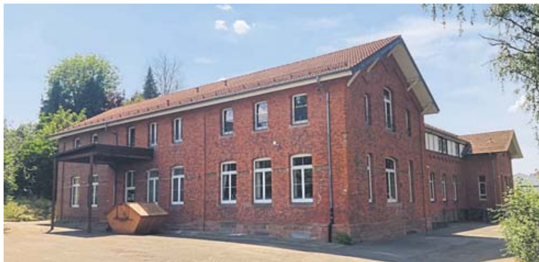
Ein Container, als Vorbote für den bevorstehenden Abriss, steht vor dem „Erholungsheim“.