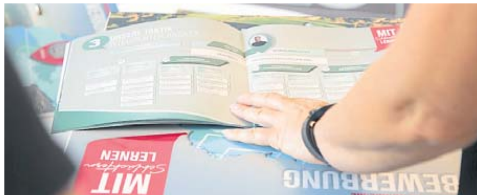
Mit einer aufwendig gestalteten Broschüre bewirbt sich die Stadt Schlüchtern um den Sitz der Kleinstadtakademie.

Als siebenfacher Gewinner des Wettbewerbs „Ab in die Mitte“ zur Förderung von Innenstädten ist die Stadt Schlüchtern von ihrer Kandidatur für den Geschäftssitz der Kleinstadtakademie daher überzeugt, um so ihr umfangreiches Knowhow in die konstante Weiterentwicklung der Initiative einbringen zu können. BWB