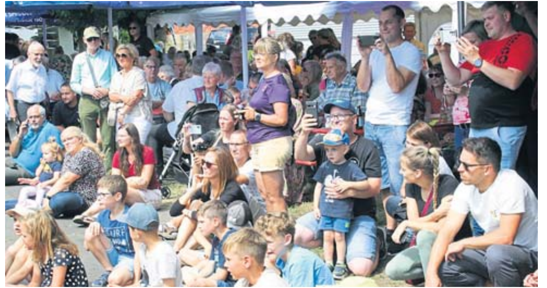
Viele Besucher verfolgten die Darbietungen.