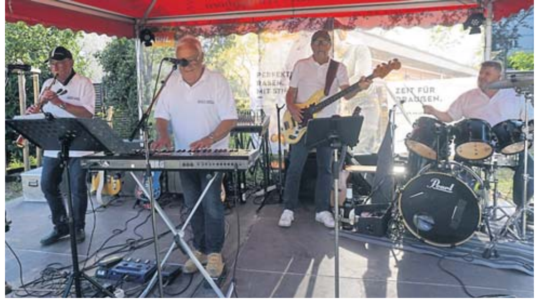
Die Kultband „Echo Four“ sorgte für die richtige Feierlaune.