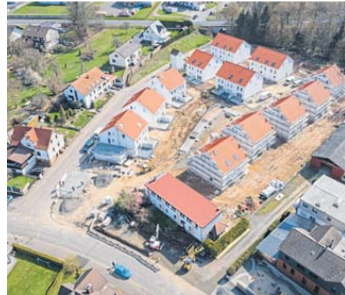
27 Wohneinheiten wurden von der Wiesbadener Traumhaus AG auf dem ehemaligen Grundstück der „Alten Ziegelei“ entwickelt.