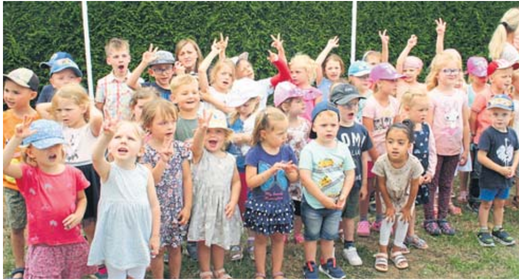
Die Ulmbacher Kindergartenkinder trugen zur Programmgestaltung bei.