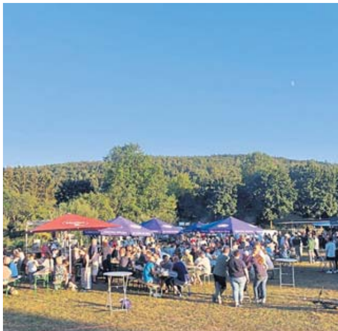
Auf viele Besucher, so wie hier im vergangenen Jahr, hoffen die Organisatoren des Weitzelfestes.