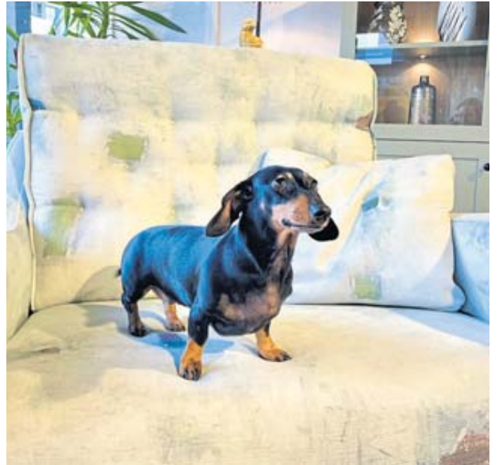
Dackeldame Susi hat sich im Einrichtungshaus Rudolf einen bequemen Sessel von fama ausgesucht.

Einrichtungshaus Rudolf Unter den Linden 48 Schlüchtern Telefon (06661) 15170 moebelrudolf.de