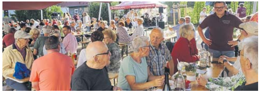
Hunderte Gäste waren der Einladung des SCC zum Weinfest gefolgt und feierten im Schloßchengarten.

Die Reparaturen erfolgen kostenfrei; über eine Spende freuen sich die ehrenamtlich Aktiven ebenso wie auf interessierte Gäste, die einfach mal reinschauen und leckeren Kuchen und Kaffee bei einem netten Gespräch vor Ort genießen möchten. BWB