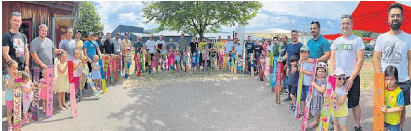
Viele bunte Holzplatten haben Väter mit ihren Kindern gestaltet. Sie werden künftig die Außenbegrenzung der Kinderburg Wiesenzauber verschönern.