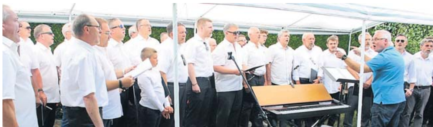
Einen fulminanten Auftritt hatte der Männerchor Frohsinn Bad Soden.

Ein harmonisches Zusammenkommen gab es auch jetzt wieder bei der Sommer-