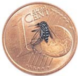
Die Asiatische Tigermücke ist relativ klein und hat weiße Streifen auf dem Rücken.

zu verbreiten. Um sich vor den Stichen zu schützen, helfen die herkömmliche Mittel gegen Mücken. Machen sich nach einem Stich Symptome