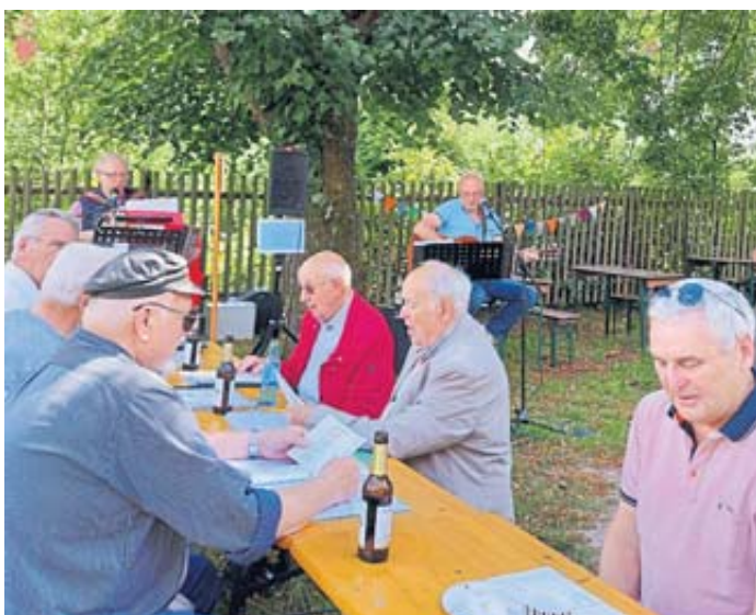
Im Museumsgarten sangen die „Laubensänger“ Volkslieder und Evergreens.