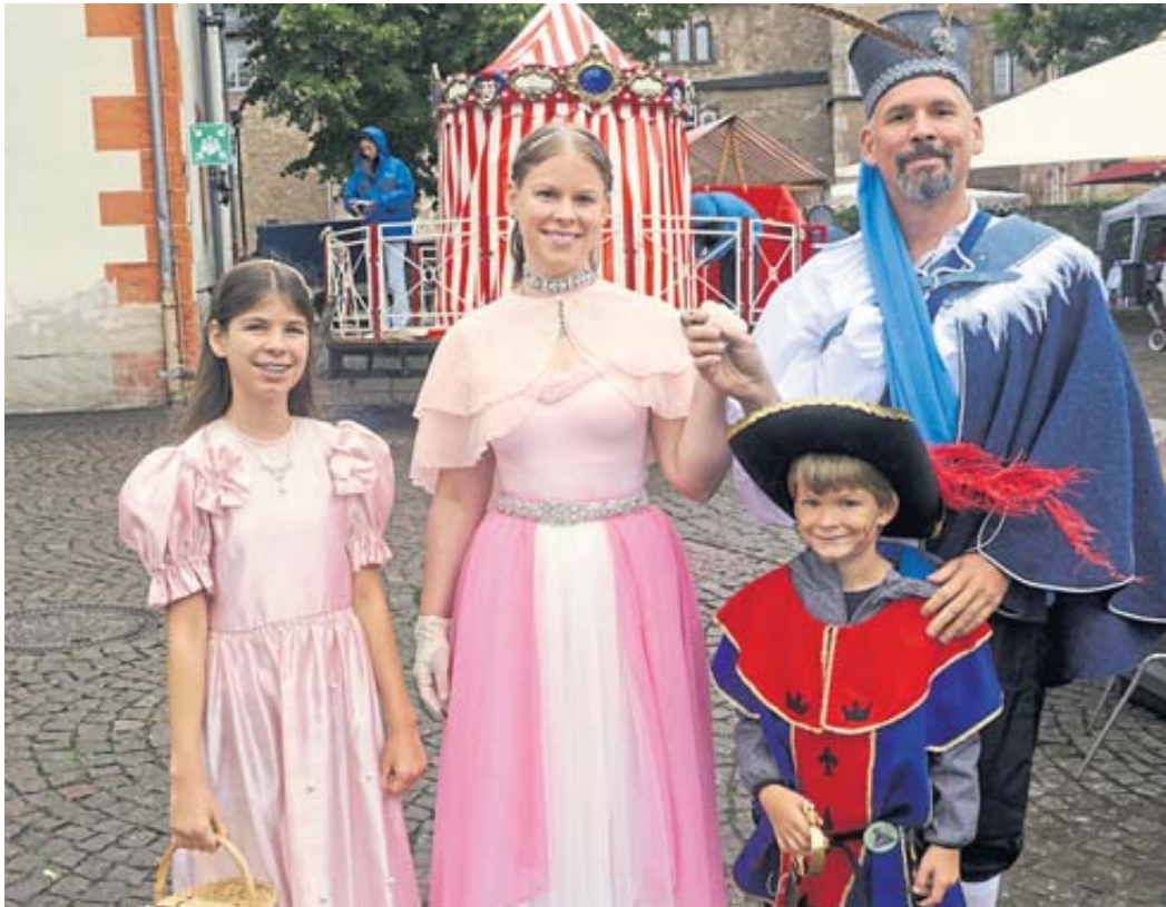
Königstöchter und Prinzen waren zum Märchensonntag in Steinau allerorten anzutreffen.