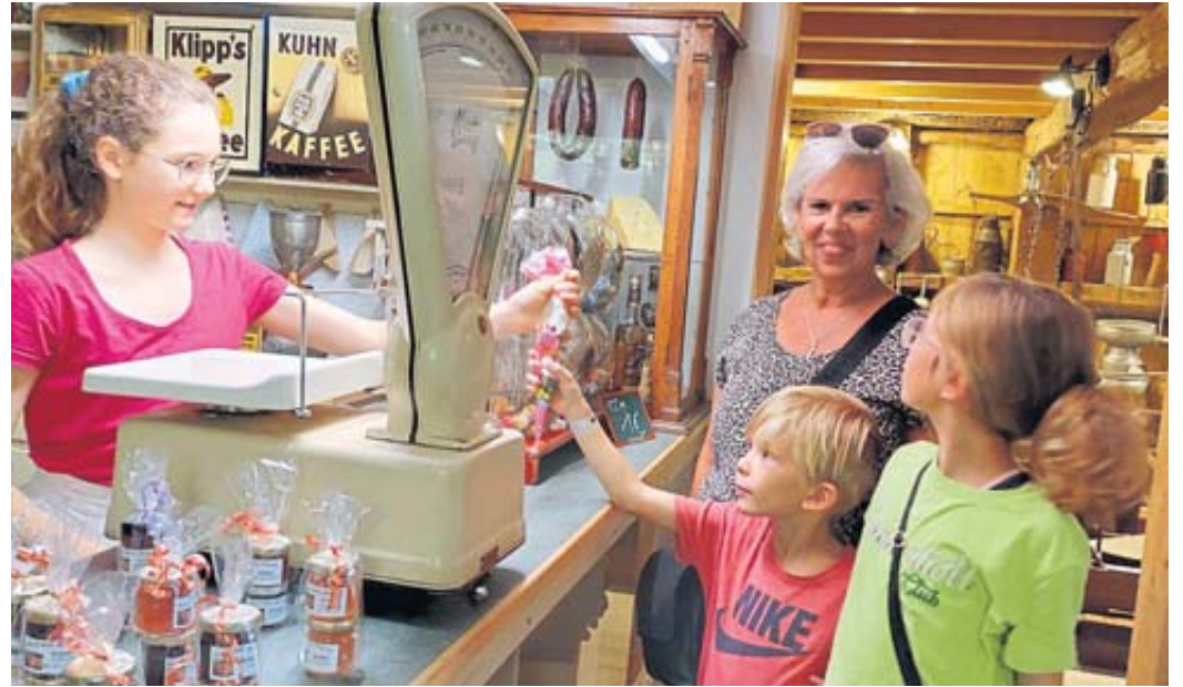
Im Kaufladen des Heimatmuseums wog die „Verkäuferin“ die Süßigkeiten einzeln ab.