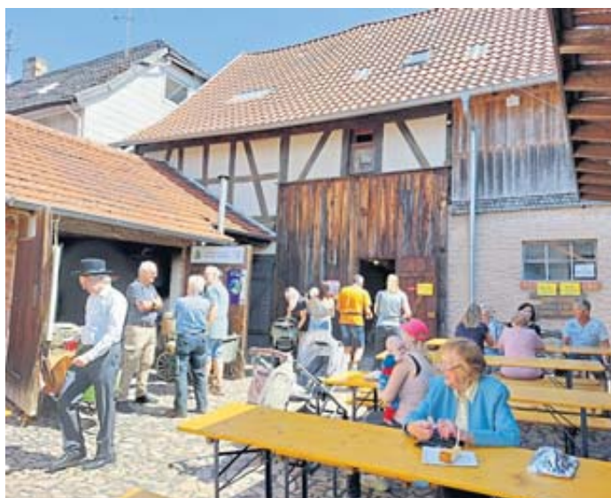
Erstmals nutzten die Besucher den sanierten Museumshof zu einem Aufenthalt.