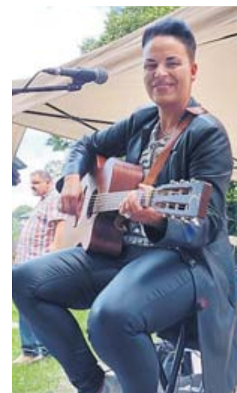
Sängerin Sabho beeindruckte mit ihrer Stimme.