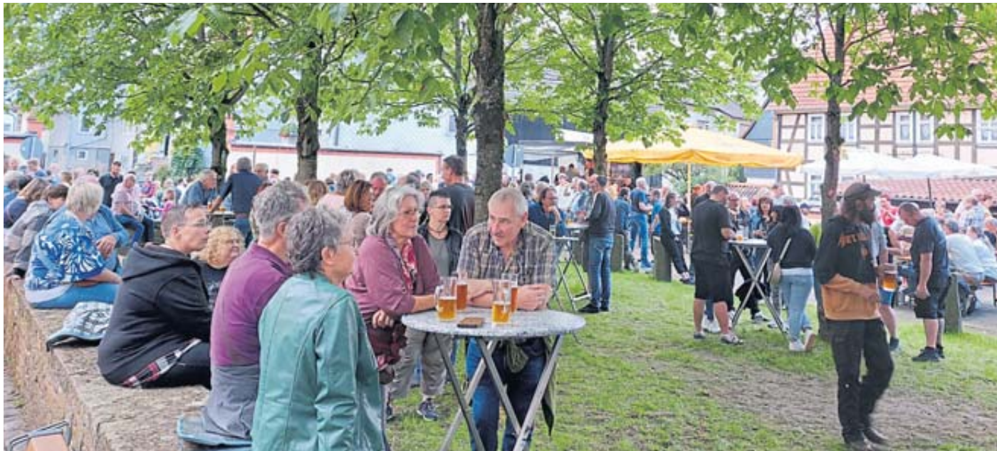
Viel Betrieb herrschte am Abend in Salmünsters Altstadt.

Es seien die ehrenamtlich engagierten Bürger, die eine Stadt mit Leben erfüllen, betonte sie. Dem Sportverein SV 1913 gratulierte sie zu seinem 110-jährigen Bestehen.