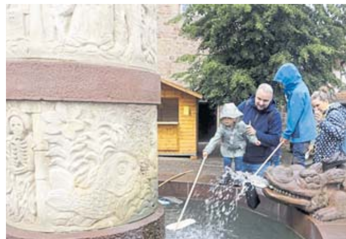
Zertanzte Schuhe konnten die Kinder aus dem Märchenbrunnen angeln – davon ließen sich die jüngsten Besucher auch durch einen Regenschauer nicht abhalten.