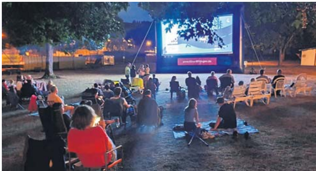
Freilichtkino im Freibad Schlüchtern: Auf dem Programm stehen „Einfach mal was Schönes“ und „Indiana Jones und das Rad des Schicksals“.

HUTTEN – Die Heimat- und Wanderfreunde Hutten unternehmen am Sonntag, 20. August, eine Wanderung mit Einkehr in Dittenbrunn, die von Hartmut Scheel geführt wird. Treffpunkt zur Abfahrt in Fahrgemeinschaften ist um 10 Uhr der Parkplatz in der Ortsmitte von Hutten. BWB