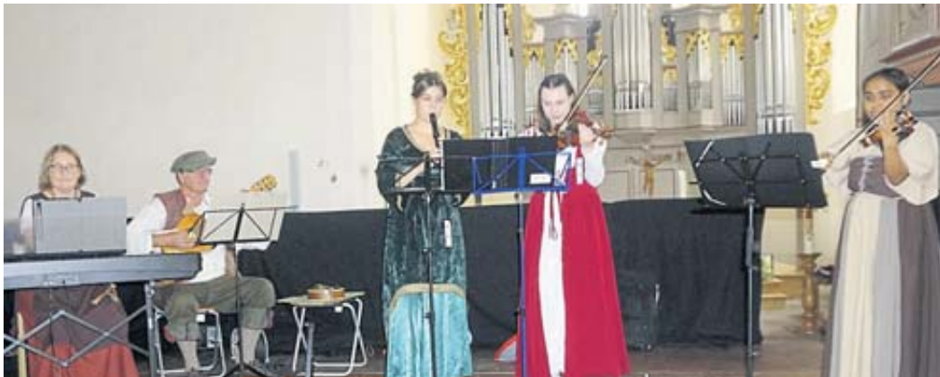
In der Katharinenkirche lauschten die Besucher der Musik.