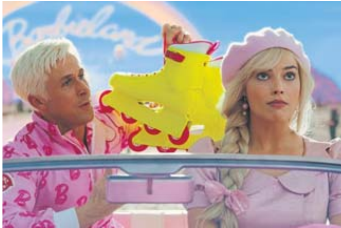
Im Barbieland leben alle Barbies und alle Kens. Jeder Tag ist der perfekte Tag.

Zum Inhalt: Im Barbieland leben alle Barbies, aber auch alle Kens. Jeder Tag ist der perfekte Tag. Sie haben Spaß am laufenden Band. Aber das gilt für die Barbies mehr, als für die Kens, denn die sind vor allem von der Aufmerksamkeit ihrer Angebeteten abhängig. Für die stereotype Barbie ist alles, wie immer. Bis es das nicht mehr ist. Eines Tages ist sie plattfüßig, hat Cellulite und denkt über ihre eigene Sterblichkeit nach. Um wieder zu werden, wer sie war, gibt es nur einen Weg: Sie muss in die echte