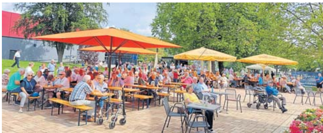
Viele Besucher genossen die Musikkonzerte auf dem Kurparkfest.

Die Kinder vergnügten sich auf der Hüpfburg und nutzten den Kurpark mit seinem schattenspendenden Baumbestand als große Spielwiese. PK