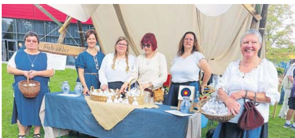
Das gewonnene Salz wird, in kleine Säckchen verpackt, zum Verkauf angeboten.