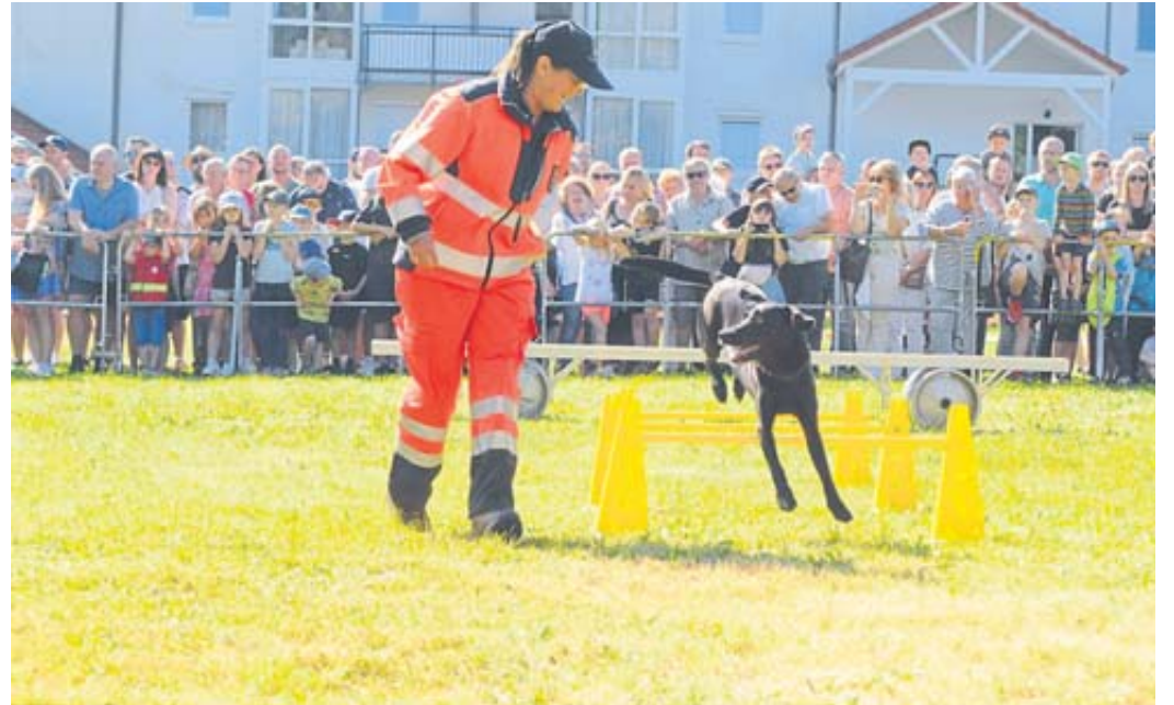
Selbst Pyrotechnik konnte die besonders geschulten Polizeipferde nicht aus der Ruhe bringen. Der Bundesverband Rettungshunde demonstrierte das Können der gelehrigen Vierbeiner.