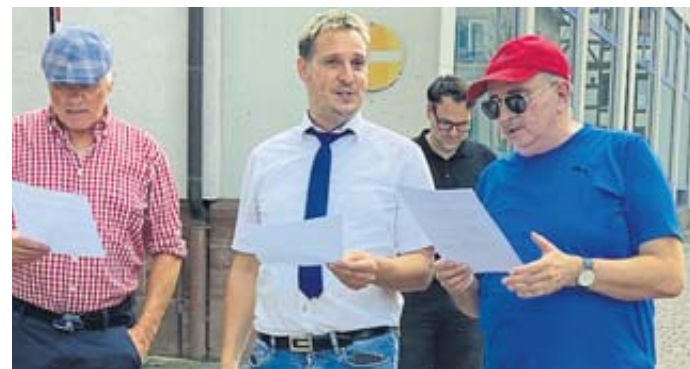
„Dieses Haus ist jetzt viel schöner als vorher“, intonierten die Bänkelsänger.