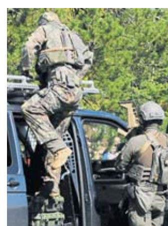
Einen SEK-Einsatz erlebten die Besucher aus der Nähe.

tungshundestaffel als Könnner in ihrem Metier. Wie das Wasser mit acht bar aus einem Wasserwerfer schießt, durften die Gäste ebenfalls bestaunen. Und bei Landung und Start des Polizeihubschraubers galt es, kleine Kinder, Tiere und Hüte gut festzuhalten.