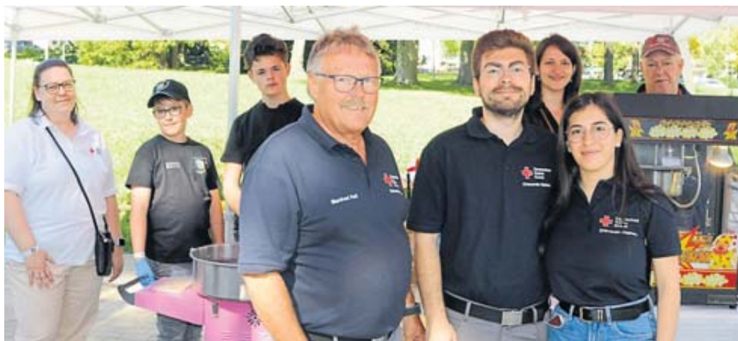
Der DRK-Ortsverein Steinau war stark vertreten.