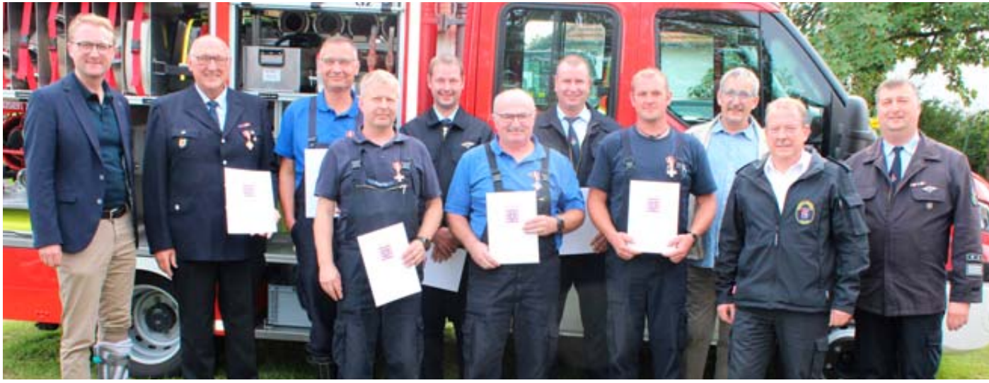
Diese langjährigen Einsatzkräfte wurden mit Brandschutzehrenzeichen des Landes Hessen ausgezeichnet.