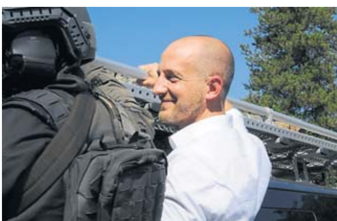
Kurstadt-Bürgermeister Dominik Brasch – einst selbst Polizeibeamter – hatte sichtlich Spaß an seinem „Einsatz“.