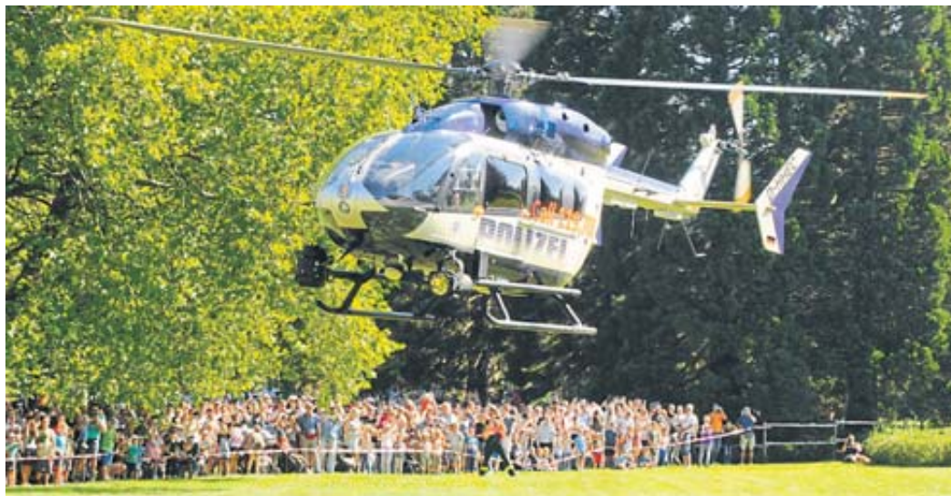
Interessiert verfolgten Hunderte Zuschauer die Landung des Polizeihubschraubers.

Bei der Suche nach Vermissten erwiesen sich die Zwei- und Vierbeiner der Polizeihunde- sowie der Ret-