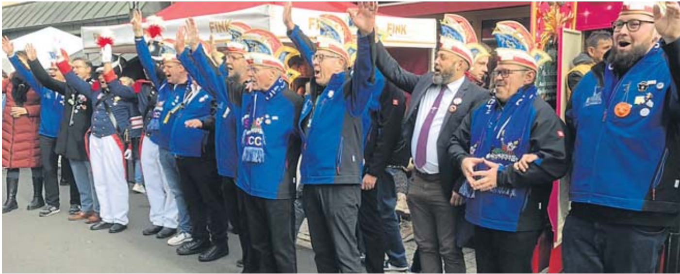
Zahlreiche Narren der Schlüchtern „Spätzünder“ eröffneten die neue Faschingskampagne.