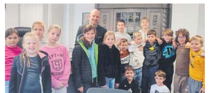
Die Klasse 4a besuchte Bad Soden-Salmünsters Bürgermeister Dominik Brasch im Rathaus.