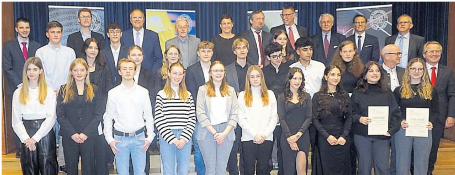
Die Förderpreisträgerinnen und -träger mit Mitgliedern des Stiftungsvorstands und des Stiftungsbeirats.