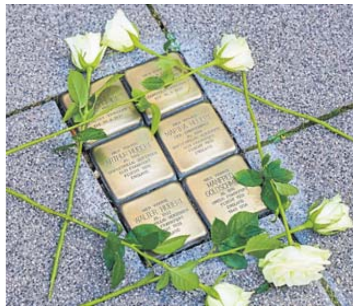
Einige Stolpersteine in der Obertorstraße in Schlüchtern.

allem und gerade durch das individuelle Schicksal, das einen Namen und ein Gesicht bekommt. Sie helfen aber