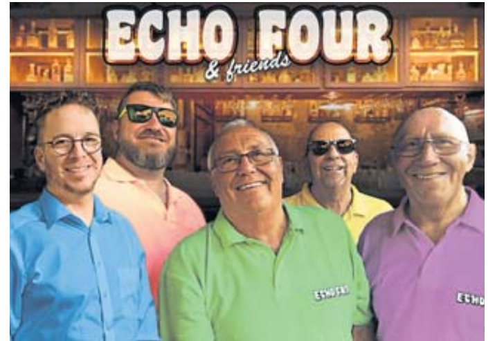
Die Schlüchterner Kult-Band „Echo Four“ feiert im großen Stil ihren 50. Geburtstag.

Geschäftsstelle der Kinzigtal Nachrichten, Obertorstraße 16 Tourist Information, Krämerstraße 5 Reservix-Ticketshops online: Eulenspiegel-entertainment.de