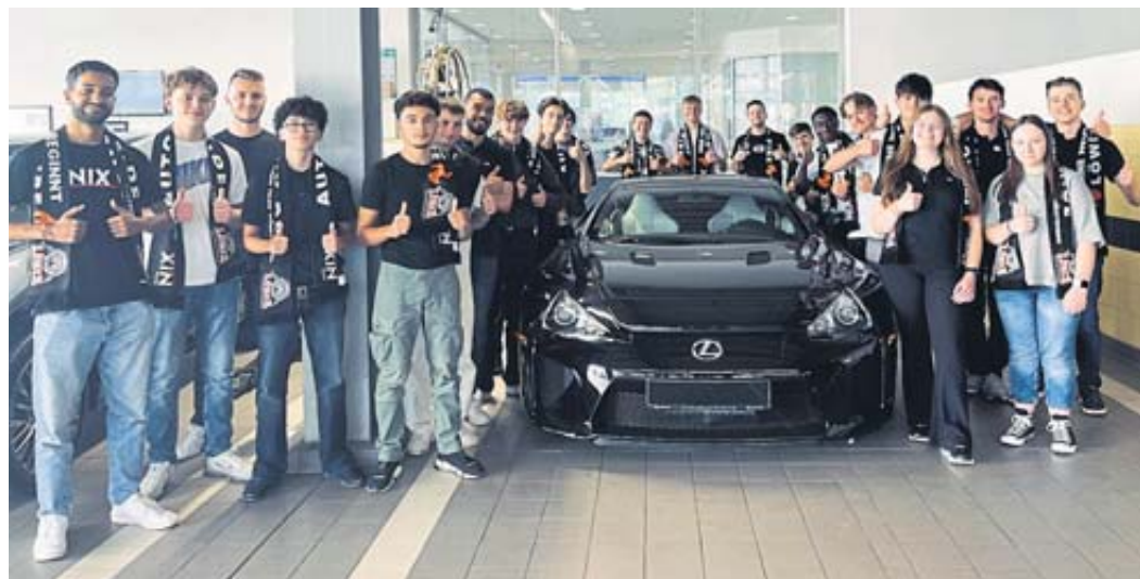
Seit dem 1. September sind 22 neue Auszubildende, FOS-Praktikanten und ein dualer Studierender der Betriebswirtschaftslehre Handel und Dienstleistungen Mitglieder des Autohaus-Nix-Teams.

schiedenen Ausbildungsberufen bei Autohaus Nix, zum Dualen Studium und den Praktika sind ganz einfach auf der Webseite auto-nix.de zu finden. Außerdem besteht dort die Möglichkeit zur schnellen und einfachen Onlinebewerbung. BWB