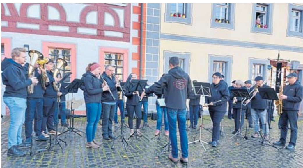
Der Musikverein Salmünster spielte zur Gedenkstunde im Schleifraschhof.

zu beklagen hätten. Seit dem Krieg zwischen Israel und der Terrororganisation Hamas werde Antisemitismus und Nationalismus auch in Deutschland öffentlich zur Schau getragen. Es gelte, sich mit aller Kraft für Frieden und Demokratie in Deutsch-