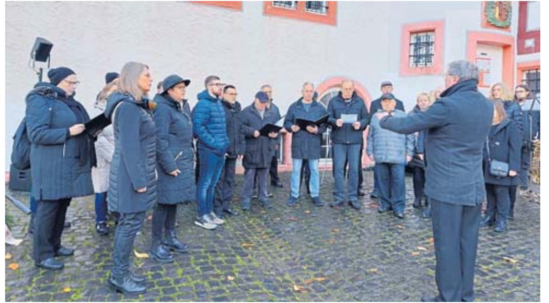
Der Kern'sche Gemischte Chor umrahmte die Gedenkstunde mit seinen Liedern.