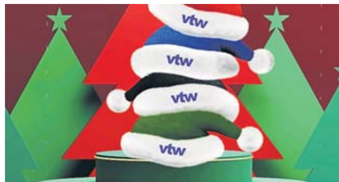
Der VTW startet die beliebte Aktion „Die große Wichtelmützen-Suche“.

Mail: gewinnspiel@vtw-bss.de WhatsApp: (0170) 7537980 vtw-bss.de/weihnachtsaktion