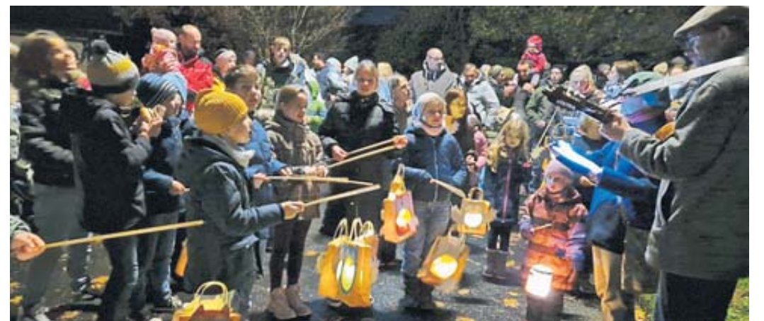
Gitarrenmusik und viele selbstgebastelte Laternen – das Martinsfest erwärmte die Herzen und trug die Botschaft von Nächstenliebe und Großzügigkeit in die Welt.

Am Ende des Abends waren sich alle einig: Das St. Martinsfest in Kerbersdorf hatte eine ganz besondere Magie, die Herzen berührte und die Botschaft von Großzügigkeit und Nächstenliebe in die Welt trug. BWB