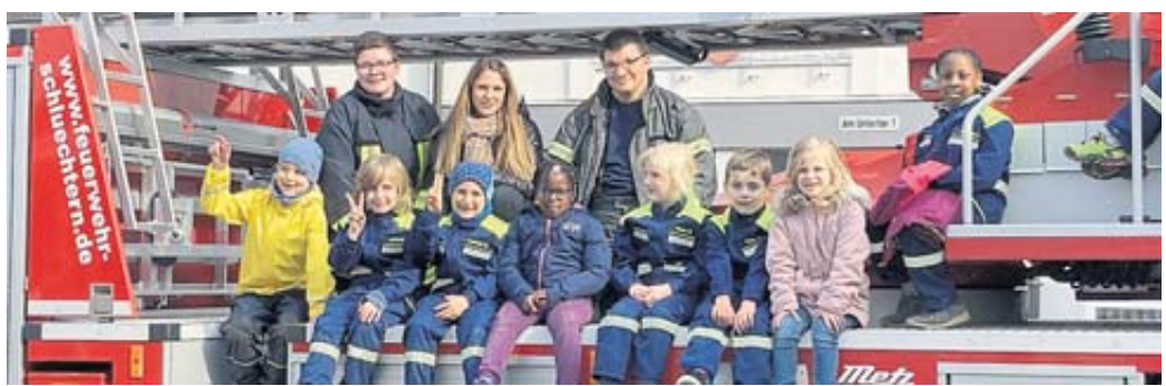
Die bereits bestehende Kinderfeuerwehr Niederzell zu Besuch am Stützpunkt der Innenstadtwehr.