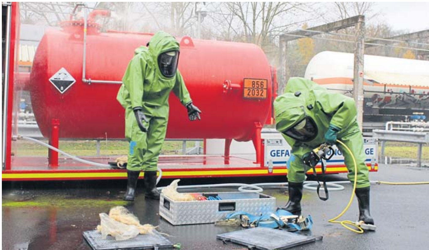
Neben dem simulierten Werkstattbrand übten die Einsatzkräfte den Umgang mit gefährlichen Stoffen. Um Leckagen an einem Tank kümmerten sich Spezialeinheiten der Feuerwehr.