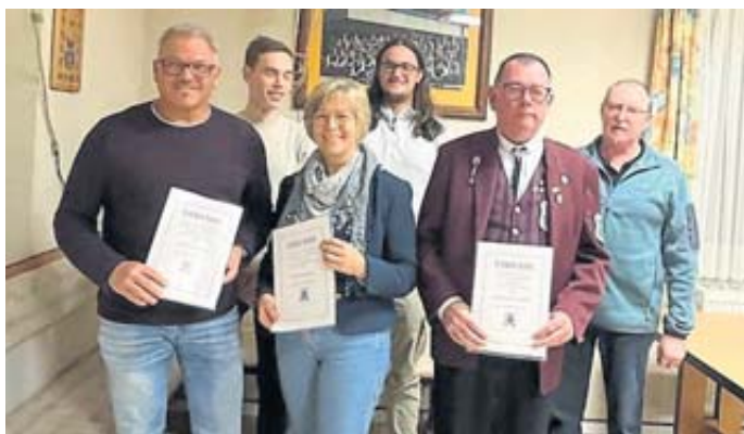
Diese Mitglieder wurden für ihre langjährige Mitgliedschaft im Musikverein geehrt.

RAMHOLZ – Der Frauenkreis II der evangelischen Kirchengemeinde Ramholz lädt für Montag, 4. Dezember, um 19 Uhr zur Adventsfeier in den Gemeindesaal im Pfarrhaus ein. BWB