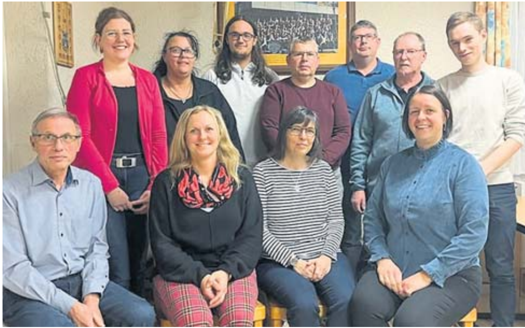
Der neu gewählte Vorstand des Musikvereins Cäcilia Bad Soden.