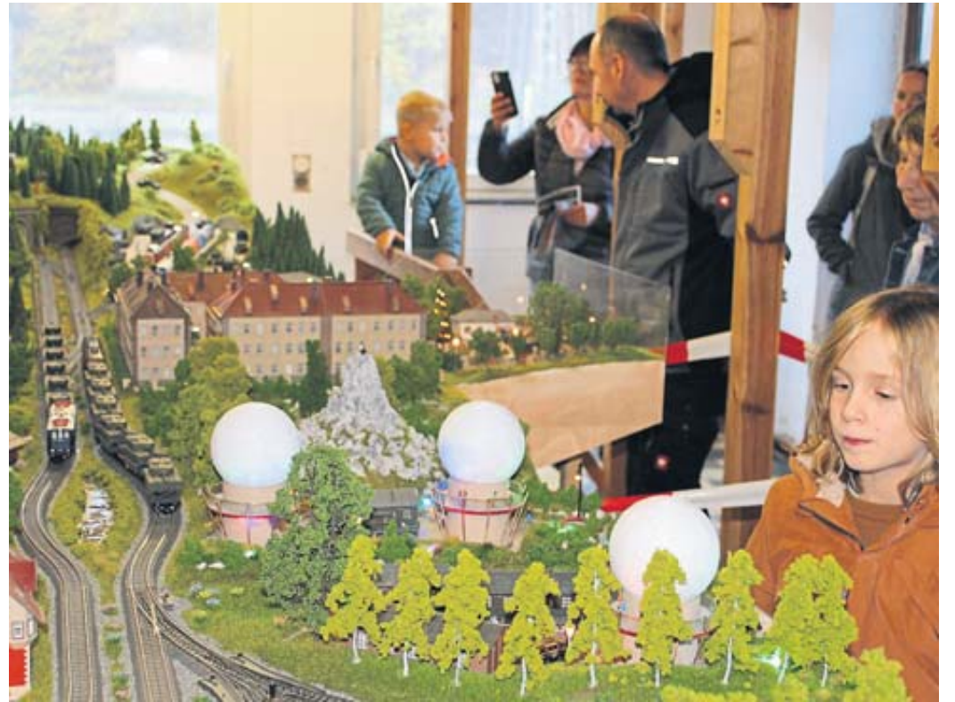
Die Modellbahnanlage im Jossaer Bahnhof wurde von zahlreichen Besuchern in Augenschein genommen.