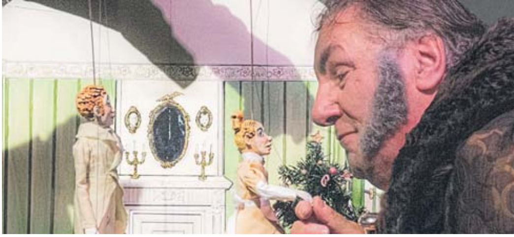
Die weltberühmte Weihnachtsgeschichte von Charles Dickens' in der Version des Theatriums Steinau.