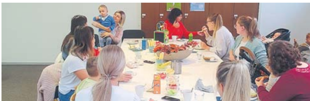
Seit September 2021 begleitet eine ehemalige Kinderkrankenschwester das Frühstückscafé „Baby Plus“.

Infos skf-bad-soden-salmuenster.de Telefon (06056) 5402