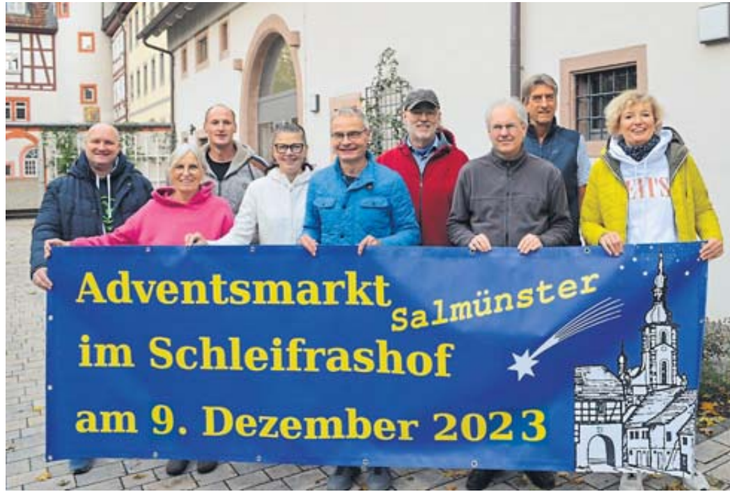
Das Orga-Team der Vereinsgemeinschaft Salmünster freut sich auf den Adventsmarkt im Schleifrashof.