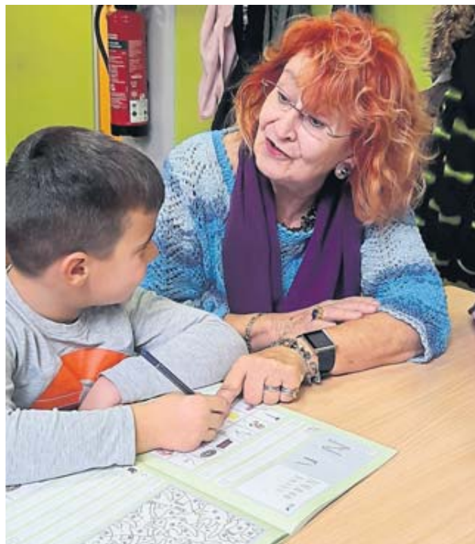
Massiv profitieren einzelne Kinder von der individuellen Förderung.