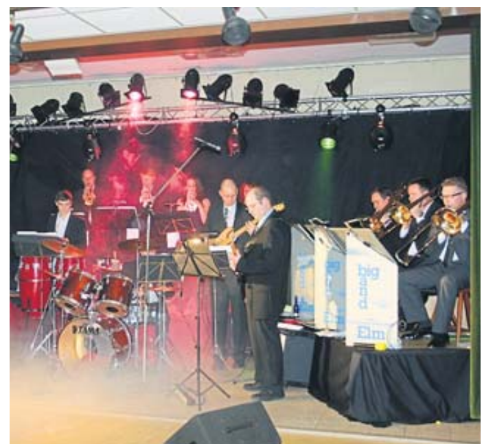
Die Big Band des Eisenbahner Musikvereins Elm hat 50-jähriges Jubiläum. Unser Foto zeigt die Band in früheren Zeiten.

Kartenvorverkauf E-Mail: gerald.lotz@web.de Telefon (0178) 6001551