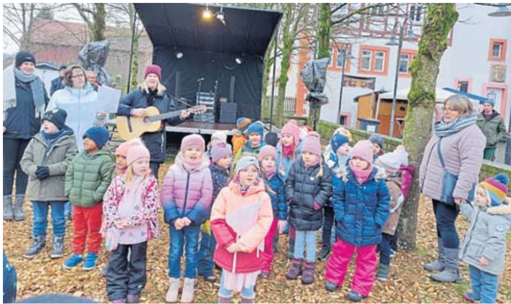
Die Kindergartenkinder von St. Marien eröffneten mit ihren Liedern den Adventsmarkt.