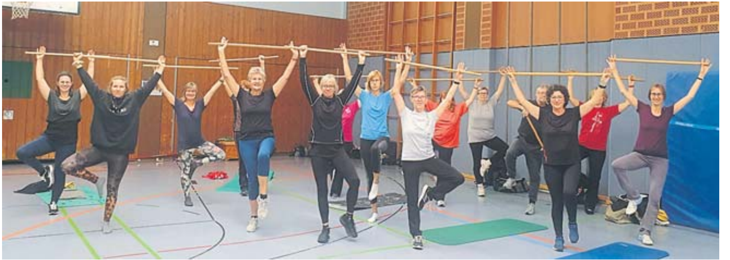
Die Fitness- und Gesundheitstage des Turngaus Kinzig.