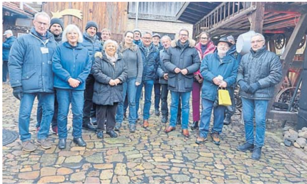
Am Heimatmuseum wurde – mit viel Prominenz – zum Adventsmarkt der neu gepflasterte Hof eingeweiht.