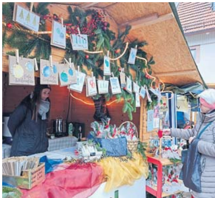
Der Stand des Sportkindergartens war hübsch dekoriert.

dergarten und das Peru-Kinderhilfsprojekt von Hildesheim Hagemann-Korn. Zur Freude der Kinder drehte sich ein Karussell, und