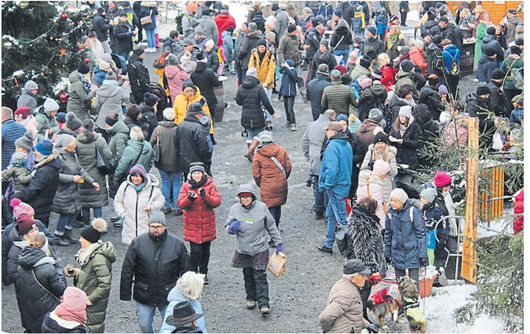
Hochbetrieb herrschte beim Weihnachtsmarkt auf der Burg Schwarzenfels, wo Besucher aus der gesamten Region kommen.

UERZELL – Die Freiwillige Feuerwehr Uerzell/Neustall lädt für Samstag, 30. Dezember, um 19.30 Uhr zur Jahreshauptversammlung in das Feuerwehrgerätehaus Uerzell ein. BWB