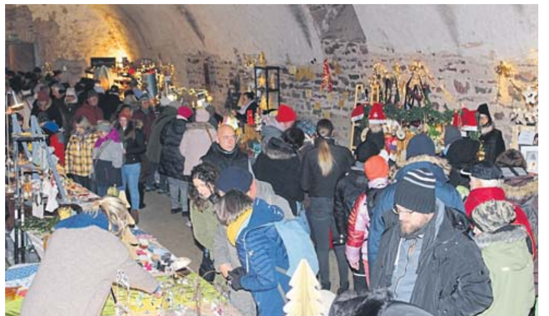
Im historischen Keller des Marstalls gab es viele Stände mit weihnachtlichen Artikeln.

Die Kinder des Kindergartens Zwergenburg sowie des Schwarzenfelser Kindertagesdienstes sangen weihnachtliche Lieder. Der Posanenorchester Züntersbach und die Landrückenmusikanten Veitsteinbach sorgten für stimmungsvolle Klänge. Bei verschiedenen Aktionen kamen auch die Mädchen und Jungen auf ihre Kosten, insbesondere beim Besuch des Nikolauses. FGW