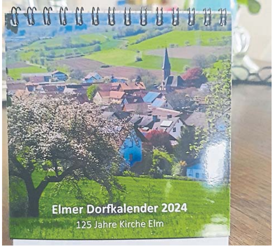
Der neue Tischkalender zeigt Elm im Wechsel der Jahreszeiten.

Damals bestellten Vey und Asmus 100 Tischkalender – und mussten aufgrund der großen Nachfrage nochmals 20 nachordern. Die Auflage haben sie in diesem Jahr direkt ein kleines wenig gesteigert, wobei die Zahl der 125