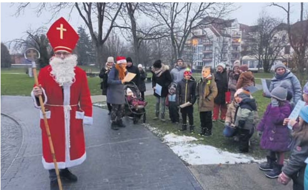
Der Nikolaus erwartete die Kinder im Kurpark.