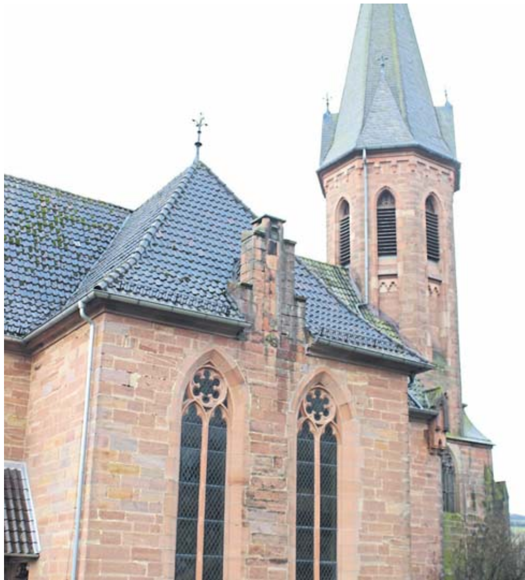
Die Elmer Kirche feiert 125jähriges Bestehen.

Die Kirche in Elm gehört zu den jüngeren Gotteshäusern der Region. Dennoch ist es schon etwas Besonderes, wenn das Gotteshaus 125 Jahre alt wird. Zu diesem Jubiläum geben wir einen Einblick in dessen Geschichte. Weil der Vorgängerbau Ende des 19. Jahrhunderts in schlechtem Zustand war und wegen Einsturzgefahr sogar zeitweise geschlossen werden musste, trieb der damalige Pfarrer Ludwig Hartmann die Pläne zu einem Neubau voran. Nach dem Abriss des alten Gebäudes wurde im Jahr 1896 mit dem Bau der neuen Kirche begonnen. Nach zweijähriger mühevoller Bauzeit erfolgte im Oktober 1898 die Einweihung des neuen im