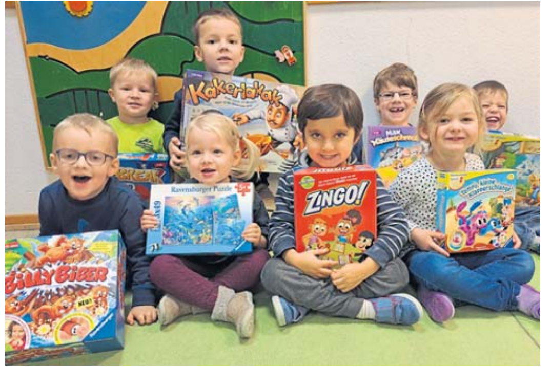
Kita-Spielothek im Kindergarten „Kleine Riesen“ in Züntersbach: Kinder des Kindergartens.

Die „Kita-Spielothek“ beinhaltet unterschiedliche Spiele und Spielwelten, die erfahrene Pädagogen und Wissenschaftler des ZNL Transfer-Zentrum für Neurowissenschaften und Lernen getestet und hinsichtlich der Kompetenzbildung von Kindergarten- und Krippenkindern bewertet wurden. Das Konzept basiert, wie bei einer Bibliothek, auf einem Ausleihsystem- denn die Spielwaren sollen neben dem Einsatz in den Einrichtungen auch an die Familien der Kinder ausgeliehen werden. Die Ausleihe bietet den Eltern nicht nur die Möglichkeit, bisher unbekannte Spielwaren mit den Kindern zu testen. Sie trägt zu einer guten Erziehungspartnerschaft zwischen Eltern und Kindertagesstätte bei. Die Ausleihe bietet einen guten Anlass für Gespräche zwischen Eltern und Fachkräften über die Entwicklung des jeweiligen Kindes. Außerdem tragen die Spielsachen zu einer Verzahnung der Lebenswelten der Kinder bei: