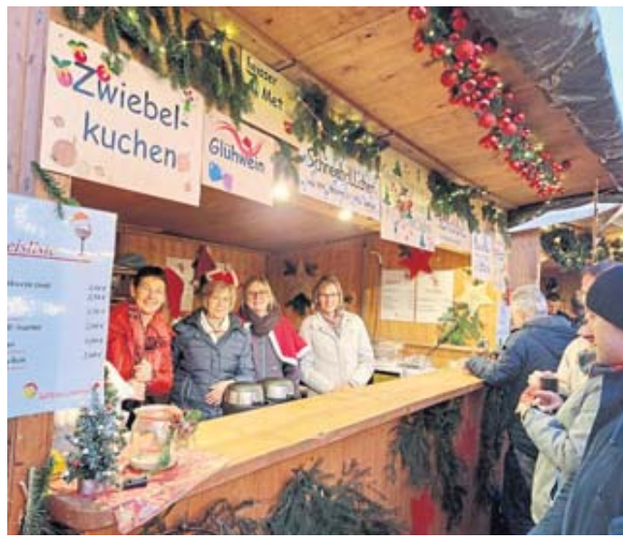
Hübsch dekorierte Stände gruppierten sich um den Salinenplatz.

Bei Einbruch der Dunkelheit schickten die Bläser des Alphornechos Kasselgrund ihre stimmungsvollen Adventsklänge über das Außengelände. Am Vortag hatte der Posaunenchor Wächtersbach ein Platzkonzert gegeben. Während am Samstag der Markttag mit einer Glühweinparty zur Musik der „Nachtschwärmer“ endete, klang der Weihnachtsmarkt am Sonntagabend mit geselligem Treffen an den Ständen aus. PK