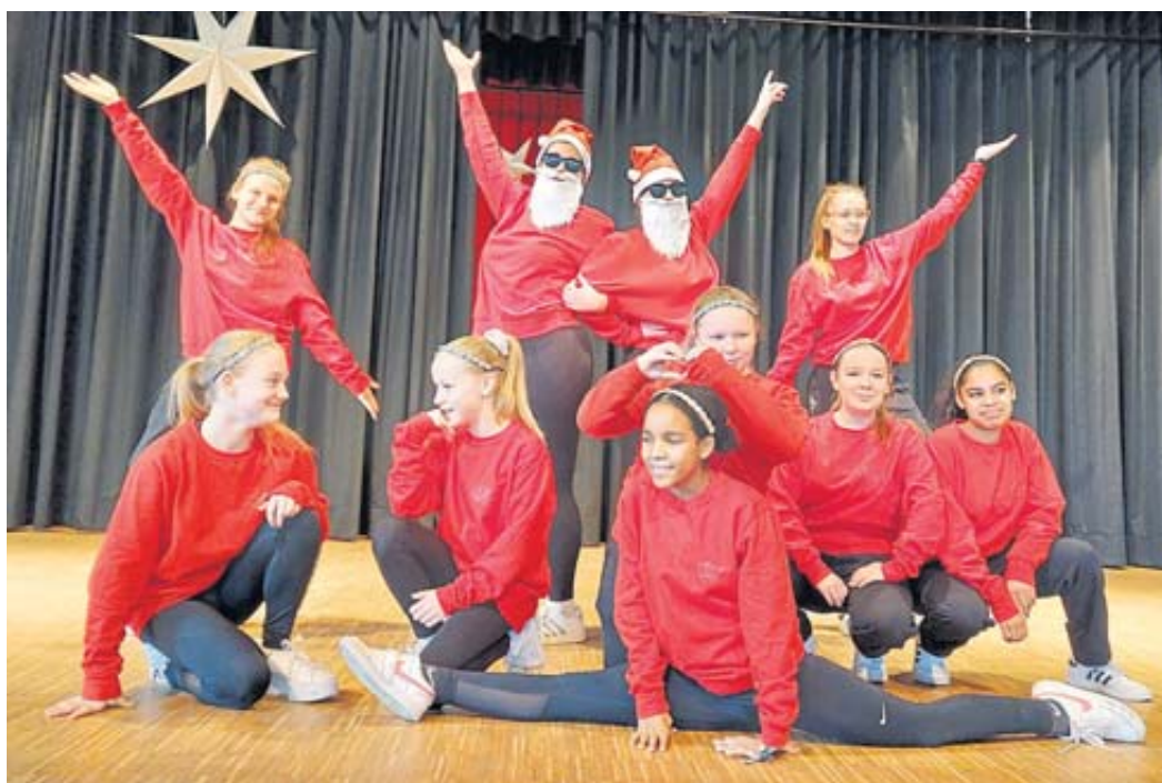
Die Tanzgruppe „Wild fires“ brachte Tanz und Akrobatik auf die Weihnachtsmarkt-Bühne.