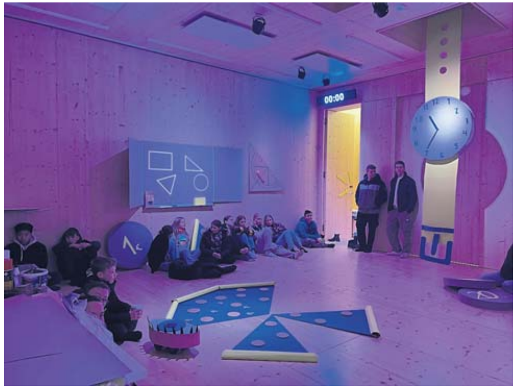
Die Aufnahme entstand während des Tags der offenen Tür an der Stadtschule.