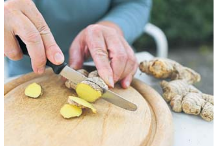
Ob zu Herzhaftem oder Süßem, Ingwer verleiht Speisen ein exotisches Aroma.

Sein zitronig-scharfes Aroma gibt sowohl herzhaften als auch süßen Speisen richtig Wumms. Mit kochendem Wasser übergossen, kann er als Tee getrunken werden. Doch egal wofür man frischen Ingwer nutzt: Er sollte erst kurz vor der Verwendung zerkleinert werden, empfiehlt das Bundeszentrum für Ernährung (BZfE). Grund dafür sind die ätherischen Öle, die sich leicht verflüchtigen.