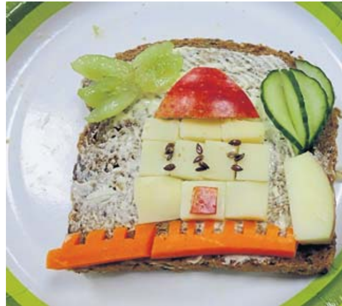
Essen nicht nur als Mahlzeit, sondern als ein kleines Abenteuer und als Basis für Zahngesundheit.

Die schönste Frühstücksbox wird jeden Monat prämiert. Wer mitmachen möchte, schickt ein Foto der Lieblings-Frühstücksbox an akjz@mkk.de . BWW