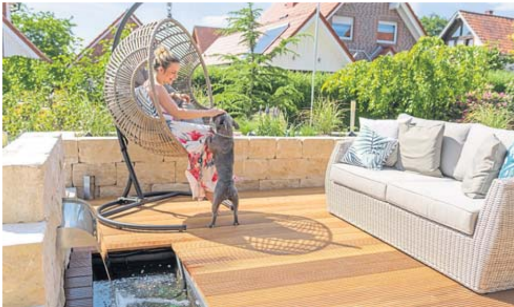
Bei der Verwirklichung des Traumgartens steht Raiffeisen Baustoffe in Welkers mit Rat und Tat zur Seite.