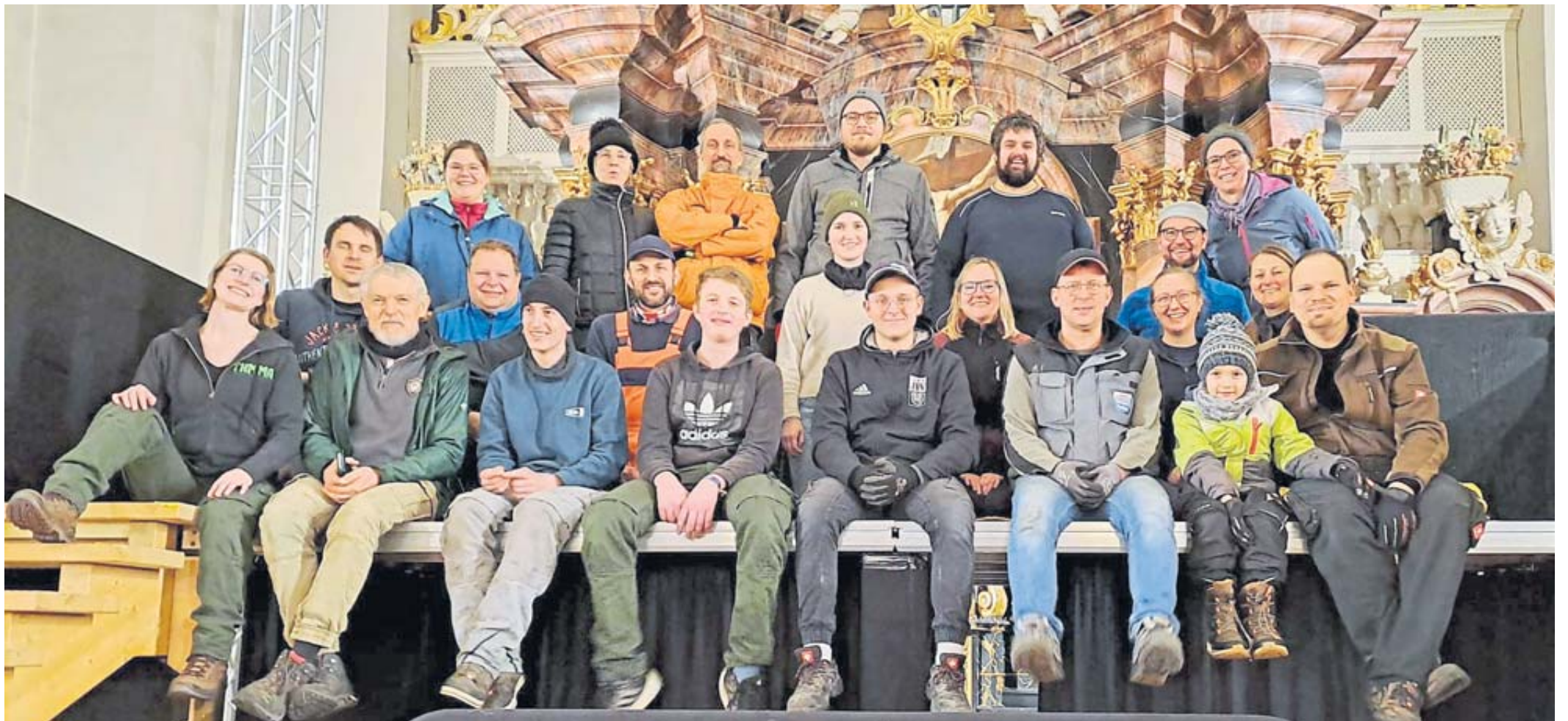
Sie alle packten beim Bühnenaufbau für die Passionsspiele in der Kirche St. Peter und Paul tatkräftig mit an.