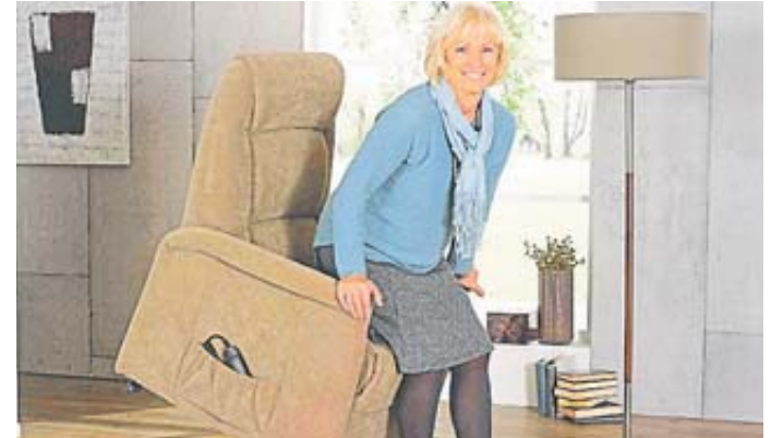
Für Menschen, denen das Aufstehen schwerfällt, hat Möbel Laibach die passenden Lösungen, wie hier ein Sessel mit Aufstehhilfe.

Gerade in Zeiten, in denen man wochenlang aufs eigene Zuhause angewiesen war, ist deutlich geworden: Wer es gemütlich hat, ist klar im Vorteil. Möbel Laibach in Hünfeld bietet Qualitätsmöbel für die Wohnbereiche Essen, Schlafen, WohlfühlWohnen an. Sie stammen überwiegend aus deutscher Produktion. Hohe Standards sind aus diesem Grund in allen Bereichen gewährleistet.