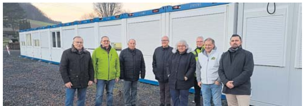
Der Gemeindevorstand machte sich vor Ort ein Bild über die Wohnsituation der Geflüchteten in der Containerwohnanlage in Sannerz.