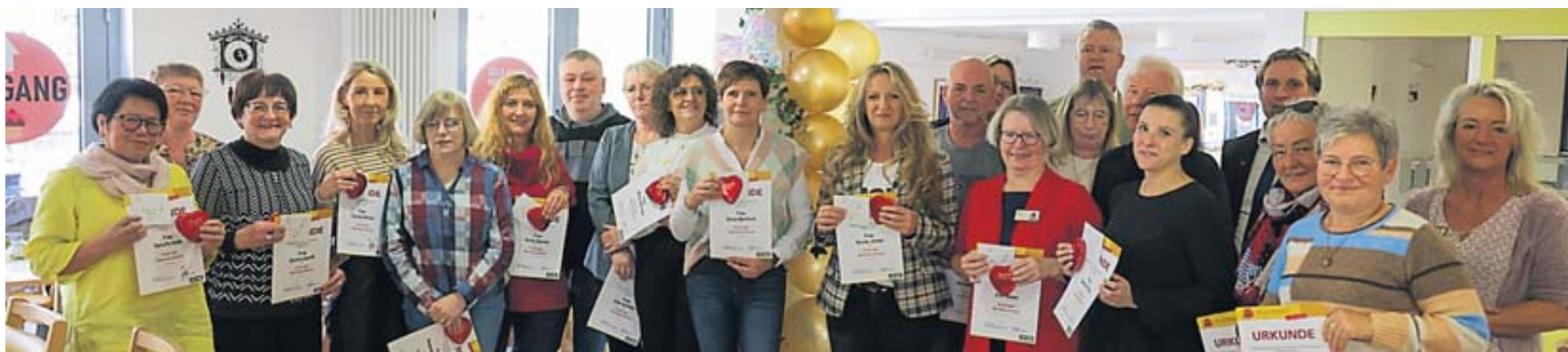
Ehrungen und Verabschiedungen gab es im Wohn- und Gesundheitszentrum Lebensbaum Sinntal.

Redaktions- und Beilagenschluss Dienstag 12 Uhr