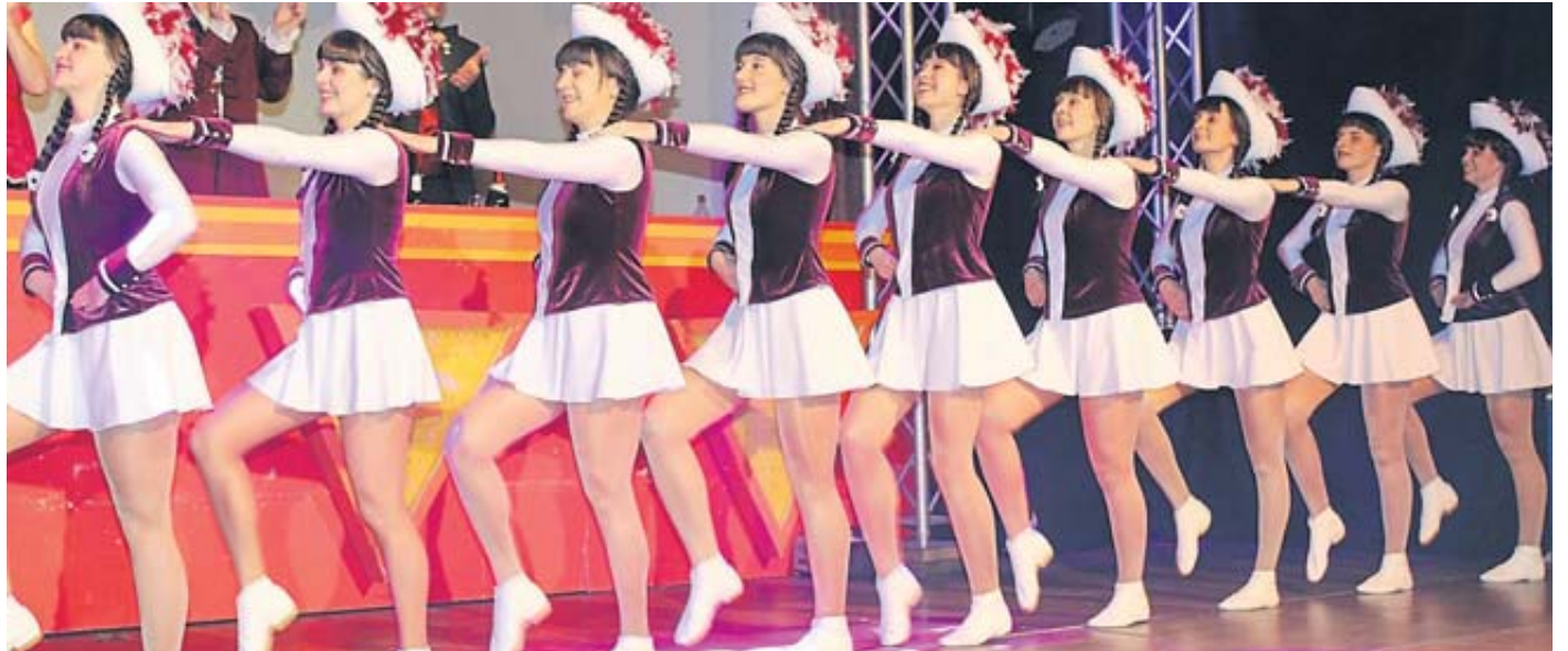
Die Königsgarde des gastgebenden TV Sterbfritz präsentierte einen zackigen Gardetanz.