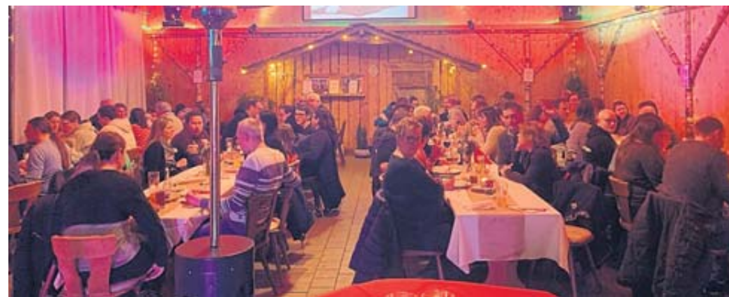
Das gemeinsame Essen zum Jahresbeginn ist auch als Dankeschön für die passiven Mitglieder der HSG gedacht – vergangenes Wochenende in der Feldscheune in Ulmbach.