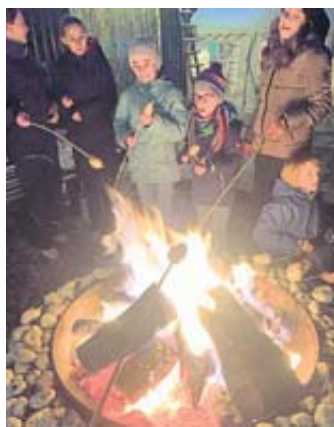
Das Lagerfeuer bereitete den Kindern viel Freude.

chen direkt vor Ort zubereitet. Anschließend wurde noch ein Lagerfeuer angezündet, was vor allem bei den Kindern auf viel Gegenliebe stieß, zumal sich darin Stockbrot in unterschiedlichen Formen kreieren ließ. BWB