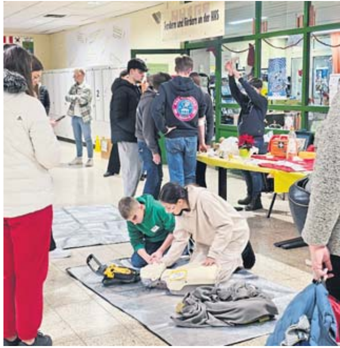
Die Schulsanitäter zeigten ihr Können vor einem großen Publikum.

Die Silberkonfirmation des Jahrgangs 1999 findet am 29. September in Schwarzenfels statt. BWB