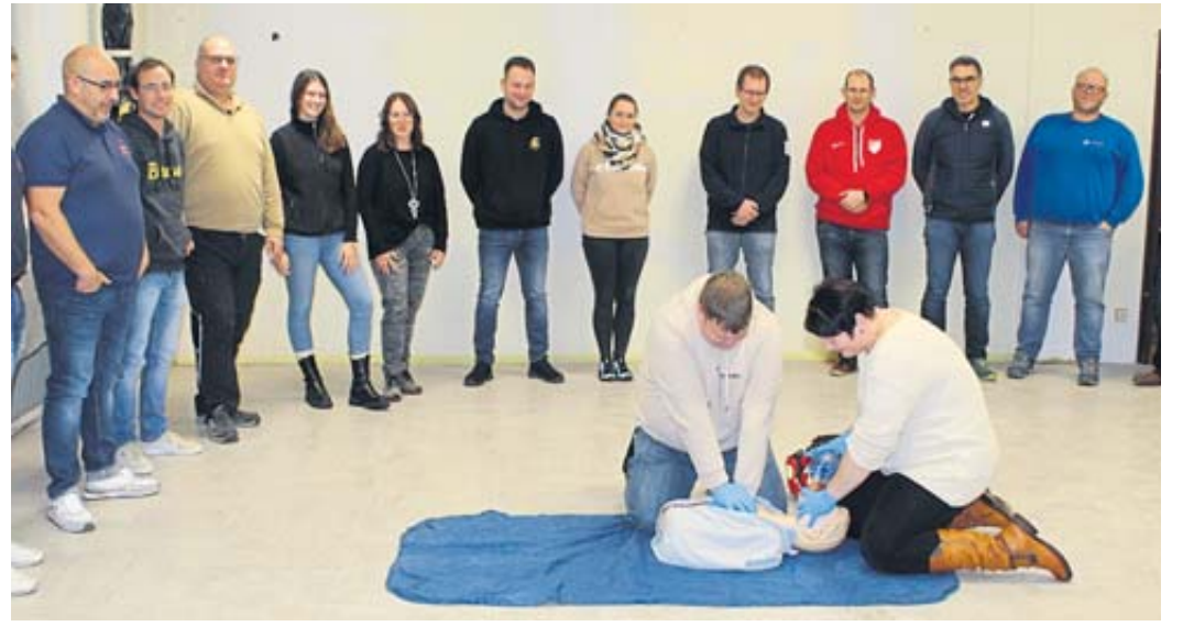
Ein Teil der Vorauhelfer Sinntal bei einer Ausbildungsveranstaltung im Sterbfritzer Feuerwehrhaus.

Wie Gemeindebrandinspektor Michael Röhl betont, sei für die Vorauhelfer ein bestimmter Qualitätsstandard von Bedeutung. So müssen sie regelmäßige Aus- und Weiterbildung absolvieren, insbesondere Reanimierungstraining. Die Finanzierung für die Materialvorhaltung der Vorauhelfer, jeder hat eine große Tasche mit bestimmten notwendigen medizinischen Utensilien, geschieht größtenteils über ein Spendenkonto bei der Gemeinde Sinntal. Sowohl Spender als auch weitere Aktive sind willkommen. FGW