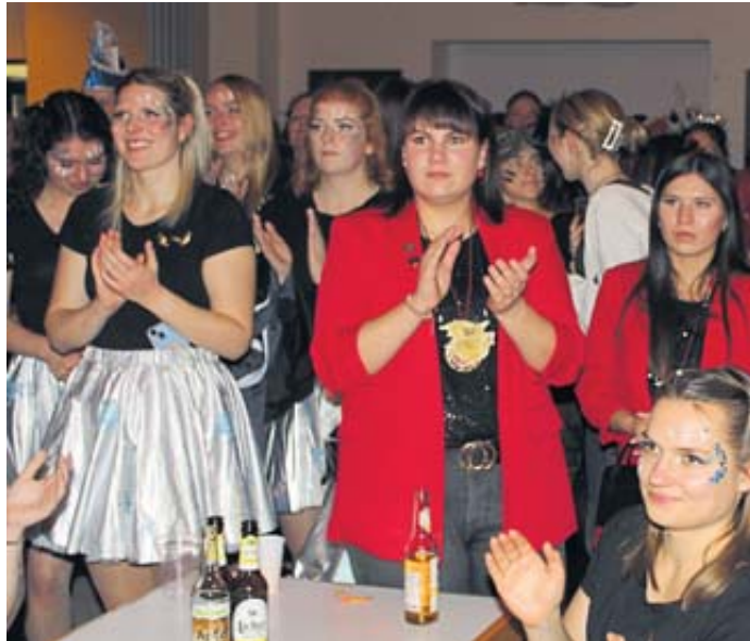
Einige der vielen Besucher in der proppevollen Halle.