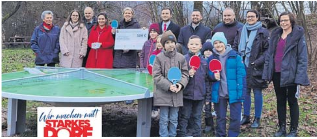
Schule, Gemeinde, Ortsbeirat und Betreuungsverein freuen sich über das gelungene Projekt.

AHL – Unter dem Motto „Bad Ahl am See lässt's wieder krachen!“ lädt der Kultur- und Heimatverein Ahl wieder zu zwei Faschingsveranstaltungen mit Livemusik, Büttreden, Gardetänzen und anderen Überraschungen ein. Sie finden statt am Freitag, 2. Februar, und Samstag, 3. Februar, jeweils ab 19.39 Uhr im Bürgerhaus „Alte Schule Ahl“ (Einlass jeweils ab 19 Uhr). Kartenvorverkauf für beide Veranstaltungen ist am Sonntag, 28. Januar, von 17 bis 18 Uhr im Feuerwehrgerätehaus Ahl. Von 16 bis 18 Uhr bietet die Feuerwehr Würstchen und Getränke vor dem Gerätehaus an. BWB