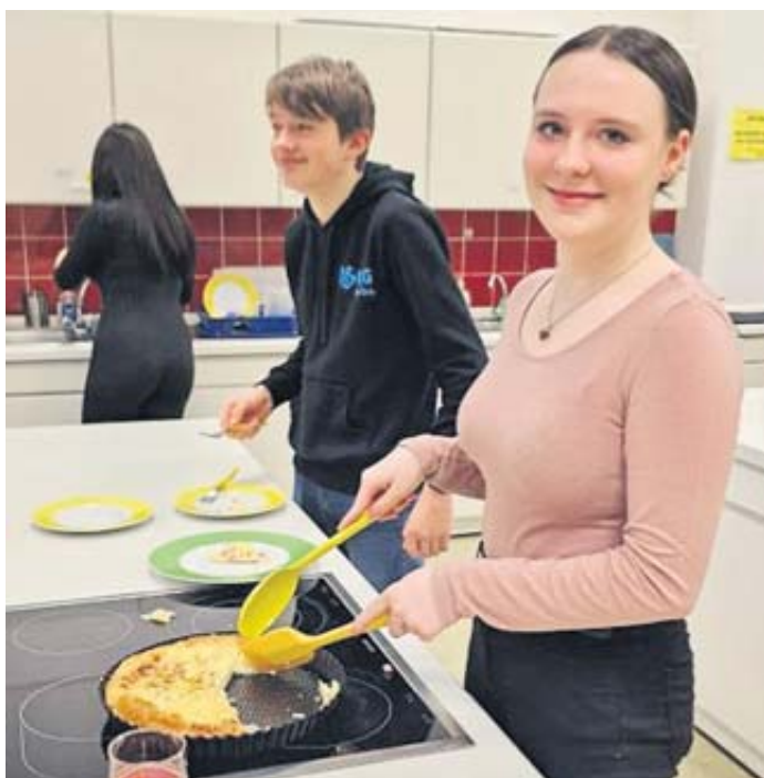
Französische Speisen zubereiten war eine der vielfältigen Aktivitäten zum deutsch-französischen Freundschaftstag.