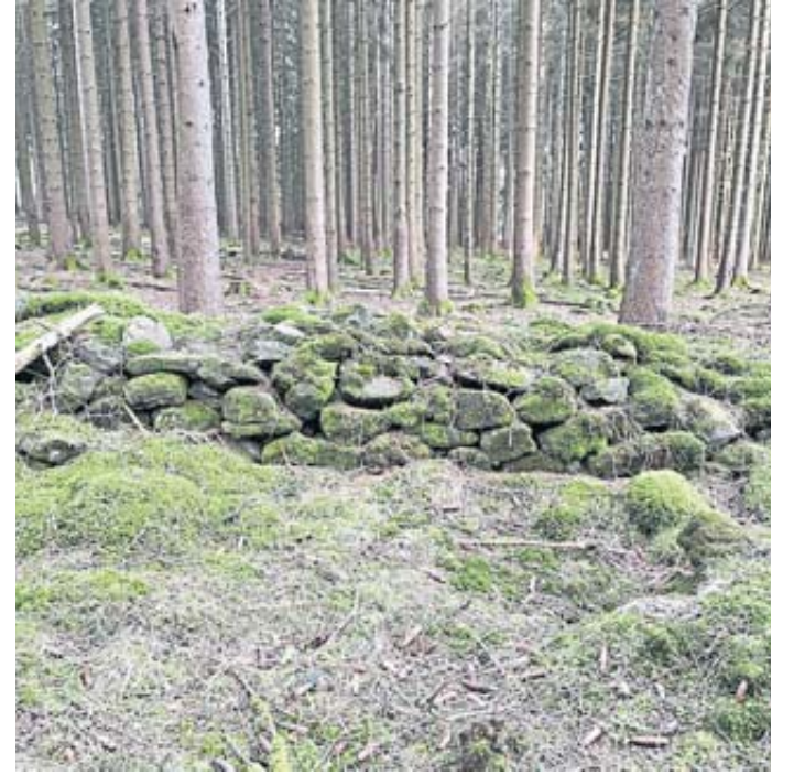
Unser Foto zeigt ein Teilstück der ehemals 200 Meter langen „Scheidmauer“ auf einer Weide des Gestüts Steinau.

tenz. Die Nutzung der Natur macht diese zur Kulturlandschaft. Nicht selten wechselte die Nutzung, so auch heute noch. Von den unterschiedlichen Nutzungen sind heute noch Reste wie zum Beispiel Steinriegel, Gräben, Brüche, Geländeabsätze, Mauern und Hohlwege zu sehen. Von mittelalterlicher Waldnutzung über Eisengewinnung und Weidenutzung bis hin zur Wiese des gräflichen Gestüts Steinau und zum modernen Wirtschaftswald ist nur ein Beispiel unterschiedlicher Nutzung der Kulturlandschaft. Mit dem Projekt des Kulturweges sollen diese Nutzformen in Erinnerung gebracht werden.