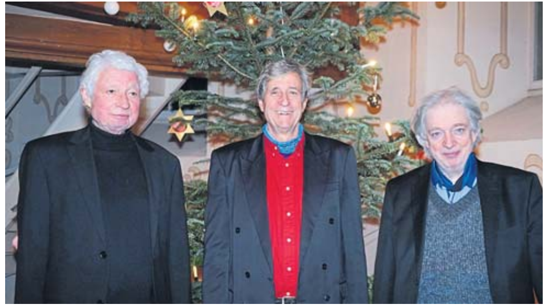
Die drei Darmstadt-Brüder spielten barocke weihnachtliche Kammermusik in der Kirche in Ramholz.