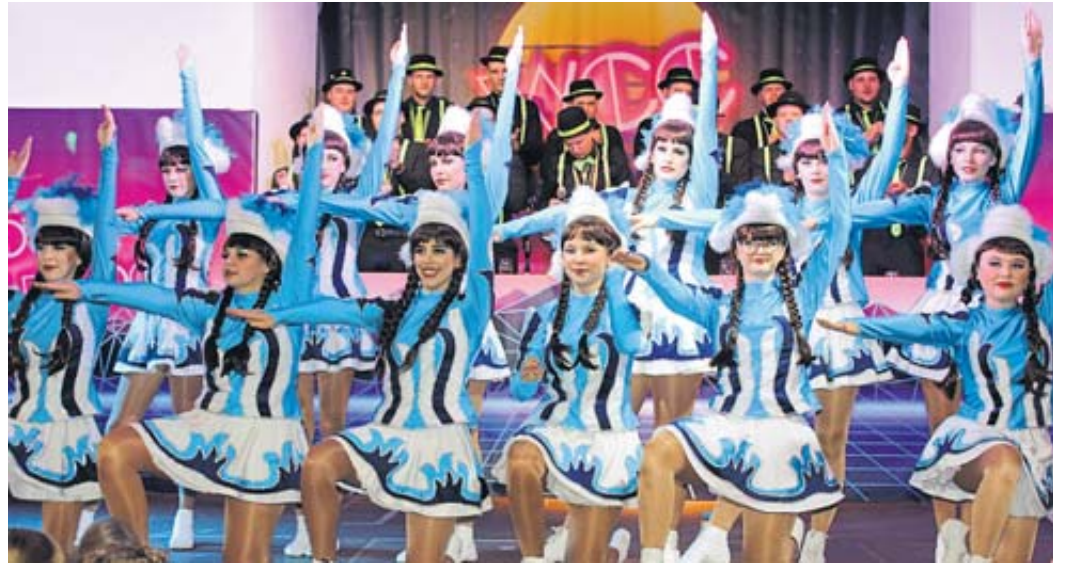
Sieben Gruppen der „Wellblooe“ tanzten bei der Kräppelsitzung. Unser Foto zeigt die Prinzen-Garde.