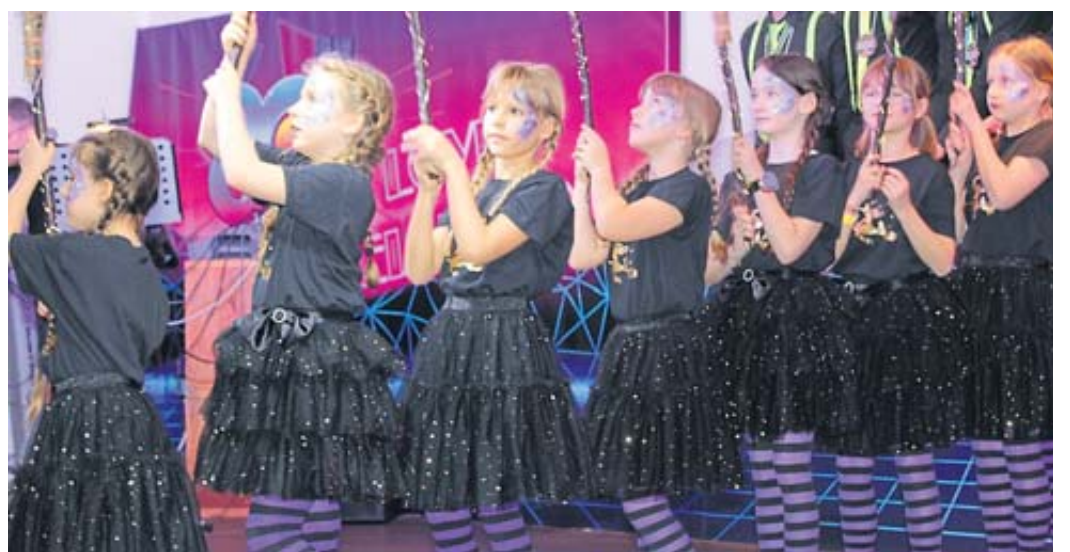
Die Dance-Girls präsentierten einen Showtanz.

Das neue Konzept ging auf. Die Veranstaltung wurde auf Anhieb zu einem vollen Erfolg. Der Saal des Landgasthofes Druschel war bis auf den letzten Platz besetzt. Vorwiegend älteres Publikum, jedoch nicht nur, nahm dieses neue Angebot gerne an. Im Eintrittspreis für diesen närrischen