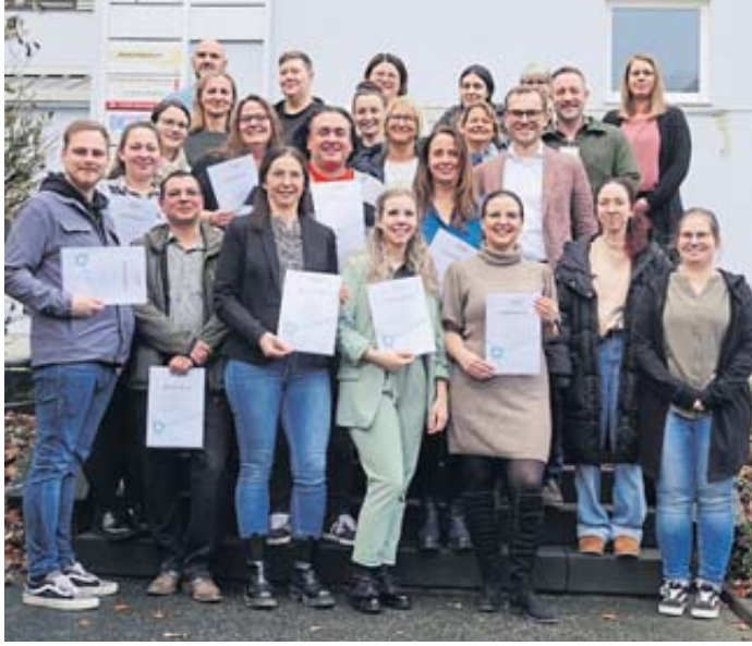
Die Main-Kinzig-Kliniken können elf neue Praxisleiterinnen und Praxisleiter in ihren Reihen begrüßen.