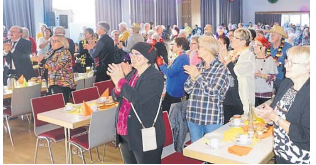
Eine tolle Stimmung herrschte bei der Seniorenfastnacht in Schlüchtern.