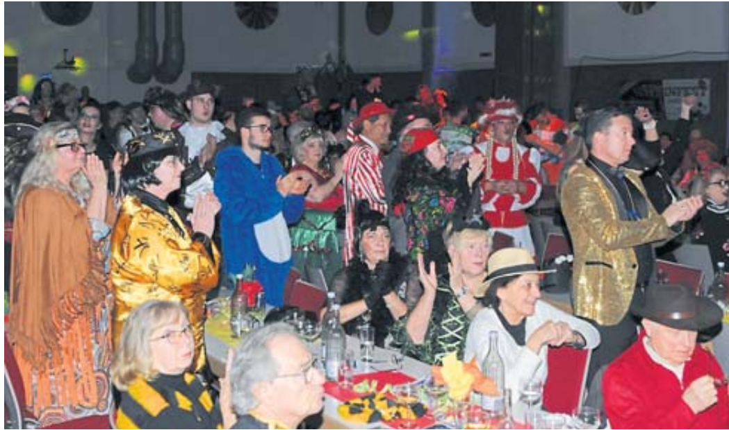
Je länger die Fastnachtssitzung in der Stadthalle dauerte, desto ausgelassener und zunehmend im Stehen wurde gefeiert.