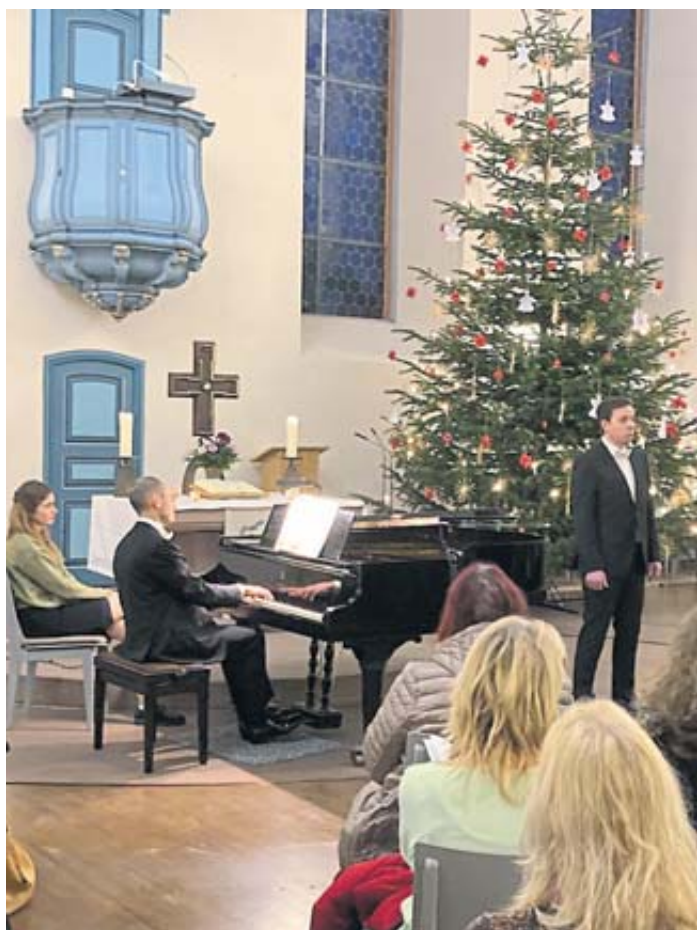
Mit Schuberts „Winterreise“ erklang einer der bedeutendsten Liederzyklen der deutschen Romantik in der Reinhardtskirche in Steinau.