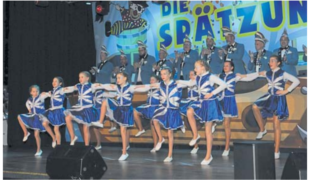
Gardetänze sind stets ein fester und glamouröser Programmpunkt auf den Fremdensitzungen in der Fastnachtszeit.