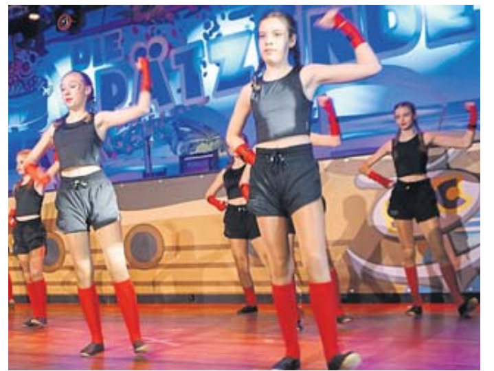
Die Knallfünkchen bewegten sich mit ihrem Showtanz im Boxingring.

Fazit: Die Spätzünder haben beim Seniorenfasching ein närrisches Feuerwerk entfacht, das sich hören und sehen ließ. CS