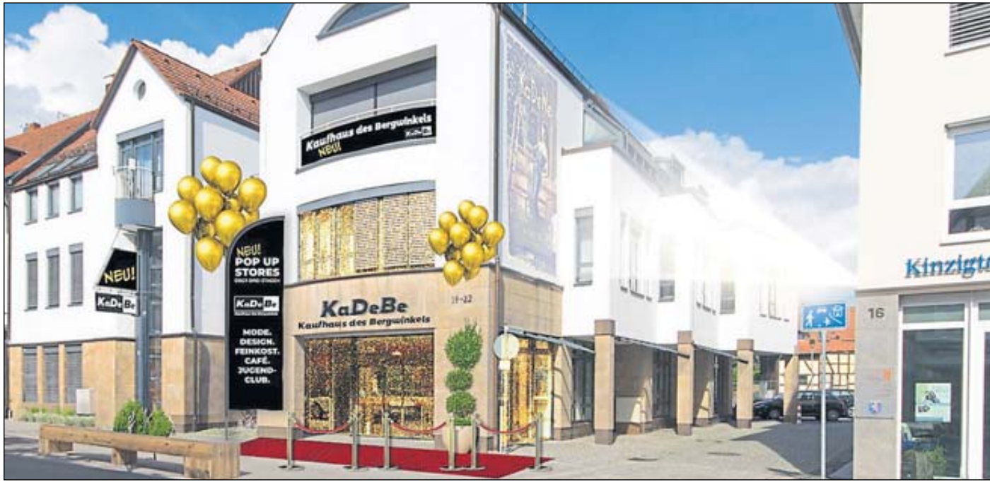
Aus der alten VR-Bank in der Schlüchterner Obertorstraße wird das „KaDeBe“.

ROMSTHAL – Der Ski- und Wanderclub Huttengrund startet am Sonntag, 25. Februar, ins neue Wanderjahr. Die Winterwanderung beginnt um 10 Uhr am Parkplatz an den Tennisplätzen in Ulmbach. Die für Kinderwagen geeignete Panoramastrecke ist rund sechs Kilometer lang. Treffpunkt zur Abfahrt nach Ulmbach ist um 9.30 Uhr im Schulhof in Romsthal. Eine Einkehr im Schützenhof ist möglich. Ebenfalls am Sonntag wird um 18 Uhr Heilige Messe in der Sankt Franziskus Kirche Romsthal für die lebenden und verstorbenen Mitglieder des Ski- und Wanderclubs Huttengrund gefeiert. BWB