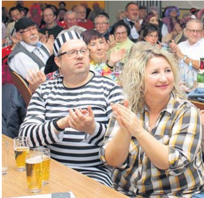
Vergnügte Gesichter im voll besetzten Gemeinschaftshaus.