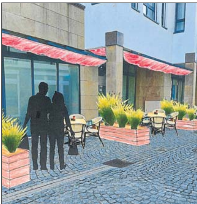
So könnte der Außenbereich in der Schmiedsgasse aussehen.