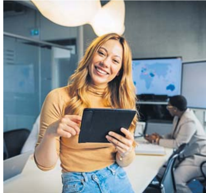
Job Crafting statt Jobwechsel: Individuelle Anpassungen im aktuellen Job können zu mehr Zufriedenheit führen.

Eine Kündigung löse demnach häufig gar nicht die wahren Ursachen der beruflichen Unzufriedenheit. Vielmehr besteht die Ge-