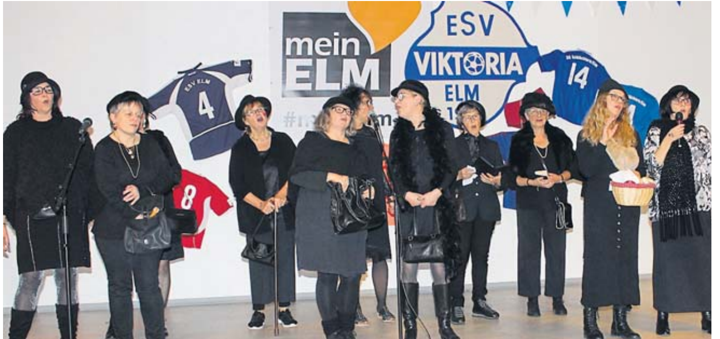
Als schwarze Witwen präsentierten sich die Damen der Gymnastikabteilung beim bunten Abend in Elm.