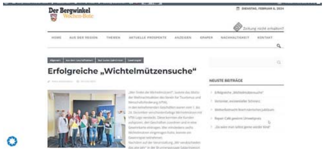
Auf der Website des Bergwinkel Wochen-Boten finden die Leser auch das E-Paper unserer kostenlosen Wochenzeitung.