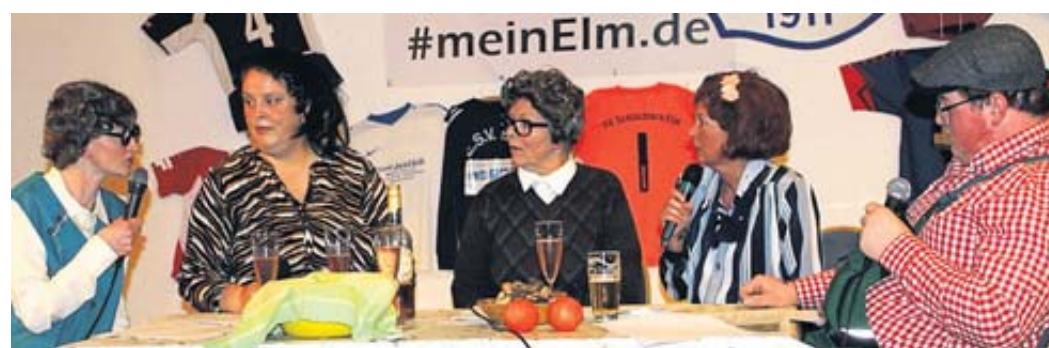
Viel zu erzählen hatten sich die „Hugoweiber“ und ein „Hugomann“.