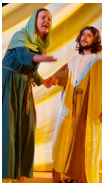
„Geh nicht fort!“, fleht Maria Magdalena.