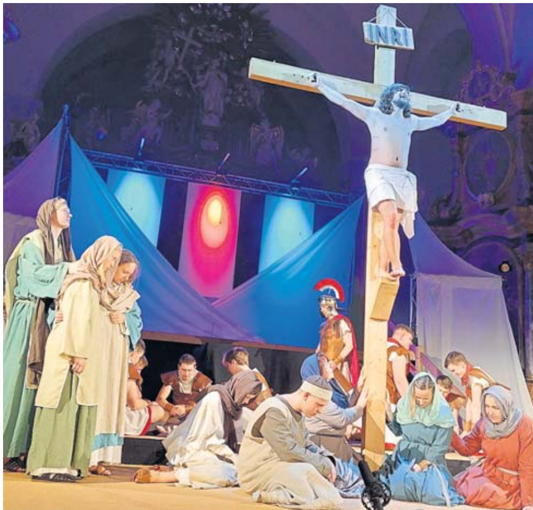
Nur eine Handvoll Getreuer weint unter dem Kreuz.

Ja, Gleichstellung aller Menschen, Nächstenliebe (so-