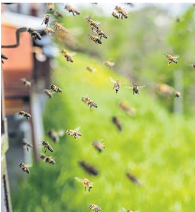
Im Frühjahr werden auch im Bergwinkel die ersten Honigbienen ausschwärmen. Die Temperaturen müssen dazu über zwölf Grad Celsius klettern.

kaufsmesse mit dem hessischen Imkertag verbunden. Veranstaltungsort wird die Stadthalle Schlüchtern sein. Neben den Bergwinkel-Werkstätten werden auch andere Anbieter mit ihren Produkten vertreten sein – so etwa die Gärtnerei Immengarten, der Imkereibedarf „Die Biene“, das Imkergut „Cum Natura“, die Imkerei Eichholz aus Steinau und andere mehr.