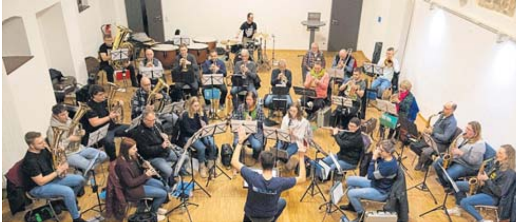
Im Generationentreff in Salmünster wurde für das Jahreskonzert fleißig geübt.

Das Jahreskonzert findet am Samstag, 9. März, um 19.30 Uhr (Einlass ab 19 Uhr) im Spessart Forum in Bad Soden statt. Karten gibt es zum Vorverkaufspreis von 10 Euro bei allen MVS-Musikern, „Getränke Dorn“ in Salmünster und „Tante Emma wohnt“ in Bad Soden. Restkarten an der Konzertkasse kosten 12 Euro. BWB