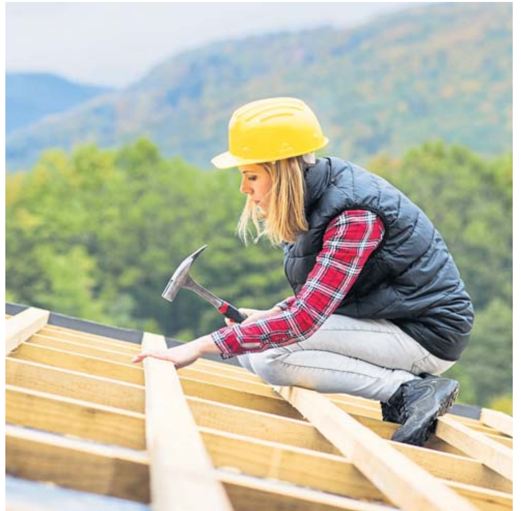
Immer mehr weibliche Azubis zieht es ins Dachdeckerhandwerk.

Rolf Fuhrmann erklärt überdies: „Die vielfältigen Aktivitäten der Berufsorganisation in Sachen Nachwuchssuche machen sich bezahlt. Angesichts der stabilen Lage möchten wir jedoch den Rückgang um 1,37 Prozent – das sind 41 Auszubildende – im ersten Ausbildungsjahr nicht unbeachtet lassen. Daher werden wir verstärkt in neue Formen der Nachwuchssuche investieren.“