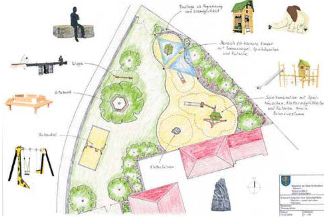
Im Garten des ehemaligen Pfarrhauses soll ein Spielplatz entstehen. Hier ein erster Entwurf.