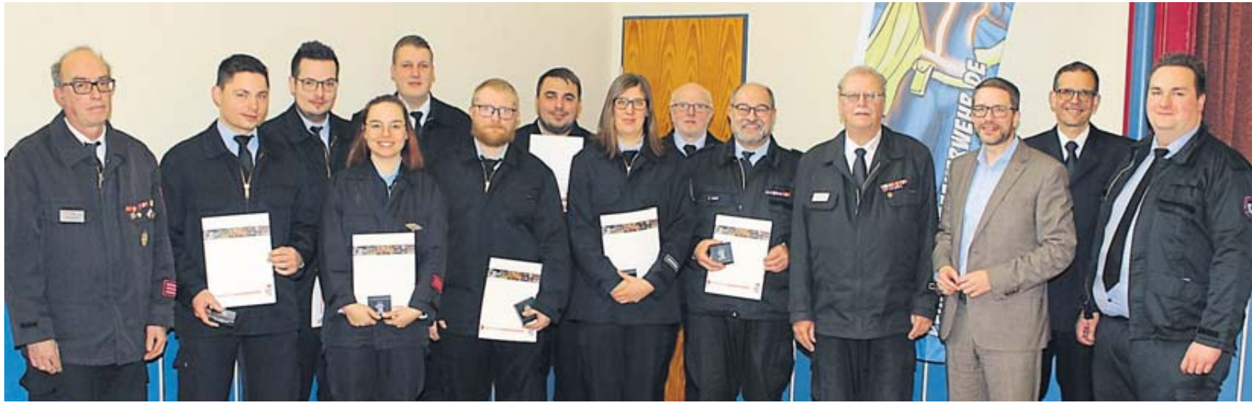
Auszeichnung von Jugendfeuerwehrfunktionären mit Floriansmedaillen des Landes Hessen.