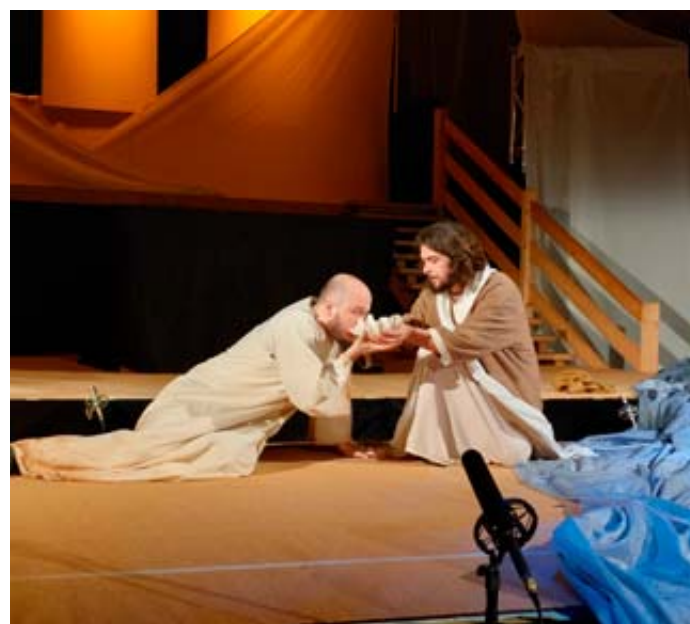
Jesus reicht Levin, dem verlorenen Sohn, das Wasser des Lebens.

gar Feindesliebe), Versöhnung und Barmherzigkeit kennzeichneten den Weg Jesu, der jedoch unweigerlich im Tod am Kreuz enden sollte.