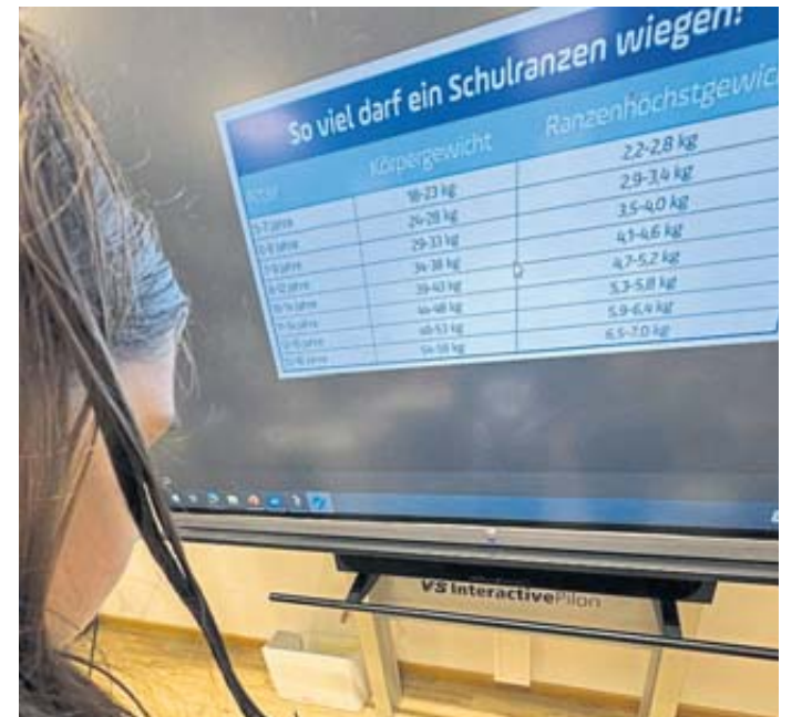
Schüler des Jahrgangs 5 der Henry-Harnischfeger-Schule lernen am Methodentag neue Lern- und Arbeitstechniken kennen.