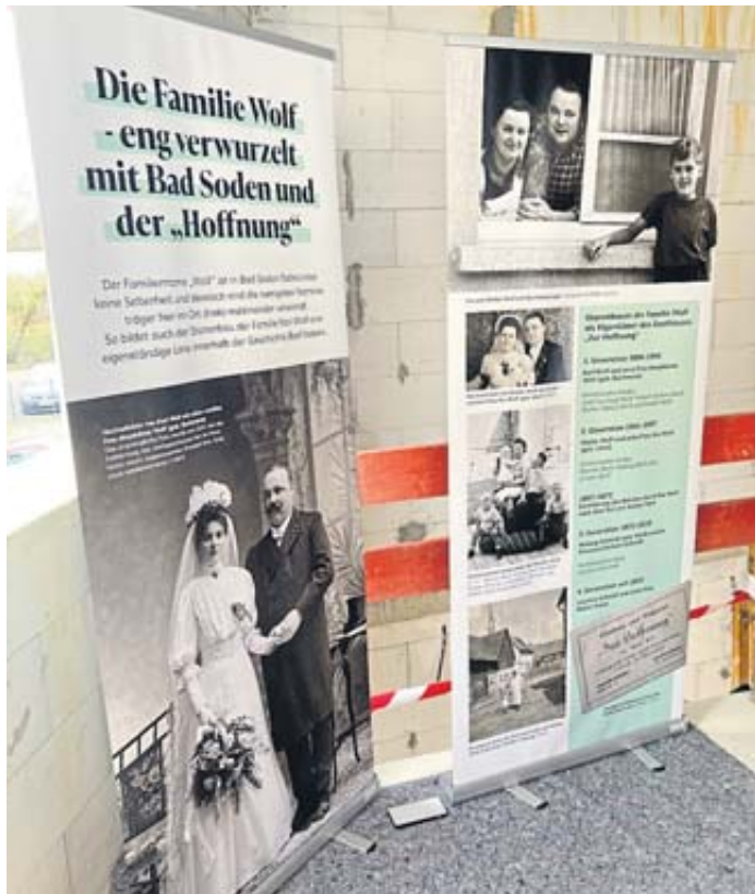
Im Rohbau aufgestellte Tafeln ließen die Historie des Gebäudes und die Familiengeschichte der Wolfs lebendig werden.

Die Gäste des Richtfestes, darunter Familie, Nachbarn, Freunde und die bauausführenden Handwerker, Vertreter der städtischen Gremien und von Planungsbüro und Ingenieurbüro hatten ausreichend Gelegenheit bei Pizza und Getränken, den Rohbau zu besichtigen, sich an im Gebäude aufgestellten Tafeln über Historie und Familiengeschichte zu informieren und von der Dachterrasse einen beeindruckenden Blick auf die katholische Kirche St. Laurentius zu genießen. OJ