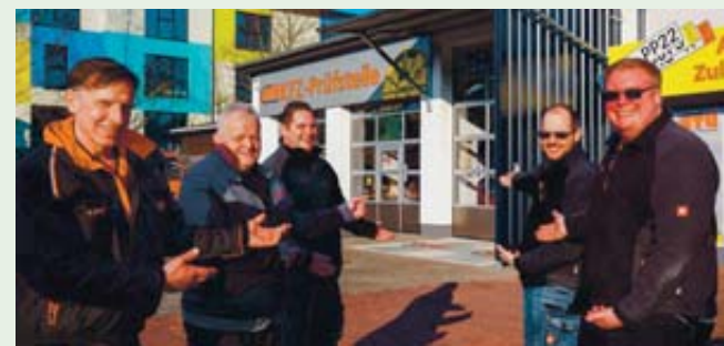
Hereinspaziert: Das Team von GTÜ Bratz und Dein Kennzeichen-Shop richtet die erste WITO-After-Work-Party aus und freut sich auf viele Interessierte.

GTÜ-Bratz, Dein Kennzeichen-Shop Am Elmacker 4, 36318 Schlüchtern