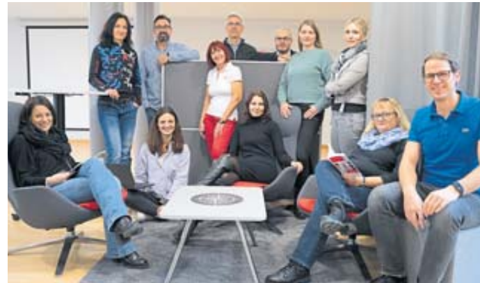
Gut gewappnet für die Fragen der jungen Leute ist das Team der Berufsberatung Fulda.

So komfortabel ist aktuelle die Situation für die Schulabgängerinnen und Schulabgänger in Osthessen: Mehr als 1400 Ausbildungsstellen in über 100 Berufen sind laut Agentur für Arbeit zu besetzen.