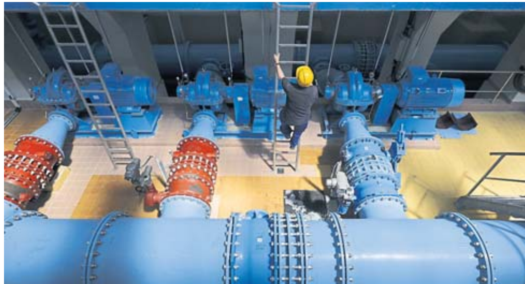
Neue Jobbezeichnung: „Fachkräfte für Wasserversorgungstechnik“, wie hier in einer Wasserversorgungsanlage in Leipzig, heißen in Zukunft „Umwelttechnologien für Wasserversorgung“.

Von der „Fachkraft für Wasserversorgungstechnik“ zu „Umwelttechnologien für Wasserversorgung“, von der „Fachkraft für Abwassertechnik“ zu „Umwelttechnologien für Abwasserbewirtschaftung“: Insgesamt vier Ausbildungsordnungen im Bereich Umwelttechnologie wurden modernisiert.