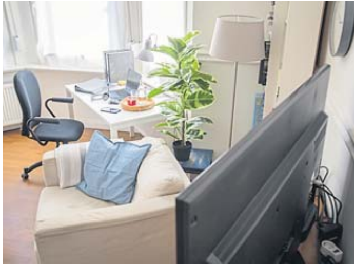
Wer zu Hause lernt und arbeitet, kann die Gemütlichkeit des eigenen Heims während der Arbeitszeit genießen.

Einer vom Bundesinstitut für Berufsbildung (BIBB) verabschiedeten Empfehlung zufolge soll die duale Berufsausbildung zwar grundsätzlich in Präsenz stattfinden. Mobiles Arbeiten könne aber als Ergänzung in der Berufsausbildung im Sinne der