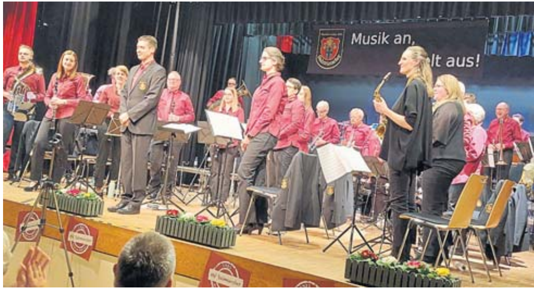
Das Stammorchester des Musikvereins Salmünster begeisterte mit seinem Jahreskonzert.