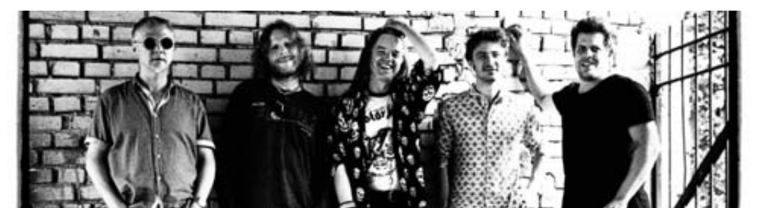
The Great Lakes gastieren im Löwenkeller in Schlüchtern.

AC/DC, Led Zeppelin oder Tom Petty werden an diesem Abend mit großer Stimme und unbändiger Spielfreude vorgetragen. BWB