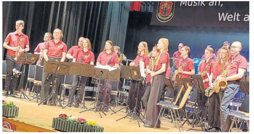
Herzlichen Applaus gab es für das gemeinsame Jugendorchester der Musikvereine Salmünster und Cäcilia Bad Soden.