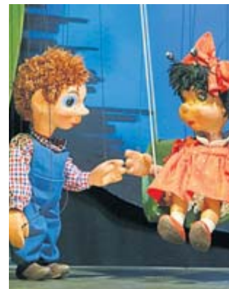
„Käferchen Klärchen“ ist ein wundervolles Kinderstück voller Fantasie und Abenteuer.