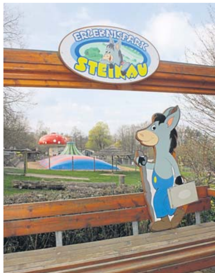
Parkmaskottchen Erli begrüßt am Wochenende zum Saisonstart die ersten Gäste im Erlebnispark. Dann werden das Kettenkarussell „Fliegenpilz“ und auch das große Hüpfkissen wieder viele Kinder begeistern.