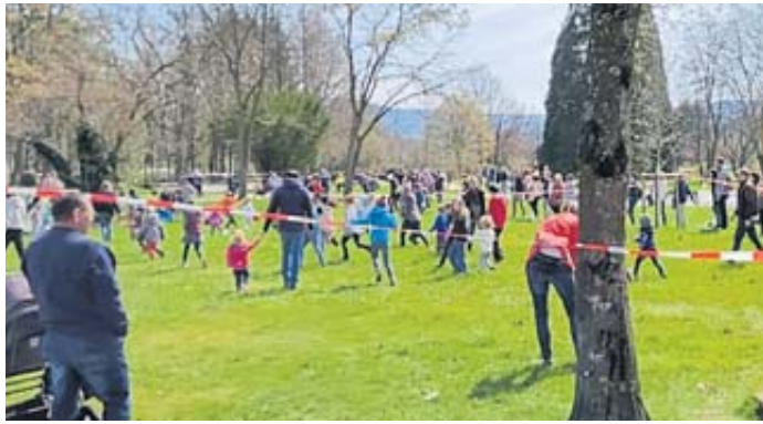
Ostereiersuche im Kurpark: Viele Kinder, Eier und Hasen sowie jede Menge Spaß bei der Suche.

Der Bereich des Wellenfreibades der Spessart Therme steht für die ersten 15 Minuten ausschließlich für die