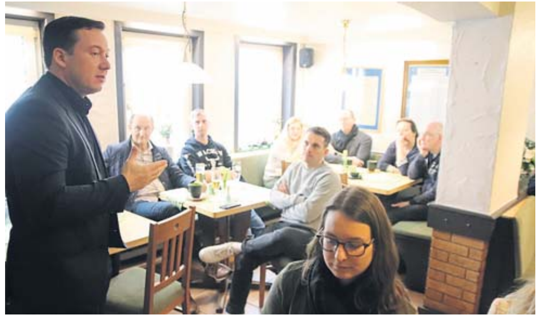
Rund 30 Gäste hatten sich zu dem Fröhschoppen eingefunden.