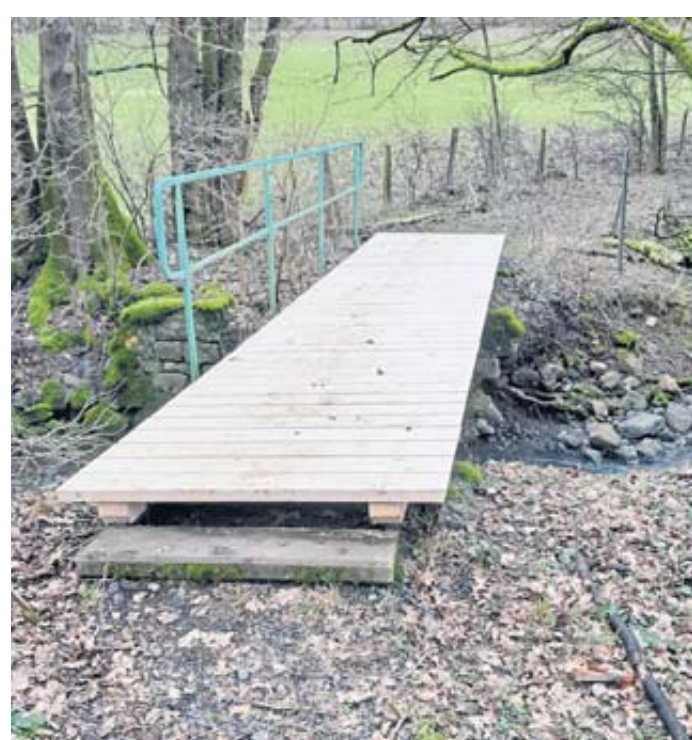
Frisch saniert präsentiert sich der Holzsteg über den Ulmbach bei Marborn.