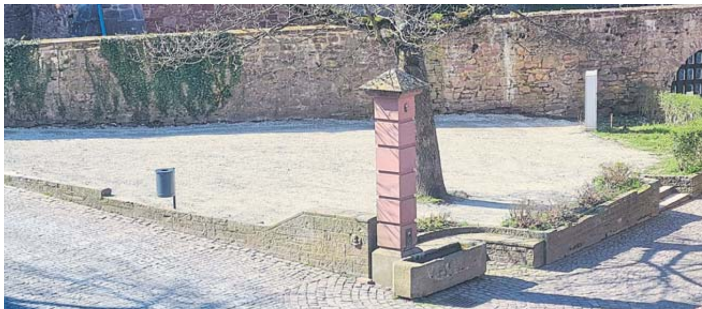
Die Aufnahme zeigt den Kumpen in Steinau – zentraler Ort, der Schloss, Rathaus, Katharinenkirche und Marstall mit Theatrium verbindet. Auf dem Kumpen soll mit Mitteln aus Spessart regional ein neuer Kulturkiosk errichtet werden.

Seit dem Abriss des alten Kiosks sei deutlich spürbar, dass ein solches Angebot fehle. Inzwischen hat die Stadt den Container bestellt und es läuft die Ausschreibung für einen Pächter. Mit der Inbetriebnahme des Kiosks wird im Laufe des Sommers gerechnet. BWB