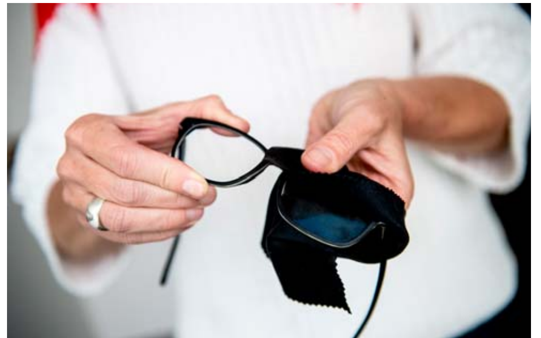
Besser als ein Taschentuch eignet sich zum Putzen der Brille ein sauberes Mikrofasertuch.

Wenn Sie diese vier Dinge beim Brille putzen lassen, sind Sie auf der sicheren Seite: Fehler 1: Brille mit rückfettendem Spülmittel reinigen. Ein, zwei Tropfen Spülmittel killen jeden Fettfinger-Abdruck auf der Brille. Am