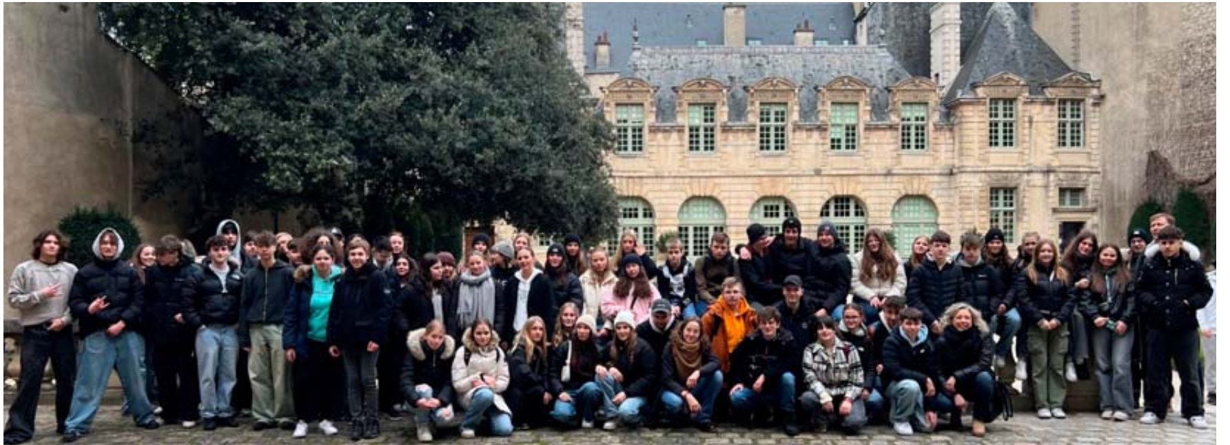
Die Stadtschüler aus Schlüchtern verbrachten mit ihren Lehrkräften vier ereignisreiche Tage in Paris.

SINNTAL – Alle zwölf Feuerwehren der Gemeinde Sinntal kommen am nächsten Freitag, 26. April, zur gemeinsamen Jahreshauptversammlung in Mottgers zusammen. Neben den Berichten des Gemeindebrandinspektors und der Gemeindejugendfeuerwehrwartin sowie der Ansprache des Bürgermeisters werden ausgedehnte Wehrführer verabschiedet und neue Wehrführer ernannt. Zudem werden langjährige Aktive geehrt. Die Versammlung beginnt um 19 Uhr im Mottgerser Feuerwehrhaus. FGW