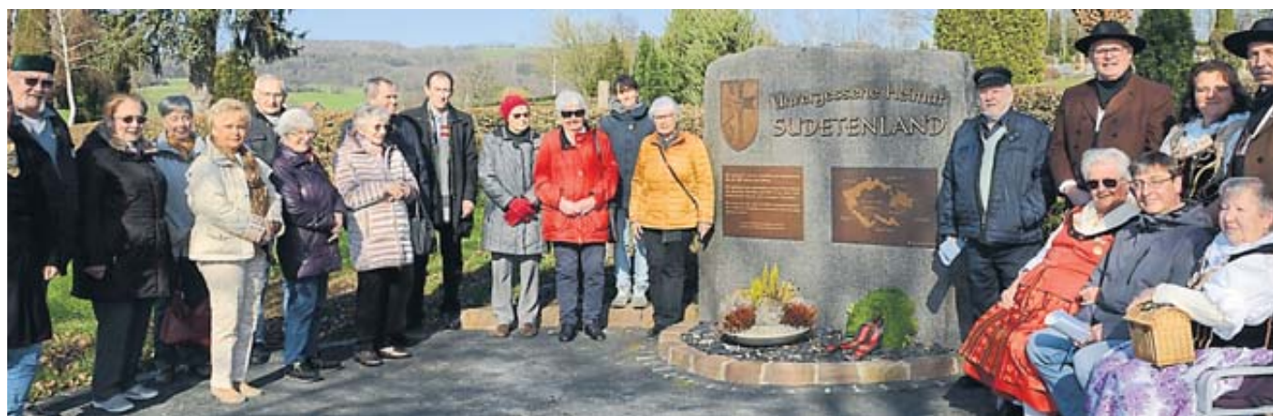
Die Aufnahme zeigt die Teilnehmer des Märzgedenkens der sudetendeutschen Landsmannschaft in Schlüchtern.

ELM – Die Jahreshauptversammlung der Jagdgenossenschaft Elm findet am kommenden Samstag, 27. April, im Gasthaus Zum Saukoppstübchen statt. Auf der Tagesordnung steht unter anderem der Bericht des Jagdpächters. Die Veranstaltung beginnt um 20 Uhr. BWB