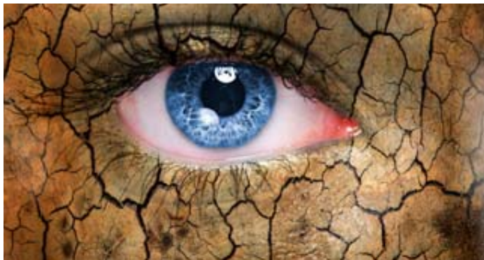
Das trockene Auge ist ein Volksleiden.

STERBFRITZ – Zu den üblichen Symptomen des trockenen Auges zählen brennende, juckende, gerötete, tränende und müde Augen, Sandkorngefühl, verklebte Augen und Lidränder, lichtempfindliche Augen bis zu Sehstörungen am Tag und vor allem in der Dämmerung. Die Ursachen sind vielfältig. Von gewissen Erkrankungen und Medikationen bis zur Computerarbeit lässt sich die Ursache des trockenen Auges finden. Auch eine chronische Lidrandentzündung ist hierfür verantwortlich. Man unterscheidet zwischen einer zu niedrigen Tränenproduktion oder einer zu hohen Verdunstung des Tränenfilms. „Mit unserer Tränenfilmanalyse lässt sich die Art des trockenen