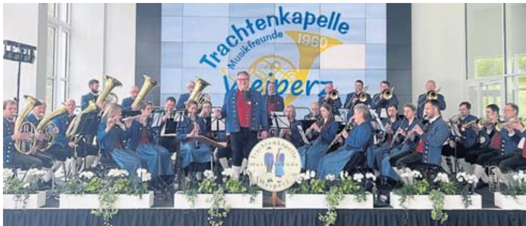
Die Trachtenkapelle Musikfreunde Weiperz freut sich auf ihre Auftritte.