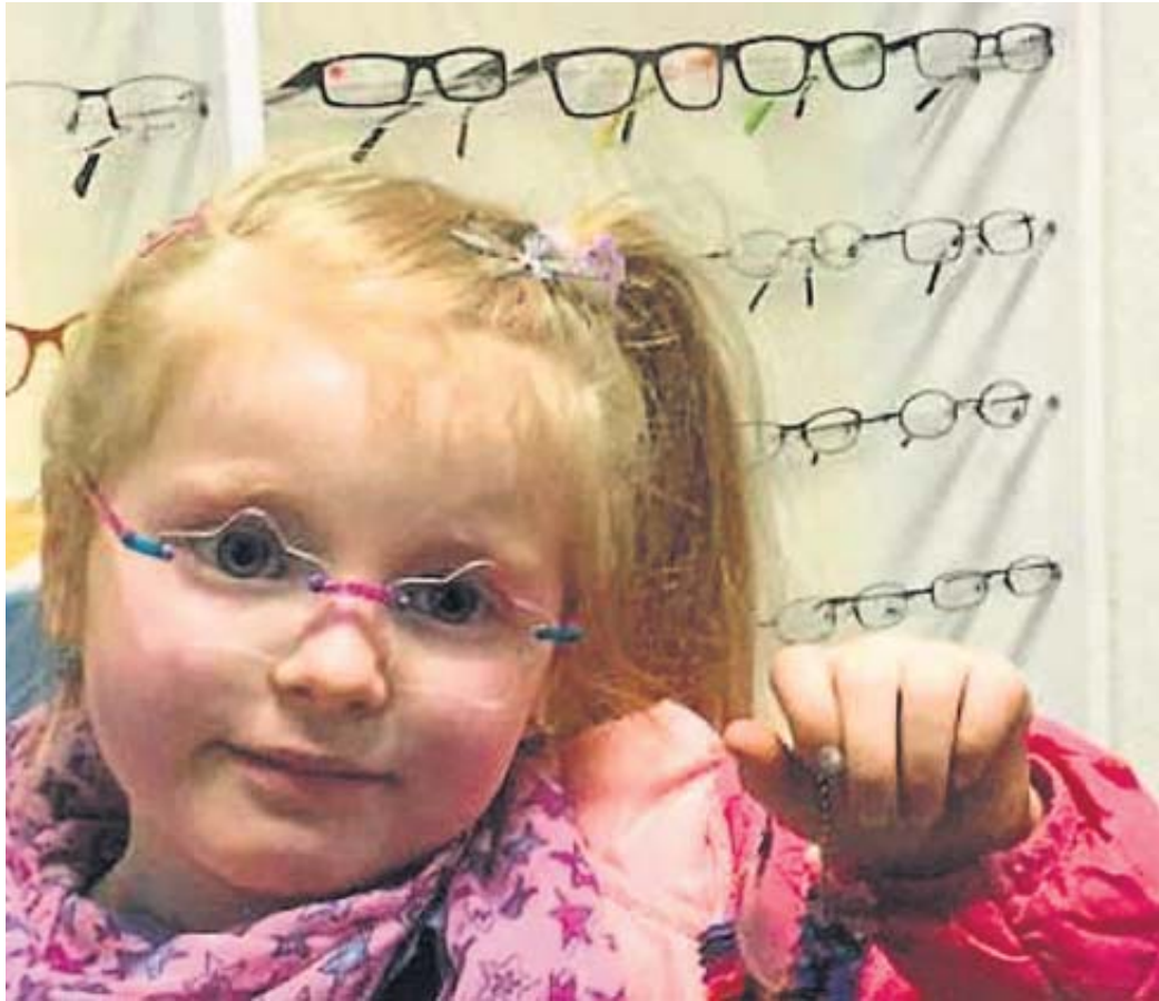
Ein süßer Hingucker: Für Kinderbrillen gibt es Gläser in Form von Sternen.

Weitere Informationen und ausführliche Beratung erhalten Interessierte im Fachgeschäft Optik Stollfuss, Obertorstraße 30, Schlüchtern, erreichbar unter: (06661) 2269 oder per E-Mail an: optik-stollfuss.de. BWB