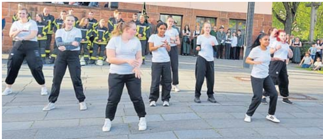
Die Tanzgruppe des TV Soden-Stolzenberg „Wild fires“ präsentierte einen rhythmischen Tanz unter dem Maibaum.

Bestens bewirte vom Schützenverein Stolzenberg genossen die Besucher den milden Frühlingsabend. PK