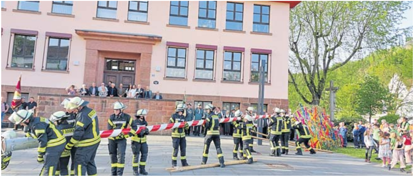
Die Feuerwehrleute brachten den Maibaum zur Grundschule an der Salz.

Nach uralter Tradition symbolisiere der Maibaum Stärke, Wachstum, Frucht-