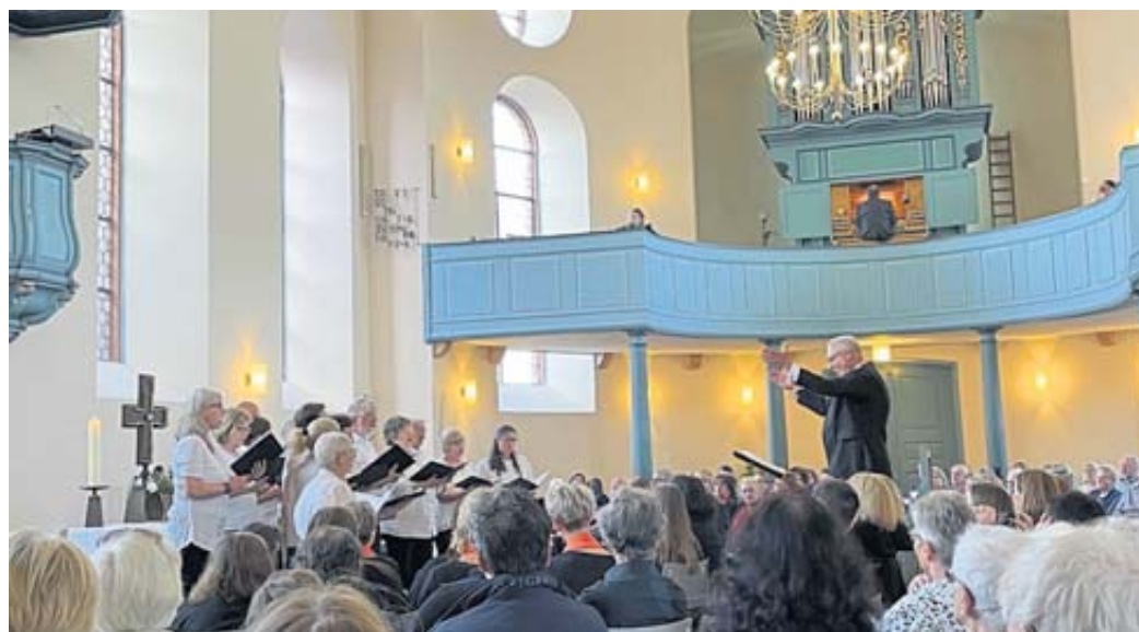
Der Kirchenchor Steinau ist einer der Akteure beim „Tag für die Musik“.

Im Anschluss an die musikalischen Beiträge gibt es Knabberien und einen kleinen Umtrunk. Das Konzert verfolgt außerdem noch ein besonderes Ziel: Es dient als Benefiz-Konzert zugunsten der bald fälligen Generalüberholung der Orgel der Reinhardskirche. Die Orgel – die in diesem Jahr 50 Jahre alt wird – soll nach Beschluss des Kirchenvorstands in absehbarer