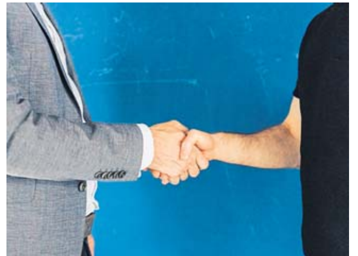
Erst mal kennenlernen: Laut einer Umfrage halten 42 Prozent der Befragten eine Probezeit von drei Monaten für angemessen.

Die gesetzliche Probezeit darf maximal sechs Monate dauern. In dieser Zeit können Unternehmen und Arbeitnehmer prüfen, ob sie künftig zusammenarbeiten wollen. Aber wie lang sollte sie sein? Und welche Seite profitiert stärker?