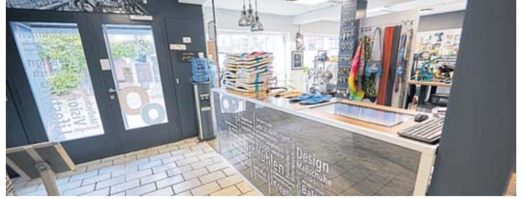
Für alle Fragen rund um das Orthopädieschuh-Handwerk ist der Laden von Footopia in der Brüder-Grimm-Straße in Steinau die richtige Adresse.

Nichtsdestotrotz sind wir froh, dass dieser Stein so langsam ins Rollen gebracht wird.