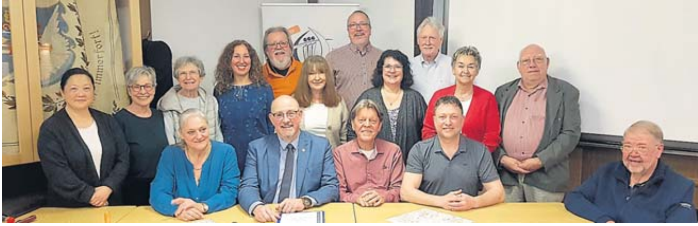
Der neu gewählte Vorstand des Gesangvereins Liederkrantz Bad Soden-Salmünster.