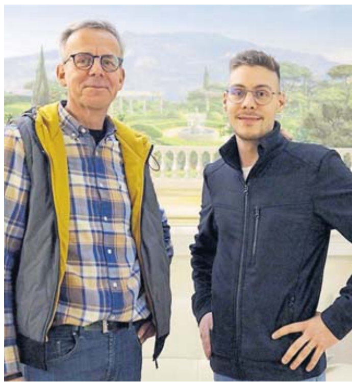
Zwei Generationen der Firma Dieter Baudekoration freuen sich auf den Besuch von Interessierten bei der morgigen Aktion „Wir zeigen es allen....“

REGION – Seit 1905 ist die Firma Dieter Baudekoration in der Handwerksrolle eingetragen. „117 Jahre sind vergangen, in denen unser Familienbetrieb den Herausforderungen einer Firma bestehen musste. Im Jahr 1999 haben wir uns mit dem Thema „Spanndecken“ befasst, das uns seit dieser Zeit nicht mehr loslässt. In zig Privathaushalten verschönern wir Decken und Wandflächen ohne großen Schmutz und Aufwand. Das ist einer der Hauptvorteile von Spanndecken. Zeitersparnis und nahezu staubfrei. Mit hochglänzenden und matten Foliendecken ist bei Spanndecken noch lange nicht Schluss. Mit textilen Decken, Akustikmaterial und bedruckten Decken kann das Thema unendlich ausgebaut werden. Unsere Akustikspanndecken konnten wir schon in großen Schulen und Kindergärten, Turnhallen, Konferenzräumen sowie Großraumbüros