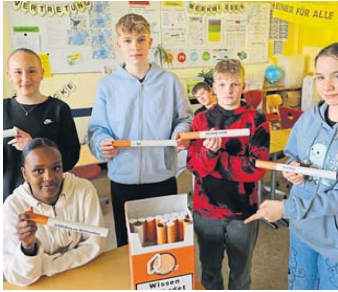
Schülerinnen und Schüler des Jahrgangs 7 tauschen ihren Kenntnisstand zum Thema Rauchen aus.