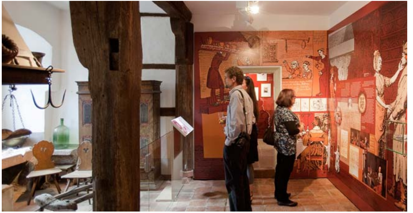
Ein Besuch im Museum Brüder-Grimm-Haus darf selbstverständlich nicht fehlen.

Weitere Informationen gibt es im Verkehrsbüro Steinau, erreichbar unter der Telefonnummer (06663) 973 88. BwB