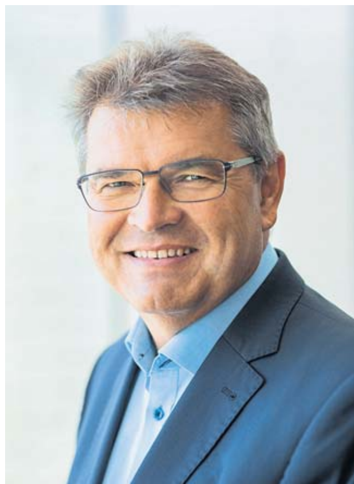
Arbeitsagentur-Chef Waldemar Dombrowski

Die Betriebe haben ihre Anforderungen zumeist stark herabgesetzt. Heute ist man in vielen Bereichen bereit, Abstriche beim Schulabschluss zu machen, wenn Interesse und Motivation gegeben sind.