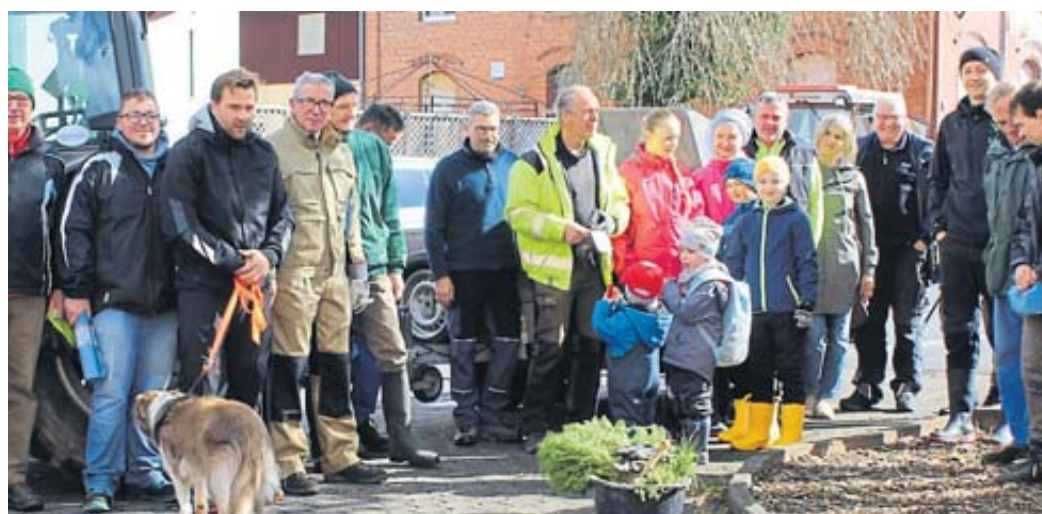
Sterbfritz putzt sich raus

Besucher des Wächtersbacher Kunsthandwerkermarktes können ihre Fahrzeuge kostenlos auf dem Gelände der ehemaligen Brauerei in der Wittgenborner Straße parken. BWB