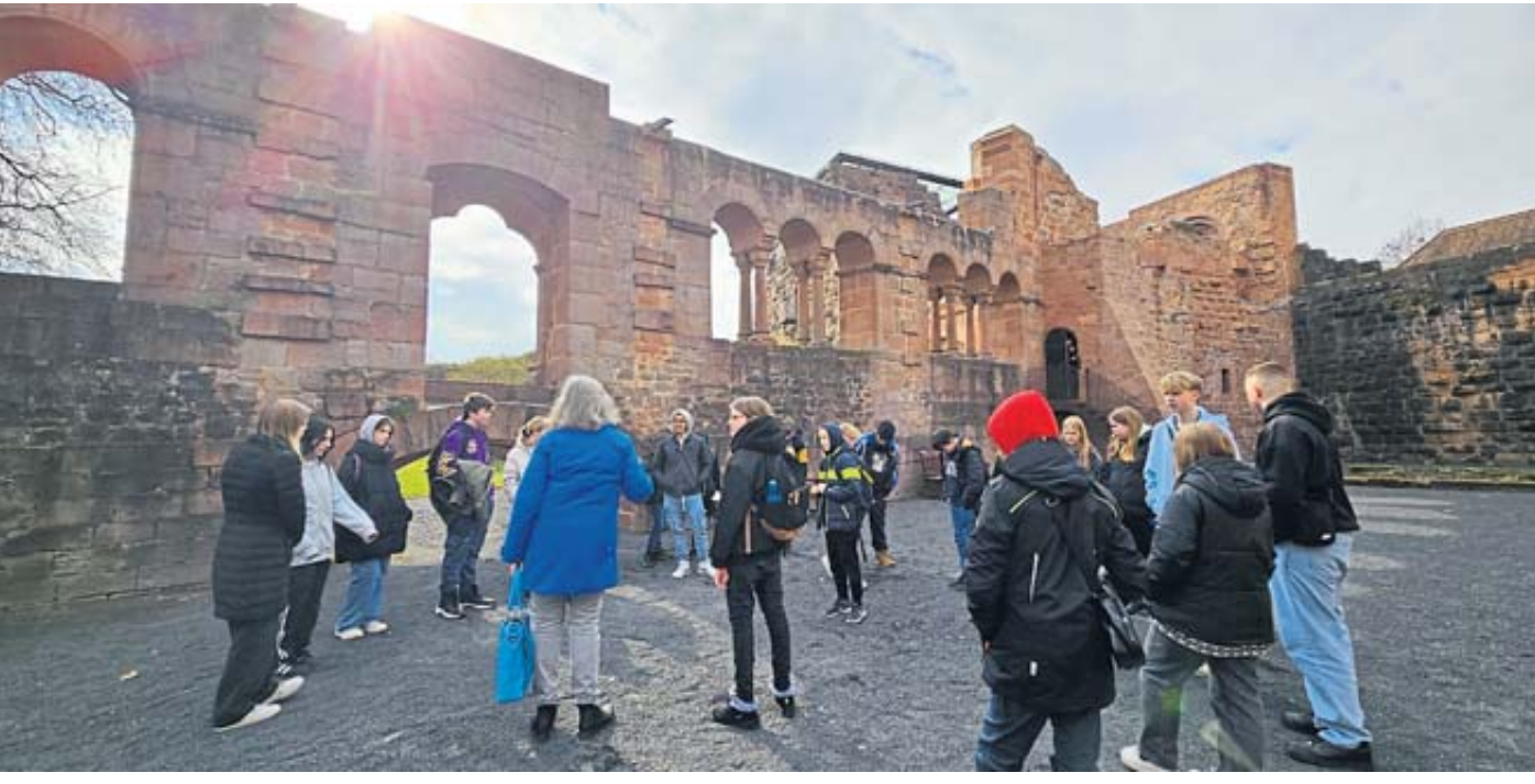
Die Größe der Kaiserpfalz in Gelnhausen wurde für die Schülerinnen und Schüler erst im Inneren der beeindruckenden Anlage sichtbar.