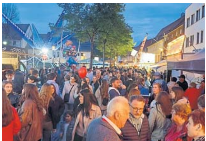
Auch in den Abendstunden war der Helle Markt ein beliebter Treffpunkt für Alt und Jung.