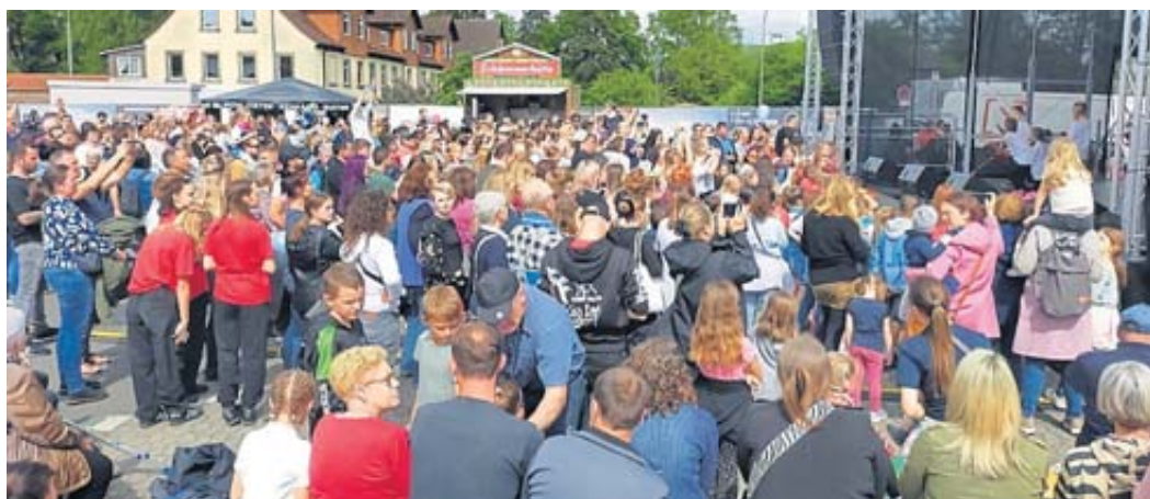
Dicht umlagert war die Bühne am Untertor.

Öffnungszeiten: Mo. - Fr. 9:00-20:00 Uhr *Neu*Neu* Samstag 8:30-20:00 Uhr Angebote gültig vom 11.05. - 17.05.2024 Höbäckerweg 24 - 36381 Schlüchtern