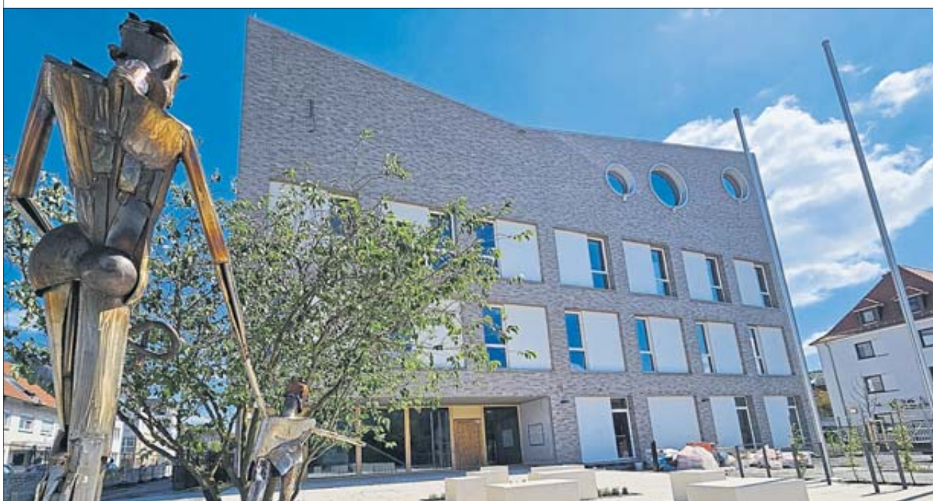
Auch das Kultur- und Begegnungszentrum samt Weitzeldenkmal konnten die Besucher des Helle Markts bestaunen.

Der Helle Markt 2024 ist vorüber. Und man darf festhalten: Es war ein fantastisches Wochenende – sogar das Wetter hat fast immer mitgespielt. Tausende Menschen aus der Region, aber auch aus der Ferne, tummelten sich am Freitag, Samstag und Sonntag in