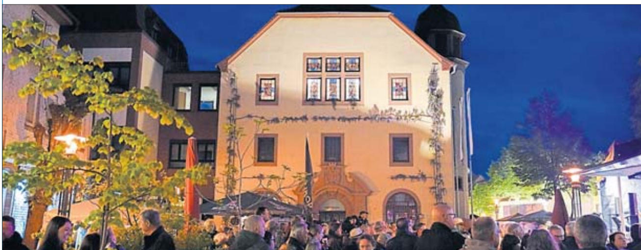
Der Blick auf das Schlichter Rathaus am Ende der prall gefüllten Obertorstraße.