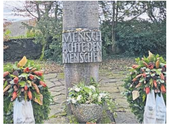
Die Lehre aus Hadamar und der Existenz weiterer Tötungsanstalten wird von der Stele mit der Inschrift „Mensch, achte den Menschen!“ im Kern getroffen.

An einer Stele mit der Inschrift „Mensch, achte den Menschen“ gedachte die Schülergruppe den Opfern. Besonders berührte sie neben dem Aufsuchen der Gaskammer im Keller der Tötungsanstalt die Arbeit mit Biografien: Zwei Brüder, die im gleichen Alter wie sie selbst waren, wurden kurz nacheinander getötet. Die Mutter der beiden wollte wegen des aufkommenden Zweifels nach dem Tod eines Sohnes den anderen nach Hause holen. Dies