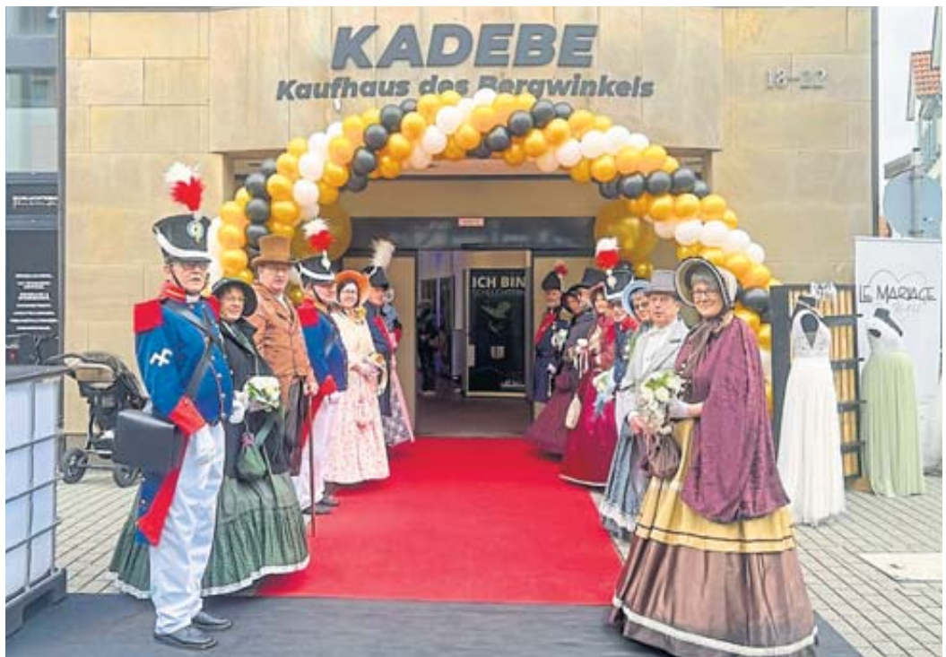
Die Biedermeiergruppe sowie die historische Bürgergarde begrüßten die Interessierten zum Bürgertalk im Kaufhaus des Bergwinkels, kurz KaDeBe.

Dingen.“ Rau nannte den Weg, den die Verantwortlichen in der Stadt Schlüchtern bezüglich des Langer-Areals gegangen seien, alternativlos. Er teilte mit, dass die Bergwinkelmétropole seit einer