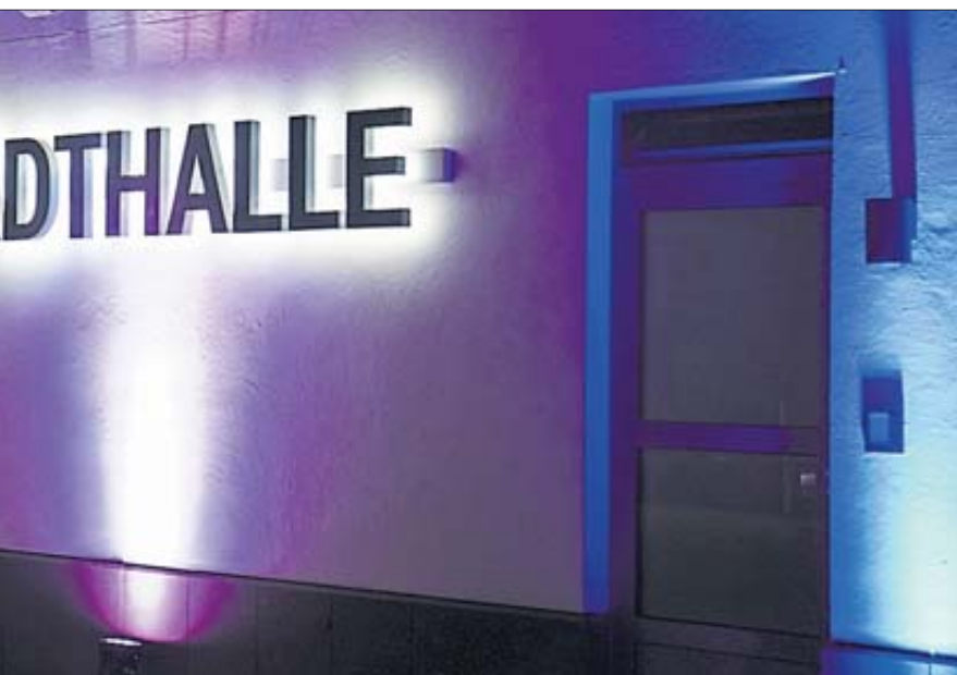
hier die Stadthalle.