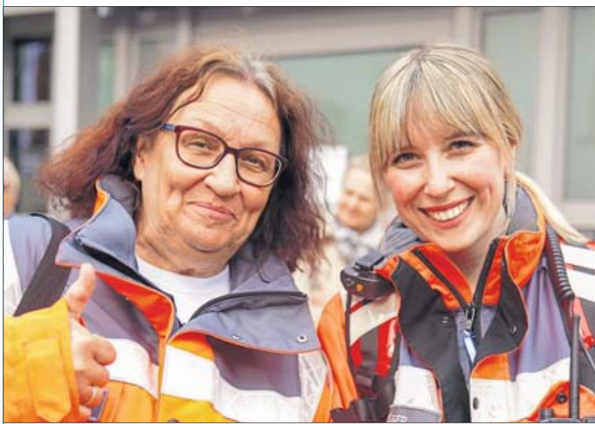
Ohne sie geht nichts: die fleißigen Helferinnen und Helfer vom Deutschen Roten Kreuz.