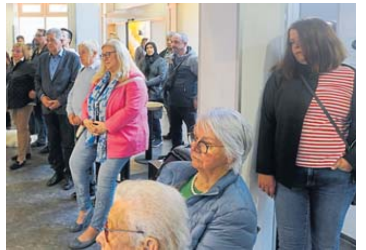
Interessierte Zuhörer waren der Einladung zum Bürgertalk gefolgt und nutzen die Gelegenheit, Fragen zu stellen.