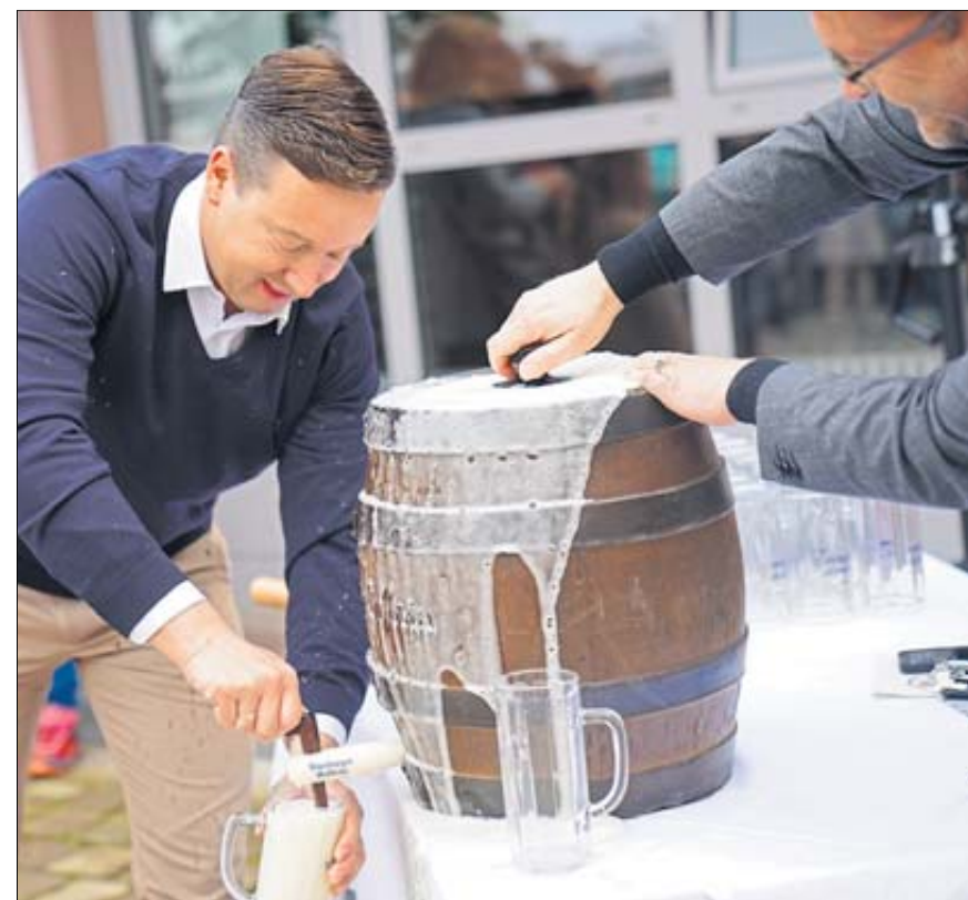
Der Fassanstich am Freitagabend gestaltete sich etwas schwierig, ...