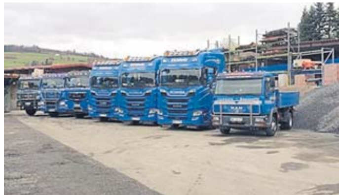
In Reih und Glied: der Fuhrpark Baustoffe-Fuhrbetrieb 2023.