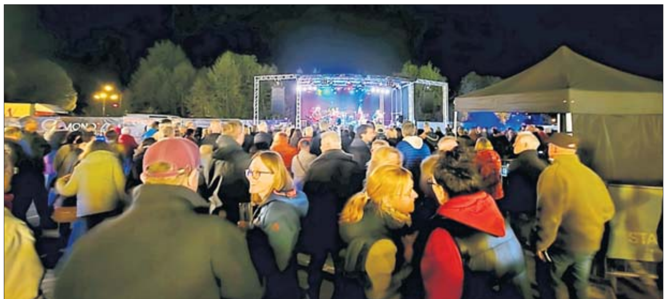
Zahlreiche Bands sorgten für gute Stimmung auf dem Helle Markt, ob auf der Bühne vor der Gaststätte Hausmann oder hier auf der großen Bühne auf dem Untertor-Parkplatz.