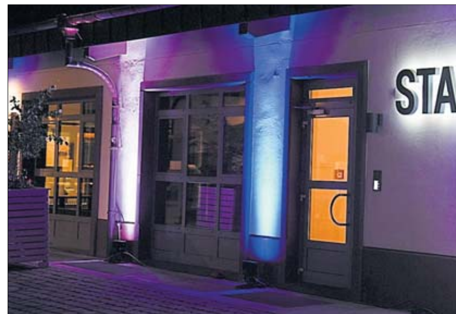
Auch nachts konnte sich der Helle Markt sehen lassen. Einige Gebäude wurden besonders illuminiert, wie hier.