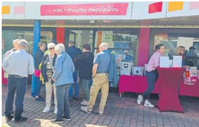
Viel Andrang herrschte bei Zieglers Reisewelt.

Für den Tag der offenen Türen hatten sich die Unternehmen einiges einfallen lassen. Überall standen Mitarbeiter für umfangreiche Informationen bereit. Ausstellungen, Workshops und Verkostungen gaben interessante Einblicke in die Vielfalt von Dienstleistung, Handel und Gewerbe in der Kurstadt. Gewinnspiele lockten mit netten Preisen, und die Kunden