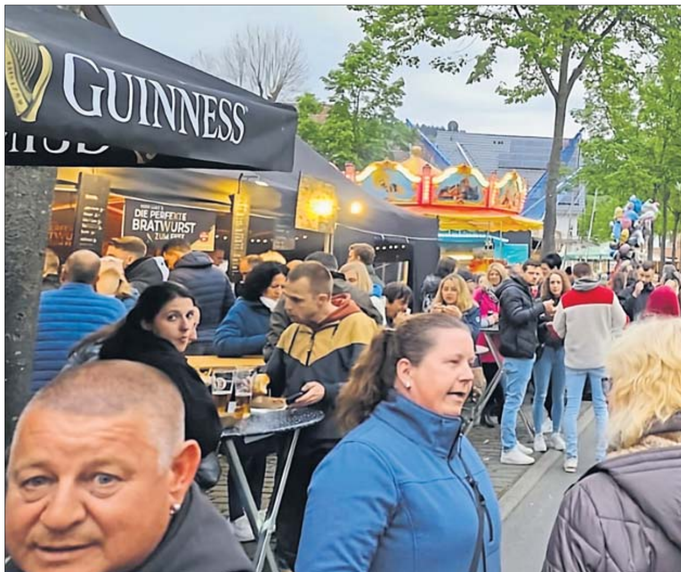
In der Straße „Unter den Linden“ war am Helle Markt immer etwas los.