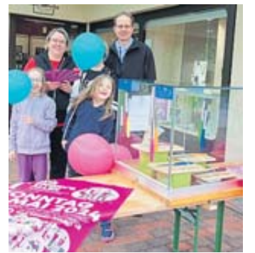
Juwelier Uhren Wolf stellte zum 50-jährigen Bestehen der Gesamtstadt Brettchen und Messer mit entsprechendem Motiv vor.

Die Veranstaltung „Wir zeigen's allen!“ im Format der