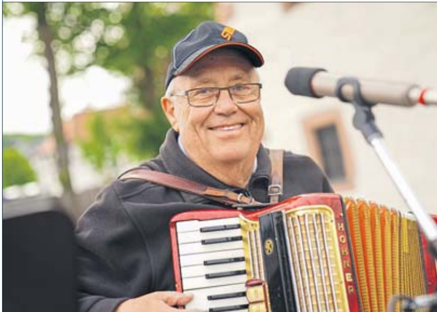
Für gute Stimmung sorgten die Dixie Oldies.