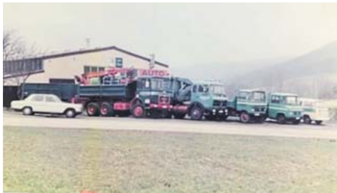
Die Aufnahme aus den 1970er Jahren zeigt den damaligen Fuhrpark Baustoffe.