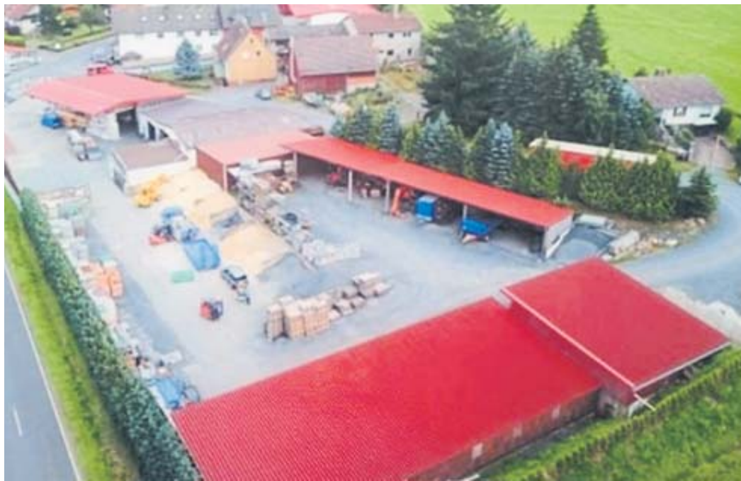
Die Aufnahme entstand vor rund sechs Jahren und zeigt, aus luftigen Höhen, den Lagerplatz für die Baustoffe.

Zum heutigen Zeitpunkt beschäftigt die Firma 14 Mitarbeiter. Im Jahr 2022 wurden neue Büro und Lagerräume erbaut, die im Februar 2023 bezogen wurden. BWB