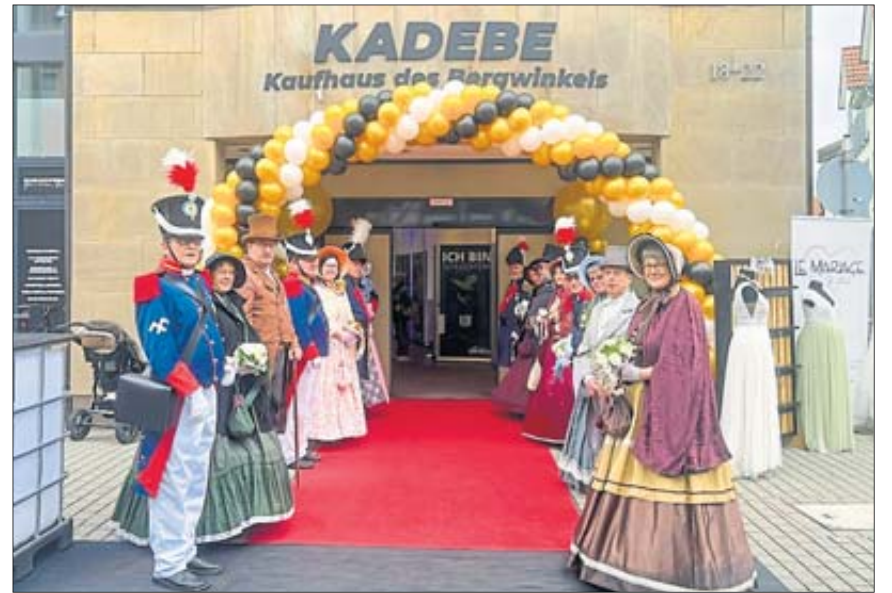
Die Biedermeier-Gruppe und die historische Bürgergarde standen für die Helle-Markt-Besucher Spalier.