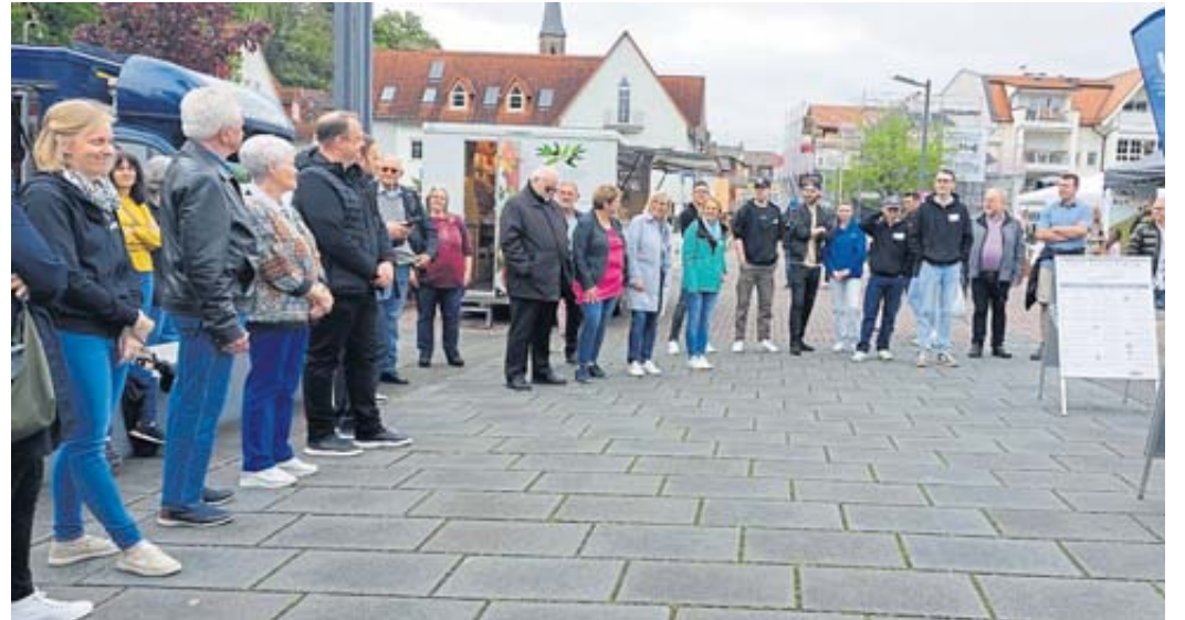
Fröhliche Gesichter bei der Eröffnung der Veranstaltung „Wir zeigen's allen“, denn mehr als 40 Unternehmen gaben Einblicke in ihre Arbeit.