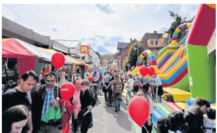
Bestes Frühlingwetter lud zu einem Marktbummel ein.