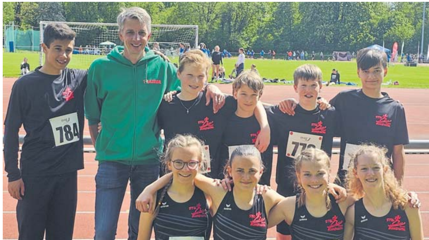
Die Leichtathleten des TV Salmünster wurden in den Staffeln ergänzt durch Starter des TV Wächtersbach.