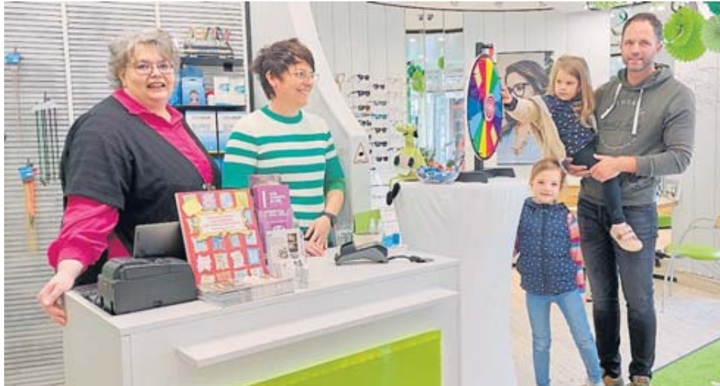
Bei Optik May drehte sich nicht nur ein Glücksrad, sondern das Tragen einer Gleichsichtbrille wurde virtuell simuliert.