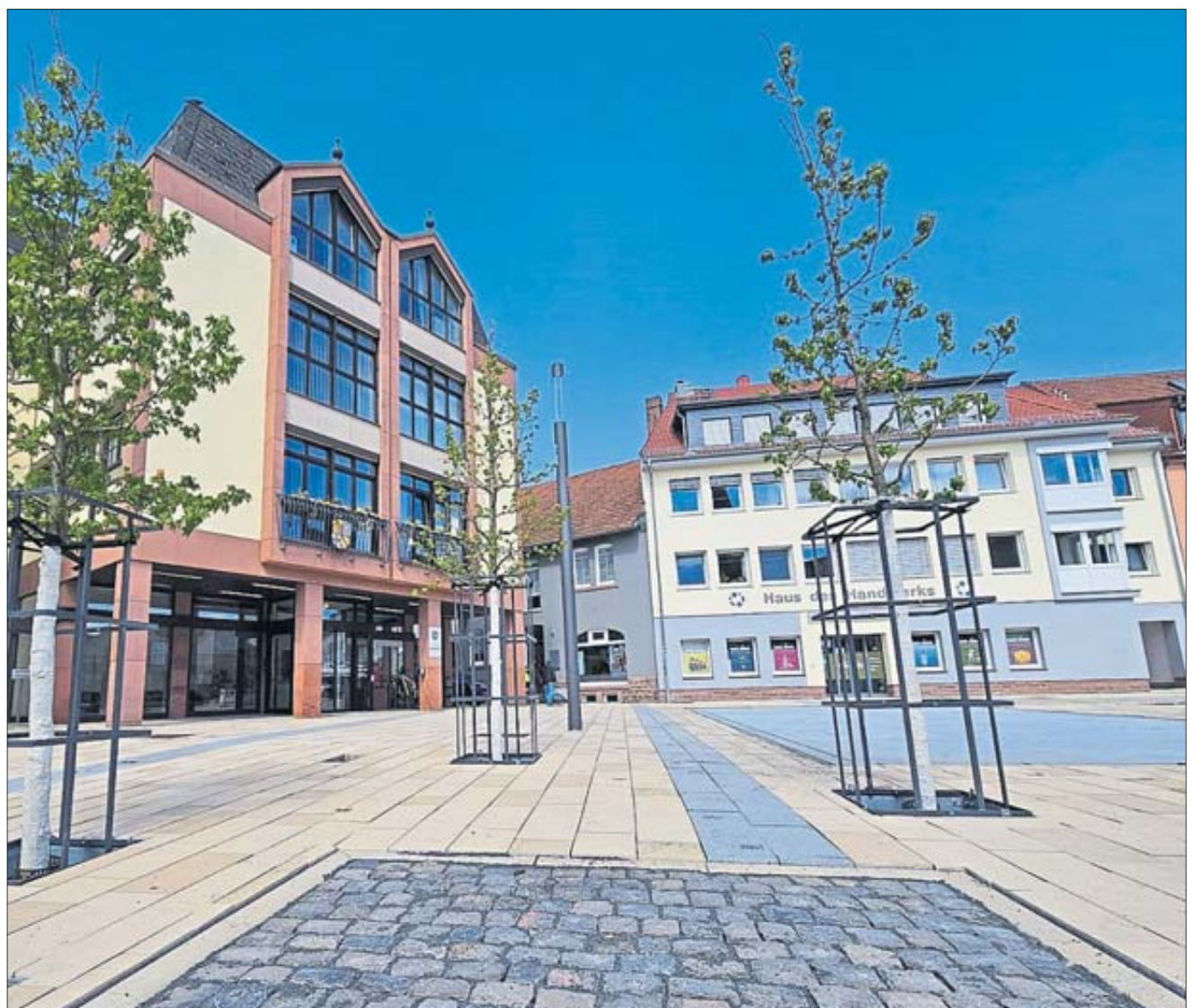
Den neuen Stadtplatz konnten sich die Gäste ebenfalls anschauen. Eröffnung ist am 14. Juni zum EM-Auftaktspiel zwischen Deutschland und Schottland.