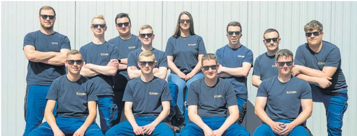
Die derzeitigen Azubis beweisen es: Bei Eckart Hydraulik hat jeder junge Mensch die Chance, die Weichen für eine beruflich erfolgreiche Zukunft zu stellen.

finanzverwaltung-mein-job.de Instagram-Account: Karriere.Steuern.Hessen