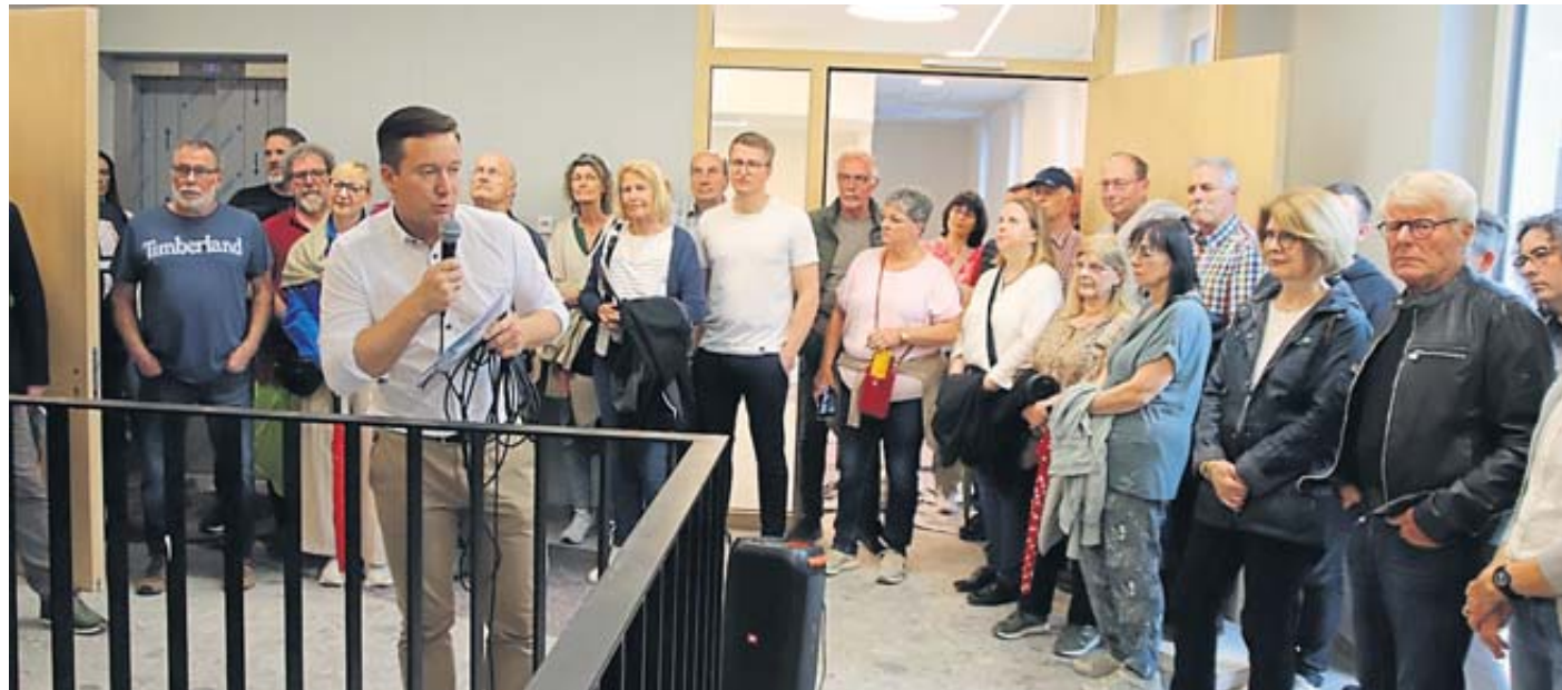
Bürgermeister Matthias Möller gab interessante Einblicke in das neue Herzstück Schlüchterns, das Kultur- und Begegnungszentrum.

Ins Auge sticht sofort das neue Zuhause für die viergruppige Kindertagesstätte Zwergenwiese. Mit 24 Krippenplätzen und 40 Ü3-Plätzen wird ein Meilenstein für die Kindertagesbetreuung in der Stadt gesetzt. Bis zu 25 Mitarbeitende werden hier einen Arbeitsplatz haben.