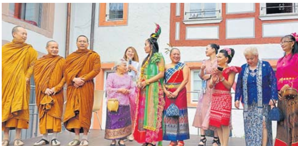
Buddhistische Mönche und thailändische Tänzerinnen vermittelten ihre kulturellen Traditionen.