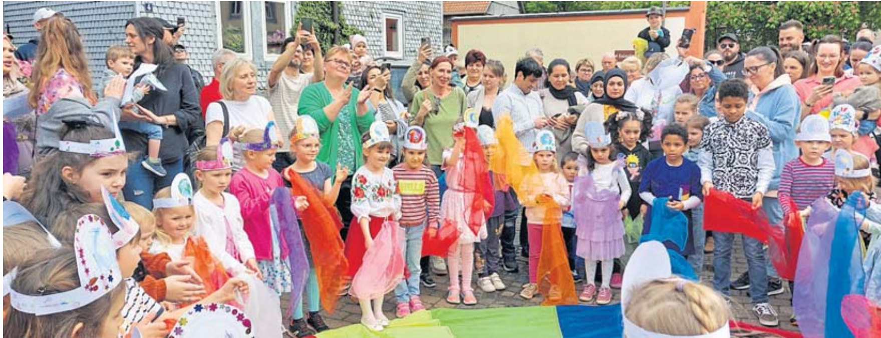
Die Kindergartenkinder verschiedener Tagesstätten trugen passende Lieder vor.