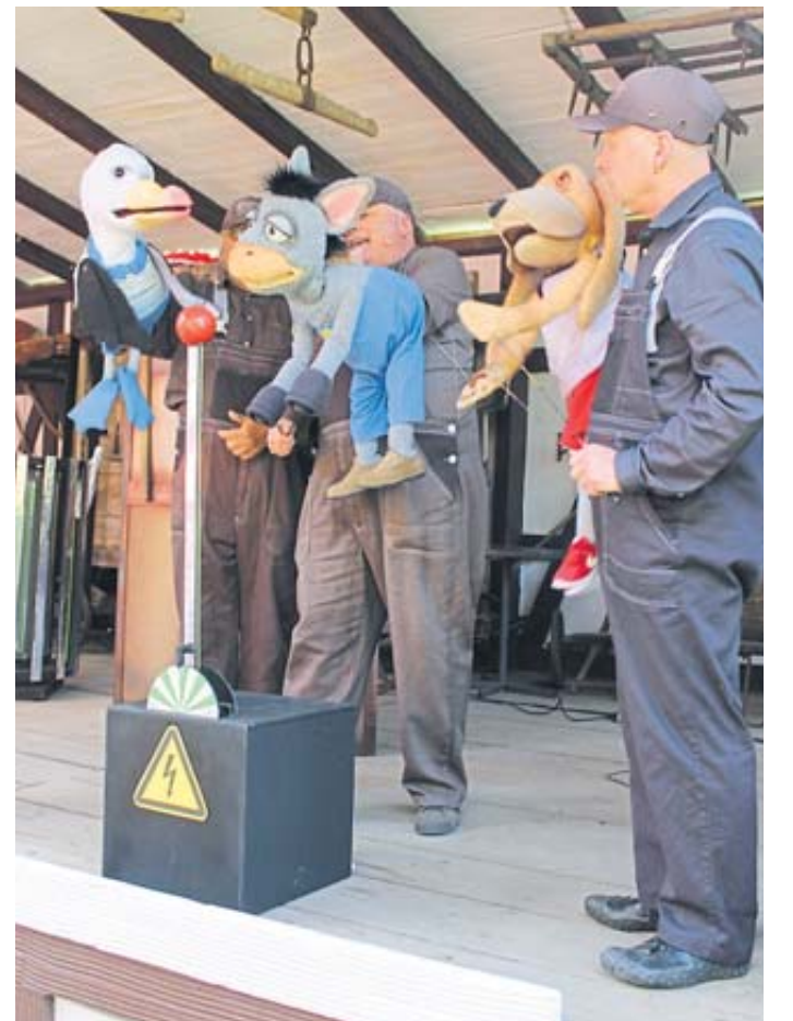
Albi, Erlie und Bert scharen sich um die Zeitmaschine, mit deren Hilfe es gelingt, Erline zu befreien.

Seit 30 Jahren gibt es den Erlebnispark in Steinau und das Musical, vom Team des Theatriers Steinau eigens zum Geburtstag inszeniert, ist die Hauptattraktion in diesem Jahr. Kleine und große Besucher dürfen sich auf viele weitere Aufführungen freuen und mitfeiern, wenn es Erlie und seinen Freunden trickreich gelingt, Erline von ihrem Arbeitsjoch zu befreien und mitzunehmen in den Erlebnispark, wo Schaukeln, Rutschen und Klettergerüste über der Grimm-Stadt Steinau auf die tierischen Kameraden warten.