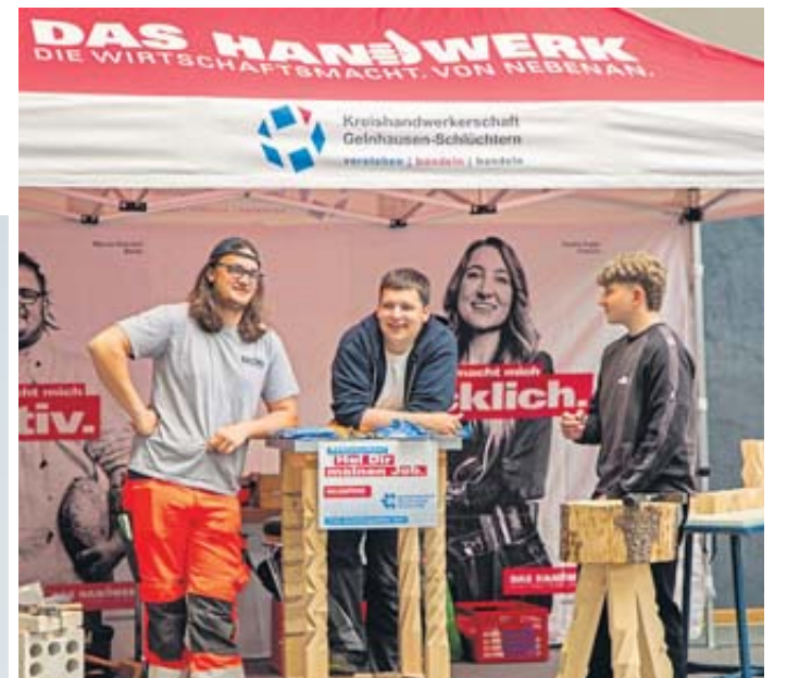
Am Stand der Kreishandwerkerschaft werben jugendliche Azubis für ihren Beruf.

DRK-Ortsverein Steinau sorgt für Ihr Wohlergehen