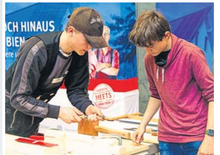
Handwerkliche Fähigkeiten können an verschiedenen Ständen unter Beweis gestellt werden.