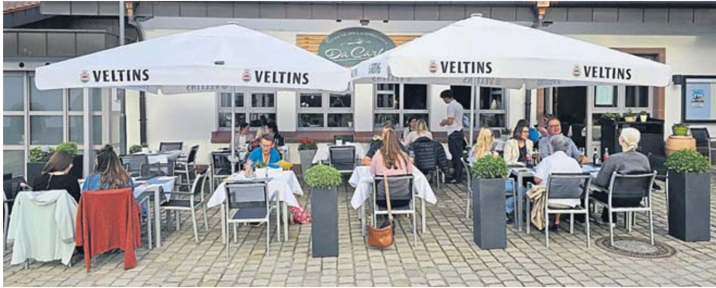
Die stets schön gedeckten Tische am neugestalteten Vorplatz der Stadthalle ziehen viele Gäste direkt magisch an.