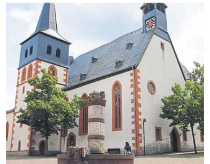
Zum „Kleinen Orgelsommer“ erklingt in der Katharinenkirche die historisch wertvolle Georg-Friedrich-Wagner-Orgel.