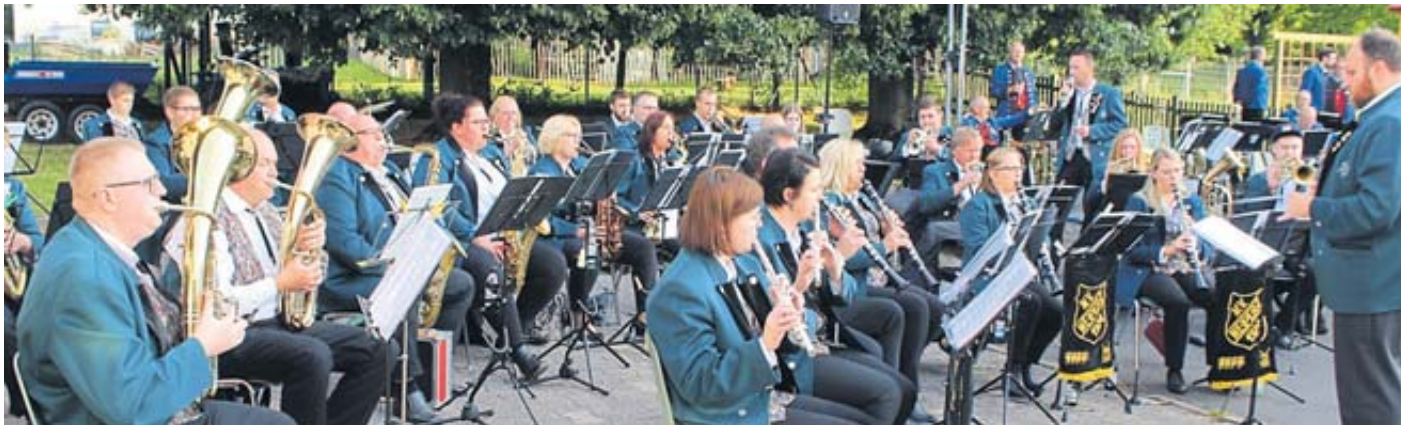
Das Stammorchester des Musikvereins 1924 Weiperz bei einem seiner zahlreichen Auftritte.