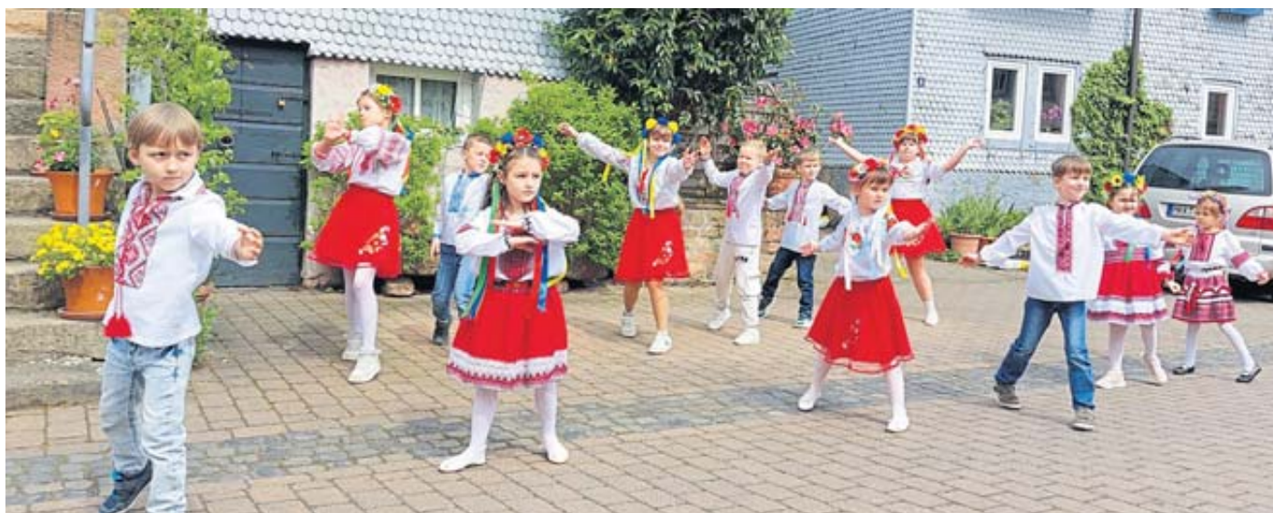
Die ukrainische Kindertanzgruppe begeisterte mit ihren Vorführungen.