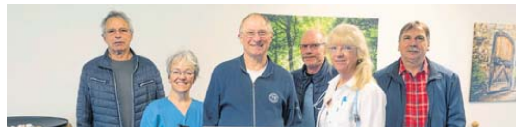
Der Vorstand des Männergesangvereins „Sängerlust“ Seidenroth übergab eine Spende über 500 Euro an das Team der Palliativstation Schlüchtern.