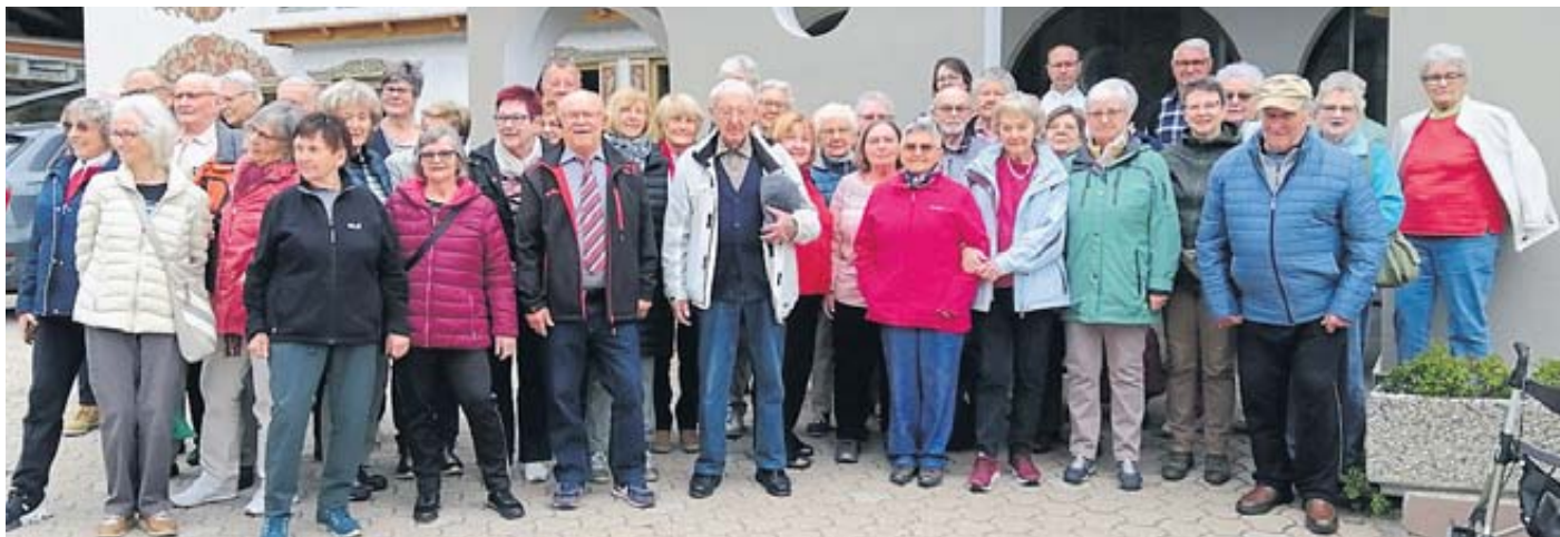
Erlebnisreiche Tage verbrachte die Reisegruppe in Südtirol.

Alle hatten schließlich den Eindruck: Südtirol ist ein wunderschönes, hochinteressantes kultur- und geschichtsträchtiges Land im Norden Italiens, dessen Besuch sich gelohnt hat und immer wieder lohnt. Weil die Nachfrage nach dieser Reise so groß war, findet die gleiche Reise noch einmal im September dieses Jahres statt. BWB