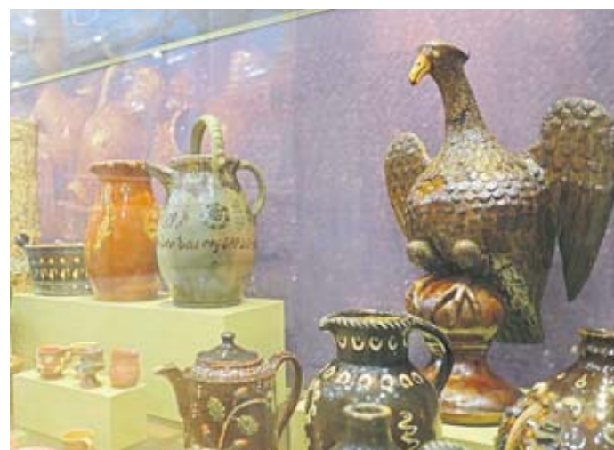
Eine große Auswahl an historischen Töpferwaren ist im Museum Steinau an der Straße zu finden.