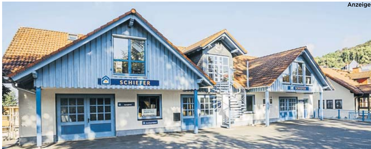
Die Holzwerkstätte Schiefer lädt für den 8. Juni zum Tag der offenen Tür ein.