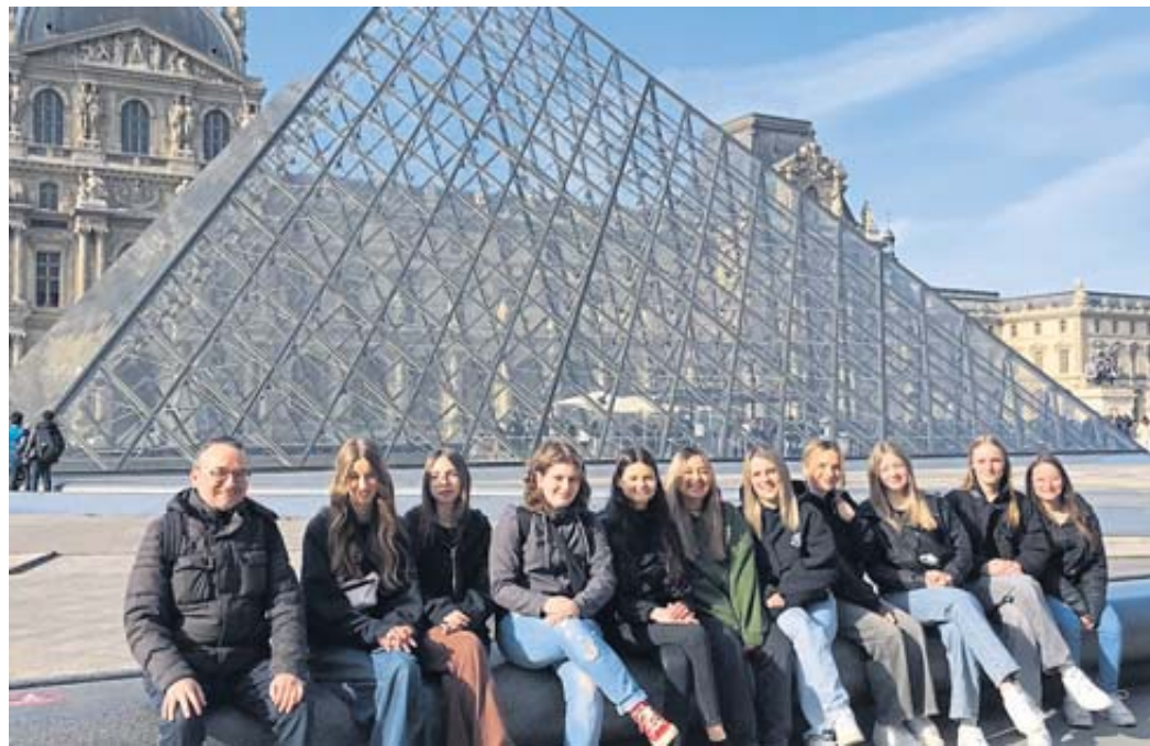
Zehn Schülerinnen und eine Lehrkraft waren unterwegs in Paris.