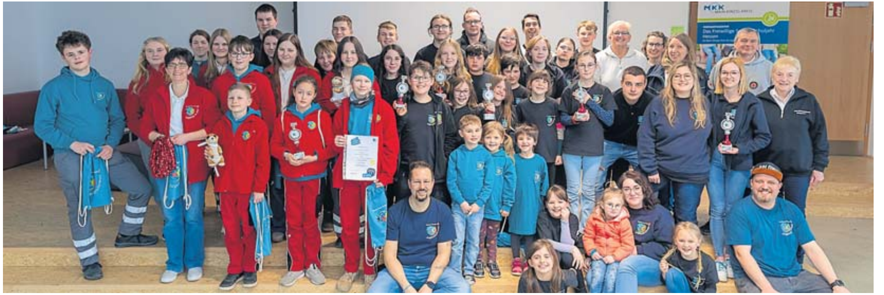
Das Bild zeigt alle Teilnehmer des Jugendrotkreuz-Kreiswettbewerbs mit dem Orga-Team sowie den Betreuern.

STERBFRIEZ – Ladies Night heißt es am Freitag, 7. Juni, von 19 bis 22 Uhr im Laden Nachmalschön in Sterbfritz. Bei einem Glas Prosecco kann in aller Ruhe die Ladenerweiterung erkundet und Schönes geshoppert werden. BWB