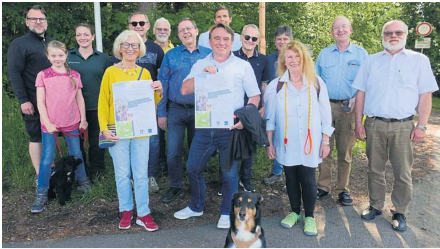
Viele der beteiligten Bürger trafen sich zur Freiluft-Presskonferenz nahe des Krugbaus in Steinau.