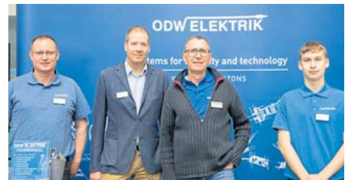
ODW Elektrik war eines von rund 35 Unternehmen, das sich auf der Ausbildungsbörse präsentierte.