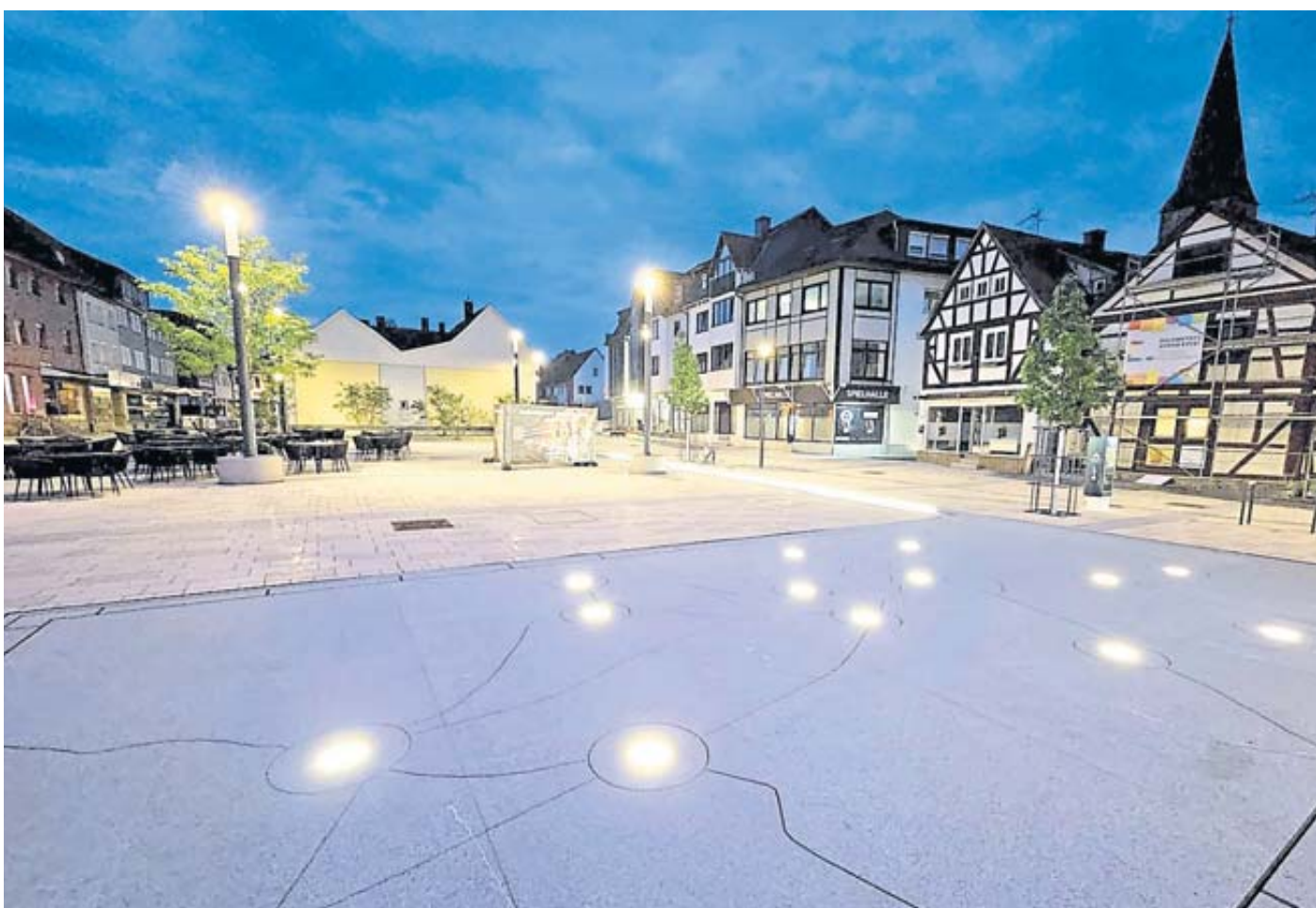
Der Stadtplatz in Schlüchtern ist nicht nur ein multifunktionaler Stadtraum, sondern eine Bühne der Möglichkeiten. Auch in den Abendstunden ist er ein attraktiver Aufenthaltsort.

Der Stadtplatz in Schlüchtern ist nicht nur ein multifunktionaler Stadtraum, sondern eine Bühne der Möglichkeiten. Mit seiner flexiblen Gestaltung und hochwertigen Ausstattung bietet er Raum für alltägliche Aktivitäten, traditionelle Höhepunkte und vielfältige Veranstaltungsformate. Hier können