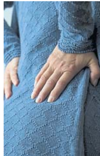
Die Symptome eines Bandscheibenvorfalles sind oft unspezifisch sein.

Kann sich das Immunsystem nur schlecht gegen Krankheitserreger wehren, steigt auch das Risiko für eine Bandscheibenentzündung.