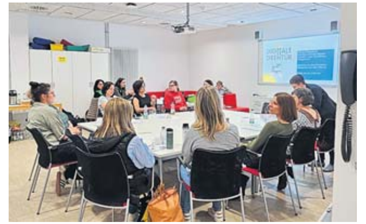
Lehrkräfte aus dem Main-Kinzig-Kreis und Vertreter der Universität Gießen waren zu Gast an der Henry-Harnischfeger-Schule Bad Soden-Salmünster.