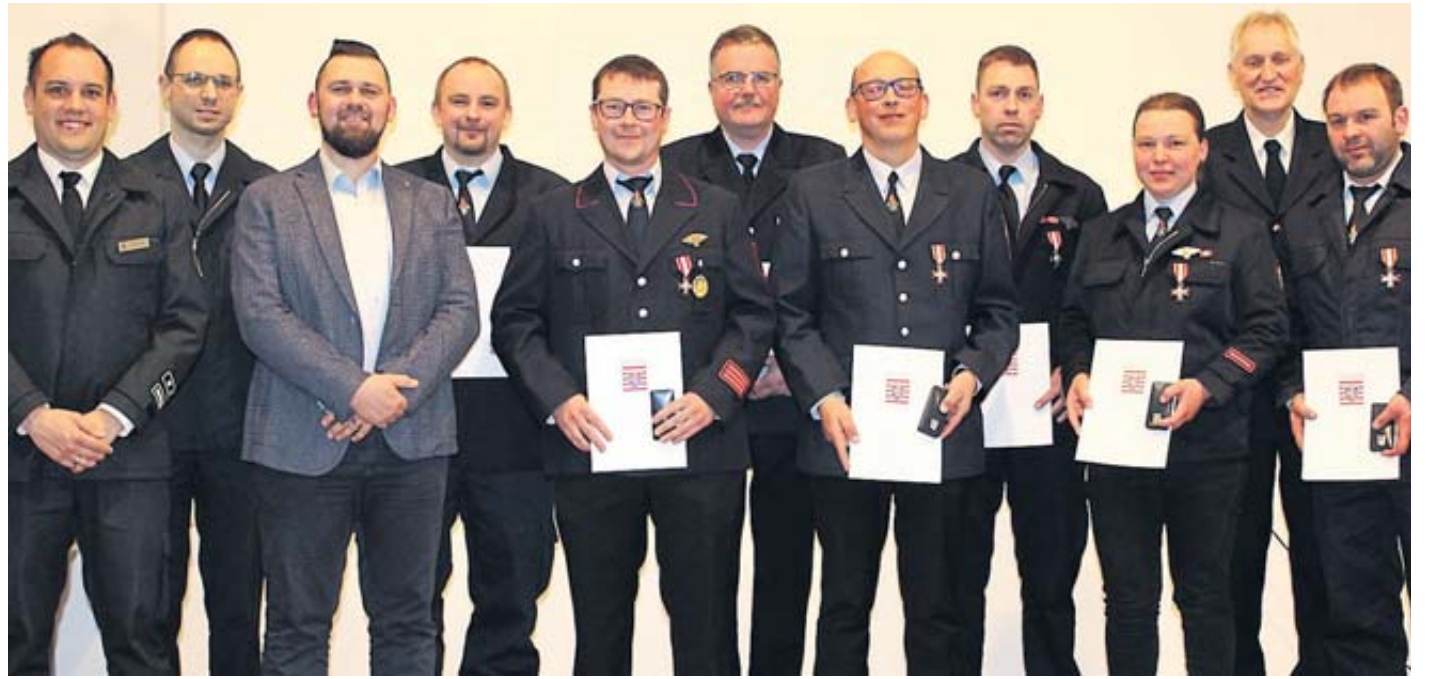
Langjährige Aktive verschiedener Sinntaler Feuerwehren wurden mit dem Silbernen Brandschutzehrenzeichen des Landes Hessen ausgezeichnet.

Zahnarzt: Für Notfälle außerhalb der Sprechzeiten ist der diensthabende Arzt über die Zentrale Notdienst-Nummer für den Bereich Zahnmedizin unter (01805) 607011 zu erfragen.