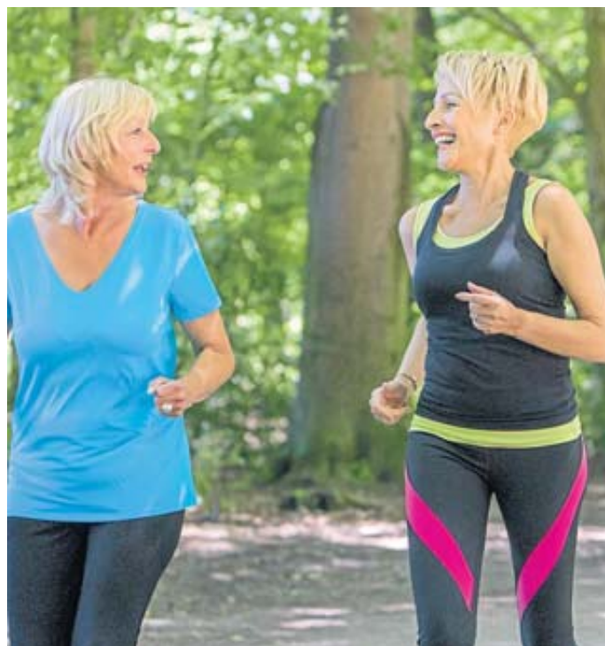
Moderater Ausdauersport kann dabei helfen, den Bluthochdruck zu senken.

Blutdruck aus. Hier gilt aber ebenfalls: nicht an die eigenen Grenzen gehen.