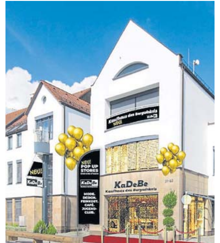
Im KaDeBe gibt es am 15. und 16. Juni ein Carrera-Turnier und ein Star Wars Lego Event.

„Wir freuen uns darauf, dieses besondere Wochenende mit Ihnen zu feiern und gemeinsam den neuen Stadtplatz einzuweihen. Kommen Sie vorbei und genießen Sie die vielfältigen Angebote und Attraktionen!“, heißt es in der Einladung der Stadtverwaltung. BWB