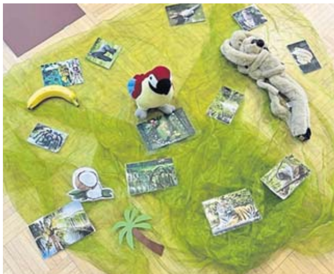
Der „Papagei“, der eine Schatzkarte im Dschungel gefunden hatte, war auf die Hilfe der Kinder angewiesen, um den Wortschatz zu finden.

Die natürliche Freude an der Bewegung wird für Sprachanlässe genutzt. Unter diesen Voraussetzungen entstand ein Projekt zum Thema „Bewegte Sprache“, welches