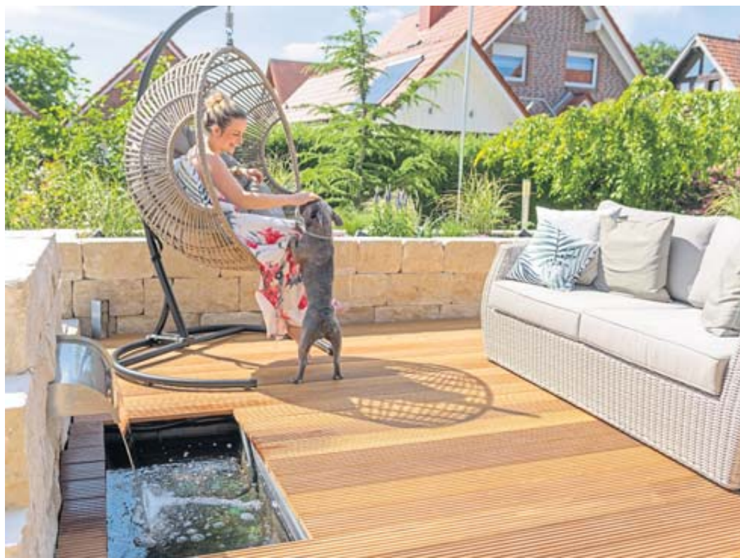
Bei der Verwirklichung des Traumgartens steht Raiffeisen Baustoffe in Welkers mit Rat und tat zur Seite.