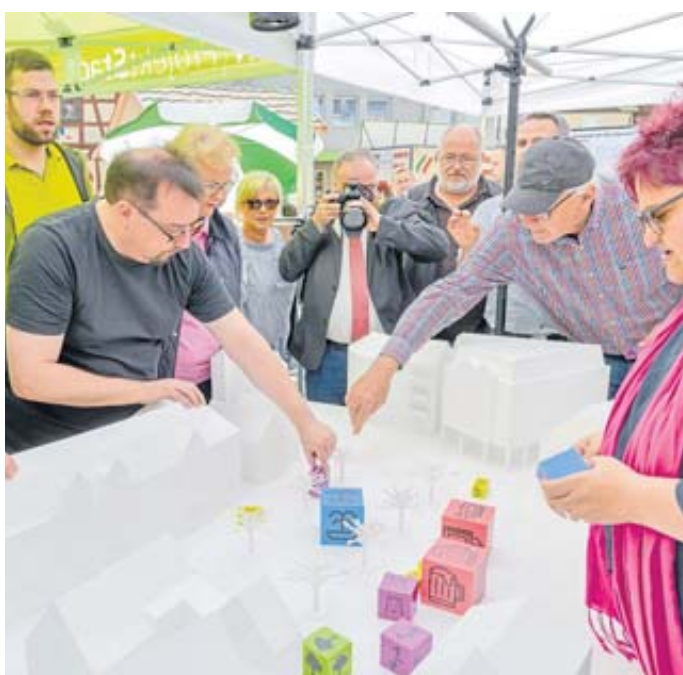
Beim Helle Markt 2018 konnten alle Bürgerinnen und Bürger mittels bunter Würfel ihre Ideen zur Umgestaltung des Stadtplatzes einbringen.