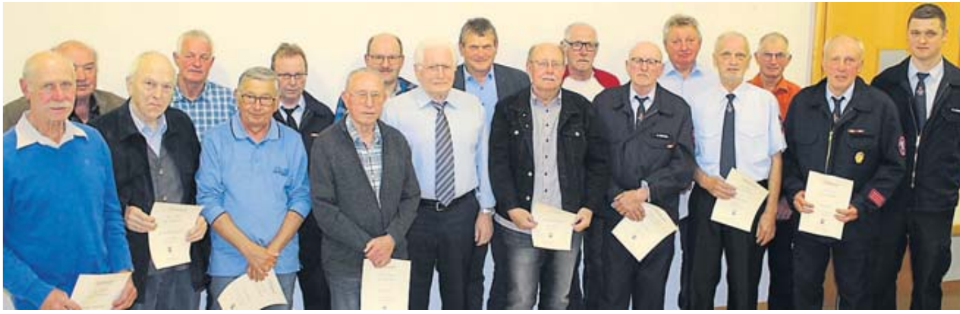
Schon 50 beziehungsweise 60 Jahre gehören diese Mitglieder der Hintersteinauer Wehr an.