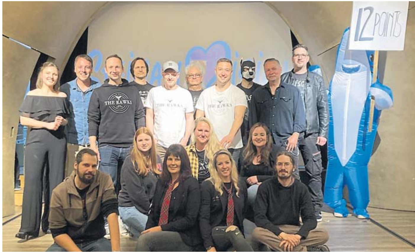
Die Künstlerinnen und Künstler des Steinauision Song Contests präsentierten sich auf der Bühne im Theatrium. Mit dabei war der Hai, der „12 Points“ verkündete. Vielleicht, weil der Gesangswettbewerb schon jetzt die Grimm-Stadt insgesamt zur Gewinnerin macht?

Unter dem Gelächter des Publikums antworteten WOLFSGOD auf die Frage „Lieber üben oder improvisie-