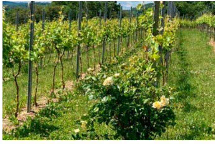
Bei der Exkursion über den Weinberg werden interessante Stationen des Steinauer Weinbaus erwandert.