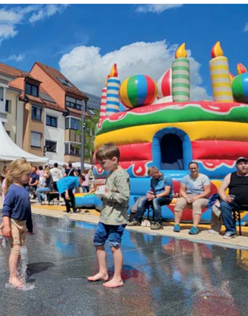
Wasserspiel für eine erfrischende Abkühlung.