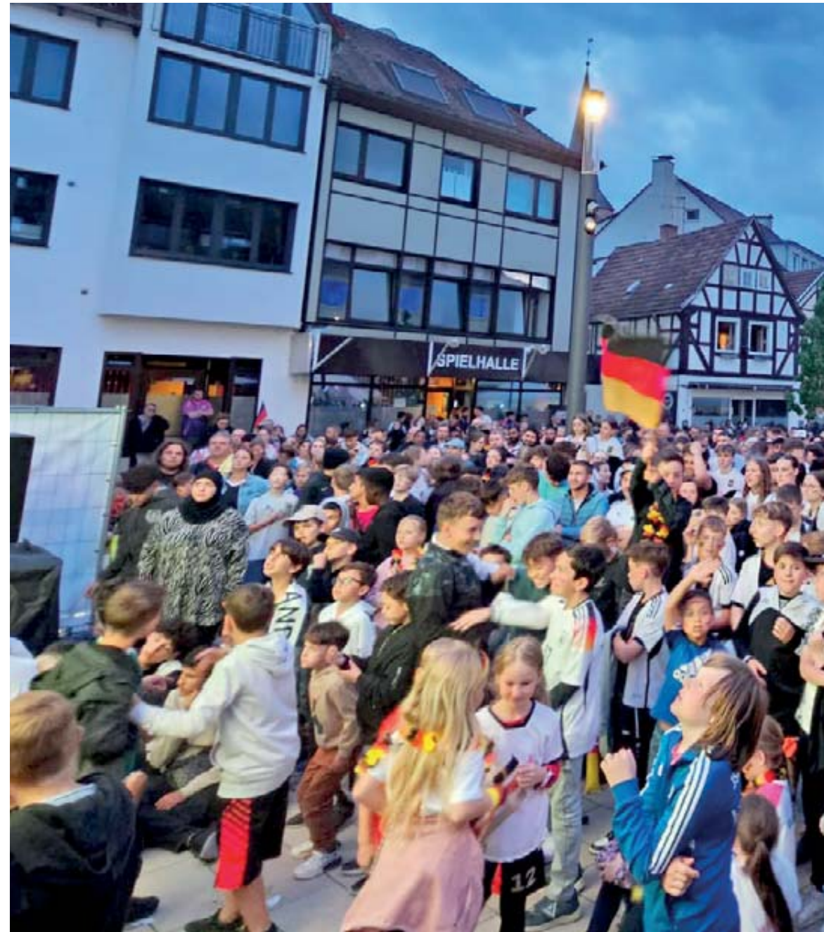
In einer angenehmen Atmosphäre schauten die Fans das tolle Spiel der Deutschen Nationalmannschaft.