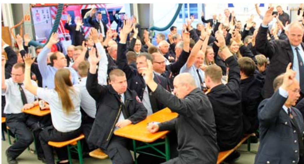
Die Aufnahme zeigt einige der vielen Delegierten, die in der gemeinsamen Hauptversammlung ihre Zustimmung gaben....