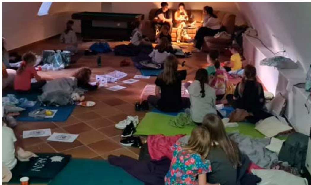
Nachdem es sich alle im Gewölbekeller gemütlich gemacht hatten, wurden die Bücher für diesen Abend vorgestellt.

Oftmals beginne das Riesenproblem, nachdem eine Frau es geschafft habe den Täter anzuzeigen. Selbst ein Schuldeingeständnis des Täters, hätte in ihrem Fall nicht dazu geführt, dass die Staatsanwaltschaft das Gewaltdelikt verfolgt habe, berichtete eine Frau im Publikum. Die Gewalttäter seien juristisch keine Täter. Auch gebe es dringenden Änderungsbedarf. bak