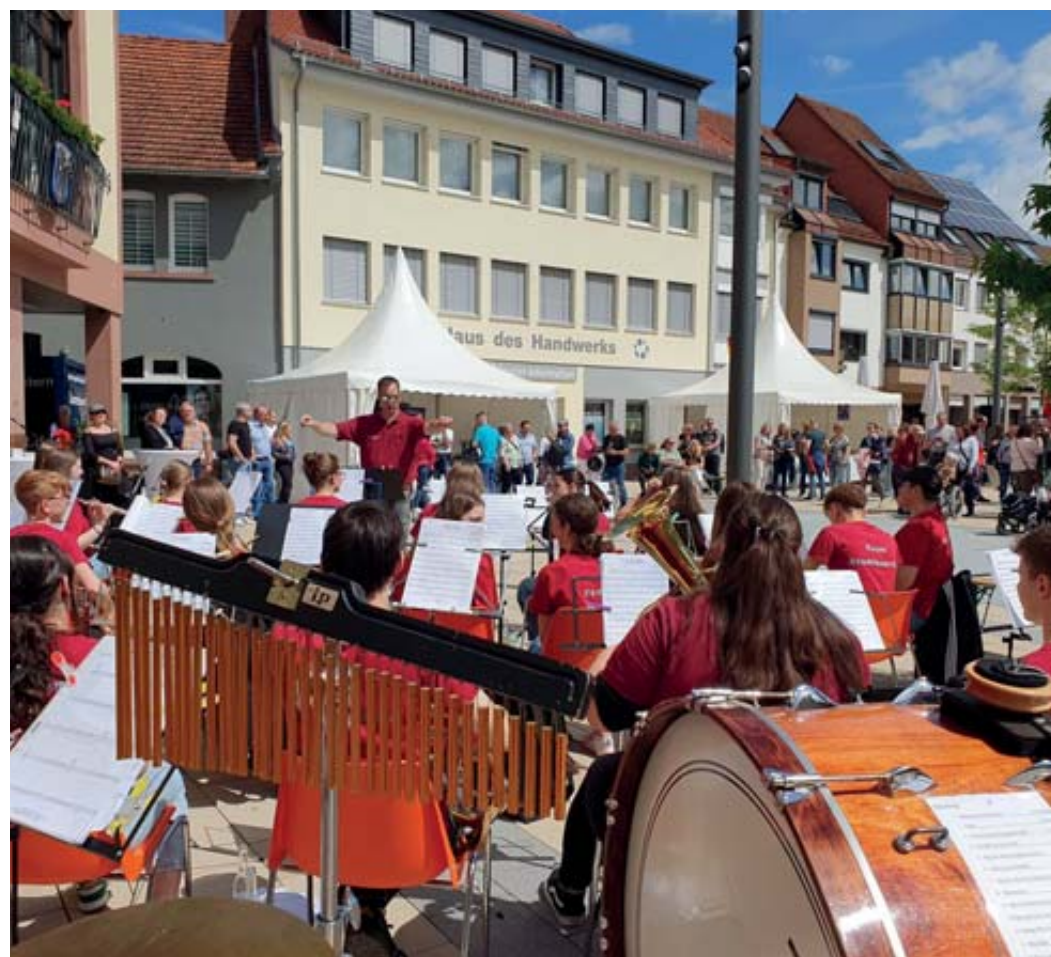
Ganz schön rockig! Die Jugendkapelle bewies, dass man Rock und Pop instrumental frischen Wind einhauchen kann.