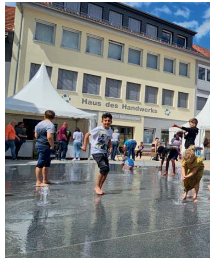
Bei sommerlichen Temperaturen nutzten die jungen Besucher das neue W