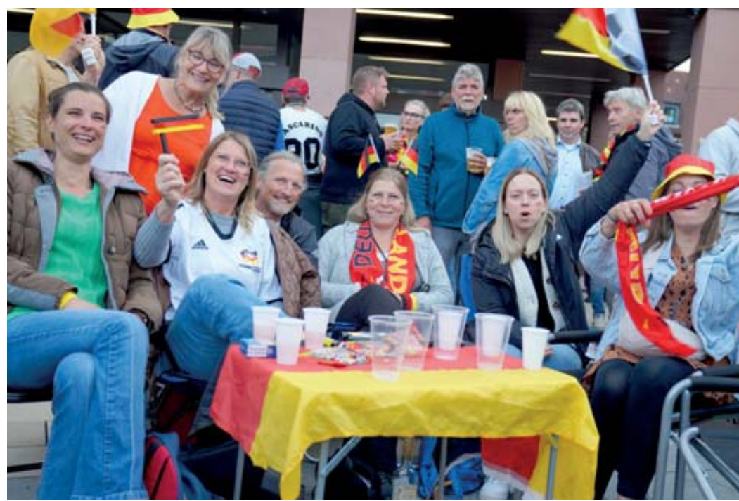
Der Stadtplatz in Schlüchtern dient als Wohnzimmer der Stadtbewohnerinnen und Stadtbewohner.