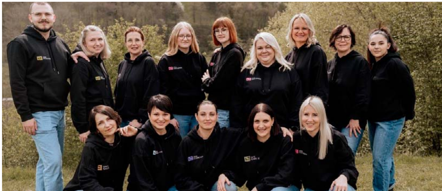
Das Team des Sinntal Squares besteht zu einem großen Teil aus starken weiblichen Persönlichkeiten.

Neben dem Hauptgebäude des Sinntal Squares entsteht unsere Eventlocation Sinn Moments. Das Merkmal dieser Räumlichkeiten, welches wohl am meisten heraussticht, ist die freitragende Architektur. Durch die großen