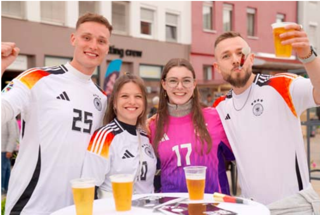
Geballte Fan-Power! Voll motivierte Fans mit Deutschlandtrikot – Da konnte Deutschland ja gar nicht verlieren.

Der neu gestaltete Schlüchterner Stadtplatz lockt Gäste aus ganz Deutschland zu einem großen Schauen des Auftaktspiels der