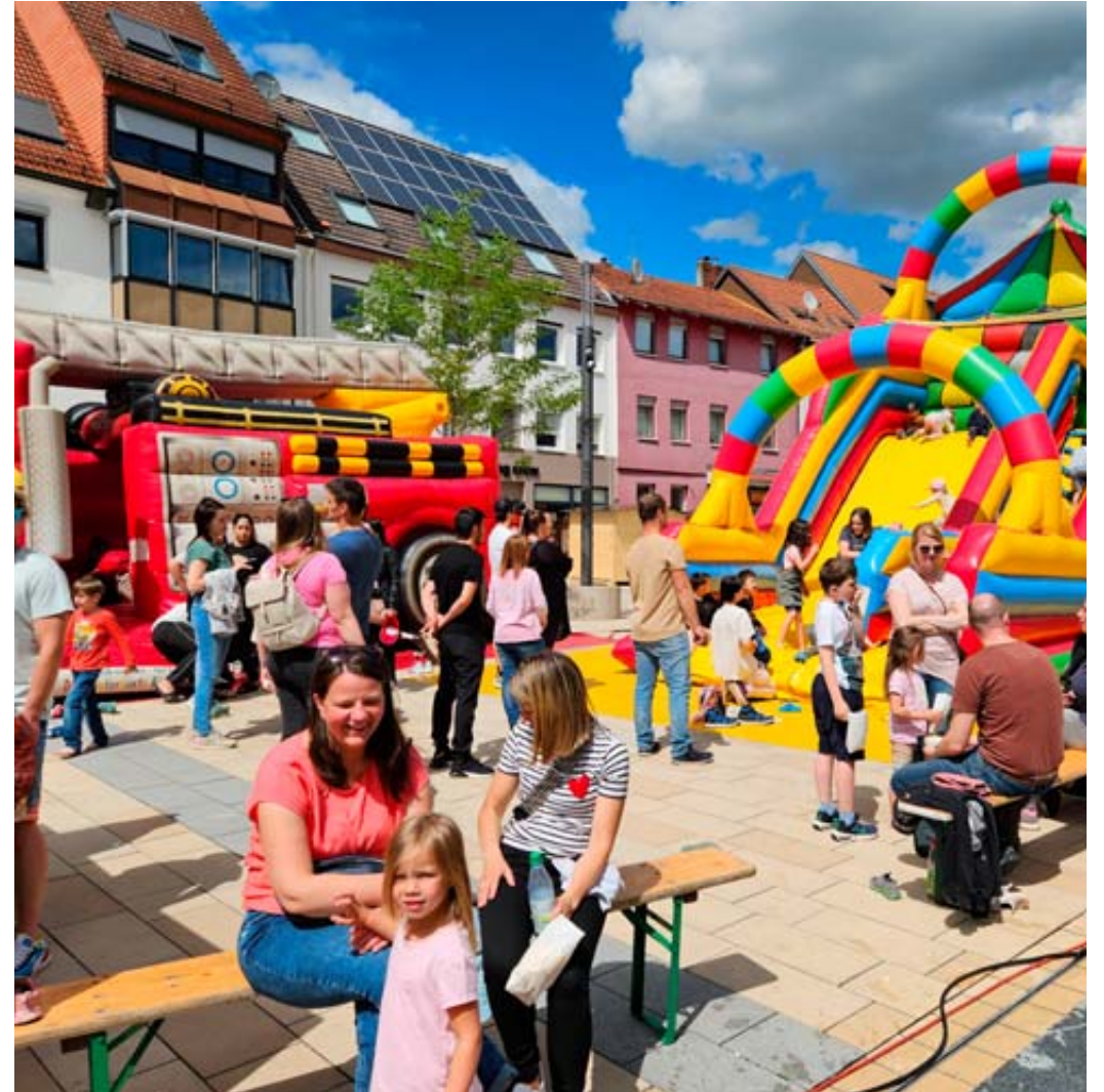
Das Wetter leistete seinen Beitrag, um den Schlüchternern einen wirklich tolles Event zu besichern.