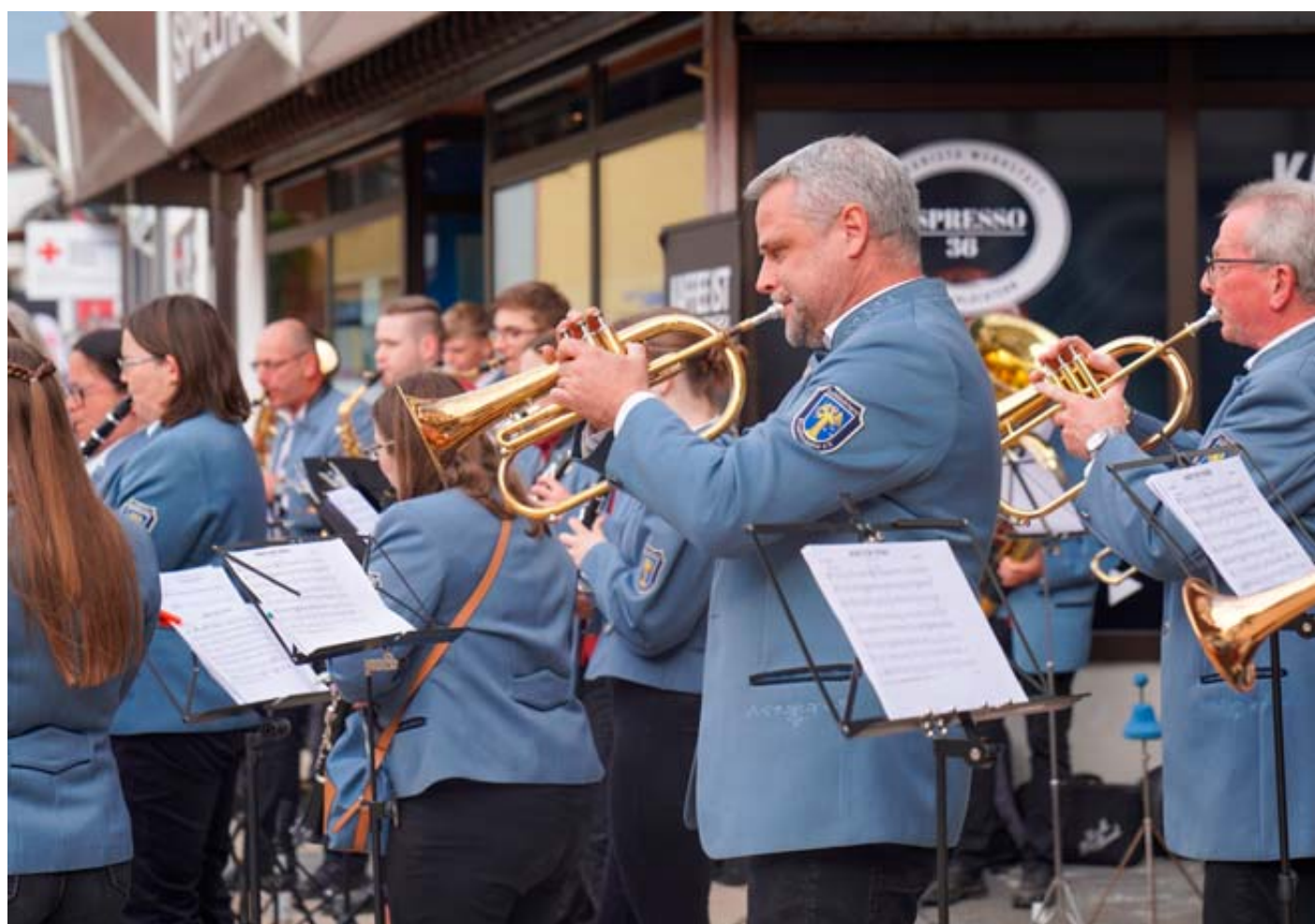
Den musikalischen Einstieg am Freitagabend machte die Stadtkapelle Schlüchtern.