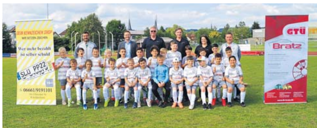
Einen Satz neuer Trikots und Eiscreme für alle gab es vom Ingenieurbüro Bratz und dem Kennzeichen-Shop für die F-Jugend der SG Schlüchtern.

zusammenarbeitet, dauerhafte Förderer der SG Schlüchtern zu sein. Nach dem Training gab für die Nachwuchssportler eine Runde Eiscreme von der ortsansässigen Eisdielen, spendiert vom Kennzeichen-Shop. BWB