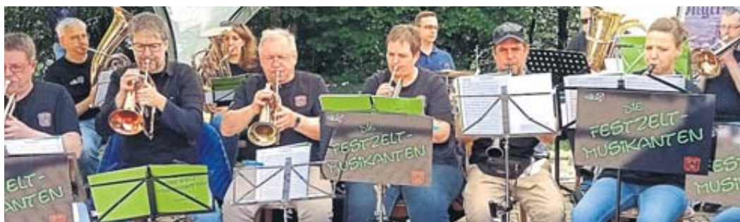
Die Wallrother Festzeltmusikanten sorgten für stimmungsvolle Unterhaltung.

Für das leibliche Wohl der vielen Besucher hatten die Feuerwehrleute bestens gesorgt. FGW