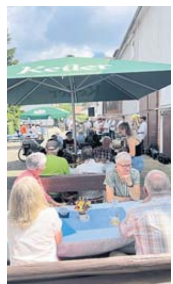
Gut 100 Besucher hieß die BBB zu ihrem Sommerfest willkommen.