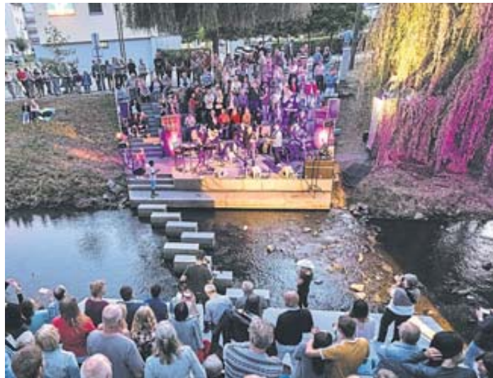
Die Wasserspiele sind ein Kulturereignis an einer ganz besonderen Location – der Arena in der Salz.

Klassikern der 60er bis 80er Jahre in seinen Bann. Am Sonntagnachmittag, 14. Juli,