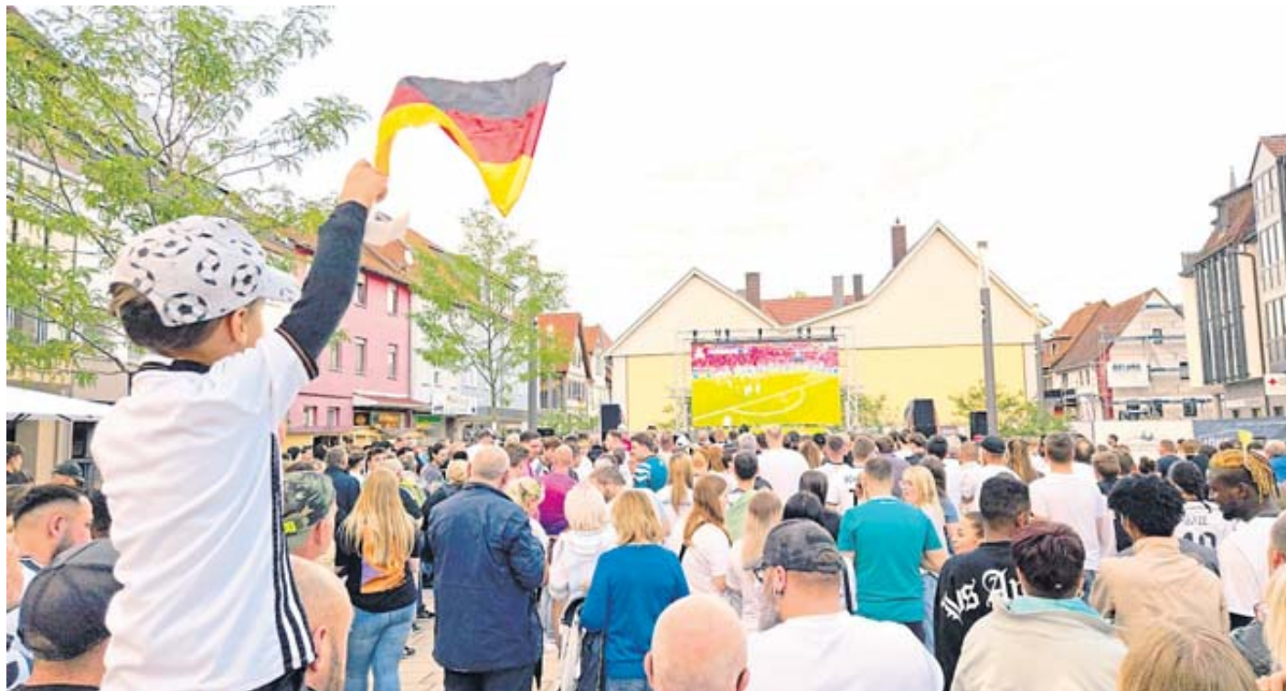
Nervenkitzel garantiert: Am Samstag, 29. Juni, um 21 Uhr tritt die deutsche Mannschaft gegen den Zweiten der Gruppe C an. Das Spiel wird, wie alle Achtelfinalspleie live auf einer Großbild-LED-Leinwand auf dem Stadtplatz übertragen.