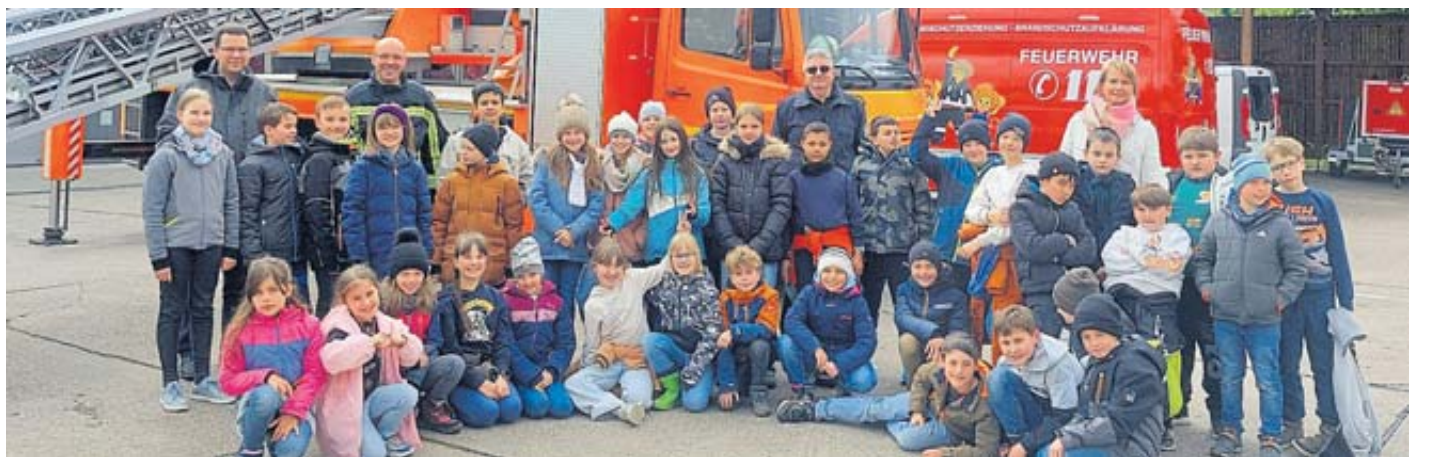
36 Schüler der dritten und vierten Jahrgangsstufe der Landrückenschule erlebten auf der Feuerwache Offenbach einen spannenden Vormittag.