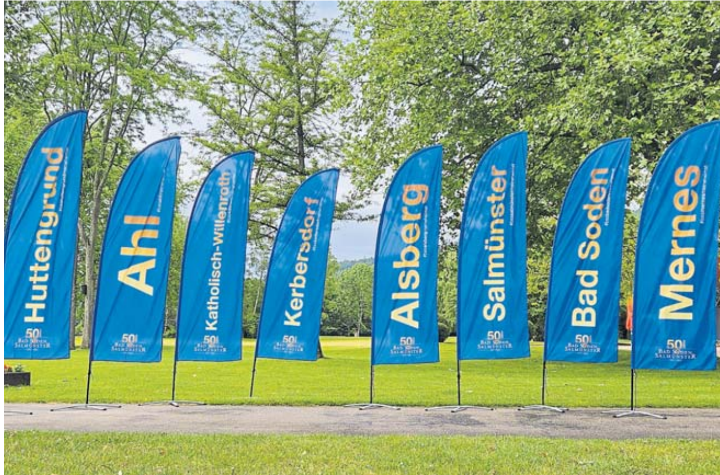
Fahnen mit den Namen der Stadtteile im Kurpark Bad Soden dienen als Hinweis auf die 50-Jahr-Feier von Bad Soden-Salmünster am ersten Juli-Wochenende.