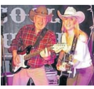
Das Duo „Cool Country“ spielt am 6. Juli im Kurpark Bad Soden.