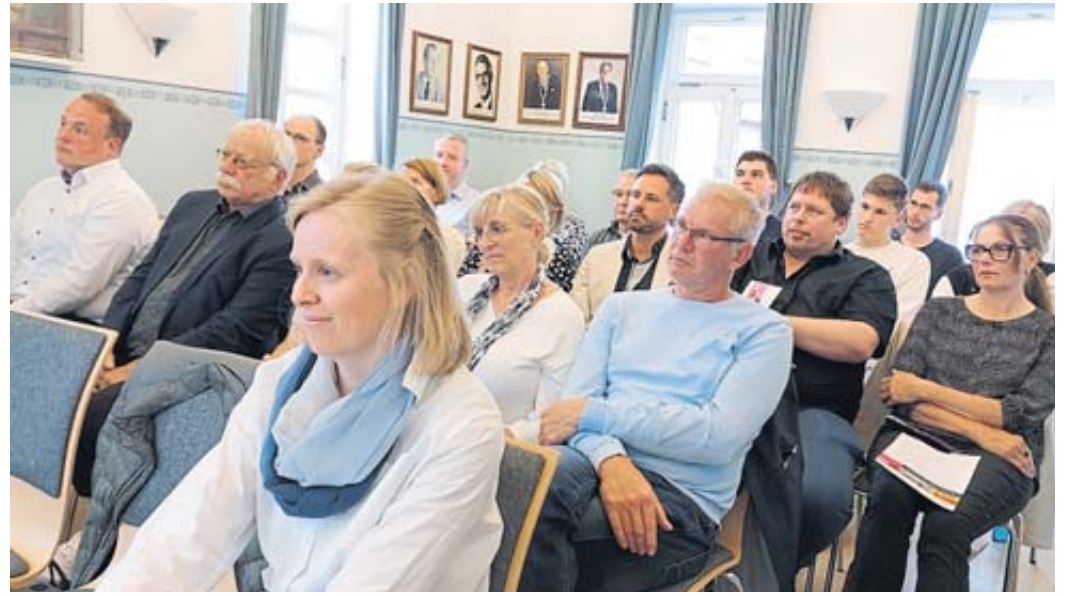
Interessiert folgten die Besucher den Ausführungen der Podiumsrunde in der ehemaligen Synagoge.