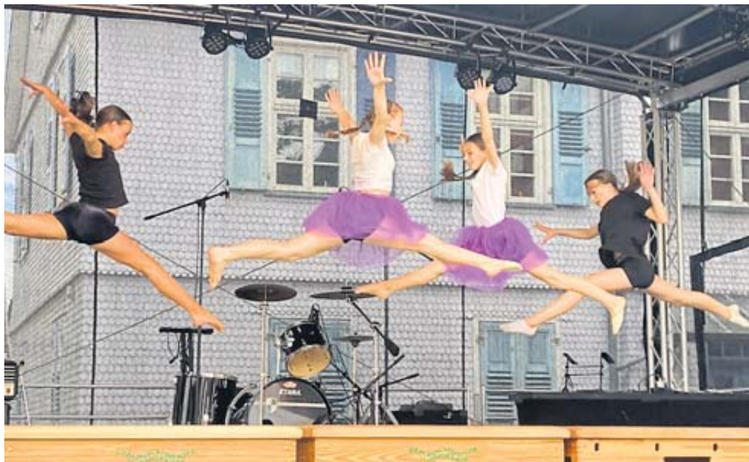
In einer tollen Choreographie erzählten die Mädchen des Turnvereins vom Kampf Gut gegen Böse, den letztlich die guten Feen für sich entscheiden konnten.