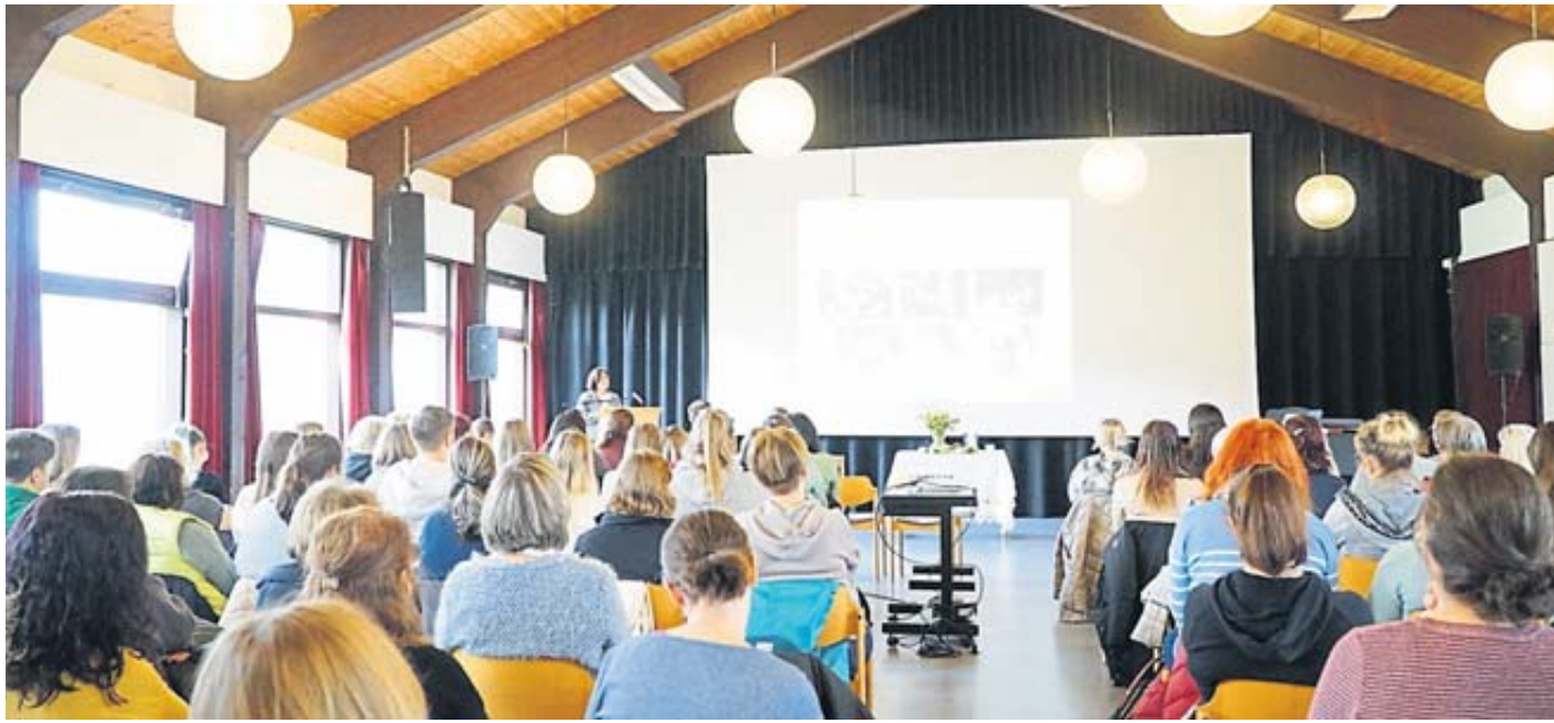
Rund 100 Erzieherinnen und Erzieher der evangelischen Kindertageseinrichtungen im Kirchenkreis Kinzigtal kamen zu einem pädagogischen Fachtag im evangelischen Gemeindezentrum in Schlüchtern zusammen.