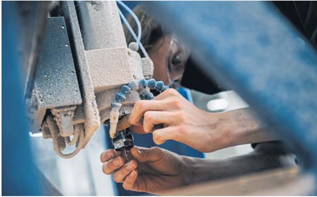
Bei einem Berufspraktikum können Ausbildungssuchende für ein paar Wochen in einen Beruf reinschnuppern.

Ein wesentlicher Bestandteil ist das Berufsorientierungspraktikum. Damit die