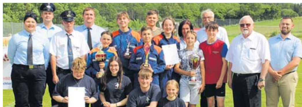
Die Siegermannschaften in Staffel- und Gruppenwertung, Huttengrund und Vollmerz, zusammen mit den Verantwortlichen und Ehrengästen.

Zudem würde in der Jugendwehr Gemeinschaft und Vertrauen gefördert: „Alle Teilnehmer sind Sieger.“ FGW