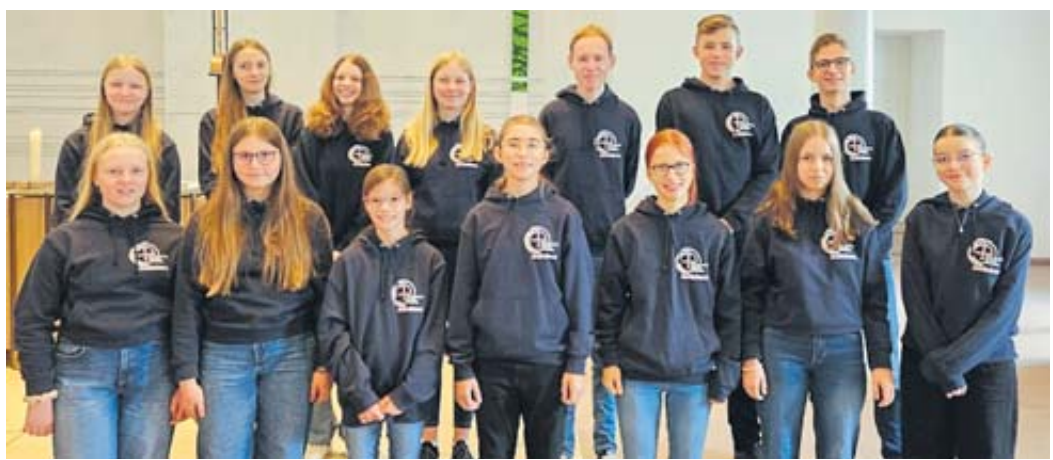
Die Chöre der evangelischen Kirchengemeinde St. Michael Schlüchtern freuen sich auf die sommerliche „Serenade im Klosterhof“. Unser Bild zeigt den Jugendchor.