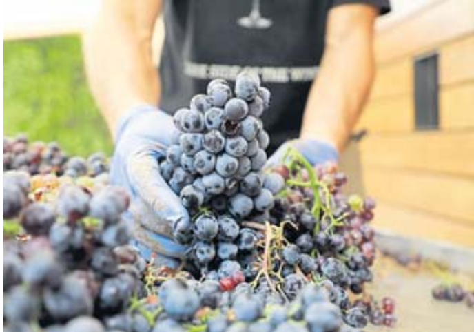
Mal etwas Neues ausprobieren? Mit einer Saisonarbeit wie etwa bei der Weinlese ist das möglich.

„Gerade dort, wo der Fachkräftemangel besonders