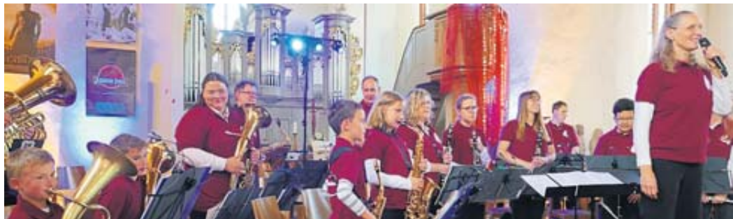
Die Germania Juniors gaben ihr Debüt mit den Geisterjägern.