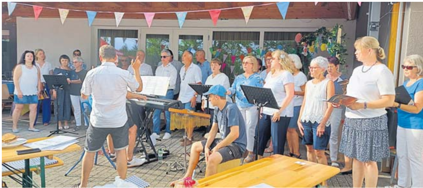
Der Männerchor Einigkeit Marborn und die Formation Haste Töne eröffneten das Chorsingen.