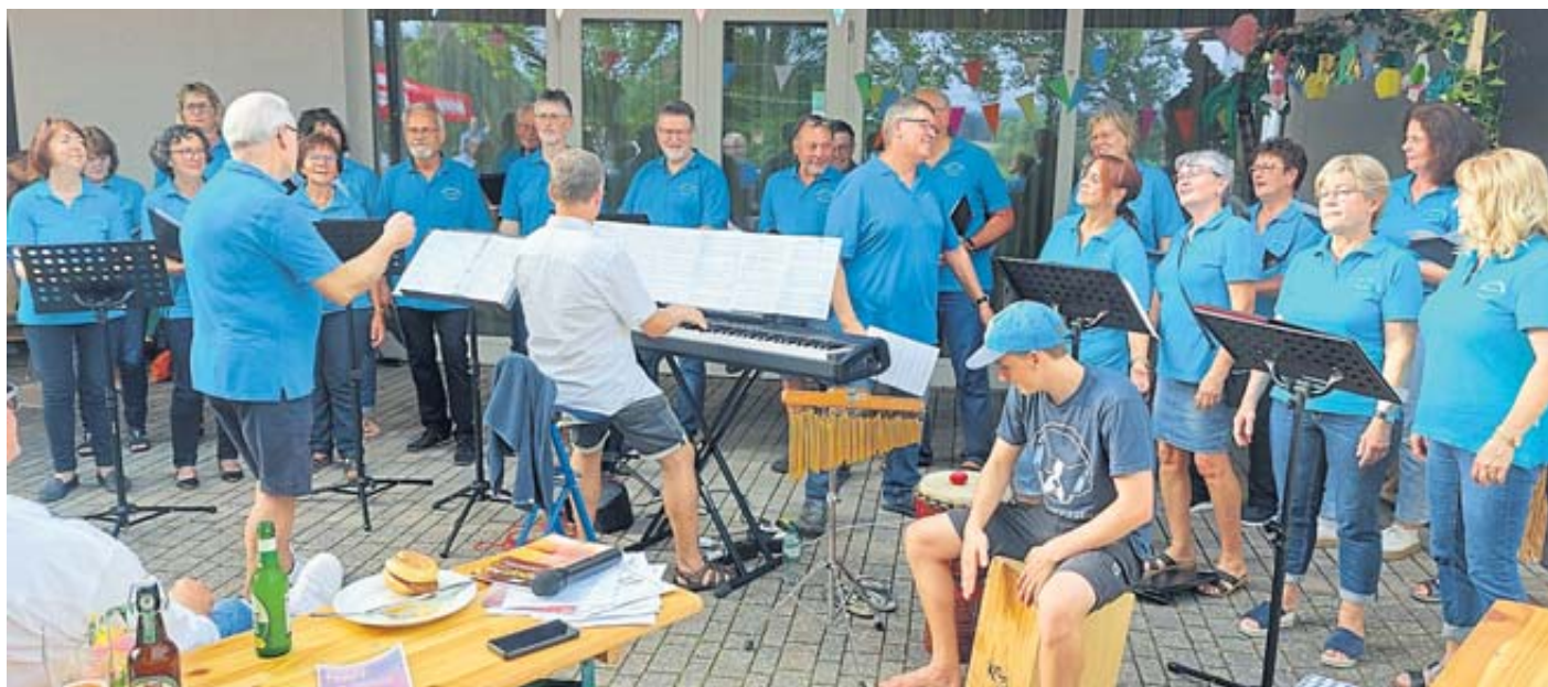
Auch „Harmonie“ Ulmbach sorgte mit fetzigen Liedern für gute Stimmung.

Bis zum Beginn des Fußballspiels Deutschland gegen Dänemark unterhielten sich die Besucher bei DJ-Musik. Anschließend fieberten sie bei „Public Viewing“ gemeinsam um den Ausgang der Begegnung. PK