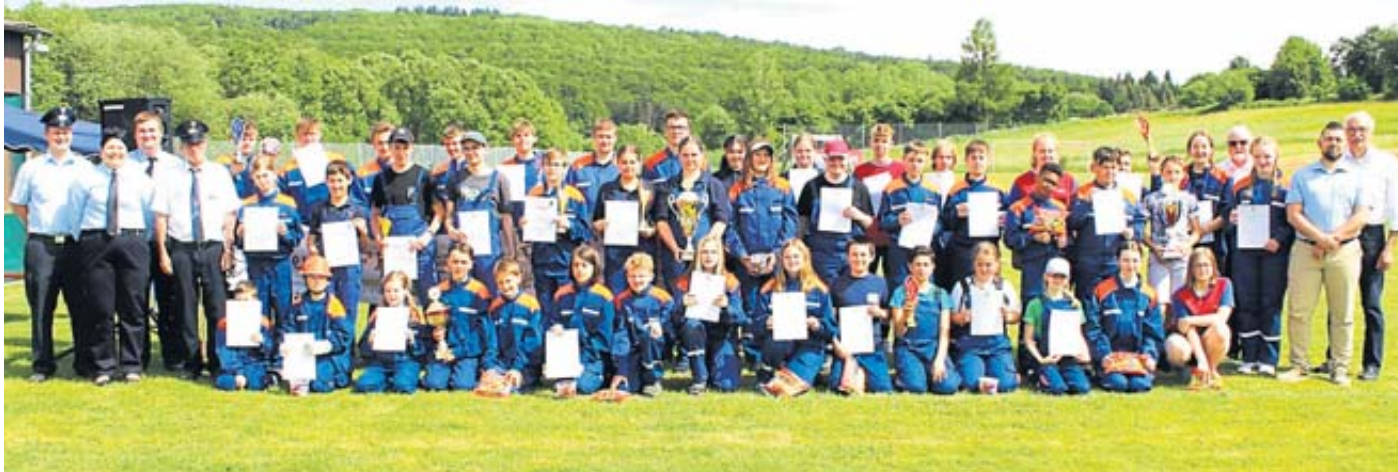
Vertreter von allen 24 teilnehmenden Mannschaften beim Jugendfeuerwehr-Unterverbandsentscheid in Breunings nach der Siegerehrung.