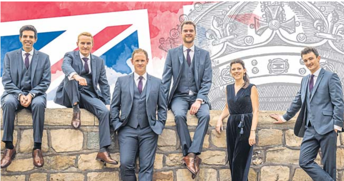
The Queen's Six singen in Nieder-Moos im Auftrag Seiner Majestät King Charles III.

meisten bekannten Vorverkaufsstellen haben Eintrittskarten parat. Freitags von 9 bis 11 Uhr können Tickets im Konzertbüro unter der Telefonnummer (06644) 7733 bestellt und erworben werden. BWW