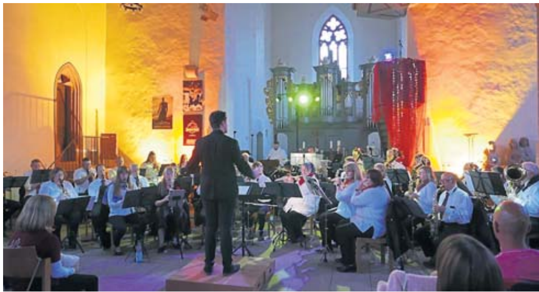
In ein farbiges Lichterspiel getaucht präsentierte sich die Katharinenkirche bei Einbruch der Dunkelheit.