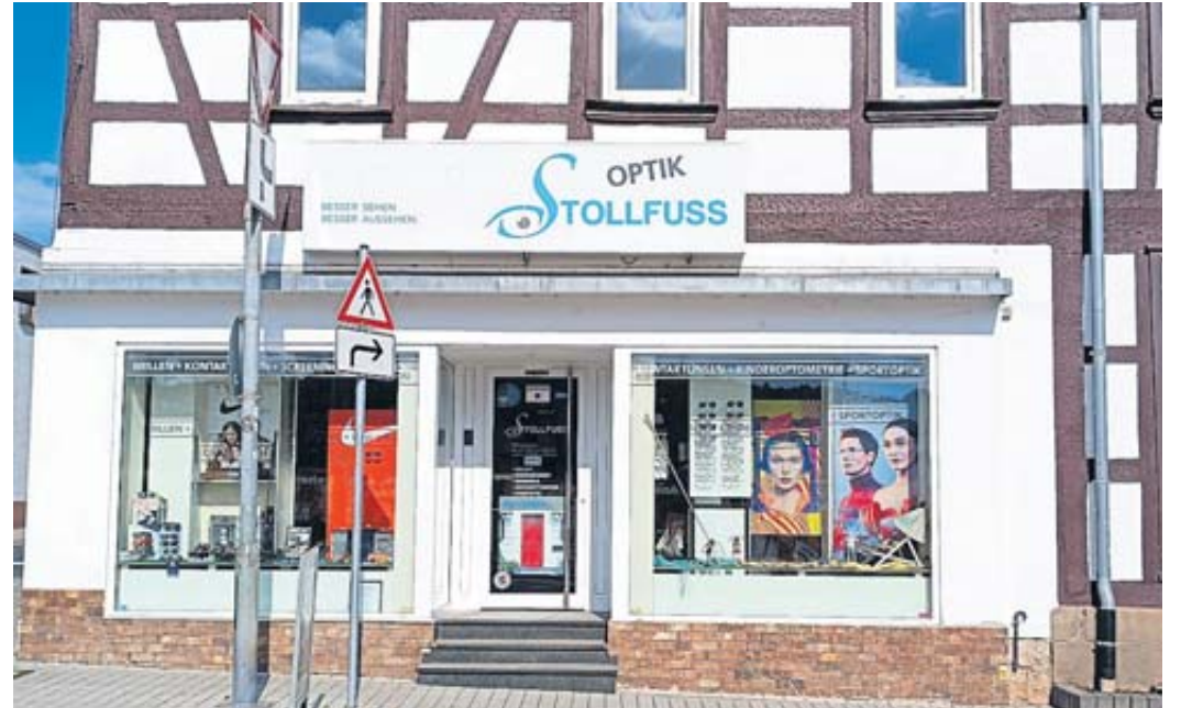
Seit Ende Oktober 2012 finden Kunden das Fachgeschäft Optik Stollfuss in der Obertorstraße 30 in Schlüchtern.