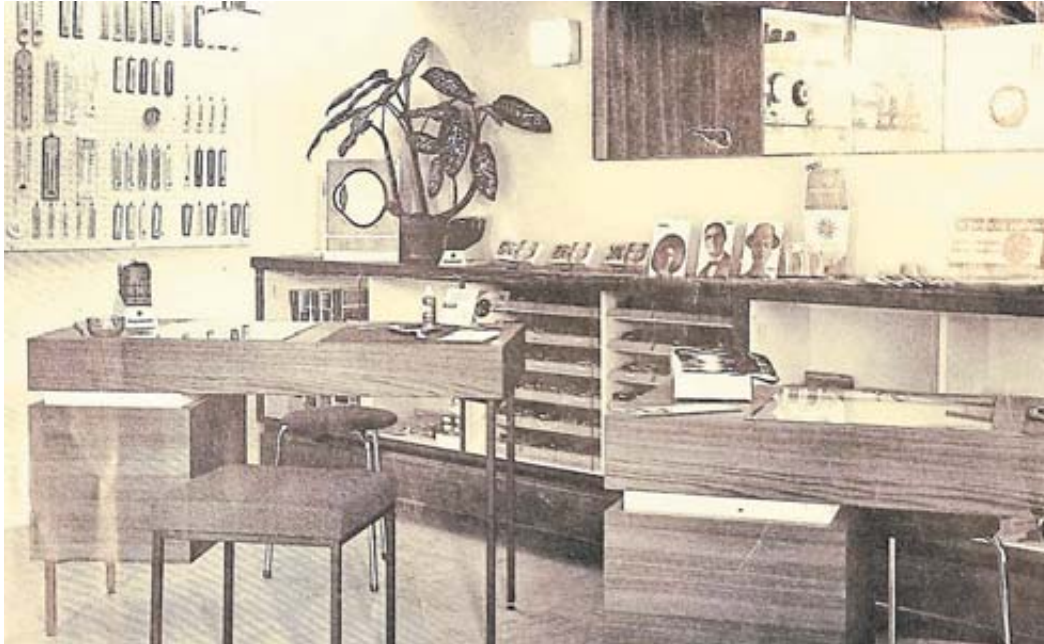
Unser Bild zeigt die ehemaligen Geschäftsräume von Optik Stollfuss in der Bahnhofstraße in Schlüchtern.