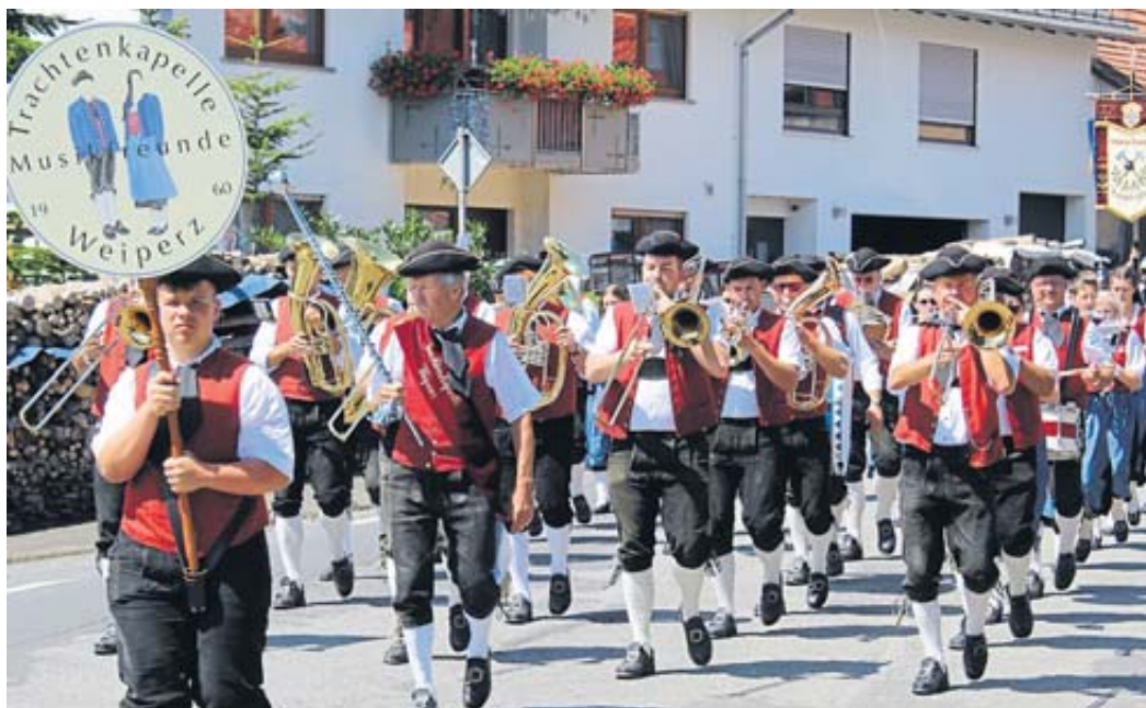
Die Trachtenkapelle Weiperz sorgte für passende Marschmusik.

Nach dem Festzug am Sonntag war Party mit Gaudi-Gerry angesagt. Seinen abschließenden Höhepunkt hatte das Fest am Montagabend mit der Aufführung des Großen Zapfenstreichs, wo noch einmal das große Zelt vollbesetzt war. FGW