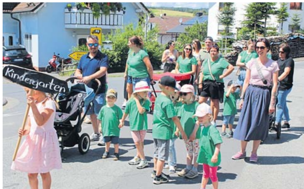
Ein bunter Farbtupfer unter den Uniformierten war der Hintersteinauer Kindergarten.