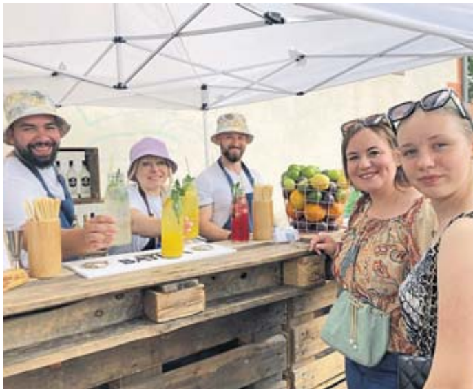
Freundlichen Service und erfrischende Limonaden gab es am Stand von „We love Cocktails“ auf dem Kumpen.

tropfen für die fast 80 Anbieterinnen und die Besucher war das Wetter, dass sich ab dem Mittag von seiner schlechteren Seite präsentierte. Der Regen veranlasste einen Teil der Standbetreiberinnen früher als geplant zusammenzupacken.