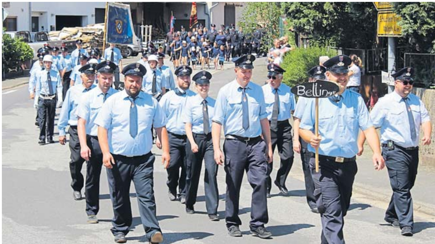
Eine Vielzahl von Feuerwehren aus dem gesamten Altkreis nahm vergangenen Sonntag am Festzug zum Unterverbandstag in Hintersteinau teil.