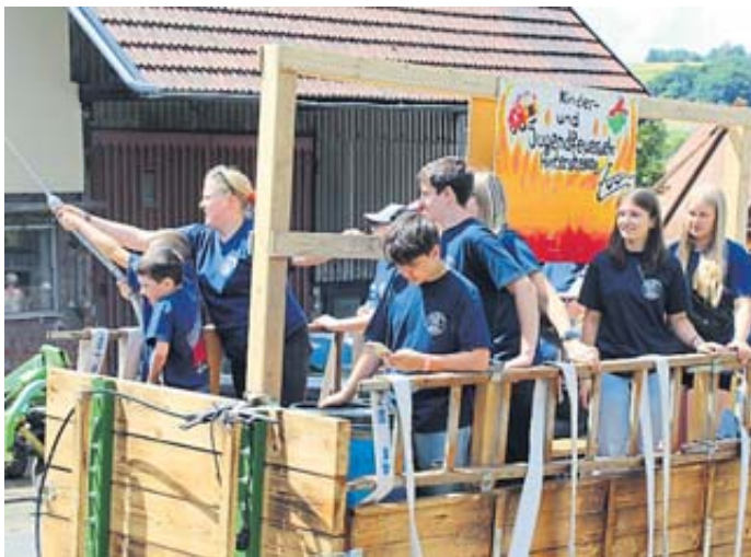
Zu den Mitwirkenden gehörte auch die Kinder- und Jugendfeuerwehr.