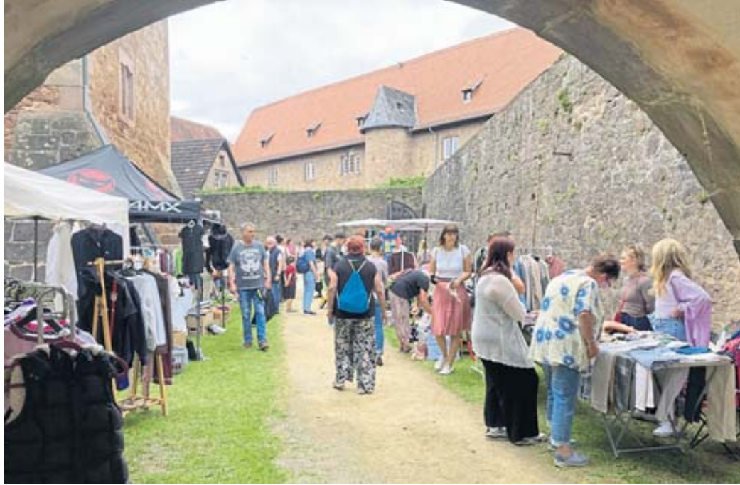
Der Hirschgraben rund um das Steinauer Schloss bot eine tolle Kulisse für den ersten Mädchenflohmarkt in Steinau.

Wer ob des Bummels hungrig oder durstig geworden war, hatte die Qual der Wahl. Im Marstall boten die Landfrauen 2.0 Seidenroth leckere selbstgebackene Kuchen an und auf dem Kumpen gab es Burger, Bubble-Waffeln, erfrischende Cocktails und Limonaden. Einziger Wermuts-