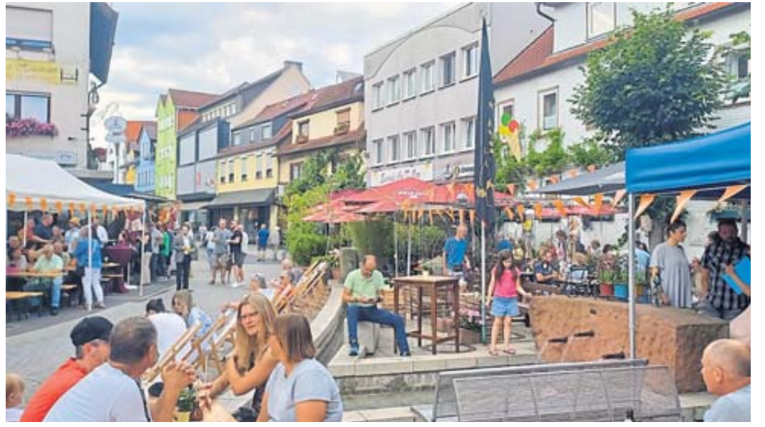
Das Leben findet auf der Straße statt, ein Bild, dass man eher aus Urlaubsländern kennt.