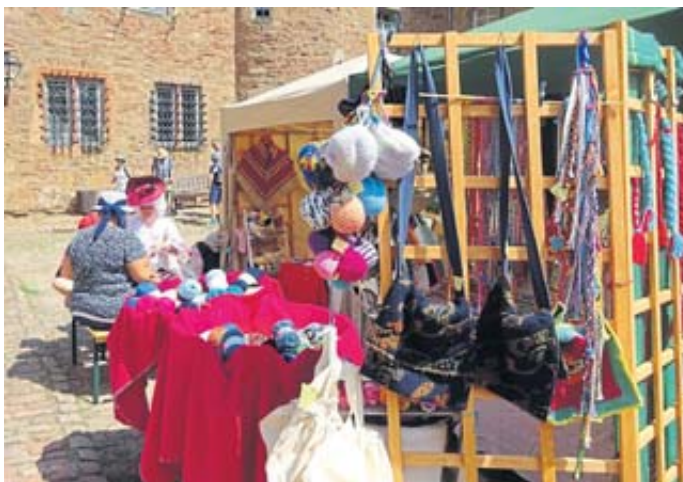
Farbenfroh dekoriert leuchten die Stände im Schlosshof.