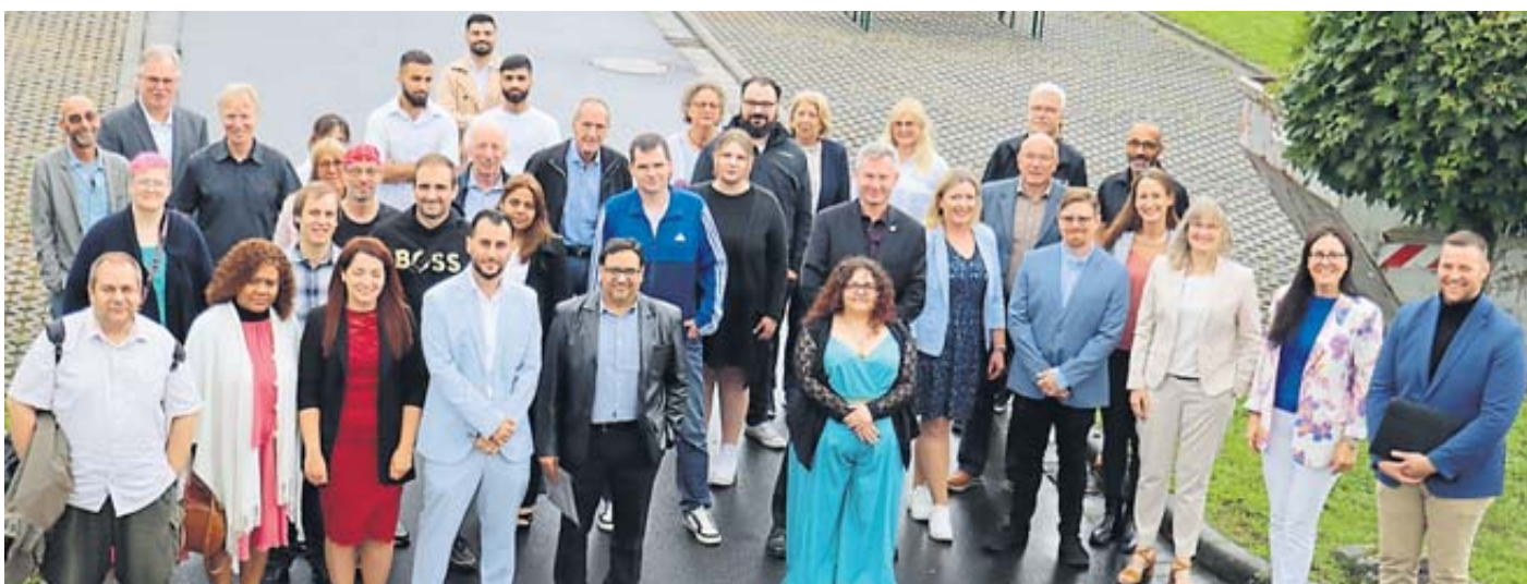
Diese 31 junge Menschen haben ihre Ausbildung bei AQA bestanden.