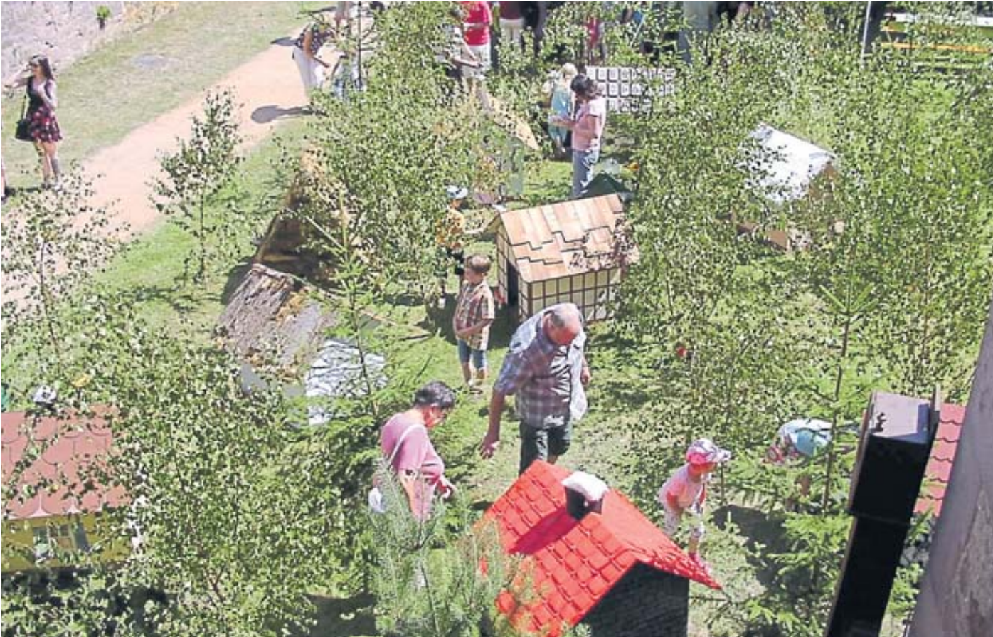
Ein Märchenwald im Hirschgraben rund um das Steinauer Schloss lädt zum Besuch ein.

Der Eintritt zum Erzählabend kostet 19 Euro (ermäßigt 14. Euro).