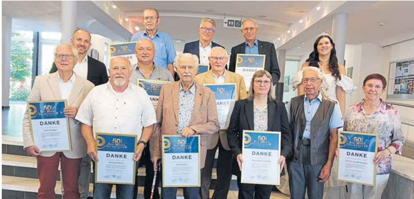
Im Rahmen des Jubiläumsfests zur Vereinigung der Kurstadt wurden verdiente Bürger geehrt.