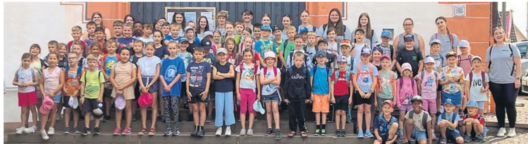
Auf dem Kumpen hatten sich die Kinder mit ihren Betreuern und Betreuerinnen versammelt, ehe es in den Erlebnispark ging. Vor dem Rathaus entstand ein Erinnerungsfoto.