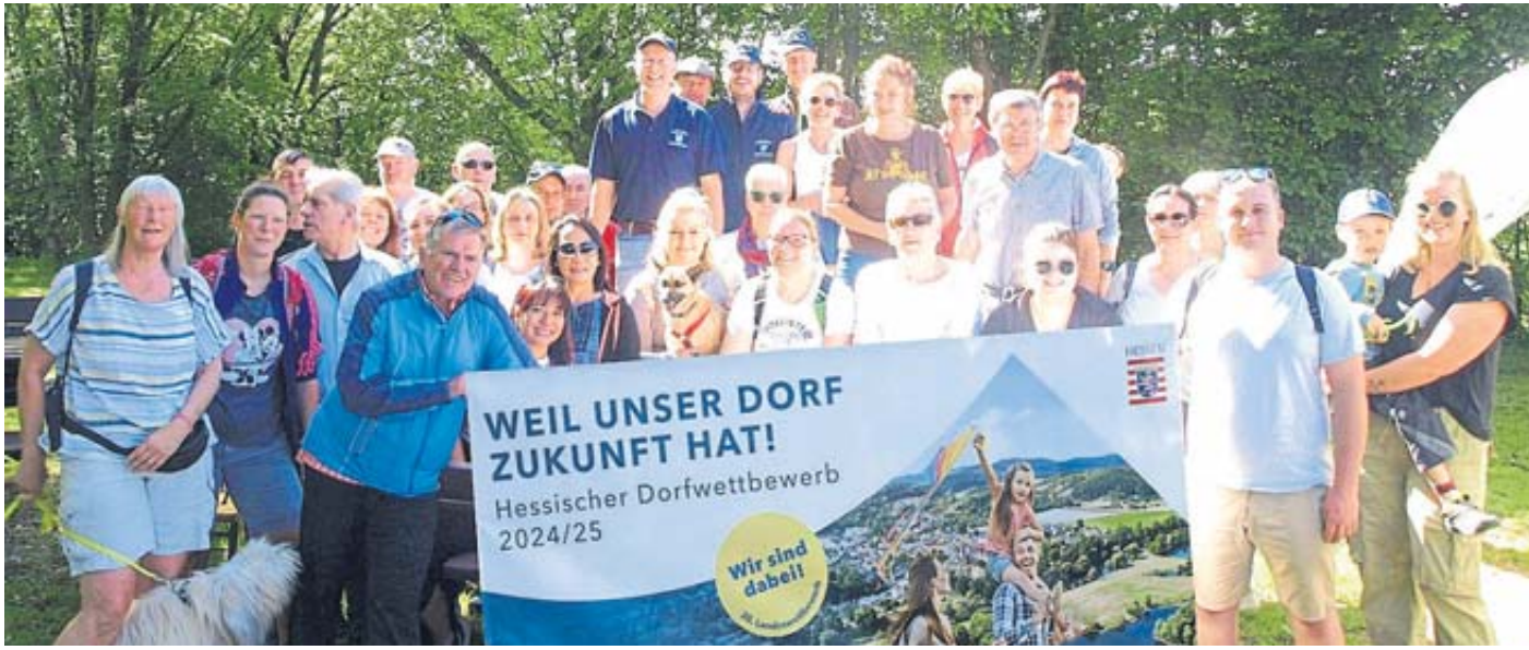
Die Aufnahme zeigt Menschen aus Breitenbach, die sich für die Teilnahme am Dorfwettbewerb einbringen.