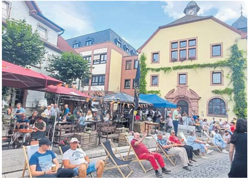
Im Liegestuhl bei einem kühlen Getränk lässt sich gut Leute beobachten...