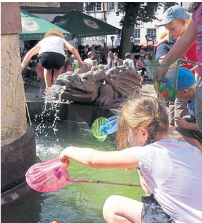
Im Märchenbrunnen auf dem Kumpen wird fleißig geangelt.