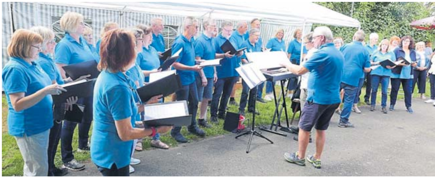
Der gastgebende Chor Harmonie Ulmbach setzte gekonnt den Schlusspunkt der Sommerserenade.

als Erzieherin im Kindergarten Mauerwiese tätig. Pfarrerin Simone Schneider dankte ihr im Namen des Kirchenvorstands für ihre langjährige zuverlässige und engagierte Tätigkeit.