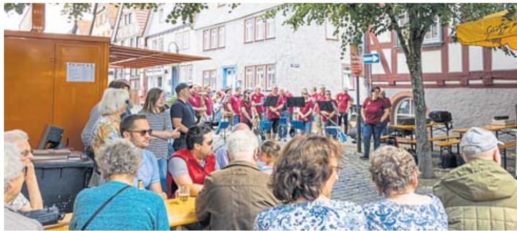
Im Herzen von Salmünster wird am 3. August Altstadtfest gefeiert.

Die offizielle Eröffnung findet um 13 Uhr am Stand des SV 1913 Salmünster in der Frankfurter Straße statt. Als