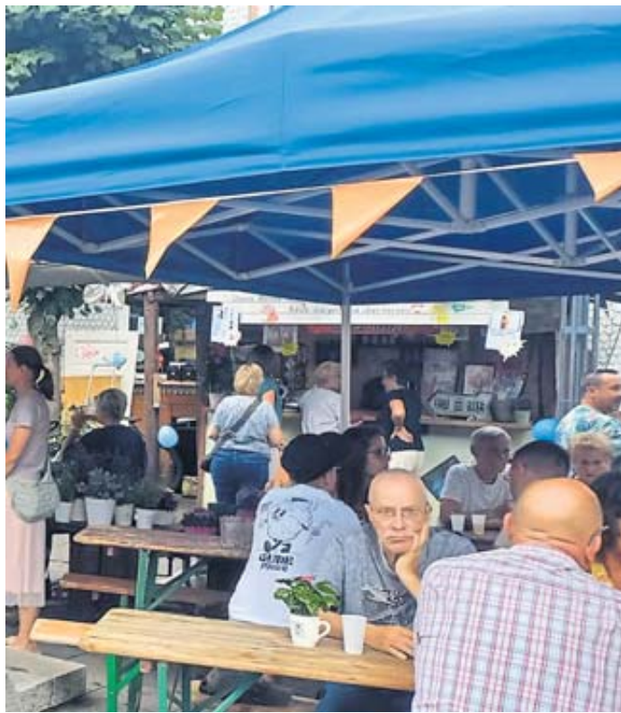
Nach einem straffen Arbeitstag nicht sofort nach Hause hasten, sondern entspannt mit alten und neuen Bekannten ein wenig plaudern.