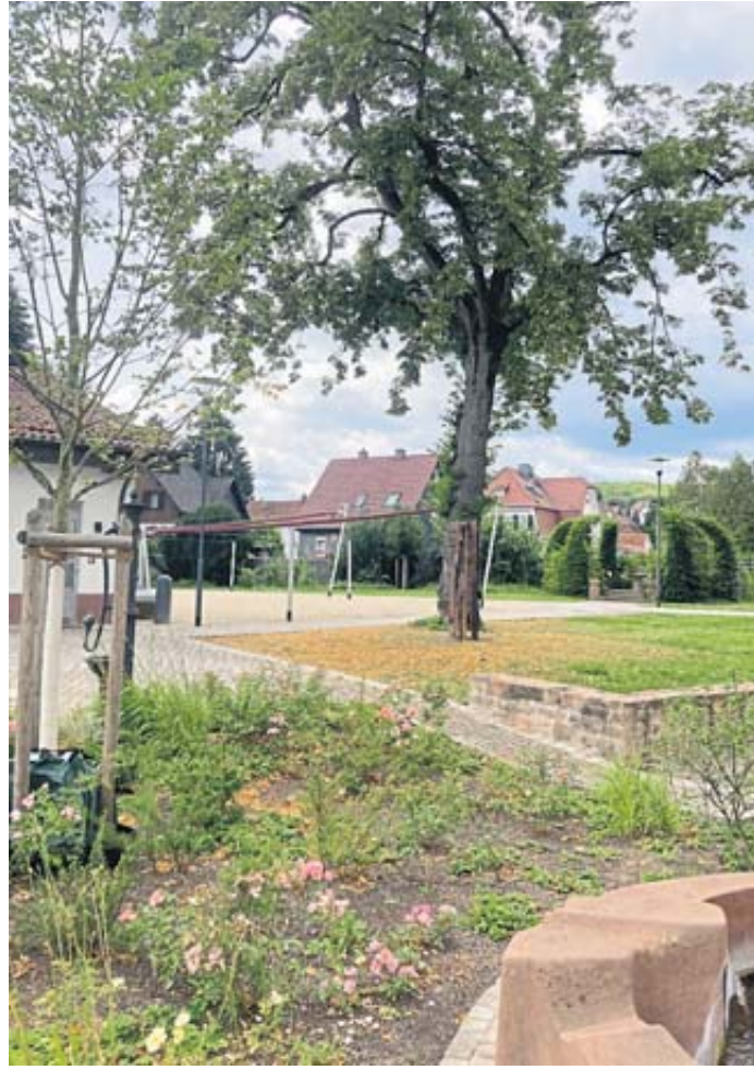
Im Schlässchengarten findet in diesem Jahr das Weitzelfest statt.