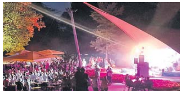
Rund um den Musikpavillon entsteht zum Kurparkfest ein großer Biergarten.