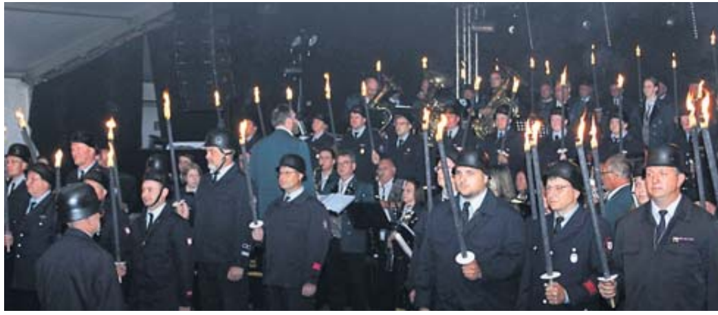
Rund 100 Feuerwehrleute mit brennenden Fackeln sorgten im dunklen Festzelt für ein feierliches Ambiente.

Den vollständigen Ausschreibungstext mit allen relevanten Informationen finden Sie im Internet unter: karriere.mkk.de