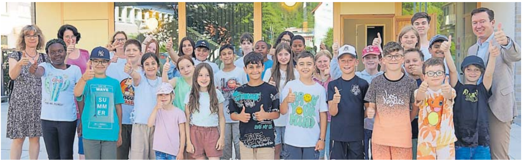
Bürgermeister Matthias Möller (rechts) führte die Kinder der Bergwinkel-Grundschule und Kinzigschule durch das Kultur- und Begegnungszentrum. Für große Begeisterung bei Schülern und Lehrern sorgte die fast fertige Bergwinkel-Zauberwelt.

Café kommen. Zum krönenden Abschluss spendierte die Stadt Schlüchtern jedem Schulkind noch ein Eis. Dabei machte Matthias Möller fleißig Werbung für das große KUBE-Eröffnungswochenende am Samstag, 5. Oktober, und Sonntag, 6. Oktober: „Es wird zahlreiche Aktionen für Groß und Klein geben – unter anderem eine Zaubershow, die Carrera-World im Kaufhaus des Bergwinkels, Hüpfburgen und Bastelstände. Ich lade alle herzlich zu diesem Festwochenende ein und fiere diesem entgegen. Bald öffnet unser KUBE seine Pforten für alle.“ BWB