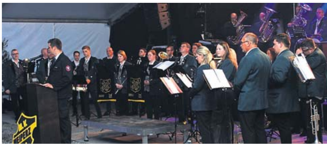
Der Musikverein Weiperz intonierte den Großen Zapfenstreich zum Abschluss des Feuerwehr-Unterverbandstages in Hintersteinau.

Besonders gedankt wurde dem scheidenden Stadtbrandinspektor Dietmar Bertold. FGW