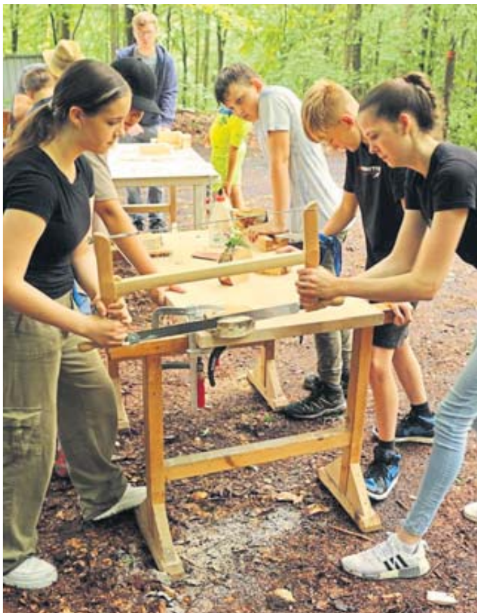
Die Aufnahme zeigt einen Teil der Schülerinnen und Schüler bei Schreinerarbeiten.

des Forstamtes und die externen Helfer galt es nun, das neue Konzept mit Leben zu füllen. Und es sollte ein voller Erfolg werden. Im Workshop Ökosystem konnten die Schülerinnen und Schüler einen Wasserfilter bauen und erleben, wie aus braunem Wasser einer Pfütze mit Hilfe des selbstgebauten Filters klares