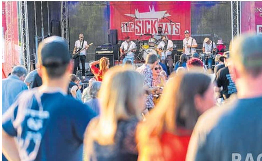
Am Festival-Freitag heizten die Musiker der Hausband „The Sick Rats“ den Besuchern ordentlich ein.