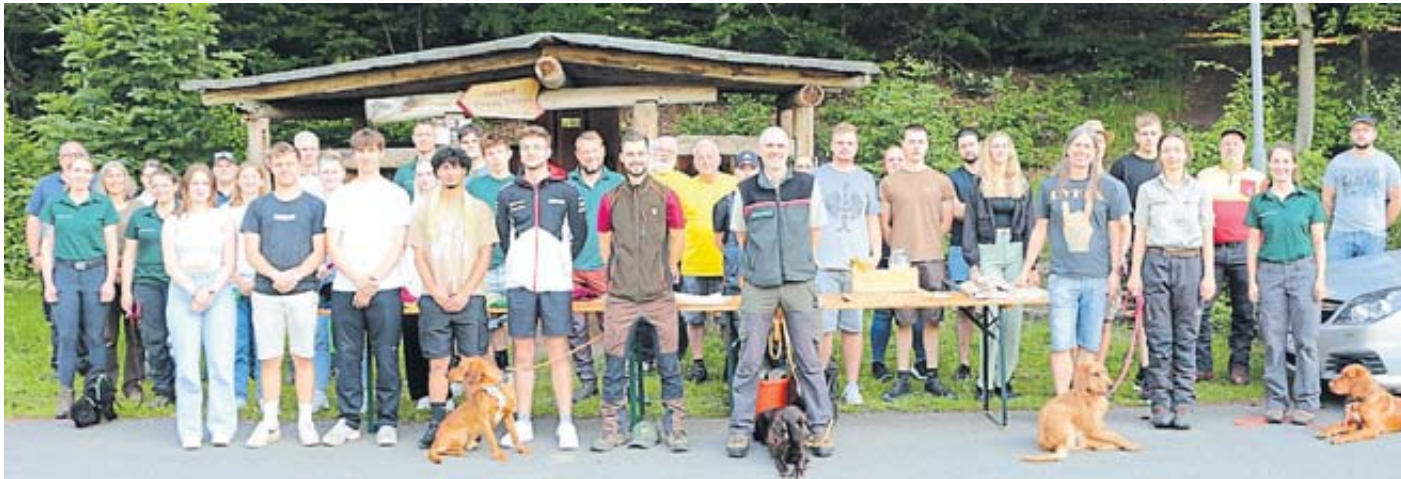
Für die Schülerinnen und Schüler wurde der Wald rund um den Acisbrunnen erneut zum Lernort.