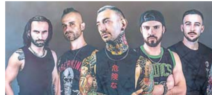
Die Linkin-Park-Tribute-Band „Living Theory“ spielt am Samstag, 10. August.