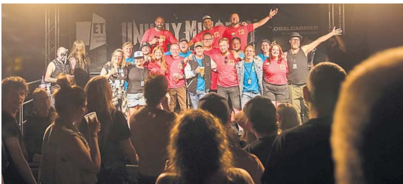
Geschafft! Die Macher von „Rock am Hinkelhof“ hatten auch in diesem Jahr ein tolles Festival auf die Beine gestellt.