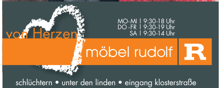
schlüchtern • unter den linden • eingang klosterstraße