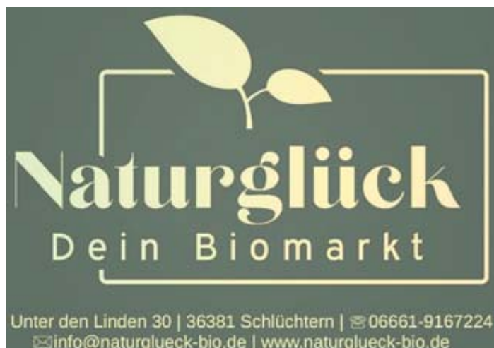
Unter den Linden 30 | 36381 Schlüchtern | ☎ 06661-9167224 ✉ info@naturglueck-bio.de | www.naturglueck-bio.de