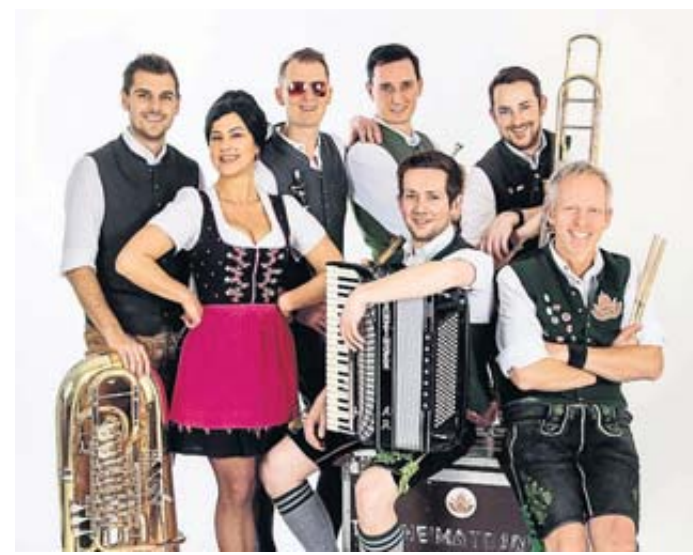
„The Heimatdamisch“ ziehen Chart-Hits und ausgewählten Rock- und Pop-Klassikern die Lederhos'n an.