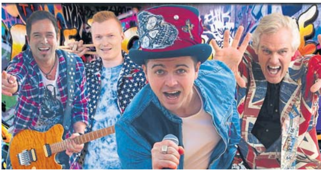
Pyro-Show, Konfettiregen und ein vibrierendes Hitspektakel gibt es beim Auftritt der „Toten Ärzte“.