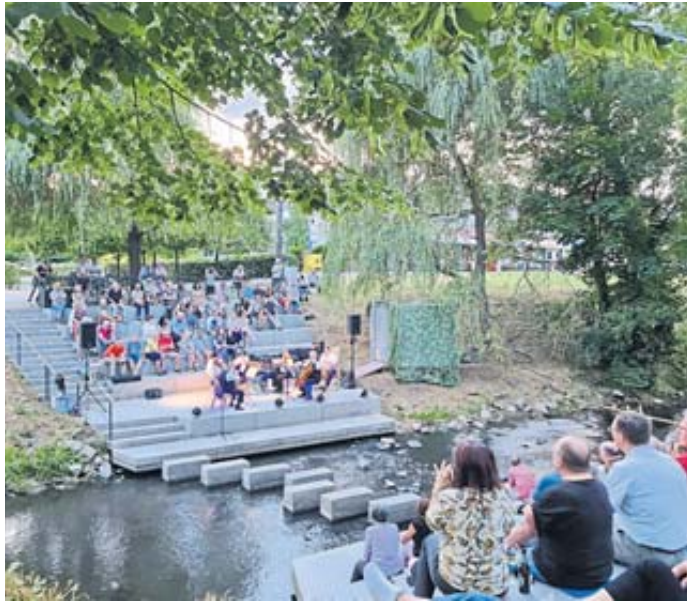
Am Mittwoch, 7. August, startet die Veranstaltungsreihe „KulturArena“.

Denn diese reichen von klassischen Sonaten – zum Beispiel von dem Hanauer Paul Hindemith – über die Arie