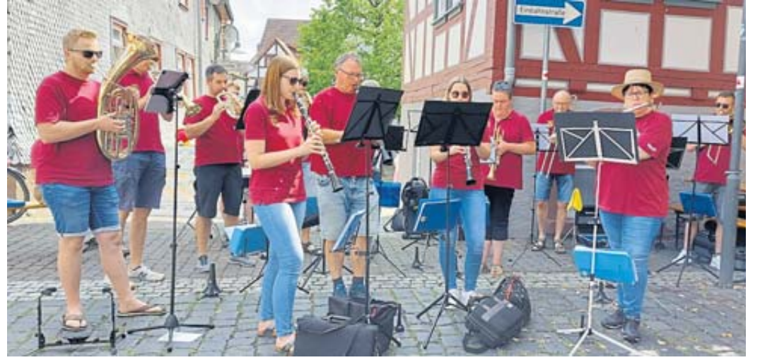
Zur Festeröffnung spielte der Musikverein Salmünster auf.