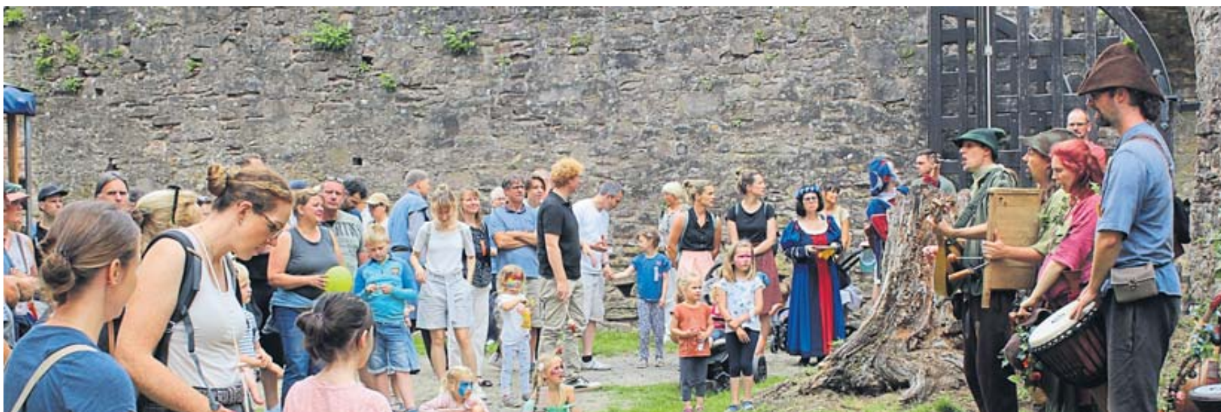
Im Hirschgraben zog der „Räuberhaufen Donnerkeil“ Groß und Klein an.

im Literaturcafé gab es Theatervorstellungen. An vielen Stellen war für das leibliche Wohl gut gesorgt. Auch der neue Kiosk am Kumpen fand guten Zuspruch. Ein Teil der Brüder-Grimm-Straße war Marktstraße mit vielen Ständen, wo Holzartikel, Strickwaren, Deko-Artikel, Schmuck, Bekleidungsgegenstände, Seifen, Karten und vieles andere erworben werden konnte. FGW