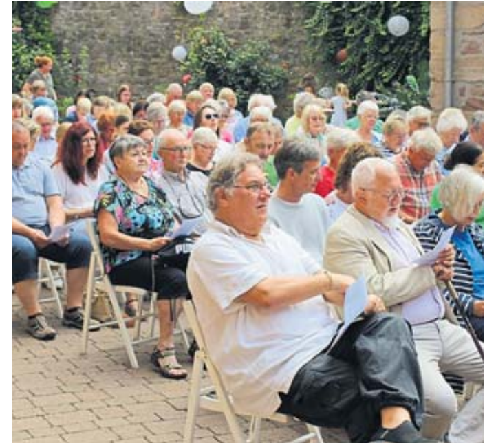
Gut besucht: der evangelische Gottesdienst im Theaterhof.