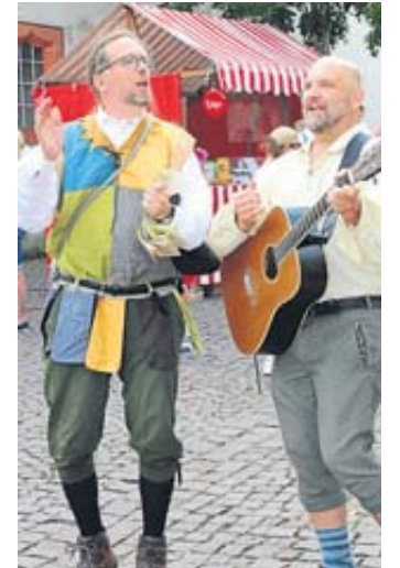
Allerorten waren in der Steinauer Altstadt Musiker und Sänger zu finden.

Im Brüder-Grimm-Haus fanden Märchenerzählungen statt, ebenso im Hirschgraben. Reichlich gesegnet war die Veranstaltung mit musikalischen Aktivitäten. An vielen Stellen gab es Musik, Gesang und Tanz. Zu Gast war auch die Alsfelder Marktspielgruppe. Im Theatrium wurde das Kinderstück „Jim Knopf und Lukas der Lokomotivführer“ gezeigt. Auch