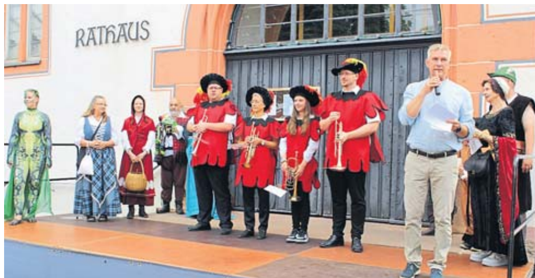
Bürgermeister Christian Zimmermann eröffnete im Beisein weiterer Beteiligter den Steinauer Märchensonntag.

Es ist auch das einzige Märchen, in dem mit einem Drachen gekämpft wird. Deshalb begegneten den Besuchern des Märchensonntags auch Drachen und Schwerter. Eine große Menschenmenge, insbesondere Kinder, war zwischen Schloss, Kumpen und Amtshof unterwegs. Ein sichtbarer Beweis des Hochbetriebs war, dass der überfüllte Mauerwiesen-Parkplatz.