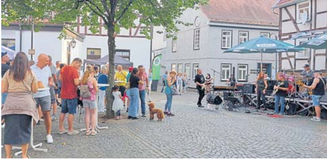
Auf dem Stadtmühlenplatz beim Angelverein unterhielt die Band Taste die Besucher.