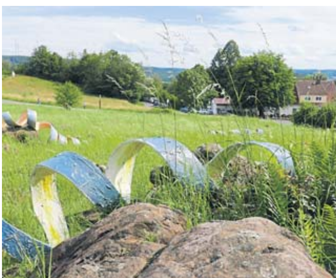
Skulpturen und Installationen von zehn Künstlerinnen und Künstlern säumen bis zum 15. September den Kunstpfad in Hutten-Heiligenborn.