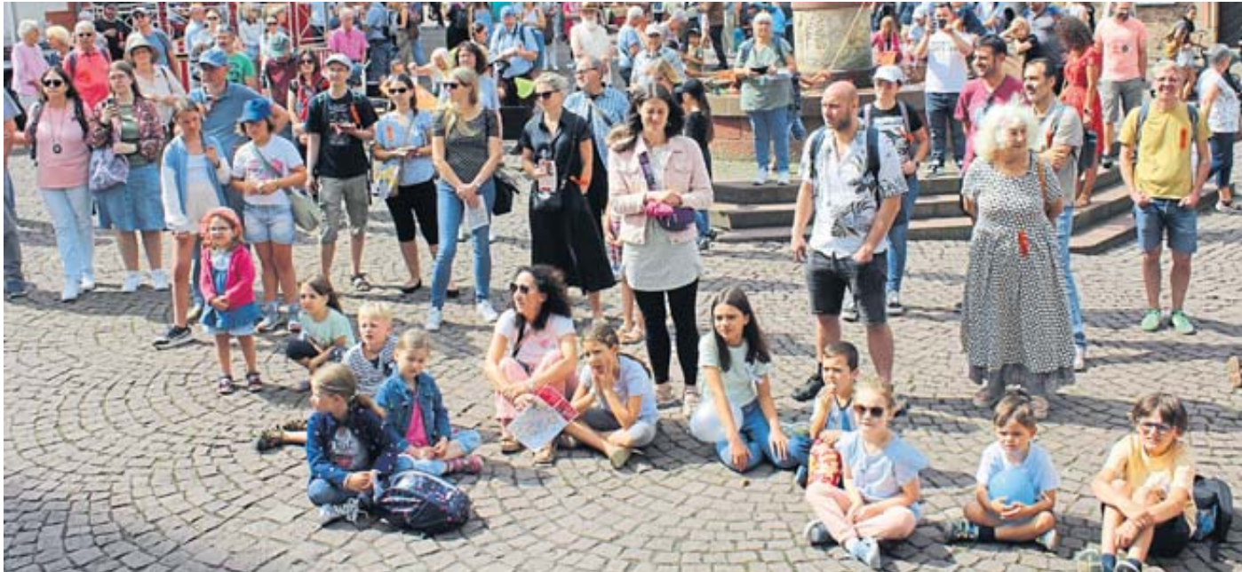
Viele Schaulustige hatten sich am Kumpen zur Eröffnung versammelt.