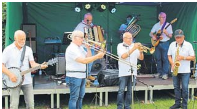
Die Dixie Oldies sorgten für die passende Musik zum Weitzelfest.

Eine weitere Neuerung: Anstelle der seither üblichen Brezelspiele gab es ein „Volks-Mofa-Fahren“, wozu die Liebhaber der knatternden Zweiräder eingeladen waren und welches auf Anhieb eine positive Resonanz fand.