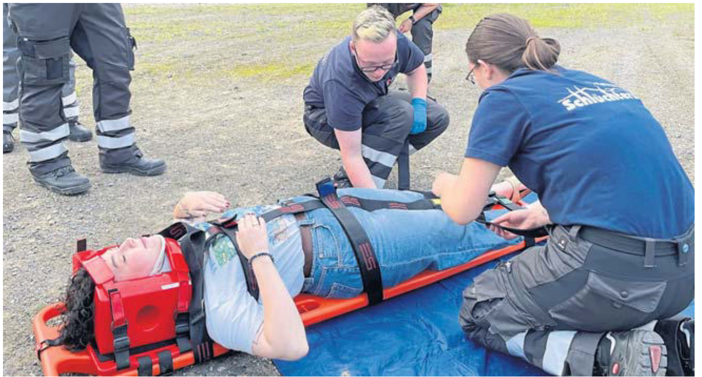
Alle Interessierten erhalten einen Einblick in die Ausbildungsarbeit der DRK-Bereitschaft.

Ein tolles Angebot gibt es ab Mittwoch, 4. September, wieder für Kinder und Jugendliche ab zehn Jahren. Alle zwei Wochen mittwochs von 17.30 bis 18.30 Uhr trifft man sich beim DRK-Ortsverein zu Unterricht, Spaß und Spiel. So werden bereits die jüngsten Interessierten spielerisch an diese ehrenamtliche Aufgabe herangeführt.