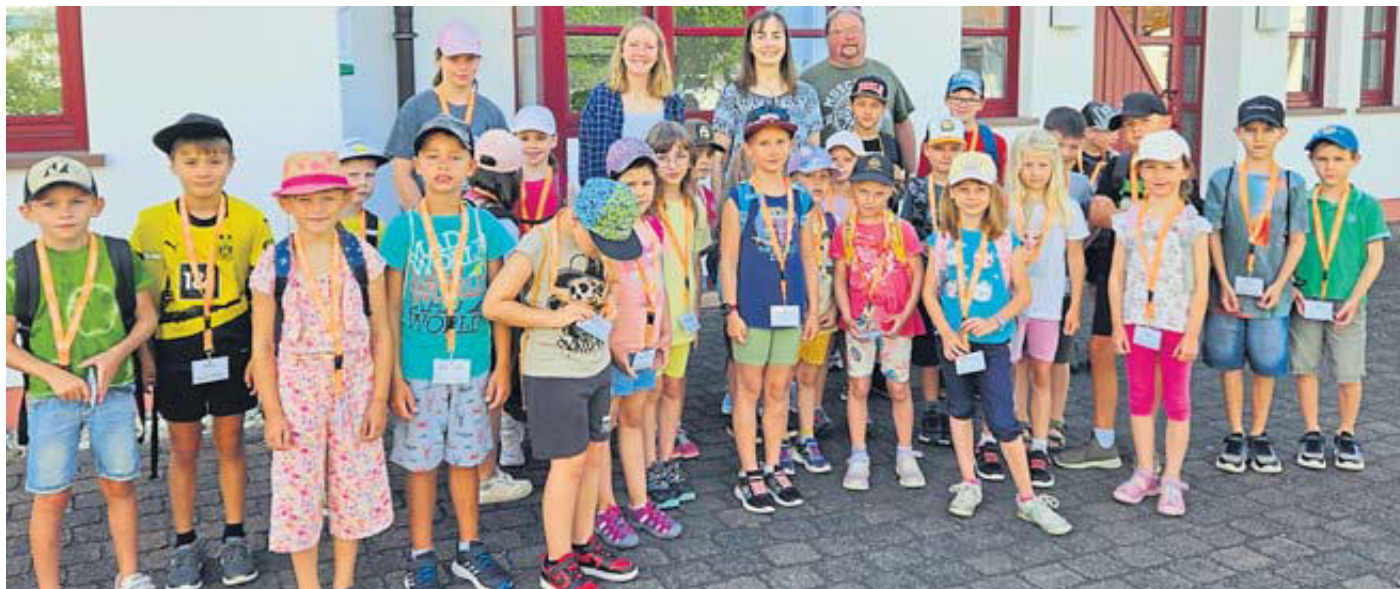
Die Sinntaler Grundschul Kinder freuen sich auf zwei Wochen Spiel und Spaß.

das Backhaus natürlich eine Rolle. Treffpunkt ist der Märchenbrunnen „Am Kumpen“. Der Rundgang wird eine Stunde dauern. Die Teilnahme kostet für Kinder 4 und für die Erwachsenen 7 Euro. Tickets gibt es im Verkehrsbüro, erreichbar unter (06663) 97388.