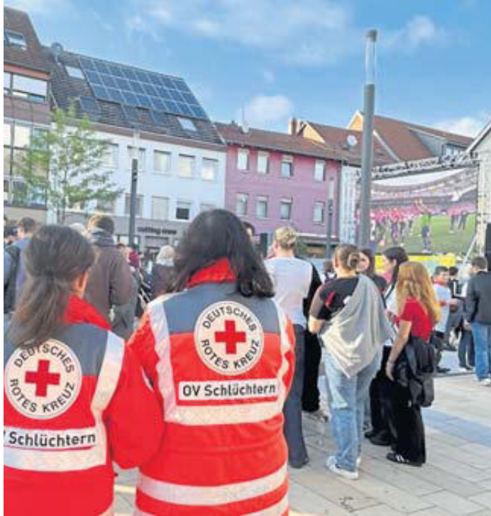
Während der Fußball-EM leisteten Mitglieder des DRK-Kreisverbandes Gelnhausen-Schlüchtern Sanitätsdienst