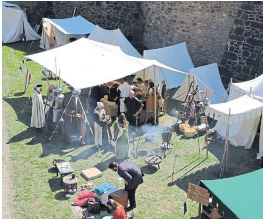
Unsere Archivaufnahme zeigt das „mittelalterliche Lagerleben“ am Steinauer Schloss.