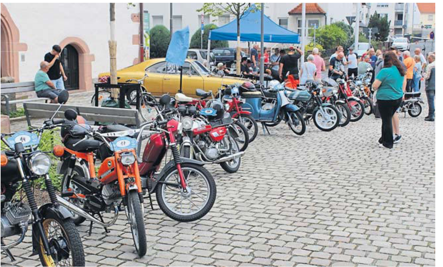
Bei einer Ausstellung am Stadthallen-Vorplatz konnten die historischen Zweiräder in Augenschein genommen werden.

Durch unterschiedliche Geschwindigkeiten der einzelnen Zweiräder gab es auch unterschiedliche Fahrzeiten. Die ersten Teilnehmer waren schon wieder nach einer halben Stunde zurück, andere benötigten bis zur einer Stunde. Die Zeit wurde jedoch