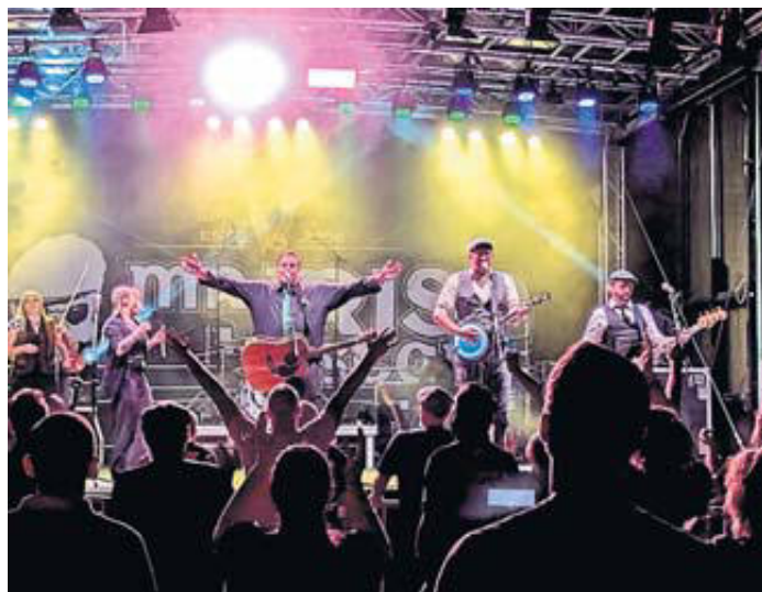
Der Schlüchterner Kultursommer 2024 legte am vergangenen Wochenende auf der Mauerwiese einen fulminanten Start hin.