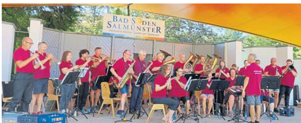
Der Musikverein Cäcilia spielte zur Unterhaltung der Festgäste auf.