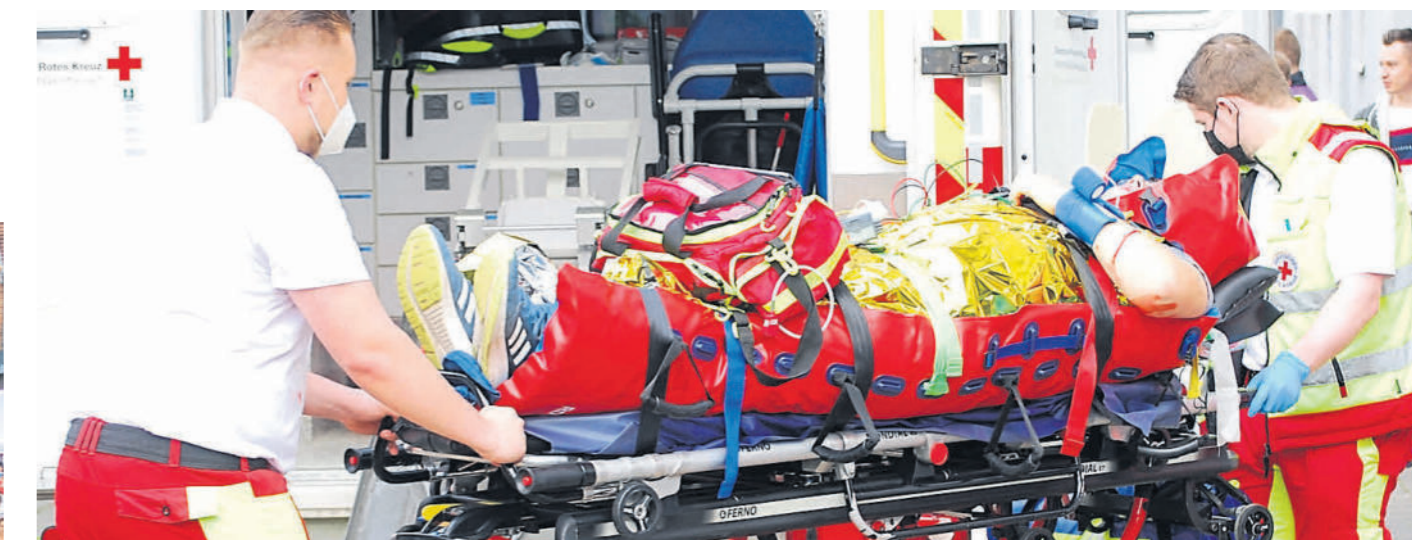
Verletzte Personen müssten schnellstmöglich vom Rettungsdienst versorgt und in eine Klinik gebracht werden.