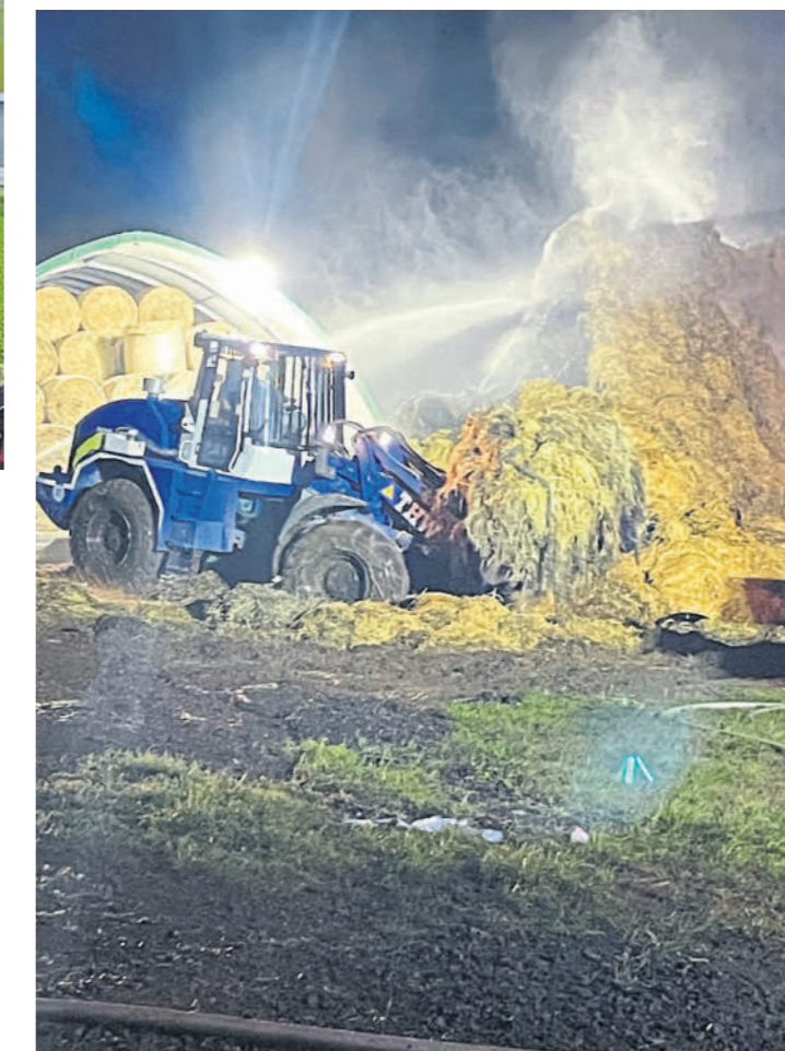
Der THW-Radlader im Einsatz bei einem Rundballenbrand.

Am Tag der offenen Tür präsentiert sich das THW aus Steinau mit der Fachgruppe Räumen, mit Radlader und Kettenbagger. Den Kettenbagger gibt es erst seit kurzen im Ortsverband und wurde zu 100 Prozent von Förderverein des THW Steinau finanziert. Im Ortsverband Steinau versehen derzeit 30 Frauen und Männer ihren Dienst in der Einsatzabteilung sowie etwa zehn Jugendliche in der Jugendgruppe.