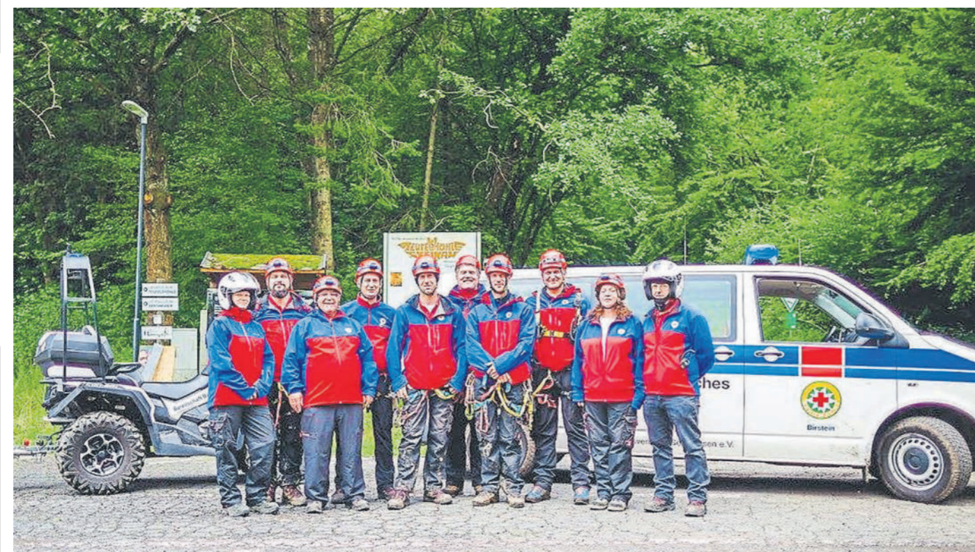
Die Bergretter bringen ihr geländegängiges ATV-Einsatzfahrzeug und verschiedenste Rettungs- und Sicherungs-Einsatzgeräten mit.

oder seine Frau stehen, auch ein geringer Jahresbeitrag hilft bereits, um zum Beispiel die persönliche Schutzausrüstung eines jeden Aktiven zu verbessern. So können die Retter jedem Bürger der in Not geraten ist, noch besser helfen. Wer am Tag der offenen Tür sich entschließt Mitglied der Feuerwehr zu werden, hat die Chance, einen von drei Einkaufsgutscheinen des Einrichtungshauses Rudolf im Wert von jeweils 100 Euro zu gewinnen. Wer sich näher informieren möchte, wie er die Feuerwehr unterstützen kann, ist herzlich zum Tag der offenen Tür eingeladen und kann dort aus erster Hand alles weitere erfahren. Mehr Infos: feuerwehr-schluechtern.de https://de-de.facebook.com/Feuerwehr.Schluechtern/