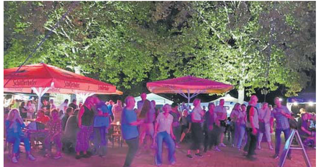
Drei Tage herrschte im Kurpark beste Feststimmung (hier am Eröffnungsabend).