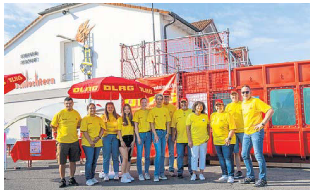
Die Freizeittaucher der DLRG Schlüchtern.

Die DLRG-Ortsgruppe Schlüchtern besteht seit 85 Jahren. Ihr vorrangiges Ziel ist die Vermeidung von Wasserunfällen und dem Ertrinkungstod. Der Tätigkeitsschwerpunkt der DLRG Schlüchtern liegt in erster Linie in der Ausbildung. So werden Nichtschwimmer zu Schwimmern und Schwimmern zu Rettungsschwimmern ausgebildet. Früher hatte die DLRG Schlüchtern auch Einsatztaucher, die hessenweit in Rufbereitschaft waren und auch immer wieder zum Einsatz kamen. Über die Jahre hat sich dieser Schwerpunkt verändert, und man beteiligt sich nun vorwiegend im Wasserrettungs-