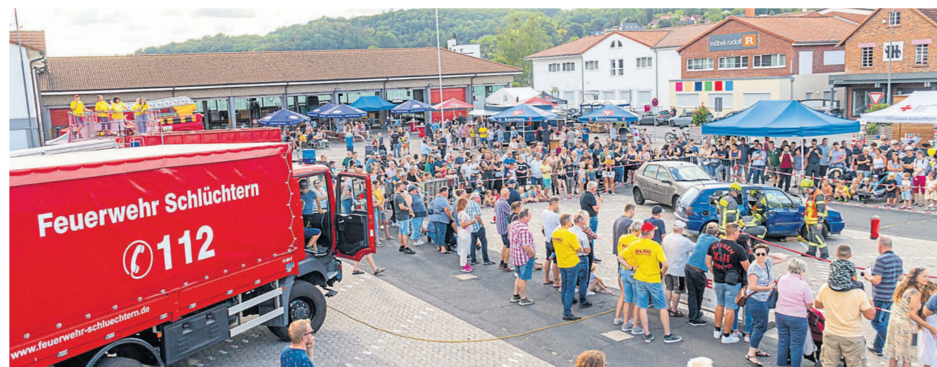
Die Vorfürhungen der Einsatzkräfte auf der Aktionsfläche werden sicher wieder bei Groß und Klein auf Interesse stoßen.

Um Retter auf vier Pfoten geht es dann um 13.30 Uhr, wenn die Rettungshundestaffel Main-Kinzig ihr Können zeigt. Schon in den Vorjahren begeisterten die kleinen Helfer und ihre HundeführerInnen mit Ihren tollen Vorfürhungen. Das Herz großer und kleiner Bagger-Fans wird gegen 14.30 Uhr höherschlagen, wenn das THW aus Steinau seinen neusten Zuwachs im Fuhrpark präsentiert. Ein großer Kettenbagger steht ihnen künftig für die schwere Räumung von Schutt und Trümmern zur Verfügung. Die findigen Einsatzkräfte des THW zeigen am Tag der offenen Türen erstmals eine Löschanlage, mit der etwa brennende Rundballen von innen gelöscht werden können. Bei der „Technische Ret-