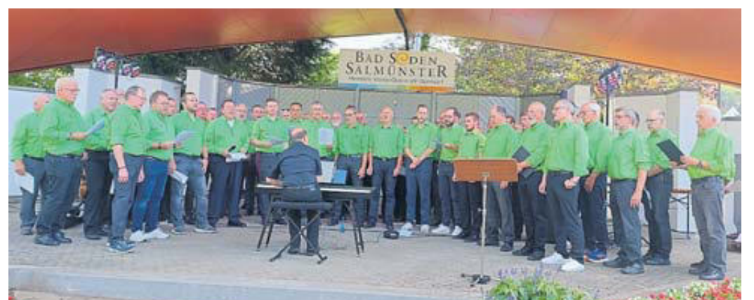
Der Männerchor Frohsinn präsentierte eine Liedauswahl.

rück. Natürlich halten die Salzsieder den Siedevorgang durch etliche Arbeitsschritte, etwa durch Rühren der Sole, in Takt. Das in Säckchen abgefüllte Salz wird gerne am Stand der Salzsieder gekauft. Es ist nicht nur ein nettes Mitbringsel, sondern auch praktisch einsetzbar. Den Salzsiedern des Schützenvereins ist es zu danken, dass in der modernen Zeit die harte Arbeit der Salzgewinnung präsent bleibt. Zudem beantworten sie viele Fragen rund um die Geschichte des weißen Goldes, das den Menschen der Region einst den Lebensunterhalt sicherte und heute eine moderne medizinische Aufgabe erfüllt. PK