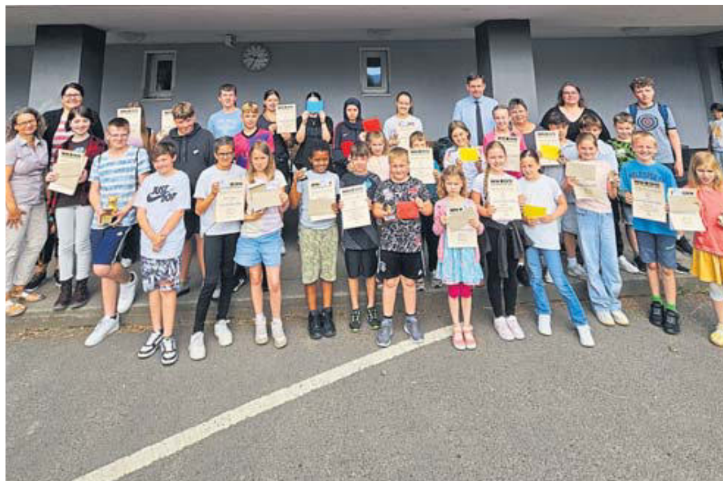
Schulleitung und Förderverein gratulieren den Siegerinnen und Siegern des diesjährigen Lesemarathons der Henry-Harnischfeger-Schule Bad Soden-Salmünster.