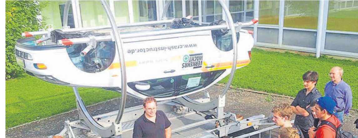
Im Überschlagssimulator kann man die Befreiung aus einem auf dem Dach liegenden Auto üben.