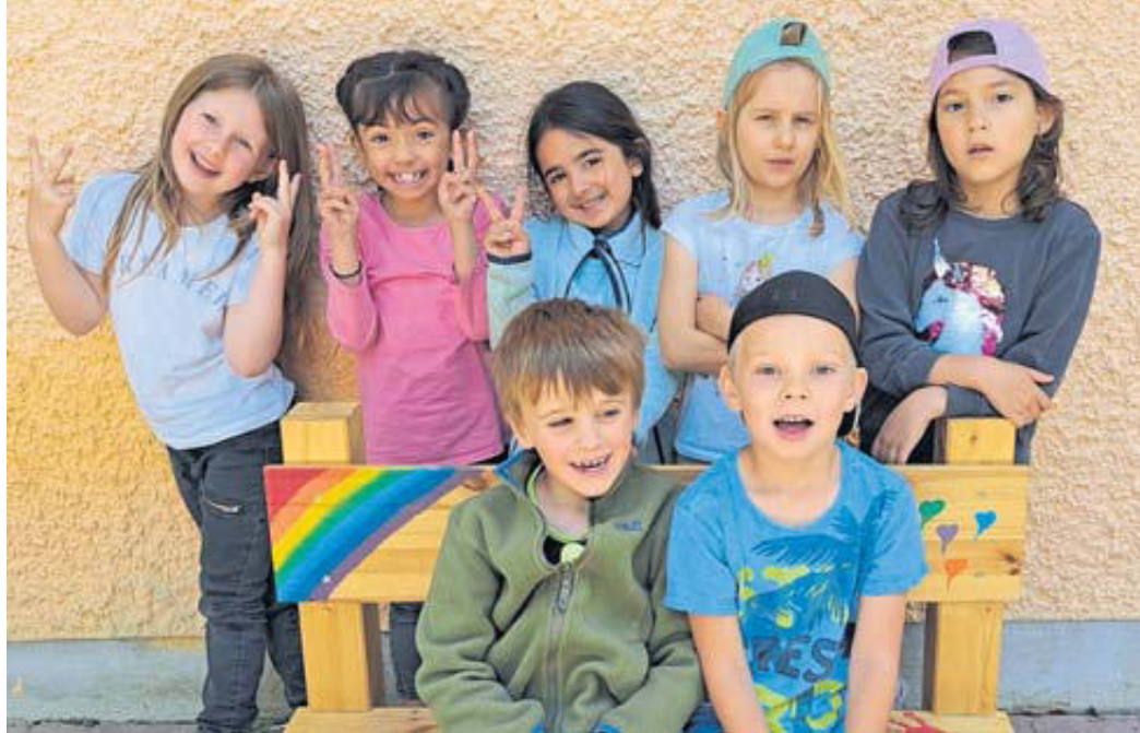
Fröhliche Gesichter bei den Kindern der Arche.