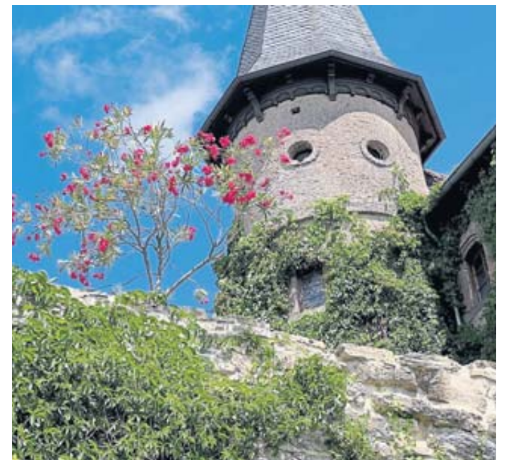
Für den Denkmaltag hat der Burgvogt wieder ein kleines Burgfest im romantischen Burghof geplant.

Auswahl von interessanten wie auch manchmal kuriosen Gerätschaften früherer Zeiten, wie etwa einer Mehlsackausklopemaschine und allerlei anderen „Rätselgeräten“. Oder man erfährt etwas zum Ursprung der „Stichprobe“ und anderen noch heute – oft im übertragenen Sinn – verwendeten Begriffen. Der Festbetrieb im Außenhof beschränkt sich bei diesem Fest auf die Verköstigung mit der bewährten Brandensteiner Apfelbratwurst sowie Grillkäse vom Grill sowie Blechkuchen und Kaffee. Im Ausschank gibt es Mottener Pilsgerstoff aus der Rhön, Brandensteiner Bio-Apfelsaft, Apfelwein und Wasser. BVB