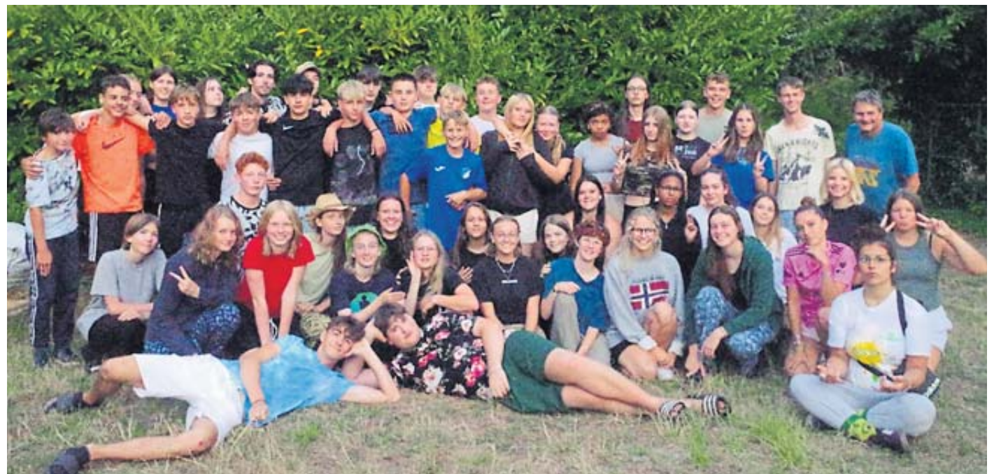
Mehr als 40 Jugendliche führen mit der Sommerfreizeit der evangelischen Jugend nach Frankreich.