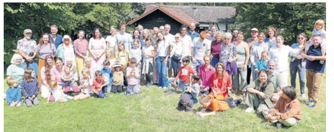
72 Kinder und Erwachsene verbrachten bei einer Familienfreizeit ein Wochenende in der ehemaligen Waldschule in Katholisch Willenroth.

Als nächstes findet speziell für die Menschen aus der Nachbarschaft und der Region der Tag der offenen Tür am Samstag, 7. September, von 11 bis 17.30 Uhr statt. Besonders für Kinder hat das ehrenamtliche Team ein abwechslungsreiches Programm unter anderem mit Basteln, Puppentheater, Sportturnier, Geschichtenecke, Kinderschminken, Limonadenbar und Eisstand zusammengestellt. Auch für das leibliche Wohl wird bei Kaffee, Kuchen und Herzhaftem gesorgt sein. Näheres unter info@samarpan-meditation.de oder unter (01577) 2782252. BWB