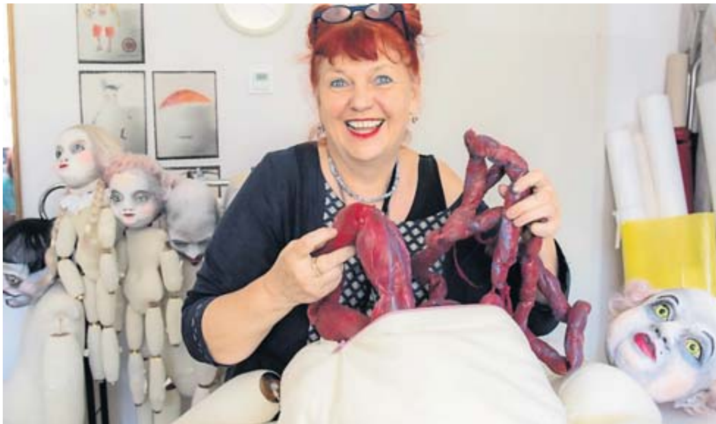
Mit Puppen lassen sich makabre Situationen, etwa brutal herausquellende Gedärme, auf der Bühne darstellen.

Die vielseitige Künstlerin arbeitet nicht nur als Planerin und Entwerferin an großen deutschen Bühnen oder