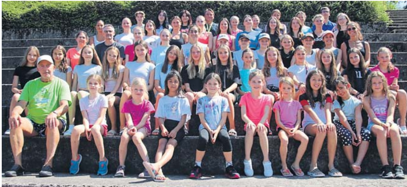
Das Foto zeigt die Teilnehmer des diesjährigen Sommertrainingslagers des TV Steinau im JZ Ronneburg mit den Trainern und dem Großteil der Aktiven.