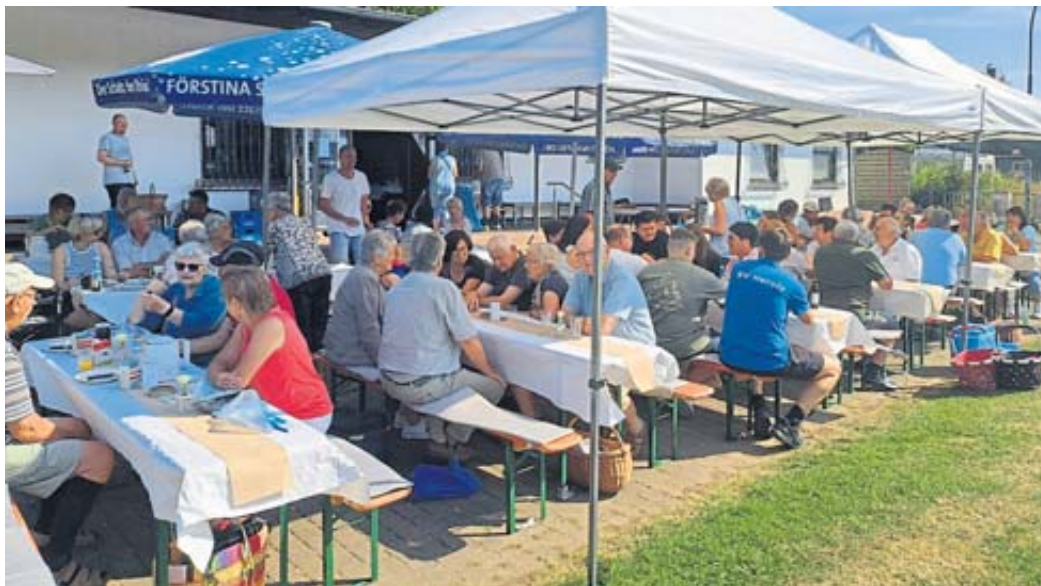
Herolzer frühstücken unter sonnigem Himmel

BAD SODEN – Das Steinauer Marionettentheater „Die Holzköpfe“ lädt zu zwei Aufführungen im historischen Konzertsaal der Spessart Therme Bad Soden ein. Am Samstag, 14. September, um 19 Uhr wird das klassische Stück „Dr. Faust“ aufgeführt. Für die kleinen und großen Märchenliebhaber gibt es am Samstag, 15. September, um 15 Uhr eine Vorstellung des Märchens „Der gestiefelte Kater“. Eintrittskarten können unter der Nummer (06663) 245 oder per Mail an dieholzkoeppe@web.de reserviert werden.