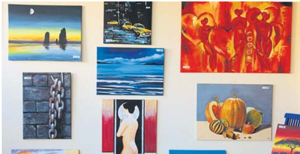
Solche Gemälde wie zuletzt vor drei Jahren können erneut bei der Kulturwoche in Elm im kommenden Jahr bewundert werden.