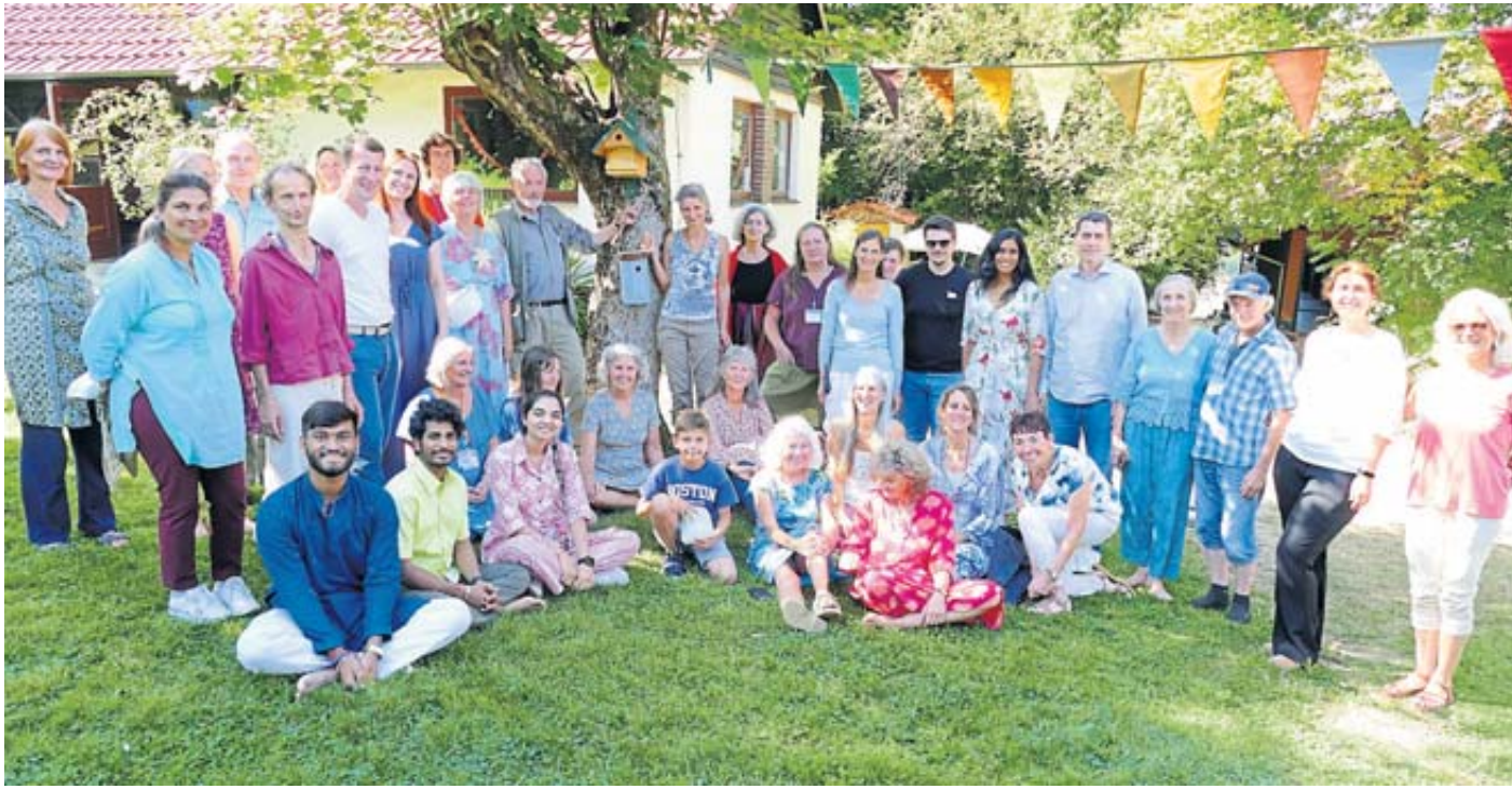
Bei idealem Wetter war der Tag der offenen Tür ein voller Erfolg.