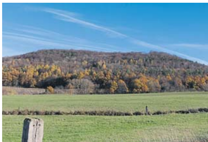
Diente der heute bewaldete Bellinger Berg früher dem Weinanbau?

Mittags heißt es „Willkommen am Dorfplatz Bellings“ mit Bellinger Platt sowie Matthias Panzoff und zwei Liedern in Mundart. Doch bei der geistigen Nahrung soll es nicht bleiben. Für eine Bewirtung mit Speisen und Getränken von Wellfleisch oder Schweineschnäuzchen mit Meerrettich und Brot sowie für die Vegetarier mit Grillkäse und Bratkartoffeln wird bestens gesorgt sein.