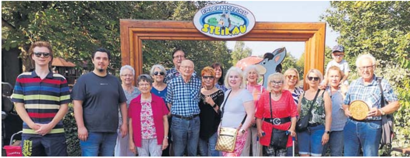
Die Mitglieder des Wandervereins waren zum Grillfest in den Erlebnispark gekommen.