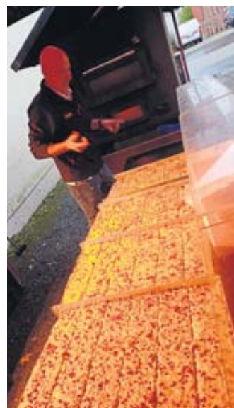
Knusprigen Zwiebelkuchen gab es von der Bäckerei Fink.

Bei freiem Eintritt spielten die Dixie-Oldies auf und es gab Wein, frischen Federweißer und Cocktails, leckere Häppchen, Zwiebelkuchen, guten Kaffee. BWB