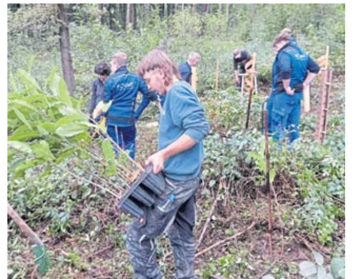
Die Azubis aus den Klimapakt-Mitgliedsunternehmen pflanzen klimaresistente Laubbäume.

Adresse. Damit können die Azubis auch noch nach Jahren, „ihren“ gepflanzten Baum finden und besuchen. Aus den Klimapakt-Mitgliedsunternehmen hatten