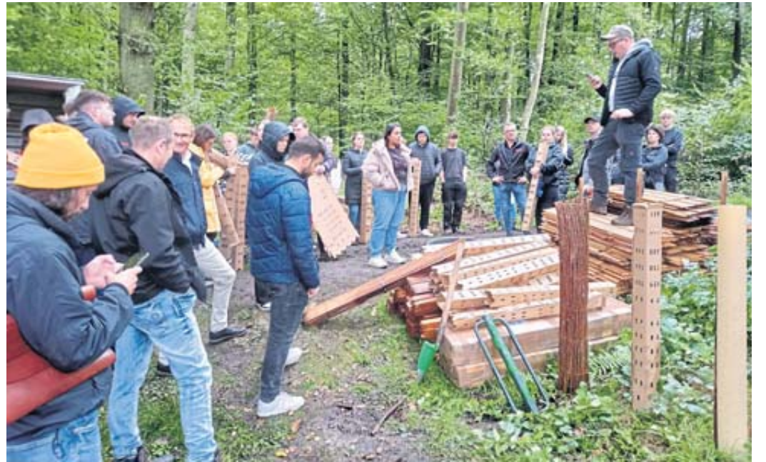
Mithilfe vorbereiteter QR-Codes konnten die Azubis direkt an der Fläche, den Pflanzort und die dazugehörigen Baumsteckbriefe herunterladen.