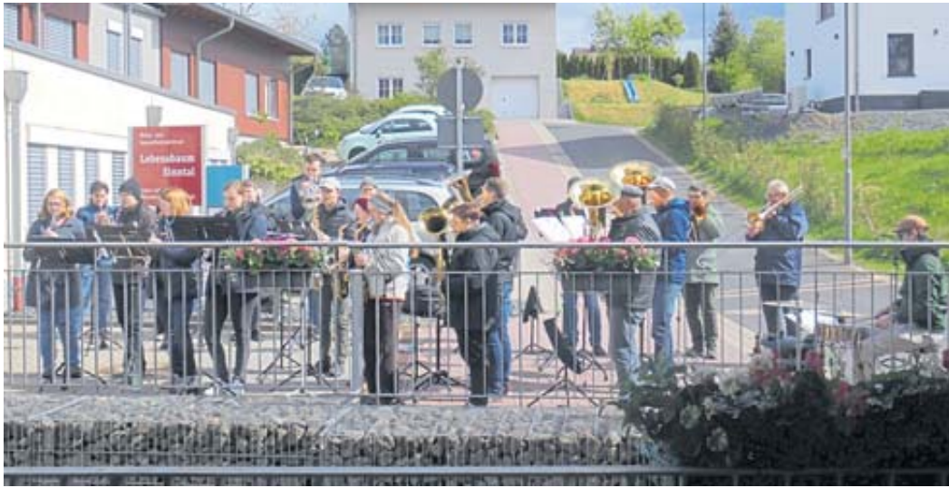
Es war ein tolles Hofkonzert, das auch in den benachbarten Straßen des Lebensbaumes zu hören war.