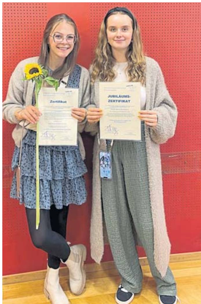
Bei der Kindervilla Kunterbunt kann man stolz sein über den Status als zehn Jahre zertifizierten Einrichtung.

Jüngst bekam die Kindervilla ein Jubiläumszertifikat für das vorbildliche Engagement der Einrichtung verliehen „Zehn Jahre rundum mundgesunde Kindertagesstätte“ und wir gehören zu den wenigen, seit Beginn an zertifizierten Einrichtungen. BWB