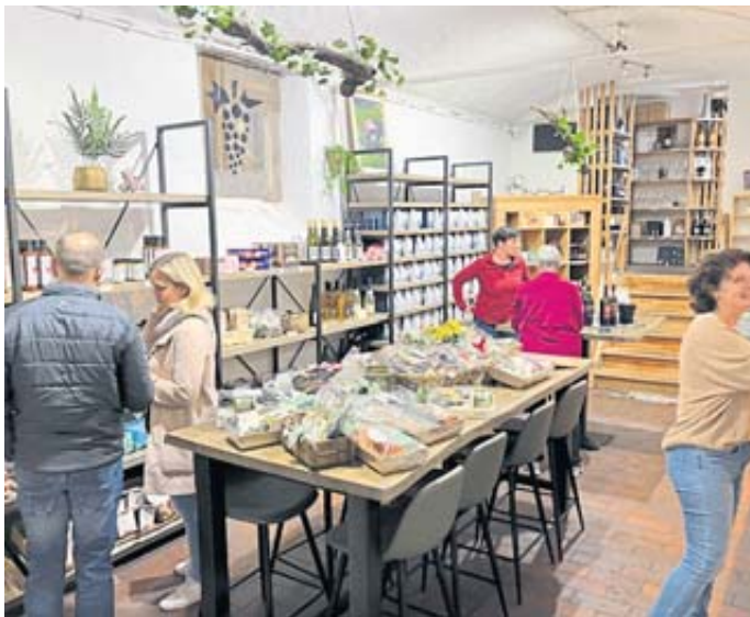
Während der After-Work-Party blieb genügend Zeit, im Vinum zu stöbern.