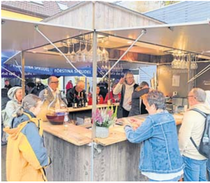
Bei Speisen, Getränken und Gesprächen den Feierabend genießen, ist ein Erfolgsgeheimnis der After-Work-Partys.