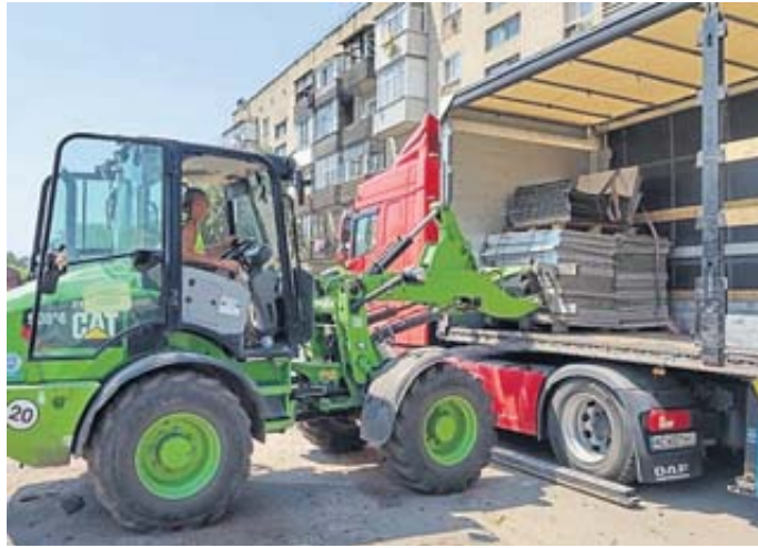
Die gespendeten Solarmodule werden in Trostianets entladen.

„Diese Hilfstransporte von Solarmodulen sichern nicht nur die Versorgung von Krankenhäusern und Kinderheimen, sondern sind zugleich