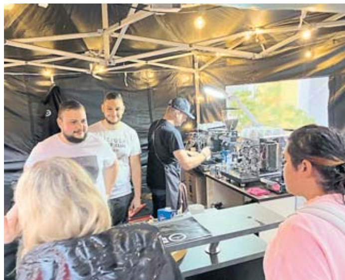
Leckere Kaffeespezialitäten wurden am Stand von espresso36 serviert.

Öffnungszeiten: Mo. - Fr. 9:00-20:00 Uhr *Neu*Neu* Samstag 8:30-20:00 Uhr Angebote gültig vom 05.10. - 11.10.2024 Höbäckergweg 24 - 36381 Schlüchtern