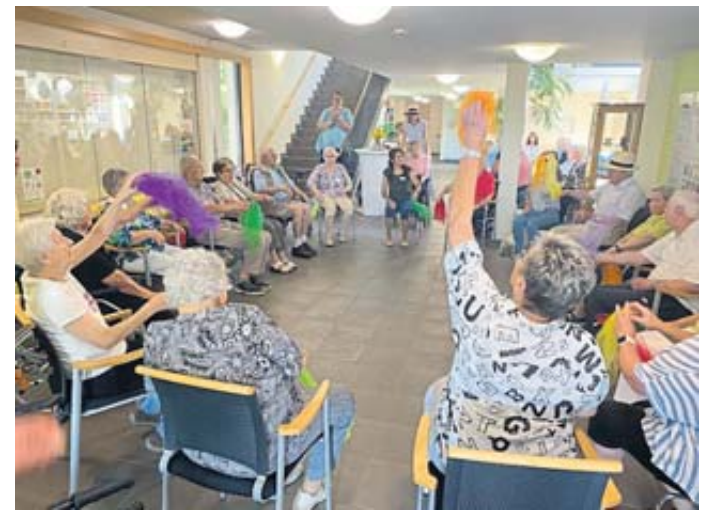
Der Sitztanz brachte die Senioren in Schwung.

Ein Bewegungsprogramm mit Sitztanz brachte die Senioren in Schwung, Live-Musik von „Gaudi Gery“ sorgte für gute Stimmung. Den Abschluss bildete am Nachmittag eine Andacht mit musikalischer Umrahmung. BWB