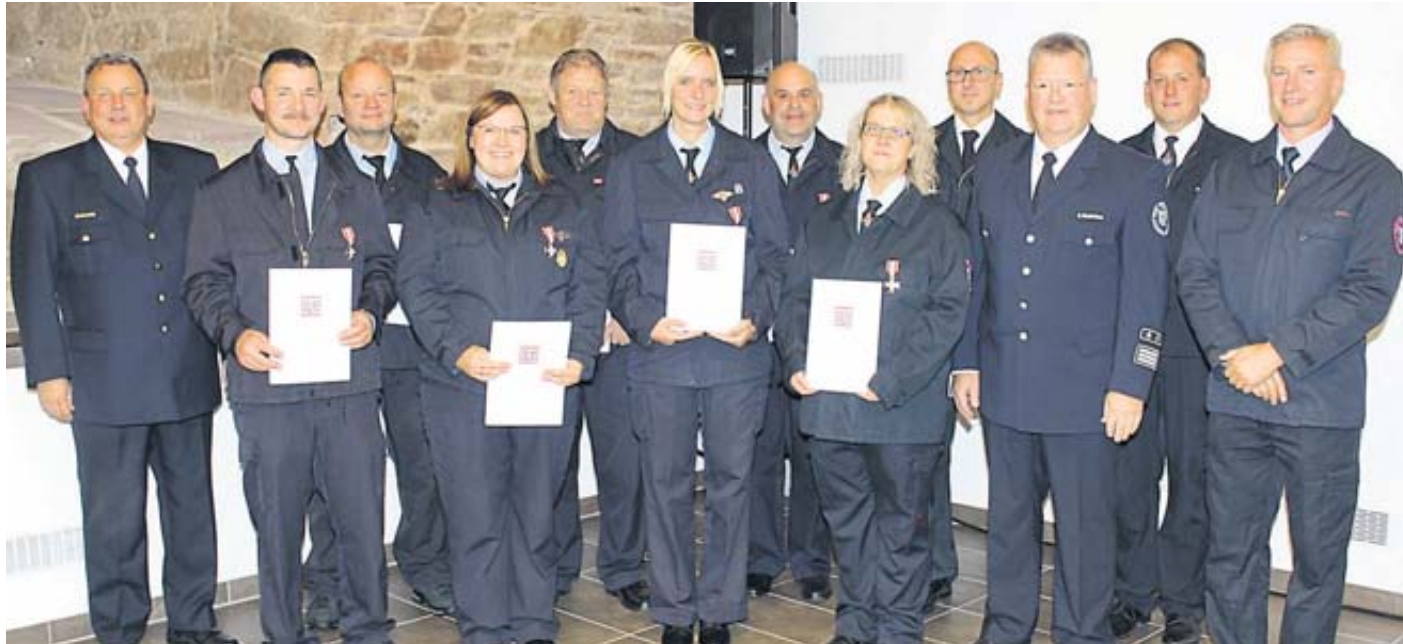
Diese Männer und Frauen wurden für 25jährigen aktiven Feuerwehrdienst mit dem Silbernen Brandschutzehrenzeichen ausgezeichnet.