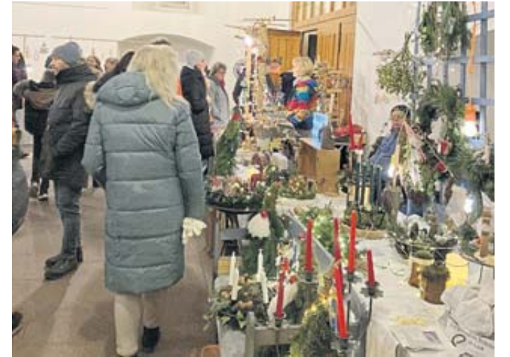
Rechtzeitig vor dem ersten Advent wurden in der Markthalle des Rathauses hübsch dekorierte Adventskränze angeboten.