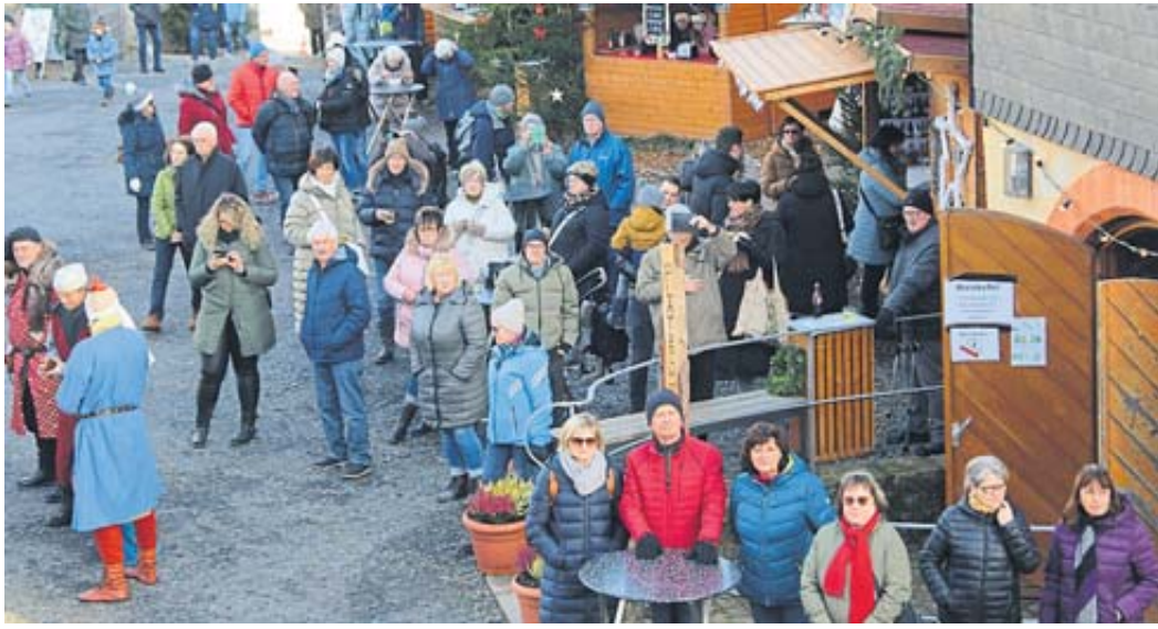
Viel Betrieb herrschte schon zur Eröffnung des Schwarzenfeller Weihnachtsmarktes im Burg-hof.