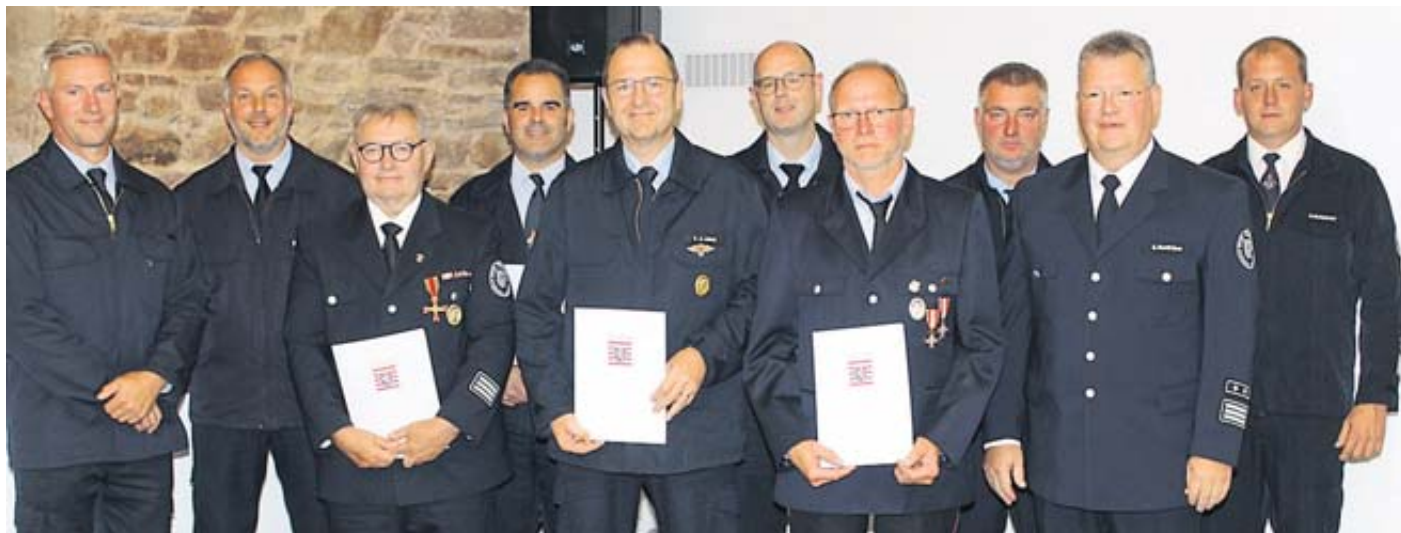
Diese Männer erhielten Anerkennungsprämien für 30 beziehungsweise 40 Jahre aktiven Feuerwehrdienst.