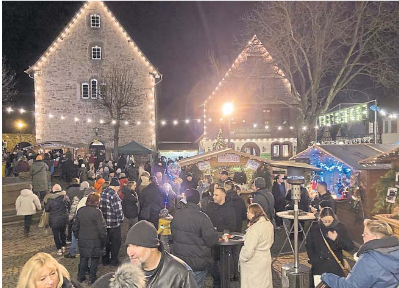
Wenn die Dämmerung einsetzte und die Beleuchtung den Weihnachtsmarkt in ein heimeliges Licht tauchte, füllte sich der Kumpen mit Besuchern aus nah und fern.