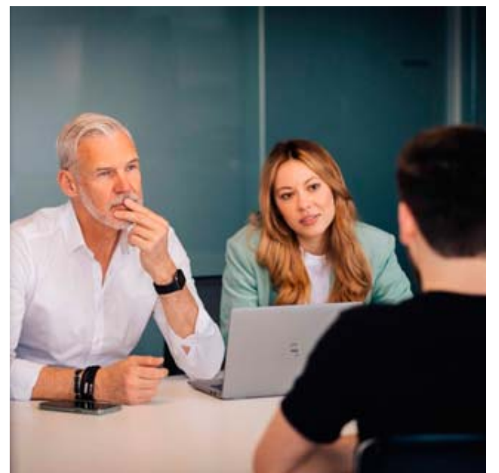
Bitte keine Standardphrasen: Die Nennung von ein bis zwei ehrlichen Schwächen reichen im Vorstellungsgespräch aus, um Ehrlichkeit und Selbstreflexion zu beweisen.

Eine weitere Möglichkeit ist, auch eine Schwäche aus dem Privatleben zu nennen, um die beruflichen Schwächen geschickt zu relativieren. Das Wichtigste laut Kuyas: Die genannte Schwäche muss authentisch wirken, denn künstliche oder unehrliche Antworten hinterlassen einen schlechten Eindruck. mag