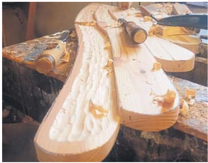
Die Flügel des Engels in Bearbeitung auf der Werkbank.

SCHLÜCHTERN – Die Weihnachtsfeier für die älteren Bürgerinnen und Bürger findet am Sonntag, 15. Dezember, ab 14 Uhr in der Stadthalle Schlüchtern statt. Alle Seniorinnen und Senioren sind eingeladen, bei einem vorweihnachtlichen Programm mit Kaffee und Weihnachtsgebäck, einen besinnlichen Nachmittag vor dem Fest zu verbringen. BWB