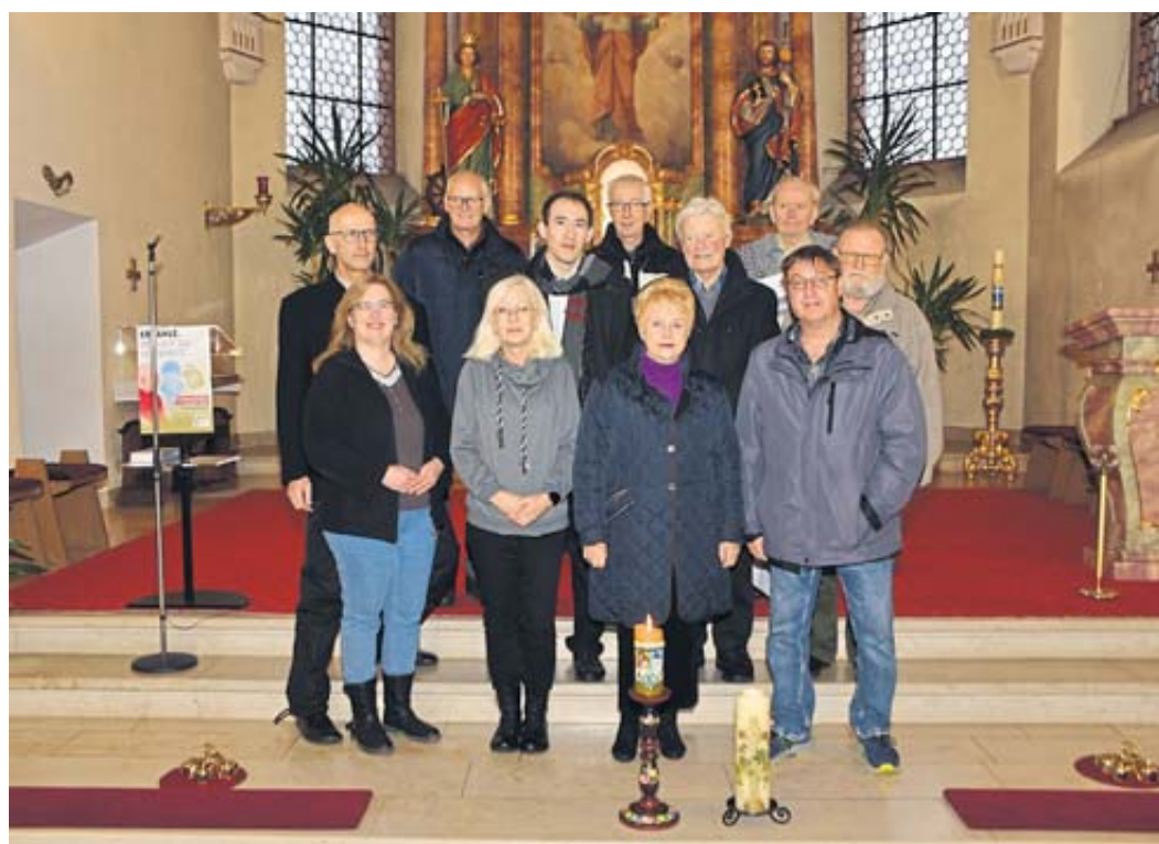
Die Aufnahme zeigt die Teilnehmer in der Herolzer Kirche.

Geschichte mit Tieren trug Rudolf Gerr vor: Wolfsfährte. Mit der Bitte um gegenseitige Wertschätzung und respektvolle Begegnung endet das Stück. Nach einem Abschlusswort und dem geistlichen Segen durch Pater Urselmann ertönte zum Abschluss das „Feieromd-Lied“, erstmals auf der Grundlage eines Satzes für einen Männerchor vorgetragen. Den Abschluss bildete ein ausführliches Zusammensein im Café Fabrice in Schlüchtern, wo Altes und Neues beratscht wurden. Schon am Vormittag hatte man am Gedenkstein vor dem Friedhof in Schlüchtern ein Gebinde niedergelegt und mahnende Worte zum Frieden gehört. BWW