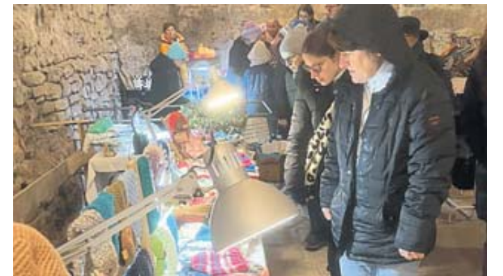
Der Schlosskeller bietet in jedem Jahr eine tolle Kulisse für die Aussteller und ihr Angebot.