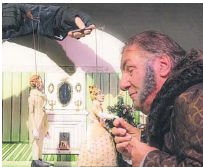
Die weltberühmte Weihnachtsgeschichte von Charles Dickens' in der Version des Theatrium.

aufgrund ihrer Habgier und Selbstsucht dazu verdammt ist, ewig als Geist die Welt zu durchstreifen. Marley warnt Scrooge davor, dass ihm ein ähnliches Schicksal blüht, wenn er sich nicht bessert und kündigt seinem Freund drei weitere Besuche aus dem Jenseits an. Diese Warnung nicht ernst nehmend, legt Scrooge sich schlafen – bis die Geister der vergangenen, gegenwärtigen und zukünftigen Weihnacht an seinem Bett steht und sich mit ihm auf eine Reise begeben. Schaffen es die guten Geister der Weihnacht, das Herz des alten Griesgrams zu erwärmen? Die Karten können unter www.theatrium-steinau.de oder unter der Hotline (06663) 3899715 reserviert werden. Weitere Termine des Stücks sind: Samstag, 14. (20 Uhr), Sonntag, 15. (16 Uhr) und Donnerstag, 26. Dezember (20 Uhr). BWB