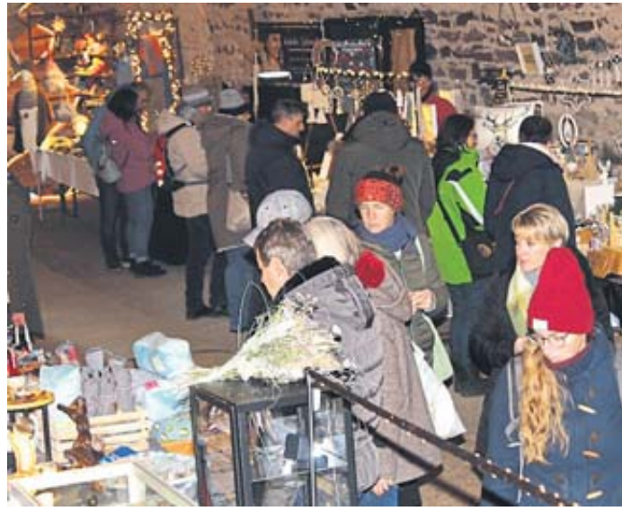
Im historischen Keller des Marstalls gab es viele Stände mit weihnachtlichen Artikeln.