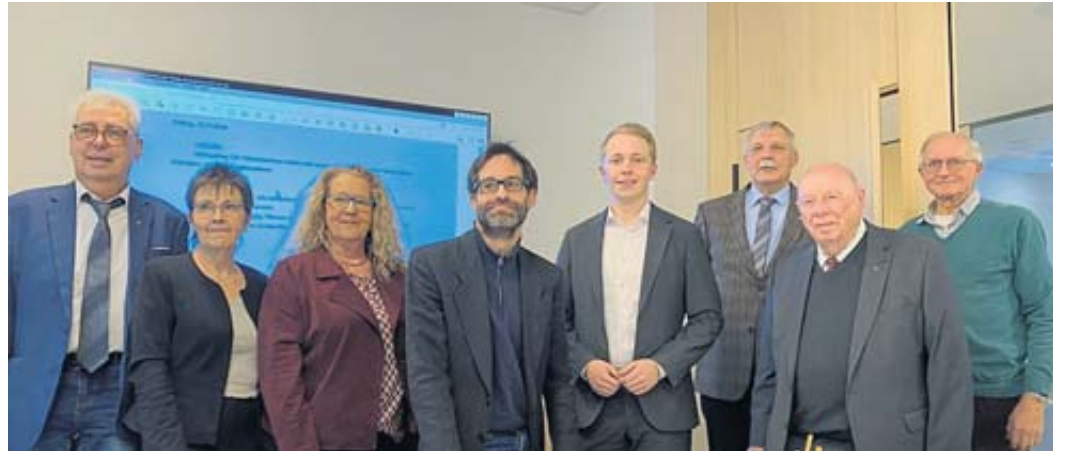
Die Teilnehmer des Seminars tauschten sich über politische und gesellschaftliche Themen aus.