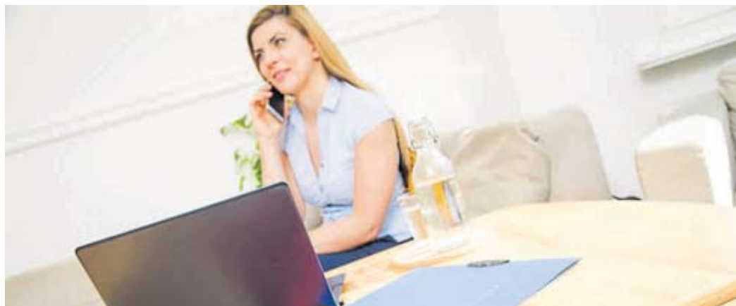
Wer eine neue Stelle sucht und bei einer anderen Firma anfangen will, kann sein berufliches Netzwerk anzapfen.