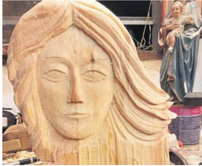
Feine Züge zieren das Gesicht des Engels, das von halblangem Haar umspielt wird.