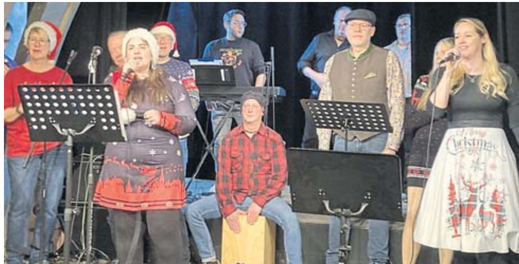
Gemeinsam und nicht im Wettstreit: Die Akteure des Steinauvision Song Contest hatten zum weihnachtlichen Singen ins Theatrium eingeladen.

Nahrung für die Seele boten die kulturellen Angebote, die es zum Steinauer Weihnachtsmarkt traditionell gibt. Weihnachtliche Musik