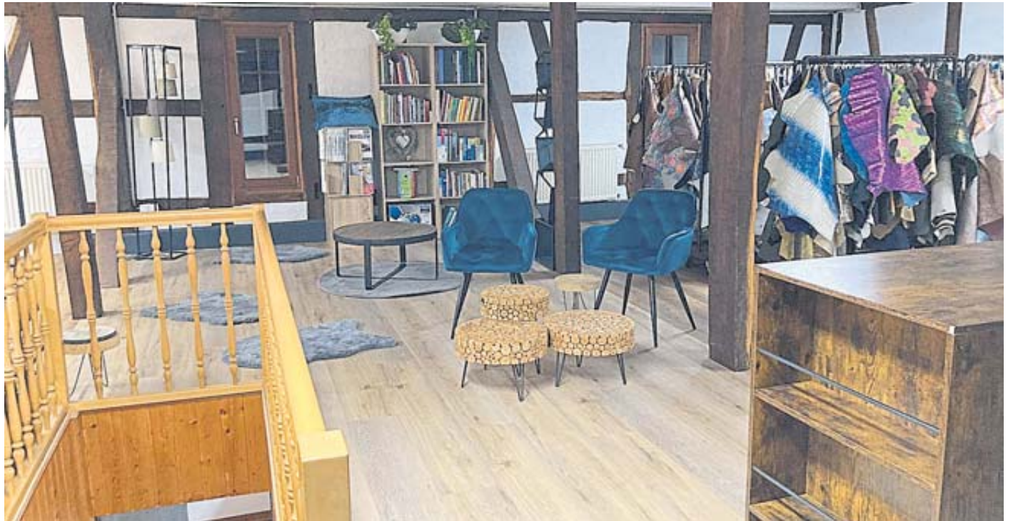
Die Footopia-academy ist ein Wohlfühlort, an dem gleichgesinnte Menschen zusammenkommen, Spaß haben und in neue Welten eintauchen können.

Traum ist endlich in Erfüllung gegangen: Die erste Event-Orthopädie-Schuhtechnik weltweit ist jetzt Teil unseres magischen Footopia-Stores. YIPPIE! Wir danken euch von Herzen, dass ihr mit uns die Neueröffnung und gleichzeitig die wildeste Party des Jahres gerockt habt! Für diesen Sprung in völlig neue Dimensionen haben wir natürlich auch unsere Räumlichkeiten erweitert und lassen sie zudem in einem neuen, rebellischen Glanz erstrahlen. Footopia ist nicht mehr nur ein Ort des Handwerks und des gegenseitigen Helfens. Es ist ein Wohlfühlort, an dem gleichgesinnte Menschen zusammenkommen, Spaß haben und in neue Welten eintauchen können. Mit dem Umbau haben wir definitiv eine weitere Rakete ins All geschossen, die euch mit auf eine footastische Reise nimmt. Ganz neu ist jetzt ein kuscheliger Wartebereich, der euch wortwörtlich eure Wartezeit veruscht "grins". Regelmäßig gibt es neue Leckereien, die eure Geschmacksknospen in ekstatische Zustände versetzen. Bei uns gibt es keine gewöhnlichen Snacks, sondern extravagantes Fingerfood, das von Herzen kommt. Jetzt freut ihr euch bestimmt schon aufs Warten, oder? ; ) Und für die großartigen Kinoabenteuer in unserer Live-Werkstatt haben wir sogar knusprige Le-