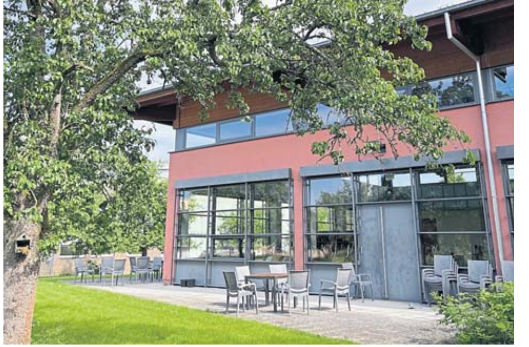
Die Aufnahme zeigt die Mensa der Schule.

In den Klassenräumen der jetzigen und kommenden fünften Klassen wird das pädagogische Konzept der Salmünsterer Gesamtschule vorgestellt. Auch die vielfältigen Förder- und Forderangebote aus dem Nachmittagsbereich, Arbeitsgemeinschaften, Hausaufgabenbetreuung und besonderen schulischen Schwerpunkte, wie die Begabungsförderung durch die Digitale Drehtür, werden während des Tages der offenen Tür vorgestellt. Das Schulleitungsteam steht Eltern und Schülern für alle Fragen in der „Ansprechbar“ zur Verfügung.