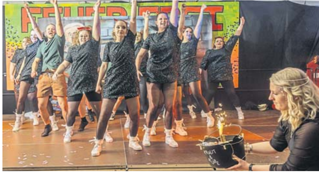
Einen temperamentvollen Auftritt legten „Kraut un Rübe aus Ulmbach“ auf's Parkett.

aus Mottgers und die Lokalmatadoren „Kraut un Rübe“ und „Die Glorreichen 7“, das Männerballett der Freiwilligen Feuerwehr. BWB