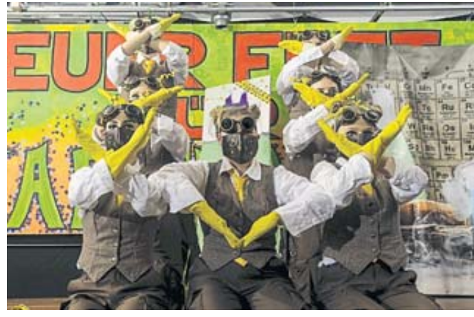
„Jamnots“ kamen aus dem Huttengrund nach Ulmbach und sorgten für Stimmung.