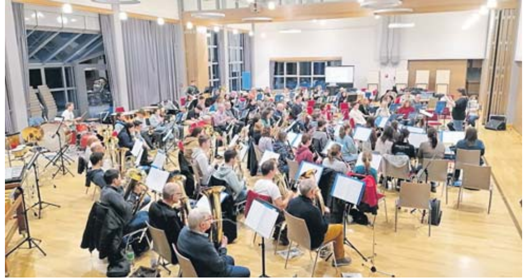
Die Stadtkapelle lässt 50 Jahre Jugendarbeit gemeinsam erklingen. Das Jubiläumsorchester zählt 105 Musizierende von Jung bis Alt.