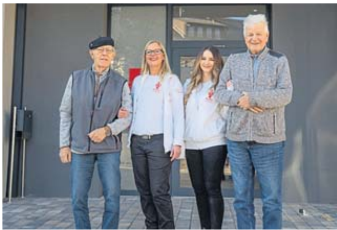
Liebevolle und fachkundige Pflegekräfte sorgen für eine würdevolle Betreuung der Kunden.