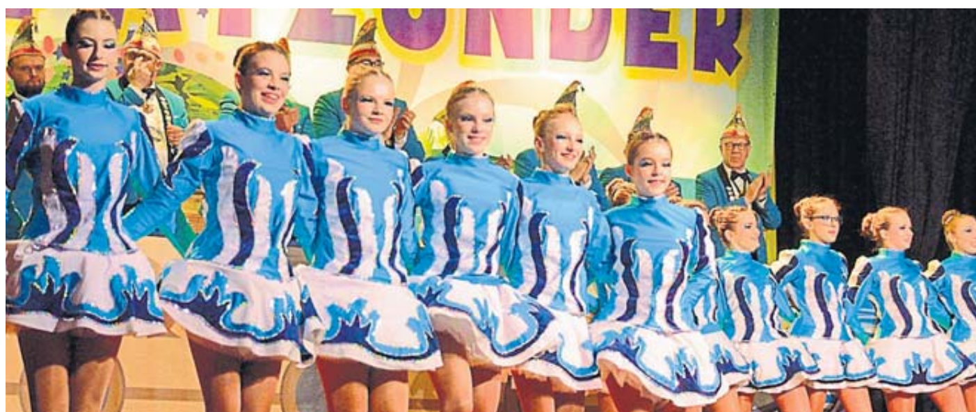
Die „Knallfünkchen“ zeigten beim Gardetanz stolz ihre neuen Kostüme.