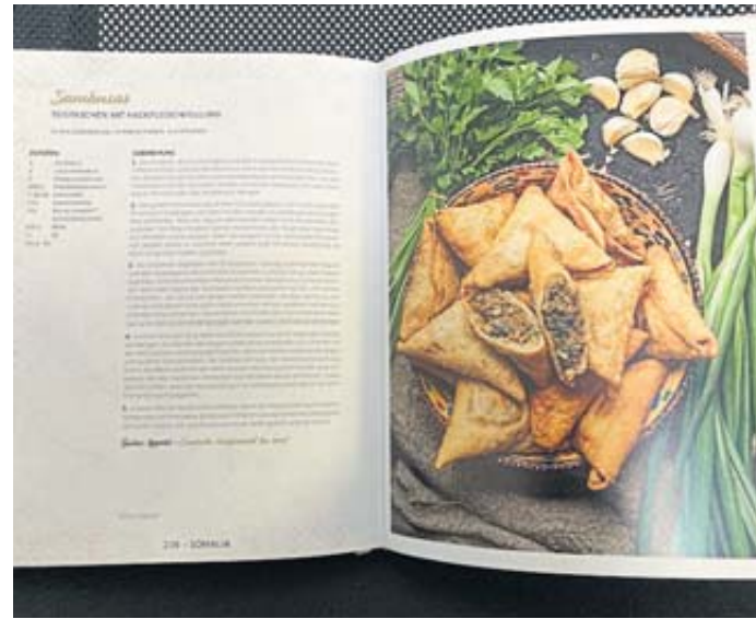
„Man teilt das Essen, nicht Worte“, sagt ein somalisches Sprichwort. Das im Buch beschriebene Gericht stammt aus dem ostafrikanischen Land.