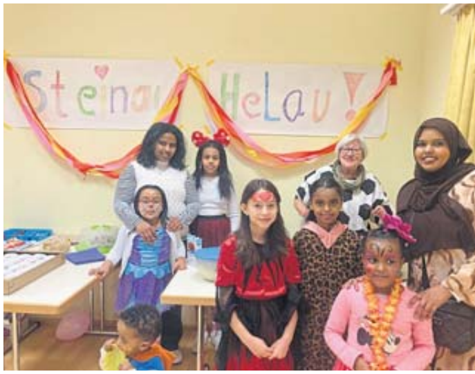
An diesem Tisch wurden Waffeln frisch gebacken, die bei Groß und Klein sehr beliebt waren.

SCHLÜCHTERN – Wie die Stadtverwaltung Schlüchtern mitteilt, sind sämtliche Dienststellen der Stadt am Rosenmontag, 3. März, nachmittags geschlossen. BWB