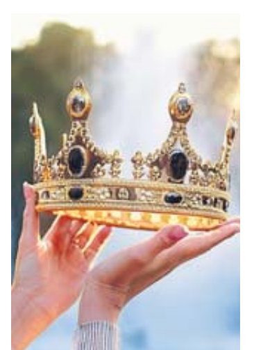
Die erste Steinauer Märchenkönigin wird ein Jahr lang ihre Stadt repräsentieren.

- Per Post: Mit dem Stichwort „Steinauer Märchenkönigin“ an Stadtverwaltung Steinau, Brüder-Grimm-Straße 47, 36396 Steinau an der Straße - Per E-Mail: museum-steinau@steinau.de