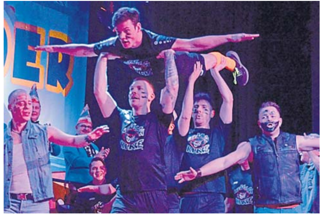
Fortsetzung von Titel seite: Das Männerballett präsentierte sich als „Die wilden Kerle“.