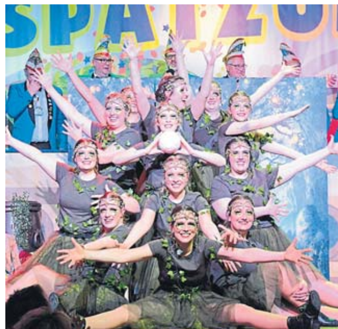
Beim Showtanz „Holla die Waldfeen“ siegte im Aciswald das Gute über das Böse.