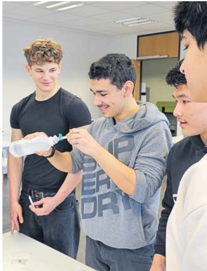
Männer in der Pflege: Die Main-Kinzig-Akademie bot motivierende Mitmachangebote.