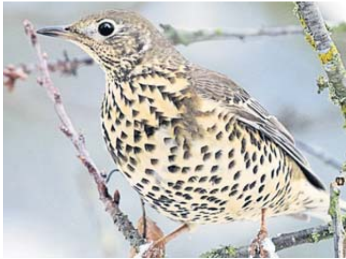
Die Misteldrossel ist die größte einheimische Drossel. Ihr melancholischer Gesang schallt bereits Ende Januar durch lichte Wälder.