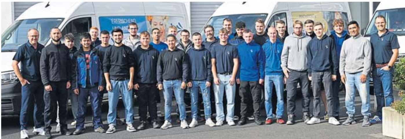
Die Azubis aller drei Standorte: Freiensteinau, Laasdorf/Jena und Fulda (Firma Ettenberger).

sehr gut möglich. Begeistert sind auch die Mitarbeiter, denn aufgrund der positiven Bewertungen auf der Arbeitgeber-Bewertungsplattform Kununu wurde Fehl + Sohn im Februar zur TopCompany 2025 gekürt. BWB