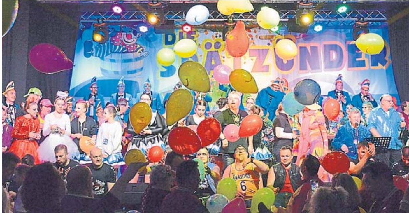
Zum Finale sangen die Mitwirkenden gemeinsam das Lied „Hey Schlüchtern“, während Ballons von der Decke segelten.