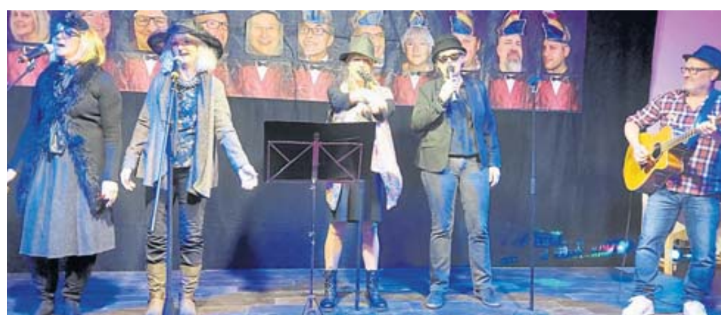
Die „Glücklichen Witwen“ besangen ihre neue Unabhängigkeit.