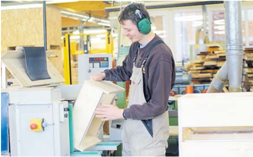
Die Aufnahme zeigt die Herstellung von Imkerei-Zubehör Schreinerei Schlüchtern.