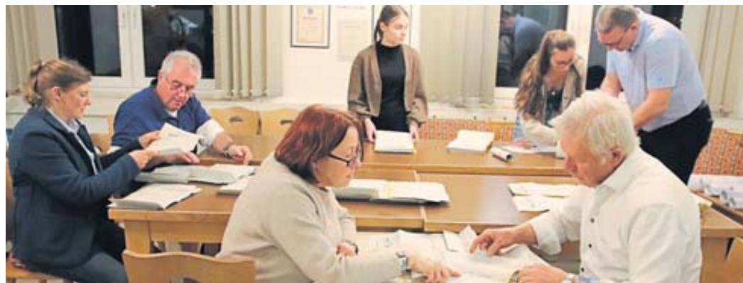
Viele Wahlhelfer hatten sich in diesem Jahr freiwillig für das Mithelfen gefunden – hier ein Teil der Ehrenamtler bei der Auszählung der Briefwahl-Unterlagen im Feuerwehrgerätehaus.