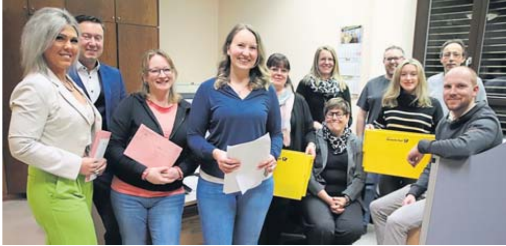
Den Damen im Einwohnermeldeamt stand ein großes Team der Stadtverwaltung hilfreich bei der Abwicklung der Wahl zur Seite.