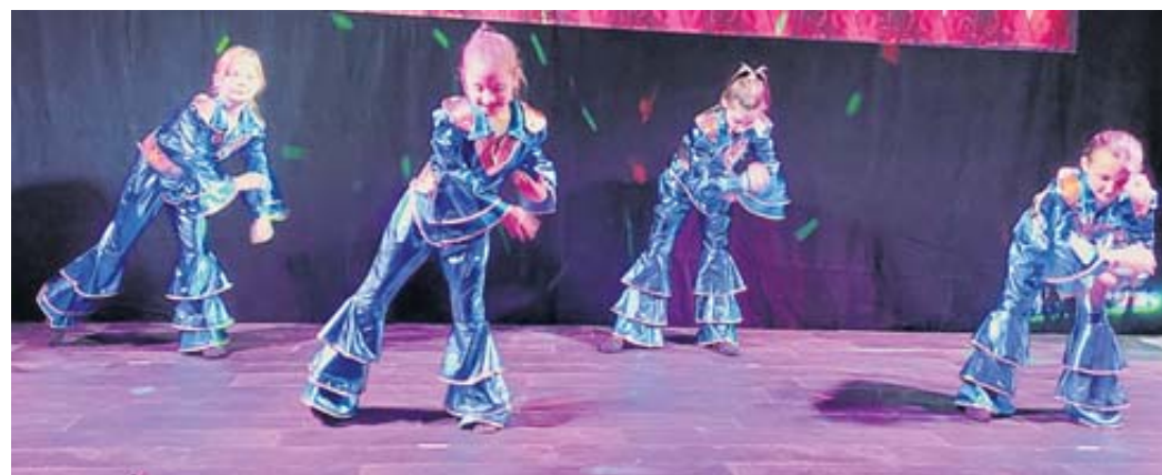
Die jüngsten Tänzerinnen aus Ahl begeisterten mit ihrem Beitrag.

Redaktions- und Beilagenschluss Dienstag 12 Uhr