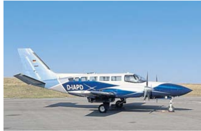
Die Firma Aerowest aus Dortmund wird mit einer zweimotorigen Cessna das Stadtgebiet Steinau überfliegen und Luftbilder aufnehmen.

Auch die Stadt Steinau wird in die Pflicht genommen, denn für die versiegelten und befestigten Flächen wie Straßen, Wege und Plätze muss die Kommune anteilig selbst die Kosten für die Entsorgung des Regenwassers/Niederschlagswasser tragen. BWB