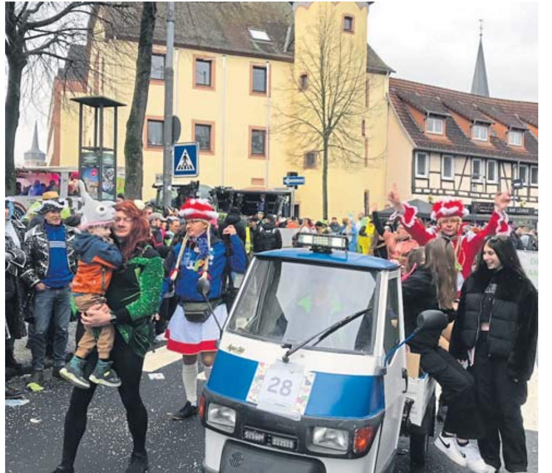
Der bunte Narrenumzug schlängelt sich wieder am Sonntagmittag durch die Straßen der Bergwinkelstadt.