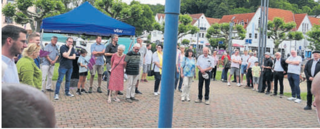
Die Gewerbeschau stand unter dem Motto „Wir zeigen's allen“.

Selbst aus Frankfurt hatten sich aufgrund einer Nachricht in der „Hessenschau“ Gäste nach Bad Soden-Salmünster auf den Weg gemacht. Manche Kurstädter waren hingegen interessiert daran, wie sich ihre ehemaligen Arbeitsstätten entwickelt haben, während wiederum