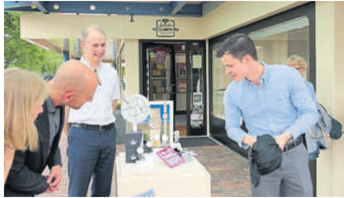
Zu den interessierten Besuchern gehörte auch CDU-Bundestagsabgeordneter Johannes Wiegelmann (rechts).

oder den Bau von Vogelhäuschen unter Anleitung bei den Möbelwerkstätten Wolf, ein Weltenentdecker-Schätzspiel bei Zieglers Reisewelt oder eine Golf-Aktions-Fläche. Zudem lockten unterschiedliche Vorträge zum Weinbau samt entsprechenden Verkostungen oder dazu, was man von Weinstöcken lernen könne, in der Vinothek erstrebenswert, zum Umgang mit chronischem Schmerz in der Knappschaftsklinik, zum Schutz vor Diebstahl und dem Quooker-Wasserhahn in der Möbelwerkstatt Wolf oder zu Fragen hinsichtlich Beisetzungen bei Nowak-Bestattungen. Besondere Angebote waren etwa Fasziolen-Yoga in der Knappschaftsklinik, ein Outdoor-Kurs im Natur-Fitness-Studio, ein Workshop zur Fahrzeugpflege bei CarMats und eine geführte Trailtour der Bikeschmiede. Führungen gab es durch das Huttenschloss in Bad Soden, die Conformtec-Produktion, die Knappschaftsklinik, die Kläranlage, das IT-Unternehmen Maxworx sowie durch die Spessart-Therme. bak