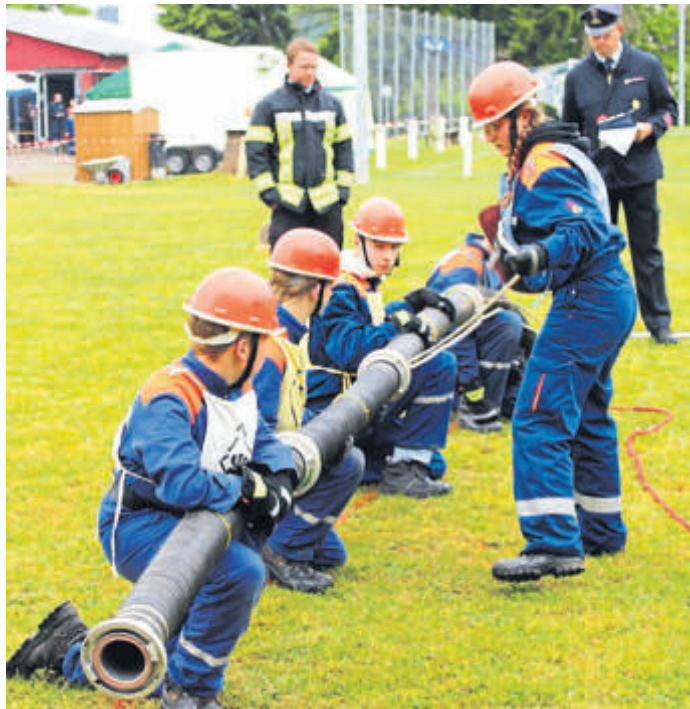
Teils war es Schwerstarbeit für die Jugendlichen.