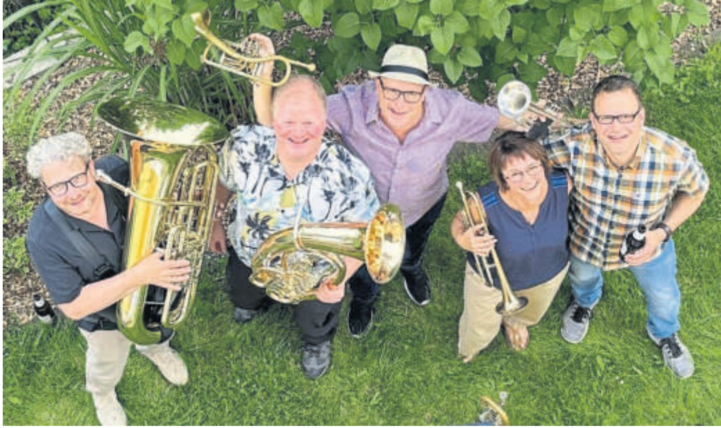
Die Blechbläsergruppe des Eisenbahner Musikvereins Elm tritt bei „Musik auf dem Dorfplatz“ zur Elmer Kulturwoche auf.