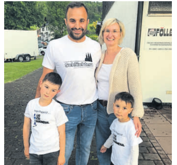
Auch seine Familie freute sich über die Abstimmung.