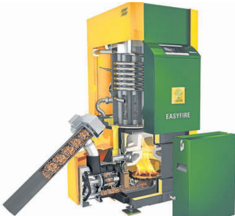
Einfach sauber heizen mit dem Easyfire, Sie sichern 2.500 Euro Förderbonus ohne Elektrofilter.