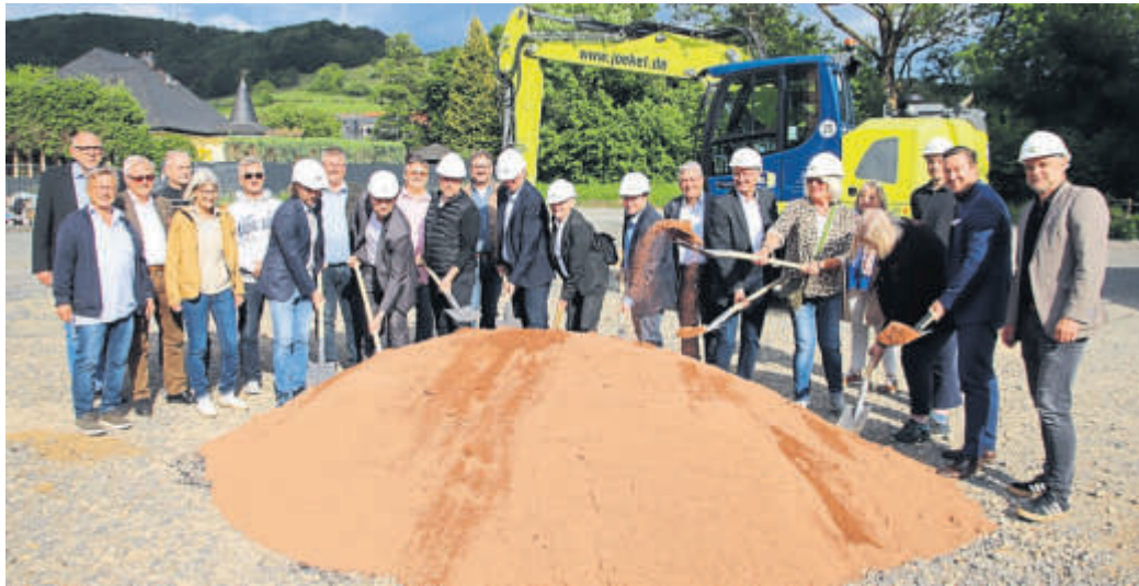
Führende Vertreter der Stadt Schlüchtern und Mandatsträger vollzogen gemeinsam den ersten Spatenstich für das neue Elmer Gemeinschaftshaus.