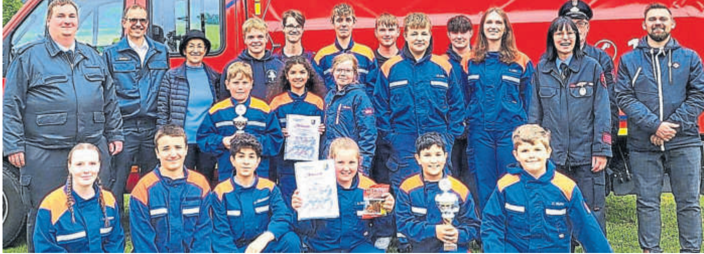
Die Siegermannschaften Ulbach und Huttengrund beim Jugendfeuerwehr-Pokalwettkampf des Unterverbands Schlüchtern, der in Sannerz stattfand.