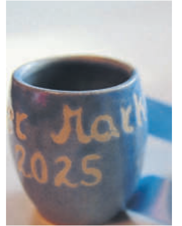
Bei der Wahl des künftigen Kalte-Markt-Präsidenten wurde auch der erste neue Krug vorgestellt.