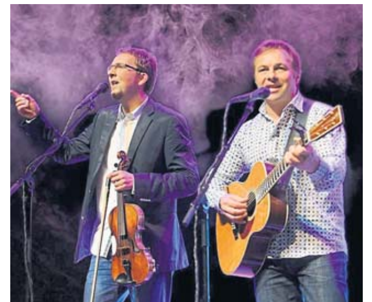
Traumhafte, leidenschaftliche Balladen wie „Scarborough Fair“ oder „Bright Eyes“ erklingen beim Auftritt der Simon & Garfunkel Revival Band.