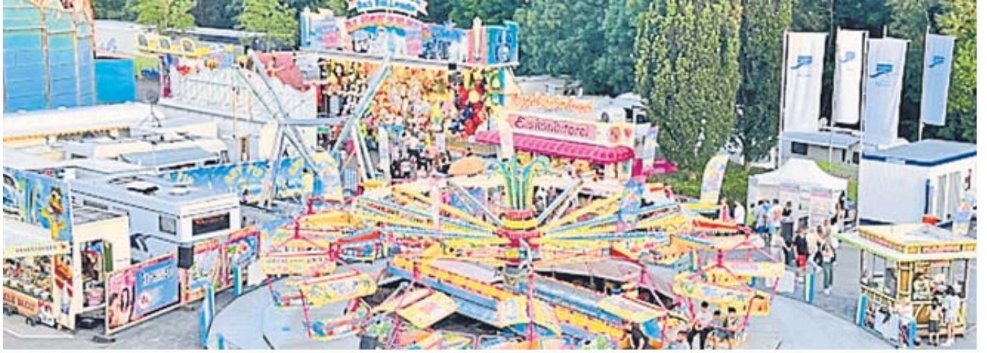
Spaß, Freude und Action für Groß und Klein bietet das Schützenfest. Und Leser können dank unseres Foto-Wettbewerbs eine ganz besondere Fahrt im Riesenrad gewinnen.