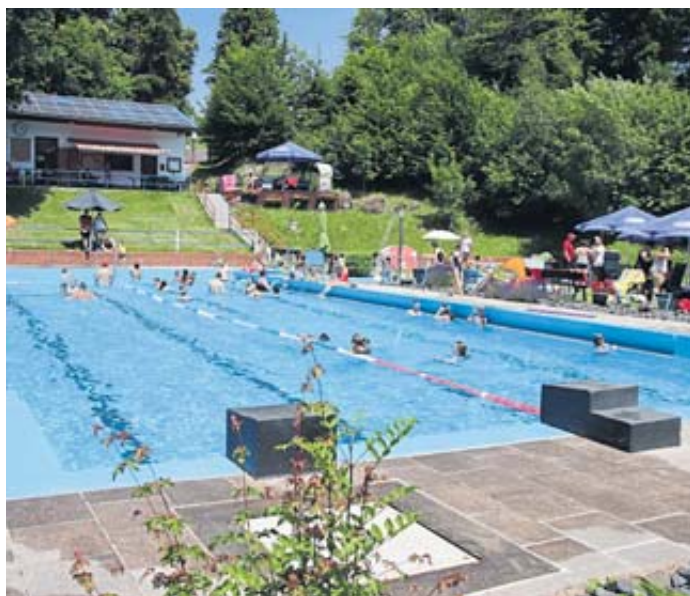
Das Schwimmbadfest lockte viele Gäste an.

Bei dem Fest schaute auch Bürgermeister Matthias Möller (parteilos) vorbei. Er freute sich über die sehr gute Resonanz des Festes, das Groß und Klein viel Spaß bereite. Ausdrücklich lobte er auch die rege Tätigkeit des Fördervereins, der Stück für Stück das höchstgelegene Bad im Main-Kinzig-Kreis weiter verschönere. Gerne habe der Bauhof der Stadt die jüngsten Arbeiten mit Materiallieferungen unterstützt. Für die weitere Arbeit übergab er an den Vereinsvorstand einen Scheck. BWB