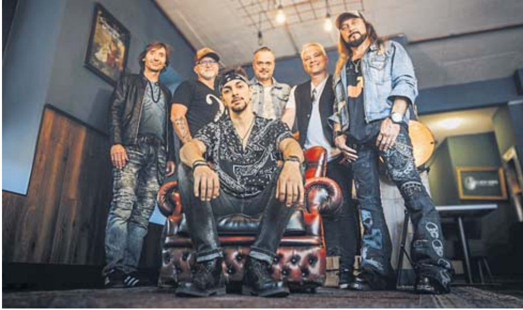
Juke Box Hero – das sind die Hits von Foreigner rockig, gefühlvoll, mitreißend und mit viel Spaß live auf die Bühne gebracht.