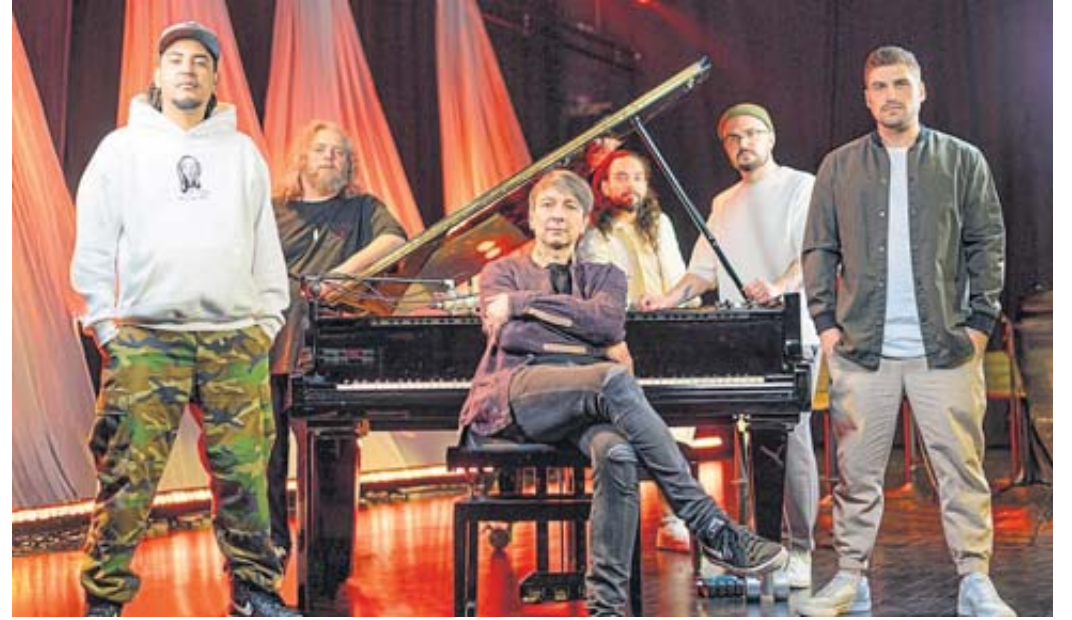
Das Live-Programm Söhne Mannheims Piano hat sich zu einem von den Besuchern gefeierten Format entwickelt.