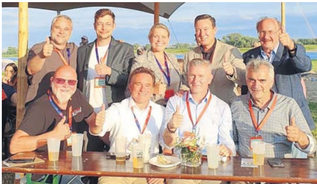
Delegationen aus Schlüchtern und Steinau nahmen an dem KleinStadt-Kongress in Wittenberge teil.