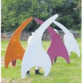
Solchen Figuren begegnet man auf dem Kunstpfad in Hutten.