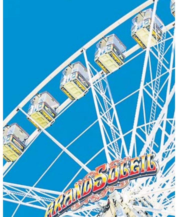
Das Grand Soleil-Riesenrad bietet atemberaubende Ausblicke über die Dächer der Barockstadt.

Fünf exklusive Sunset-Fahrten für je zwei Personen im wunderschönen Riesenrad der Firma Göbel aus Worms gibt es zu gewinnen. Die Fahrten finden am Donner-