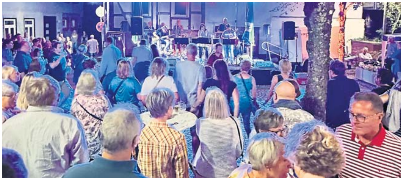
Die Archivaufnahme zeigt ein gut besuchtes Altstadtfest in Salmünster.